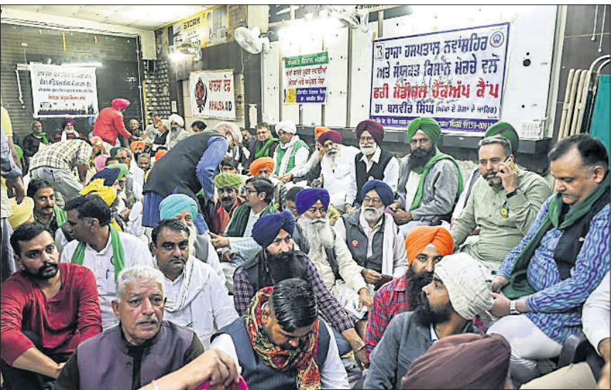
ଦିଲ୍ଲୀର ସିଂଗୁ ସାମାଜିକ ସମ୍ବଳେଷଣ କେନ୍ଦ୍ରରେ ସାମାଜିକ ଚାଷୀ।

କେନ୍ଦ୍ରର ୩ ବିବାଦୀୟ କୃଷି ଆଇନ ପ୍ରତ୍ୟାହାର ସହ ଉତ୍ପାଦିତ ସାମଗ୍ରୀର ସର୍ବନିମ୍ନ ସହାୟକ ମୂଲ୍ୟ (ଏମ୍ଏସ୍‌ପି) ପ୍ରଦାନ ପାଇଁ ସରକାର ଗ୍ୟାରେଷ୍ଟି ଦିଅନ୍ତୁ ବୋଲି ରବିବାର କୃଷକ ସଙ୍ଗଠନଗୁଡ଼ିକ ପକ୍ଷରୁ ଦାବି କରାଯାଇଛି। ଚାଷୀମାନେ ନିଜ ଦାବିରେ ଅଡ଼ିବସିଥିବାବେଳେ କୃଷି ଆଇନ ପ୍ରତ୍ୟାହାର ସମ୍ପର୍କିତ ବିଲକୁ ରୁଧିବାର କେନ୍ଦ୍ର କ୍ୟାବିନେଟ ମଞ୍ଜୁରୀ ଦେଇପାରେ। କ୍ୟାବିନେଟ ଅନୁମୋଦନ ପରେ ୨୯ରେ ଆରମ୍ଭ ହେବାକୁ ଥିବା ପାର୍ଲିାମେଣ୍ଟର ଶୀତ ଅଧିବେଶନରେ ଉପସ୍ଥାପନ କରାଯିବ ବୋଲି ସରକାରୀ ସୂତ୍ରରୁ ଜଣାପଡ଼ିଛି। ଉତ୍ତର ପ୍ରଦେଶ, ଉତ୍ତରାଖଣ୍ଡ, ପଞ୍ଜାବ, ଗୋଆ ଓ ମଣିପୁରରେ ଆସନ୍ତା ବର୍ଷ ଫେବୃୟାରୀ-ମାର୍ଚ୍ଚ ଆଡ଼କୁ ବିଧାନସଭା ଭୋଟ ହେବ। ନିର୍ବାଚନରେ ପରାଜୟ ଭୟରେ ପ୍ରଧାନମନ୍ତ୍ରୀ ନରେନ୍ଦ୍ର ମୋଦି ଆନ୍ଦୋଳନର ଚାଷୀଙ୍କ ଦାବି ଆଗରେ ମୁଣ୍ଡ ନୁଆଁଇ ୩ କୃଷି ଆଇନ ପ୍ରତ୍ୟାହାର କରାଯିବ ବୋଲି ଶୁଣ୍ଠିବାର ଚିତ୍ତିରେ ଘୋଷଣା କରିଥିଲେ। ହେଲେ ମୋଦିଙ୍କ ଘୋଷଣାକୁ ଆନ୍ଦୋଳନର କୃଷକମାନେ ବିଶ୍ଵାସକୁ