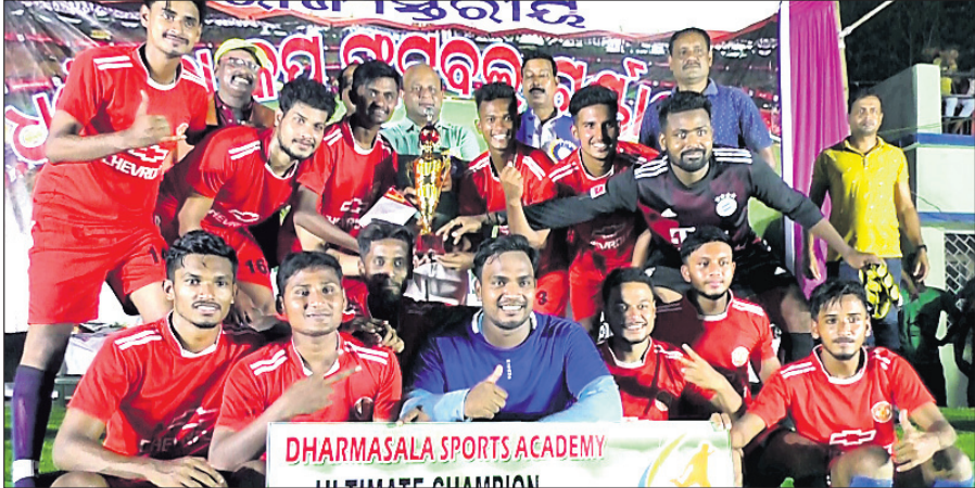
ଅତିଥିକଠାରୁ ଟ୍ରଫି ଗ୍ରହଣ ଅବସରରେ ଚାମ୍ପିୟନ କଟକର ଅଲଟିମେଟ ଦଳ।

ଧର୍ମଶାଳା, ୨୧।୧୧(ଡି.ଏନ.ଏ.) ଯାଜପୁର ଜିଲ୍ଲା ଧର୍ମଶାଳା ବ୍ଲକ୍ ଅଧୀନ ବାଣୀପାଠ ପଢ଼ିଆରେ ଅନୁଷ୍ଠିତ ୭ମ ରାଜ୍ୟସ୍ତରୀୟ ପୁରବଳ ଟୁର୍ନାମେଣ୍ଟର ରବିବାର ଫାଇନାଲ ମ୍ୟାଚ୍ ଅନୁଷ୍ଠିତ ହୋଇଯାଇଛି। ଏଥିରେ କଟକର ଅଲଟିମେଟ ଚାମ୍ପିୟନ ଦଳ କେନ୍ଦ୍ରାପଡ଼ାର ରାଜକନିକା ଆଧିକାରୀଙ୍କ ଆସୋସିଏସନକୁ ୫-୪ ଗୋଲରେ ପରାସ୍ତ କରି ଚାମ୍ପିୟନ ହୋଇଛି। ଧର୍ମଶାଳା ଷ୍ଟାଣ୍ଡିଂ ଏକାଡେମୀ ଆନୁକୂଲ୍ୟରେ ଆୟୋଜିତ ଏହି ଟୁର୍ନାମେଣ୍ଟରେ ରାଜ୍ୟ ଓ ରାଜ୍ୟ ବାହାରୁ ୮ ଟିମ୍