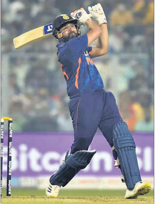
ଅର୍ଦ୍ଧଶତକ ଅବସରରେ ଶର୍ଦ୍ଧ ଷ୍ଟେକ୍ସଟି ରୋହିତ ଶର୍ମା।

କୋଲକାତା, ୨୧।୧୧ ଉତ୍ତମ ବ୍ୟାଟିଂ ଓ ବୋଲିଂରେ ପ୍ରଭାବୀ ପ୍ରଦର୍ଶନ କରି ଭାରତ ରବିବାର ଏଠାରେ ଅନୁଷ୍ଠିତ ଟୁଟାୟ ଟି୨୦ କ୍ରିକେଟ ମ୍ୟାଚରେ ଟ୍ଵାଙ୍କିଲାଣ୍ଡକୁ ୭୩ ରନରେ ପରାସ୍ତ କରିଛି। ଏଥିସହ ୩ ମ୍ୟାଚ ବିଶିଷ୍ଟ ସିରିଜକୁ କ୍ଲିନ୍ ସୁଇପ୍ କରିଛି ରୋହିତ ଶର୍ମାଙ୍କ ନେତୃତ୍ଵାଧୀନ ଟିମ୍ ଇଣ୍ଡିଆ। ଭାରତ ୨୦ ଓଭରରେ ୬ ରଜକେଟ ହରାଇ ୧୮୪ ରନ କରିଥିଲା। ୧୮୫ ରନ ବିଜୟ ଲକ୍ଷ୍ୟକୁ ପଛ କରି ଟ୍ଵାଙ୍କିଲାଣ୍ଡ ୧୨.୭ ଓଭରରେ ୧୧୧ ରନ କରି ଅଲଆଉଟ ହୋଇ ଯାଇଥିଲା। ବଡ଼ ଷ୍ଟୋରକୁ ଚେକ୍ କରିବା ଚାପକୁ ହାତେଇ ପାରି ନ ଥିଲା ଟ୍ଵାଙ୍କିଲାଣ୍ଡ। ଓପନର ମାର୍ଟିନ ଗୁପ୍ଟିଲ ସର୍ବାଧିକ ୫୧(୩୬ ବଲ, ୪ ଚୋକା, ୪ ଛକା) ରନ କରିଥିଲେ ହେଁ ଅନ୍ୟ ସବୁ ବ୍ୟାଟରଙ୍କ ବିଫଳତା ଦଳକୁ ବୁଝାଇ ପରାଜୟ ଆଡ଼କୁ ନେଇ ଯାଇଥିଲା। ଦଳ ପକ୍ଷରୁ ଟିମ୍ ସିଫର୍ସ ଦ୍ଵିତୀୟ ସର୍ବାଧିକ ୧୬ ରନ କରିବାକୁ ସକ୍ଷମ ହୋଇଥିଲେ। ୨୧ ରନରେ ପ୍ରଥମ ଉତ୍ତମକେଟ ହରାଇଥିବା ଟ୍ଵାଙ୍କିଲାଣ୍ଡ କ୍ରମାଗତ ବ୍ୟବଧାନରେ ଉତ୍ତମକେଟ ହରାଇ ୧୧୧ ରନରେ ସାମିତ ରହି ଯାଇଥିଲା। ଭାରତୀୟ ବୋଲରଙ୍କ ମଧ୍ୟରେ ଅକ୍ଷର ପଟେଲ ସର୍ବାଧିକ ୩ଟି, ହର୍ଶଲ ପଟେଲ ୨ଟି ଏବଂ