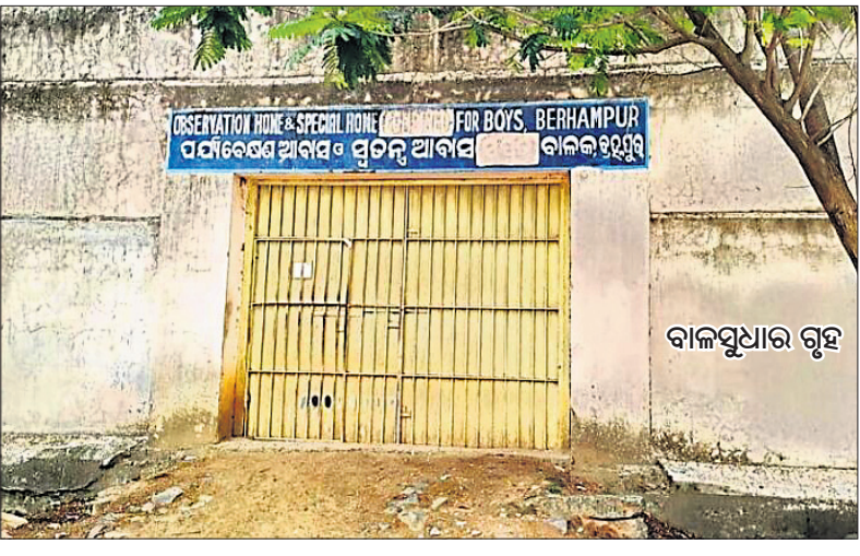
ବ୍ରହ୍ମପୁର ଅଫିସ୍, ୨୨୧୧୧

ବାଳଅପରାଧୀଙ୍କୁ ସୁଧାରିବା ପାଇଁ ସରକାରଙ୍କ ଦ୍ୱାରା ପରିଚାଳିତ ବ୍ରହ୍ମପୁର ଜରଡ଼ା ବଜାର ଦାସ୍ତାରେ ଥିବା ବାଳସୁଧାର ଗୃହ ଏବେ ବିବାଦ ଯେଉଁକୁ ଗାଲିଆସିଛି। ରବିବାର ବିଳମ୍ବିତ ରାତିରେ ଝରକା ଗ୍ରାମ୍ ତାଡ଼ି ୬ ଅନ୍ତେବାସୀ ସୁଧାର ଗୃହକୁ ଖସି ପକାଇଥିବା ସୂଚନା ମିଳିଛି।