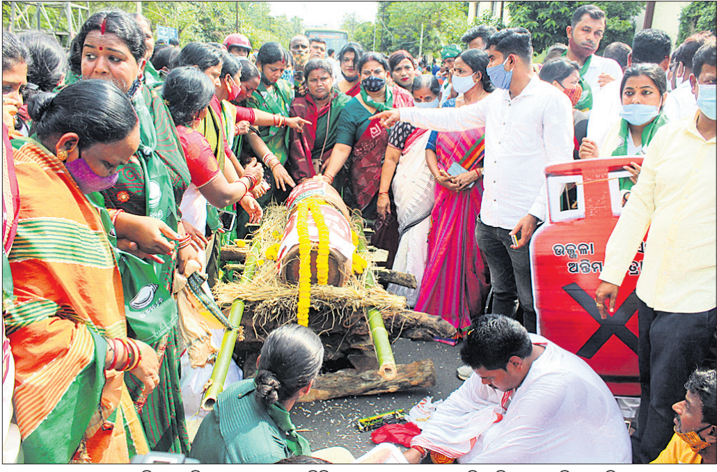
ଭୁବନେଶ୍ୱର ଏତିଏମ୍ ଅଧିକ ସମ୍ମୁଖରେ ଗ୍ୟାସ୍ ବିଲିଞ୍ଚରକୁ ବୋକେଲରେ ରଖି ବିଜେଡି ପକ୍ଷରୁ ଅଭିନବ ପ୍ରତିବାଦ ।