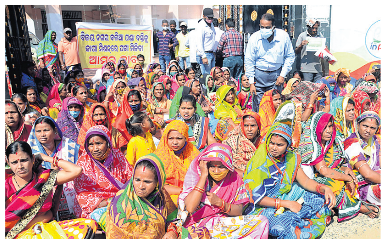
ଜମିପତା ପ୍ରଦାନ ଦାବିରେ ପୂରୀ ବକିଆପଣା ବସ୍ତିର ଲୋକେ ସୋମବାର ଜିଲ୍ଲାପାଳଙ୍କ କାର୍ଯ୍ୟାଳୟ ସମ୍ମୁଖରେ ଧାରଣା ଦେଇଛନ୍ତି।

ସଙ୍ଗୀତ ନାଟକ ଏକାଡେମୀ ଏବଂ ଓଡ଼ିଶା ରବେଷ୍ଟା କେନ୍ଦ୍ର ଉପଯୁକ୍ତ ପଦକ୍ଷେପ ନେବା ଆବଶ୍ୟକ। ରାଜ୍ୟର ପ୍ରତ୍ୟେକ ଜିଲ୍ଲାରେ ଓଡ଼ିଶା ସଙ୍ଗୀତର କର୍ମଶାଳା ହେବା ଆବଶ୍ୟକ। ଓଡ଼ିଶା ସଙ୍ଗୀତର ଶାସ୍ତ୍ରୀୟ ମାନସତା ପରିବେଷଣରେ ଓଡ଼ିଶା ସରକାର ରାଜ୍ୟ କ୍ୟାବିନେଟରେ ପାଠ୍ୟ ପଠାଇଥିଲେ। କିନ୍ତୁ ଖୁବ୍ ସମୟ କେନ୍ଦ୍ର ସରକାର ଏ ପର୍ଯ୍ୟନ୍ତ ସଙ୍ଗୀତ କ୍ଷେତ୍ରରେ କାହାକୁ ମାନସତା ଦେଇନାହାନ୍ତି।