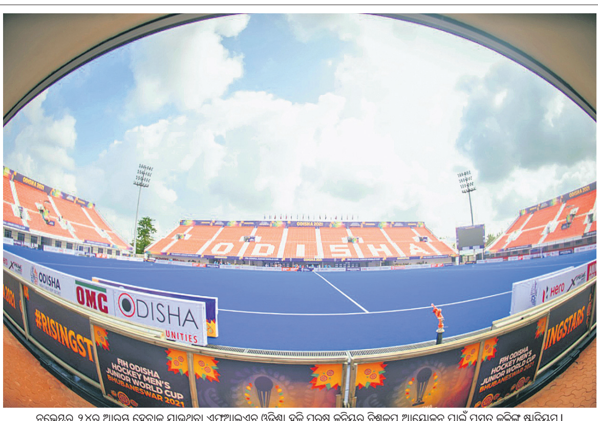
ନଭେମ୍ବର ୨୪ରୁ ଆରମ୍ଭ ହେବାକୁ ଯାଉଥିବା ଏପିଆଇଏଫ୍ ଓଡ଼ିଶା ହକି ପୁରୁଷ ଜୁନିୟର ବିଶ୍ୱକପ ଆୟୋଜନ ପାଇଁ ପ୍ରସ୍ତୁତ କଳିଙ୍ଗ ଷ୍ଟାଡିୟମ।

ଆଧୁନିକ ଶିକ୍ଷାର ପ୍ରକୃତି କେବଳ ଉପଯୋଗିତା ଯୋଗ୍ୟ ବୋଲି ଭାରତର ପ୍ରଧାନ ବିଚାରପତି (ସିଦ୍ଧେଆଇ) ଏନ୍. ଭି. ରମଣା କହିଛନ୍ତି।