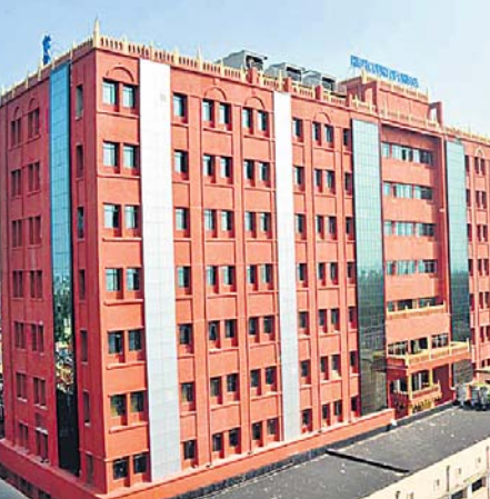
କଟକ ଅଫିସ, ୨୨।୧୧.୧୧

ପଞ୍ଚାୟତ ନିର୍ବାଚନ ସଂରକ୍ଷଣ ଚ୍ୟାଲେଞ୍ଜ ମାମଲା