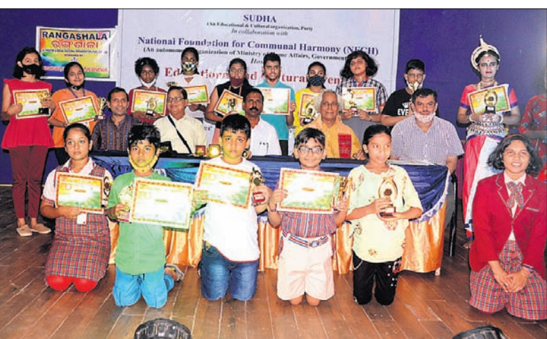
ପୁରୀ ସଂସ୍କୃତି ଭବନରେ ପୁରୀ ଓ ରାଷ୍ଟ୍ରୀୟ ସାମ୍ପ୍ରଦାୟିକ ସଦ୍‌ଭାବନା ପ୍ରତିଷ୍ଠାନ ପକ୍ଷରୁ ଆୟୋଜିତ ପ୍ରତିଯୋଗିତାର କୃତୀ ପ୍ରତିଯୋଗୀଙ୍କ ସହ ଅତିଥି।