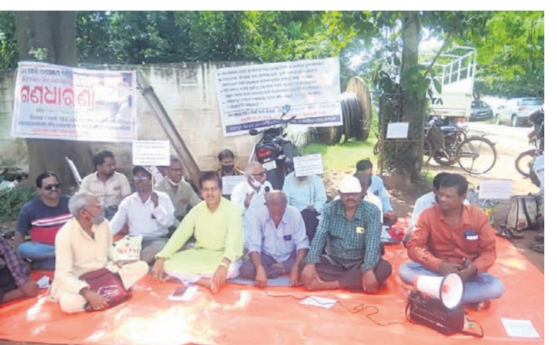
ତେଲି ପାସେଞ୍ଜର ଟ୍ରେନ୍ ଚଳାଚଳ ଦାବିରେ ସୋମବାର ଖୋର୍ଦ୍ଧାରୋଡ୍ ରେଳ ମଞ୍ଚ ପ୍ରବନ୍ଧକଙ୍କ କାର୍ଯ୍ୟାଳୟ ଆଗରେ ଧାରଣା ଦିଆଯାଇଛି।