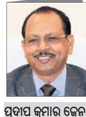
ପ୍ରଦୀପ କୁମାର ଜେନା

୧୯୮୮ ବ୍ୟବ୍ଧର ଆରବ୍ଧ ଏଫ୍.ଏସ୍.ଏସ୍.ଏସ୍. କୁମାର ଜେନା ଏବେ ଓଡ଼ିଶା ସରକାରଙ୍କ ଉନ୍ନୟନ କମିଶନର ତଥା ଅତିରିକ୍ତ ମୁଖ୍ୟ ଶାସନ ସଚିବ ଅଛନ୍ତି । ଏଥି ସହିତ ସେ ସ୍ୱତନ୍ତ୍ର ଭାବେ କମିଶନର ଦାୟିତ୍ୱ ମଧ୍ୟ ବୁଲାଇଛନ୍ତି ।