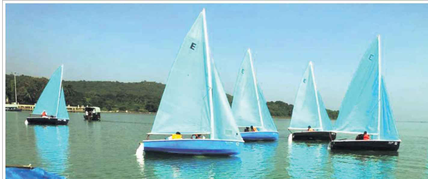
ଭାରତୀୟ ନୌସେନା ଚାଲିମ କେନ୍ଦ୍ର ପରିସର ବିଲିକାରେ ଅନୁଷ୍ଠିତ ଏକ ସମ୍ବନ୍ଧିତ କ୍ୟାମ୍ପରେ ଲୋକା ପ୍ରତିଯୋଗିତା।

ବିଶେଷ କରି ପାର୍ଟି, ହସ୍ତିନାଳ, କୋର୍ଟ ଭଳି ଜନଗହଳପୂର୍ଣ୍ଣ ସ୍ଥାନରେ ସକ୍ରିୟ ରହୁଥିଲେ। ପାର୍ଟି ସ୍ଥାନରୁ ମାଷ୍ଟର ଚାକି ସାହାଯ୍ୟରେ ବାଇକ୍ ଖୋଲି ନେଇଯାଉଥିଲେ। ଏହି ଗ୍ୟାଙ୍ଗ ଗତିରାଜଧାନୀ ଓ ଏହାର ଆଖପାଖ ଅଞ୍ଚଳକୁ ବାଇକ୍ ଚୋରି କରୁଥିଲେ।