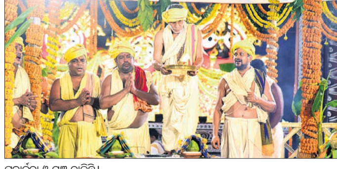
ପୂଜାର୍ଚ୍ଚନା ଓ ଯଜ୍ଞ ଗାଳିଛି।

କାର୍ଯ୍ୟକ୍ରମରେ ଯୋଗଦେଇ ପୂର୍ବାହ୍ନ ୧୧ଟା ପୁଜା ପରିକ୍ରମା ମାର୍ଗର ଶିଳାମାୟ କରିବେ। ପୂର୍ଣ୍ଣସ୍ତୁତି କାର୍ଯ୍ୟକ୍ରମରେ ଜଗଦଗୁରୁ ଶଙ୍କରାଚାର୍ଯ୍ୟଙ୍କୁ ଯୋଗଦେବାକୁ ପ୍ରଶାସନ ପକ୍ଷରୁ ଅନୁରୋଧ କରାଯାଇଛି।