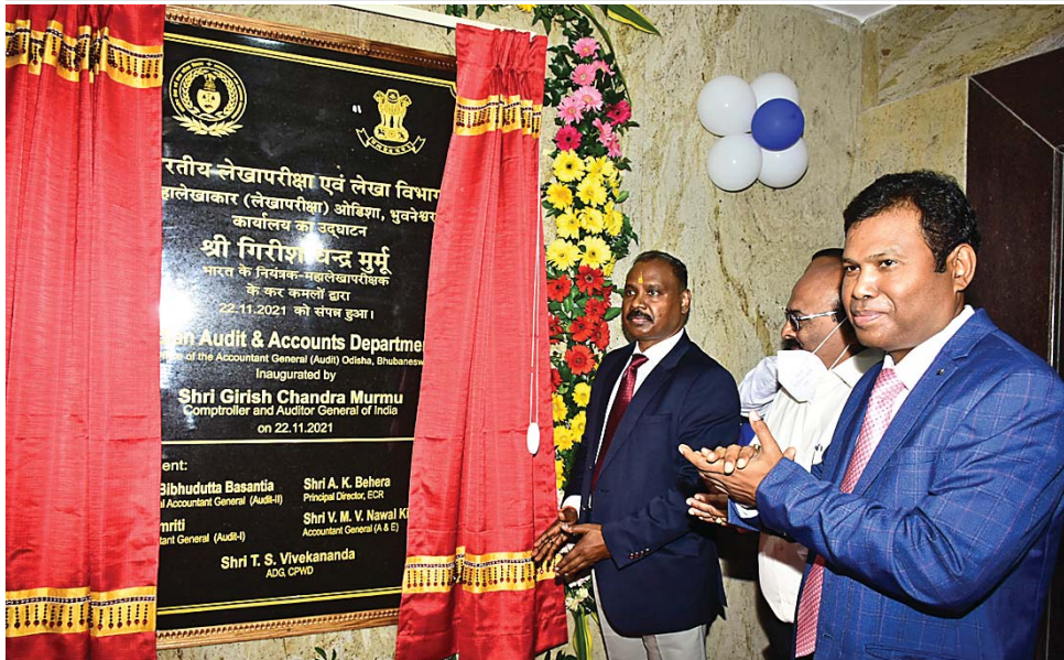
ଭୁବନେଶ୍ୱରଠାରେ ପ୍ରିନ୍ସିପାଲ ଆକାଉଣ୍ଟାଣ୍ଟ ଜେନେରାଲଙ୍କ ନୂଆ କାର୍ଯ୍ୟାଳୟର ଉଦ୍‌ଘାଟନ କରୁଛନ୍ତି ସିଏଜି ଗିରୀଶ ଚନ୍ଦ୍ର ମୂର୍ମୁ।

ପ୍ରିନ୍ସିପାଲ ଆକାଉଣ୍ଟାଣ୍ଟ ଜେନେରାଲଙ୍କ ନୂଆ କାର୍ଯ୍ୟାଳୟ ଶୁଭାରମ୍ଭ