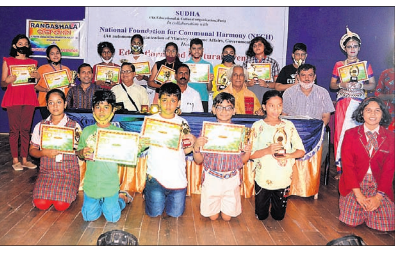
ପୂରୀ ସଂସ୍କୃତି ଭବନରେ ସୁଧା ଓ ରାଷ୍ଟ୍ରୀୟ ସାମ୍ପ୍ରଦାୟିକ ସଦ୍‌ଭାବନା ପ୍ରତିଷ୍ଠାନ ପକ୍ଷରୁ ଆୟୋଜିତ ପ୍ରତିଯୋଗିତା କୃତା ପ୍ରତିଯୋଗୀଙ୍କ ସହ ଅଟିଥି।