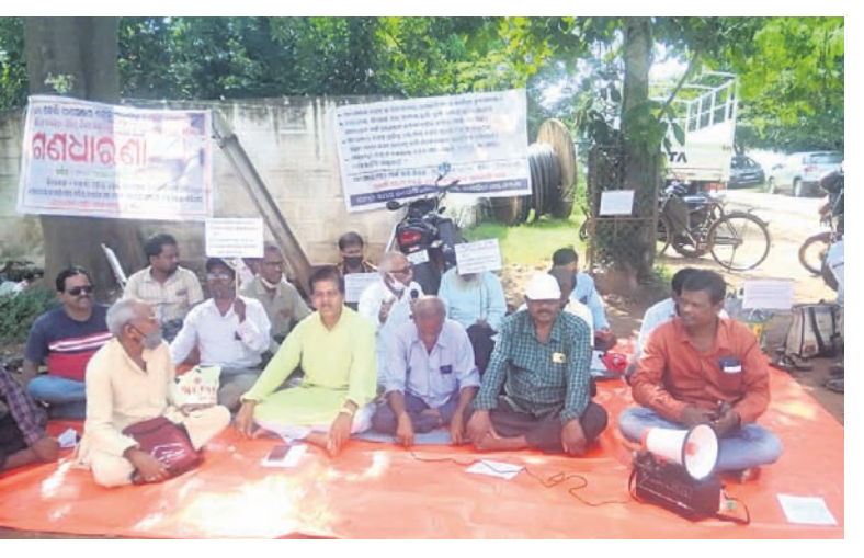
ତେଲି ପାଞ୍ଚେର ଟ୍ରେଡ୍ ଚଳାଚଳ ଦାବିରେ ସୋମବାର ଖୋର୍ଦ୍ଧାରେ ଟ୍ରେଡ୍ ଚଳାଚଳ କାର୍ଯ୍ୟକ୍ରମ ଆରମ୍ଭ ହୋଇଛି।