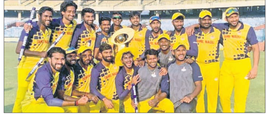
ଚାମ୍ପିୟନ ତାମିଲନାଡୁ ଦଳ ତ୍ରୁପି ସହ।