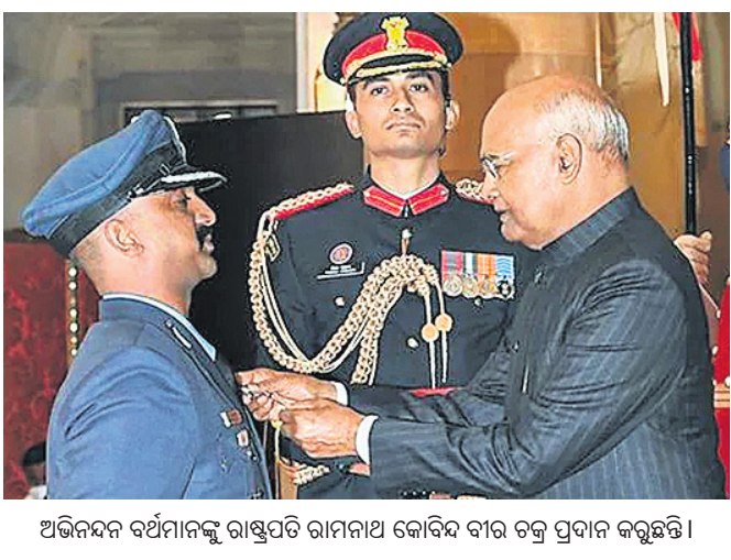
ଅଭିନନ୍ଦନ ବର୍ଥମାନଙ୍କୁ ରାଷ୍ଟ୍ରପତି ରାମନାଥ କୋବିନ୍ଦ ବୀର ଚକ୍ର ପ୍ରଦାନ କରୁଛନ୍ତି।

ଏନଟି ବରଗଡ଼ ଜିଲ୍ଲାରେ ୨୫୦ କୋଟି ଟଙ୍କା ବ୍ୟୟରେ ଇଥାନଲ୍ ପ୍ଲାଣ୍ଟ ଗଠନ କରାଯିବ। ଏଥିରେ ୨୦୨ ଜଣଙ୍କୁ ନିଯୁକ୍ତି ସୁଯୋଗ ମିଳିପାରିବ। ସେହିପରି ବାୟୋ-ଆଗ୍ରୋ ଏନଟି ଲିମିଟେଡ୍ ସୋନପୁର ଜିଲ୍ଲାରେ ୨୨୮.୫୫ କୋଟି ଟଙ୍କା ବ୍ୟୟରେ ଇଥାନଲ୍ ପ୍ଲାଣ୍ଟ ଗଠନ କରାଯିବ। ଏଥିରେ ୩୩୭ ଜଣଙ୍କୁ ନିଯୁକ୍ତି ସୁଯୋଗ ମିଳିପାରିବ। ଭାରତୀୟ ପଦାତ୍ମ ଲିମିଟେଡ୍ କଳାହାଣ୍ଡି ଜିଲ୍ଲାରେ ୨୧୯ କୋଟି ବ୍ୟୟରେ ଶାସ୍ୟଭିତ୍ତିକ ଇଥାନଲ୍ ପ୍ଲାଣ୍ଟ ଗଠନ କରାଯିବ। ଏହି ପ୍ଲାଣ୍ଟରେ ୨୩୮୫ ଜଣଙ୍କୁ ନିଯୁକ୍ତି ସୁଯୋଗ ମିଳିବ। ଖାରସୁଗୁଡ଼ା ଜିଲ୍ଲାରେ ଏନଟି ଲିମିଟେଡ୍ ୨୦୫ କୋଟି ଟଙ୍କା ବ୍ୟୟରେ ଶାସ୍ୟଭିତ୍ତିକ ଉଷ୍ଣିକାରି ଯୁନିଟ୍ ଗଠନ କରାଯିବ। ଏଥିରେ ୧୯୬ ଜଣଙ୍କୁ ନିଯୁକ୍ତି ସୁଯୋଗ ମିଳିବ। ସେହିପରି ଆଦିବାସୀଙ୍କୁ ସ୍ୱାସ୍ଥ୍ୟ ସୁଯୋଗ ପ୍ରଦାନ କରିବା ପାଇଁ ଉଦ୍ଦେଶ୍ୟ ରଖାଯାଇଛି। ଏଥିରେ ଆଦିବାସୀଙ୍କୁ ସ୍ୱାସ୍ଥ୍ୟ ସୁଯୋଗ ପ୍ରଦାନ କରିବା ପାଇଁ ଉଦ୍ଦେଶ୍ୟ ରଖାଯାଇଛି।