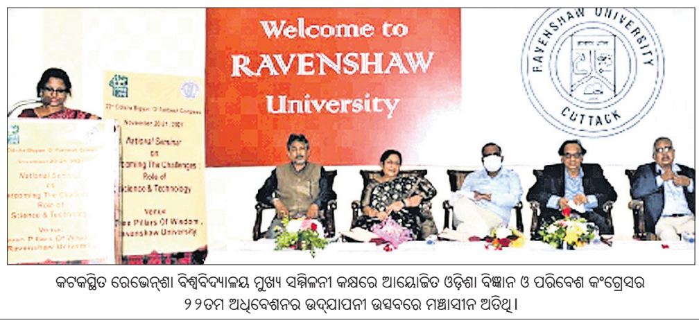
କଟକସ୍ଥିତ ରେଭେନ୍ସା ବିଶ୍ୱବିଦ୍ୟାଳୟ ମୁଖ୍ୟ ସମ୍ମିଳନୀ କକ୍ଷରେ ଆୟୋଜିତ ଓଡ଼ିଶା ସଙ୍ଗୀତ ଓ ପରିବେଶ କଂଗ୍ରେସର ୨୨ତମ ଅଧିବେଶନର ଉଦ୍ଘାଟନା ଉତ୍ସବରେ ମଞ୍ଚାଧୀନ ଅଟିଥି।