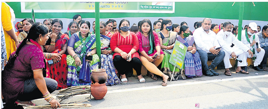
ପୁରୀ ପୌରକାର୍ଯ୍ୟାଳୟ ସମ୍ମୁଖରେ ବିଜେଡି ପକ୍ଷରୁ ଧାରଣା ଦିଆଯାଇଛି।

ପେଟ୍ରୋଲ, ଡିଜେଲ ଓ ରକ୍ଷନଗ୍ୟାସ୍ ଦର ବୃଦ୍ଧି ପ୍ରତିବାଦରେ ସୋମବାର ପୁରୀ ଜିଲ୍ଲା ମୁଦ, ଛାତ୍ର ଓ ମହିଳା ବିଜେଡି ପକ୍ଷରୁ ପୌର କାର୍ଯ୍ୟାଳୟ ଏବଂ କଟେରୀ ଛକ ନିକଟରେ ପ୍ରତିବାଦ କରାଯାଇଛି। ଭାଜପା ନେତୃତ୍ୱାଧୀନ କେନ୍ଦ୍ର ସରକାରଙ୍କ ଆହେଦିନ ଏବେ ଦେଶବାସୀଙ୍କ ଦୁଃଖର କାରଣ ପାଲଟିଛି। ଭାଜପା ସରକାର ସମୟରେ ଉତ୍ତମ ଯୋଜନାରେ ମହିଳାଙ୍କୁ ମାଗଣାରେ ଗ୍ୟାସ୍ ସିଲିଣ୍ଡର ଯୋଗାଇବାର ଉଦ୍ଦେଶ୍ୟ ରଖାଯାଇଥିଲା।