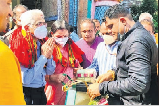
ଆର୍ବିଆଇ ଗଭର୍ନର ଶକ୍ତିକାନ୍ତ ଦାସଙ୍କୁ ଶ୍ରୀମନ୍ଦିର ପ୍ରଶାସନ ପକ୍ଷରୁ ଉପହାର ପ୍ରଦାନ କରାଯାଇଛି ।

ସମୟ ଅତିବାହିତ କରିଥିଲେ । ଏହି ଅବସରରେ ଶ୍ରୀମନ୍ଦିର ପ୍ରଶାସନ ପକ୍ଷରୁ ତାଙ୍କୁ ମହାପ୍ରଭୁଙ୍କ ପ୍ରତିମୂର୍ତ୍ତିର ସ୍ୱାଦିତ୍ୟ ପ୍ରଦାନ କରାଯାଇଛି ।