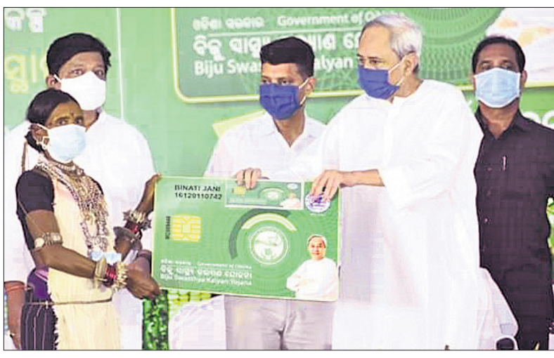
ଜଣେ ହିତାଧିକାରୀଙ୍କୁ ମୁଖ୍ୟମନ୍ତ୍ରୀ ନବୀନ ପଟ୍ଟନାୟକ ସ୍ମାର୍ଟ ହେଲ୍ଥ କାର୍ଡ ପ୍ରଦାନ କରୁଛନ୍ତି।

ପୁଲବାଣୀ ଅପିଏ, ୨୨।୧୧ ଆଦିବାସୀ ଅଧିକାର କମିଶନ ଜିଲ୍ଲାରେ ବିଭିନ୍ନ ସ୍ୱାସ୍ଥ୍ୟ କଲ୍ୟାଣ ଯୋଜନାରେ ସ୍ମାର୍ଟ ହେଲ୍ଥ କାର୍ଡ ବ୍ୟବହାର ଆରମ୍ଭ ହୋଇଛି। ସୋମବାର ମୁଖ୍ୟମନ୍ତ୍ରୀ ନବୀନ ପଟ୍ଟନାୟକ କମିଶନ ଗ୍ରହଣ କରିଛନ୍ତି। ଏଥିରେ ଆଦିବାସୀଙ୍କୁ ସ୍ୱାସ୍ଥ୍ୟ ସୁବିଧା ପ୍ରଦାନ କରିବା ପାଇଁ ଉଦ୍ଦେଶ୍ୟ ରଖାଯାଇଛି। ଏଥିରେ ଆଦିବାସୀଙ୍କୁ ସ୍ୱାସ୍ଥ୍ୟ ସୁବିଧା ପ୍ରଦାନ କରିବା ପାଇଁ ଉଦ୍ଦେଶ୍ୟ ରଖାଯାଇଛି। ଏଥିରେ ଆଦିବାସୀଙ୍କୁ ସ୍ୱାସ୍ଥ୍ୟ ସୁବିଧା ପ୍ରଦାନ କରିବା ପାଇଁ ଉଦ୍ଦେଶ୍ୟ ରଖାଯାଇଛି।