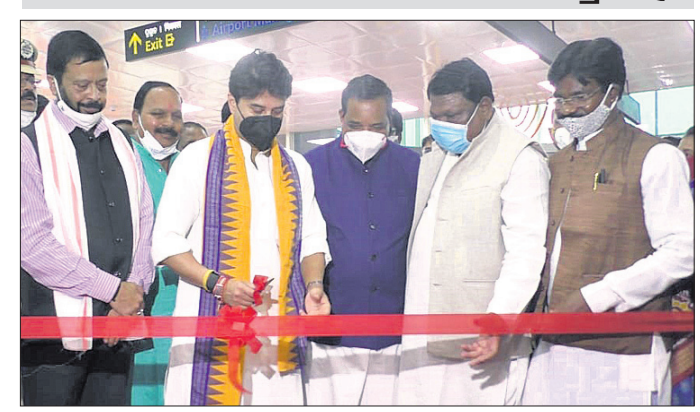
ଆର୍ସିଏସ୍ ଉଡ଼ାନ ଯୋଜନା ଲୋକାର୍ପଣ କରୁଥିବା କେନ୍ଦ୍ରମନ୍ତ୍ରୀ ଜ୍ୟୋତିରାଜିତ ସିଂହା

ପୁରୀରେ ଖୁବ୍‌ଶୀଘ୍ର ଗ୍ରୀନ୍ ଫିଲ୍ଡ ବିମାନ ବନ୍ଦର ନିର୍ମାଣ ହେବ । ଏ ନେଇ କେନ୍ଦ୍ର ସରକାର ରାଜ୍ୟ ସରକାରଙ୍କ ସହଯୋଗ ଲୋଡ଼ିଛନ୍ତି । ରାଜ୍ୟ ସରକାରଙ୍କଠାରୁ ଆବଶ୍ୟକ ଜବାବ ମିଳିବା ପରେ ପୁରୀ ଠାରେ ବିମାନ ବନ୍ଦର ନିର୍ମାଣ କରାଯିବ ବୋଲି ସେମାନଙ୍କ ବିମାନ ଚଳାଚଳ ମନ୍ତ୍ରୀ ଜ୍ୟୋତିରାଜିତ ସିଂହା କହିଛନ୍ତି । ଝାରସୁଗୁଡ଼ା ବାର ସୁରେନ୍ଦ୍ର ସାଏ (ଭିଏସ୍‌ଏସ୍) ବିମାନ ବନ୍ଦର ପରିସରରେ ସୋମବାର କେନ୍ଦ୍ର ବେସାମରିକ ବିମାନ ଚଳାଚଳ ମନ୍ତ୍ରୀଙ୍କ ପରିଦର୍ଶନ ପାଇଁ ପ୍ରସ୍ତୁତ ହୋଇଯାଇଛି । ମନ୍ତ୍ରୀ ସିଂହା ରିଜିଷ୍ଟ୍ରାର କମ୍ୟୁନିକେସନ୍ ସିଏ (ଆର୍ସିଏସ୍) ଉଡ଼ାନ ଯୋଜନାକୁ ଲୋକାର୍ପଣ କରିଥିଲେ । ପରେ ସେ ବନ୍ଦର ପରିସରରେ ପ୍ରଦର୍ଶିତ ସମ୍ବଲପୁରୀ ବାନ୍ଧକଳା, ହସ୍ତତନ୍ତ ଓ ଚିତ୍ରକଳା ପରିଦର୍ଶନ କରିଥିଲେ । ଏହି ଅବସରରେ ବନ୍ଦର ପରିସରରେ ଏକ ସଭା ଅନୁଷ୍ଠିତ ହୋଇଥିଲା । ଏଥିରେ କେନ୍ଦ୍ର ମନ୍ତ୍ରୀ ସିଂହା ମୁଖ୍ୟଅତିଥି ଭାବେ ଯୋଗଦେଇଥିବା ବେଳେ ରାଜ୍ୟ ବାଣିଜ୍ୟ ଓ ପରିବହନ ମନ୍ତ୍ରୀ ପଦ୍ମନାଭ ବେହେରା,