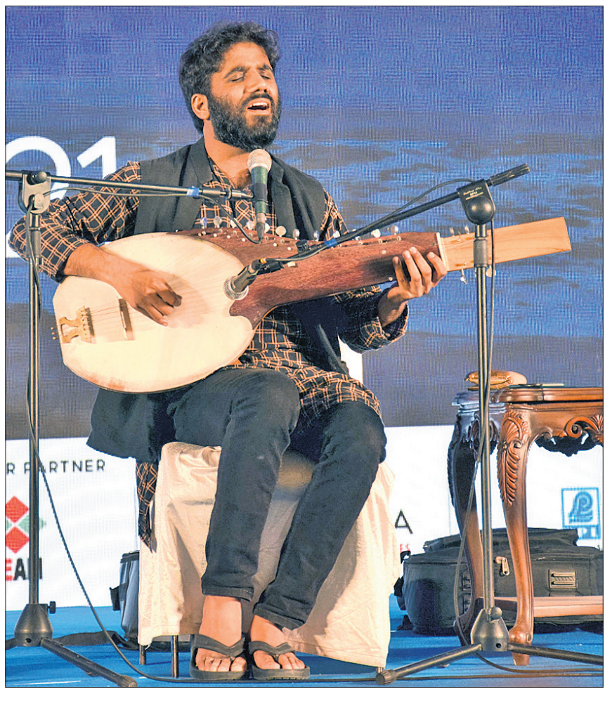
ମୁଖ୍ୟାଳୟ କବି ତଥା ଗୀତିକାର କବି ଶ୍ରେଣୀ ନିକ ଶ୍ରୀରା ଉଦାସିତ 'ନୋରା' ବାଦ୍ୟଯନ୍ତ୍ର ସହ ସଙ୍ଗୀତ ପରିବେଶଣ କରୁଛନ୍ତି।