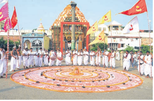
■ ଗଜପତିଙ୍କ ସହ ଶିଳାନାୟକ କଲେ ମୁଖ୍ୟମନ୍ତ୍ରୀ ■ ୧୦୭ ଜମିଦାରୀ, ୧୮ ମଠାଧୀଶ ସମ୍ପର୍କିତ

ପୁରୀ ଅପ୍ଟିମ୍, ୨୪।୧୧ ଶ୍ରୀମନ୍ଦିର ପରିସର ଆଧୁନିକୀକରଣ ହେବାକୁ ଯାଉଛି। ଖୁବ୍‌ଶୀଘ୍ର ନୂଆ ପ୍ରକଳ୍ପ ଅନୁଯାୟୀ ନୂଆ ରୂପ ନେବ। ଏହି ପରିଚ୍ଛେଦରେ ମୁଖ୍ୟମନ୍ତ୍ରୀ ନବୀନ ପଟ୍ଟନାୟକ ରୁଧିରୀ ପୁରୀ ଗସ୍ତରେ ଆସି ଗଜପତିଙ୍କ ସହ ଶ୍ରୀମନ୍ଦିର ପରିକ୍ରମା ପ୍ରକଳ୍ପର ଶିଳାନାୟକ କରିଛନ୍ତି। ଶ୍ରୀକାଳ୍ପଙ୍କ ସୁଧିଆ ଓ ଶ୍ରୀମନ୍ଦିର ପୁରୁଷା ଉଦ୍ଦେଶ୍ୟରେ ନିର୍ମାଣ ହେବାକୁ ଥିବା ଏହି ପ୍ରକଳ୍ପ ପାଇଁ ଜମି ଅଧିଗ୍ରହଣ କାର୍ଯ୍ୟ ପୂର୍ବରୁ ସରିଥିବାବେଳେ କାର୍ଯ୍ୟ ଆରମ୍ଭ ପୂର୍ବରୁ ଗତ ୨୧