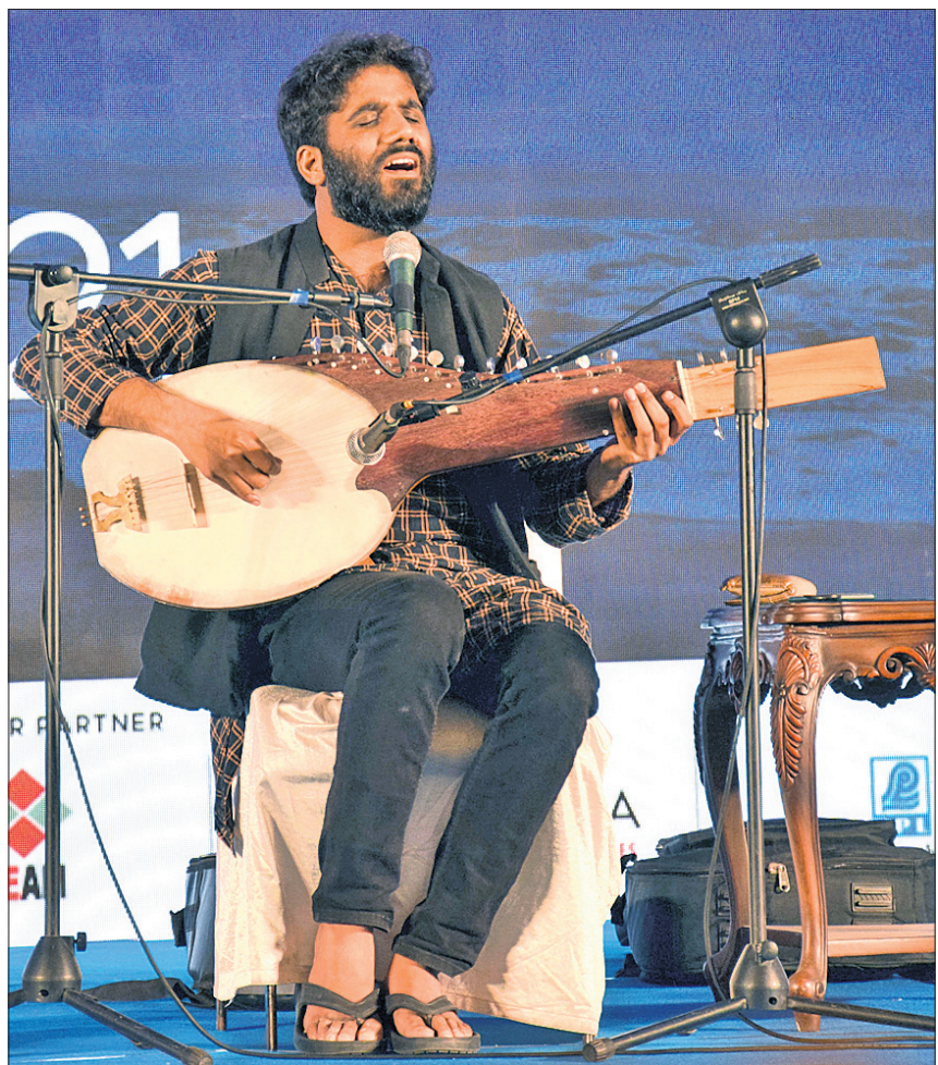
ମୁଖ୍ୟାଳୟ କବି ତଥା ଗୀତିକାର କବି ଶ୍ରେଣୀ ନିକ୍ତା ଉଦାସିତ 'ନୋରା' ଗାୟନରେ ସହ ସଙ୍ଗୀତ ପରିବେଶଣ କରୁଛନ୍ତି ।