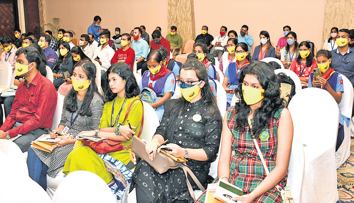
ବିଭିନ୍ନ ଶିକ୍ଷାନ୍ତରାଳରୁ ଆସିଥିବା ଛାତ୍ରାଛାତ୍ରୀ ଓ ବର୍ଷିକ