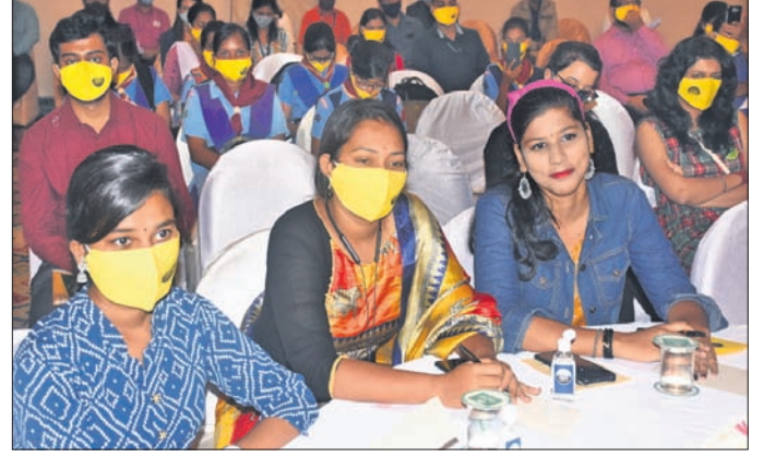
ସମ୍ମିଳନୀରେ ଉପସ୍ଥିତ ବର୍ଷିକ।