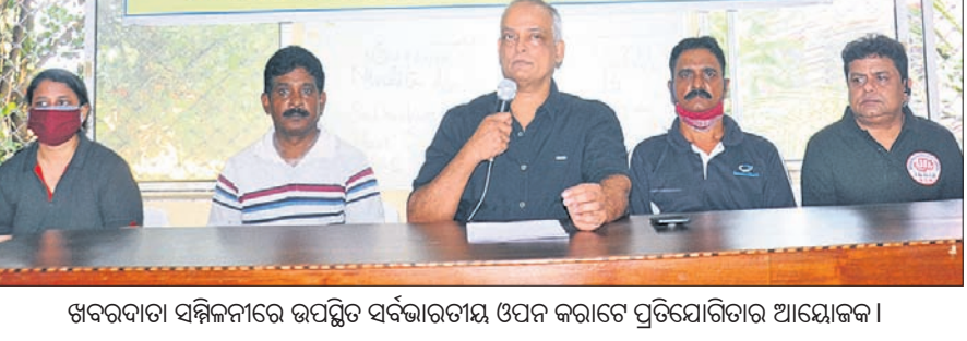
ଖବରଦାତା ସମ୍ମିଳନୀରେ ଉପସ୍ଥିତ ସର୍ବଭାରତୀୟ ଓପନ୍ କରାଟେ ପ୍ରତିଯୋଗିତାର ଆୟୋଜକମାନେ।

ଭୁବନେଶ୍ୱର, ୨୪।୧୧ (ସ୍ପୋର୍ଟ୍ସ୍ ବ୍ୟୁରୋ) ୧୧ତମ ସର୍ବଭାରତୀୟ ଓପନ୍ କରାଟେ ପ୍ରତିଯୋଗିତା ଆସନ୍ତା ୨୬ ତାରିଖରୁ ସ୍ଥାନୀୟ ଉତ୍କଳ କରାଟେ ସ୍କୁଲରେ ହେବ। କୋଭିଡ କଟକଣାକୁ ଦୃଷ୍ଟିରେ ରଖି ପ୍ରତିଯୋଗୀଙ୍କ ସଂଖ୍ୟାକୁ ସୀମିତ କରାଯାଇଛି। ଏଥିରେ ଓଡ଼ିଶା, ଝାଡ଼ଖଣ୍ଡ, ଛତିଶଗଡ଼ ଓ ଆନ୍ଧ୍ର