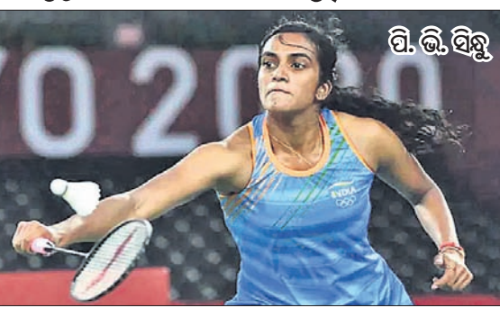
ପି. ଭି. ସିନ୍ଧୁ

ସିନ୍ଧୁ ଅଲରାଉଣ୍ଡର ମଧ୍ୟ ଦଳରେ ରହିଛନ୍ତି। ସିନ୍ଧୁ ବିଭାଗରେ ଭାରତ ପାଇଁ ସେତେବେଳେ ସମସ୍ୟା ଥିବା ପରି ମନେ ହେଉନାହିଁ। ଭାରତୀୟ ସିନ୍ଧୁର ଦୁର୍ଦ୍ଦଳାଭର ବ୍ୟାଟିଂ ବ୍ୟାଟ୍ସମ୍ୟାନଙ୍କୁ ସମସ୍ୟାରେ ପକାଇବେ। କେନ ଫ୍ଲିଣ୍ଡର୍ସନଙ୍କ ନେତୃତ୍ୱରେ ନ୍ୟୁଜିଲ୍ୟାଣ୍ଡ ପୂରା ସାମର୍ଥ୍ୟ ସହ ପଡ଼ିଆକୁ ଓହ୍ଲାଇବ। ଦଳରେ ସୋବି, ନିଲ ଡ୍ରାଗନରଙ୍କ ଭଳି ବ୍ୟାଟିଂ ସେଟ୍ ବୋଲର ରହିଛନ୍ତି। ଦୁଇ ବାମହାତୀ ସିନ୍ଧୁ ଅକ୍ଷର ପଚେଲ ଓ ମିଚେଲ ସାଣ୍ଡନରଙ୍କ ସମେତ ଅଧିକ ସିନ୍ଧୁ ଫ୍ଲିଣ୍ଡର୍ସନ ସୋମରଭିଲେ ଯୋଗାଇ ବ୍ୟାଟ୍ସମ୍ୟାନଙ୍କୁ ସମସ୍ୟାରେ ପକାଇବେ। ଦଳରେ ଫ୍ଲିଣ୍ଡର୍ସନ, ରସ ଚେଲର, ଚମ୍ପୁ ଲାଥମ, ଡାରିଲ ମିଚେଲଙ୍କ ଭଳି ବିଶ୍ୱପ୍ରସିଦ୍ଧ ବ୍ୟାଟ୍ସମ୍ୟାନ ରହିଛନ୍ତି।