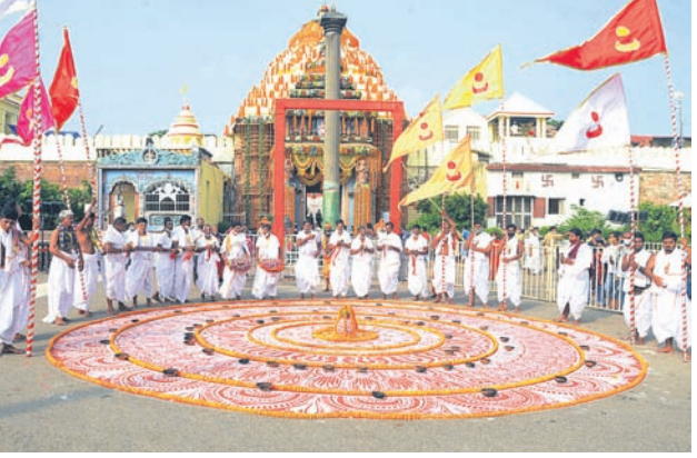
■ ଗଜପତିଙ୍କ ସହ ଶିଳାନାୟକ କଲେ ମୁଖ୍ୟମନ୍ତ୍ରୀ ■ ୧୦୭ ଜମିଦାରୀ, ୧୮ ମଠାଧୀନ ସମ୍ପର୍କିତ