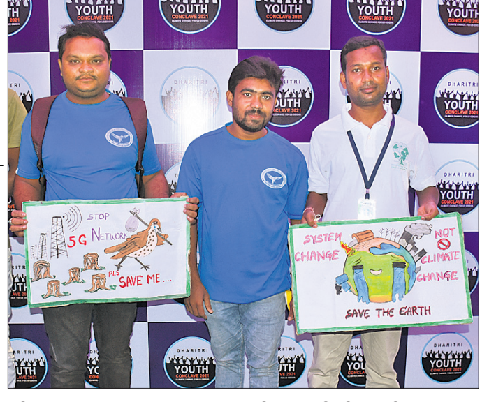
ସମ୍ମିଳନୀରେ ଯୋଗଦେଇଥିବା ବ୍ରହ୍ମପୁରର ସବୁଜ ବାହିନୀ ଓ ଆଞ୍ଚଳିକ ବିକାଶ ପରିଷଦର ସଦସ୍ୟ।