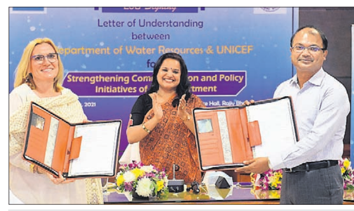
ଜଳସମ୍ପଦ ବିଭାଗ, ୟୁନିସେଫ୍ ମଧ୍ୟରେ ରୁଖାମଣ୍ଡଳ ସ୍ୱାକ୍ଷର

ଭୁବନେଶ୍ୱର, ୨୪।୧୧ (ବୁଧବେଳା) ରାଜ୍ୟ ଜଳ ସମ୍ପଦ ବିଭାଗ ଏବଂ ୟୁନିସେଫ୍ ମଧ୍ୟରେ ରୂପାନ୍ତର ଅପରାହ୍ଣରେ ଏକ ରୁଖାମଣ୍ଡଳ (ଏମ୍ପ୍) ସ୍ୱାକ୍ଷର ହୋଇଛି। ଜଳ ପରିଚାଳନାରେ ବିଭିନ୍ନ ଗୋଷ୍ଠୀକୁ ନିୟୋଜିତ କରିବା, ଯତ୍ନଶୀଳ ଓ ବିଜ୍ଞତାର ସହ ଜଳର ସୁବ୍ୟବହାର, ବ୍ୟବହାର ସମୀକ୍ଷା, ସଂରକ୍ଷଣ, ପରିଚାଳନାରେ ମହିଳାମାନଙ୍କ ପ୍ରମୁଖ ଭୂମିକା ତଥା ପ୍ରମୁଖ ଅଂଶୀଦାରମାନଙ୍କୁ ନେଇ ଜଳସେଚନ ପରିଚାଳନା କରିବା ଏହି ଉଦ୍ୟମର ଲକ୍ଷ୍ୟ ରହିଛି। ୟୁନିସେଫ୍ ସହ ରୁଖାମଣ୍ଡଳ ସ୍ୱାକ୍ଷର ପରିପ୍ରେକ୍ଷାରେ ଜଳ ସମ୍ପଦ ବିଭାଗ ସହିତ ଅନୁ ଗର୍ଭ କରିବା ଯେ, ଜଳ ସମ୍ପଦ ବିଭାଗ ପ୍ରଥମ ଥର ଅଧିକ ଗୋଷ୍ଠୀକୁ ନିୟୋଜିତ କରି ଜଳ ପରିଚାଳନା, ଜଳ ସଂରକ୍ଷଣ ଓ ଜଳକୁ ପରିଷ୍କାର କରିବା ନେଇ ରହିଥିବା ସହାୟକ ପଦକ୍ଷେପକୁ କୋହଳ କରୁଛି।