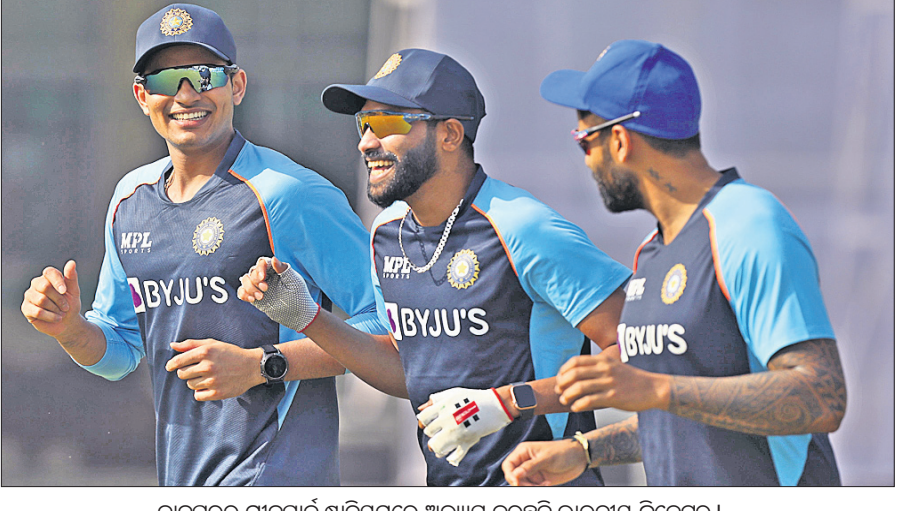
କାନପୁରର ଗ୍ରୀନ୍ ପାର୍କ ଷ୍ଟାଡ଼ିୟମରେ ଅଭ୍ୟାସ କରୁଥିବା ଭାରତୀୟ କ୍ରିକେଟରମାନେ।

କାନପୁର, ୨୪।୧୧ ସ୍ଥାନୀୟ ଗ୍ରୀନ୍ ପାର୍କ ଷ୍ଟାଡ଼ିୟମରେ ଭାରତ ଓ ନ୍ୟୁଜିଲ୍ୟାଣ୍ଡ ମଧ୍ୟରେ ଗୁରୁବାରଠାରୁ ପ୍ରଥମ ଟେଷ୍ଟ ଆରମ୍ଭ ହେବାକୁ ଯାଉଛି। ବିଜିନ ଦୁଷ୍ମକୋଣ୍ଡରୁ ଏହି ଟେଷ୍ଟ ଉଭୟ ଦଳ ପାଇଁ ଚୁରୁରୁ ବନ୍ଧନ କରୁଛି। ଟେଷ୍ଟ ର୍ୟାକିଙ୍ଗର ଏହି ଦୁଇ ଶ୍ରେଣୀ ଦଳ ପଡ଼ିଆକୁ ଓହ୍ଲାଇବାକୁ ଯାଉଥିବା ବେଳେ ପ୍ରଶଂସକମାନେ ଭାରତୀୟ