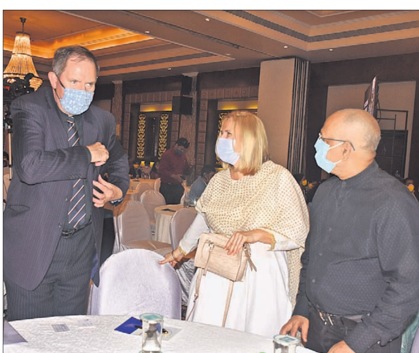
କାର୍ଯ୍ୟକ୍ରମରେ ଯୋଗଦେଇଥିବା ବେଳେ ଏକ ବିଶେଷ ପୂର୍ଣ୍ଣରେ ଅତିଥିମାନେ ।