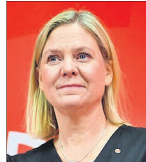
ଅଛନ୍ତି । ୫୪ ବର୍ଷୀୟା ମାଗ୍ଡାଲେନା ପ୍ରଧାନମନ୍ତ୍ରୀ ଭାବେ ଝିଫାନଙ୍କ ସ୍ଥାନ