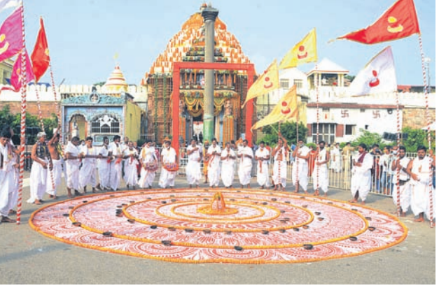
■ ଗଜପତିଙ୍କ ସହ ଶିଳାନାସ କଲେ ମୁଖ୍ୟମନ୍ତ୍ରୀ ■ ୧୦୭ ଜମିଦାରୀ, ୧୮ ମଠାଧୀଶ ସମ୍ପର୍କିତ

ପୁରୀ ଅପ୍ଟିମ୍, ୨୪.୧୧ ଶ୍ରୀମନ୍ଦିର ପରିସର ଆଧୁନିକୀକରଣ ହେବାକୁ ଯାଉଛି। ଖୁବ୍‌ଶୀଘ୍ର ନୂଆ ପ୍ରକଳ୍ପ ଅନୁଯାୟୀ ନୂଆ ରୂପ ନେବ। ଏହି ପରିକ୍ରମାରେ ମୁଖ୍ୟମନ୍ତ୍ରୀ ନବୀନ ପଟ୍ଟନାୟକ ରୁଧିରୀ ପୁରୀ ଗସ୍ତରେ ଆସି ଗଜପତିଙ୍କ ସହ ଶ୍ରୀମନ୍ଦିର ପରିକ୍ରମା ପ୍ରକଳ୍ପର ଶିଳାନାସ କରିଛନ୍ତି। ଶ୍ରୀକାଳ୍ପଙ୍କ ସୁଧିଆ ଓ ଶ୍ରୀମନ୍ଦିର ପୁରୁଷା ଉଦ୍ଦେଶ୍ୟରେ ନିର୍ମାଣ ହେବାକୁ ଥିବା ଏହି ପ୍ରକଳ୍ପ ପାଇଁ ଜମି ଅଧିଗ୍ରହଣ କାର୍ଯ୍ୟ ପୂର୍ବରୁ ସରିଥିବାବେଳେ କାର୍ଯ୍ୟ ଆରମ୍ଭ ପୂର୍ବରୁ ଗତ ୨୧