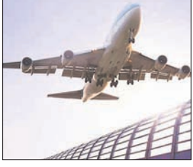
ବ୍ୟଗଳ ଆଶା ପ୍ରକଟ କରିଛନ୍ତି । ବର୍ତ୍ତମାନ ବିଭିନ୍ନ ଦେଶ ସହିତ ଏୟାର ବରଲ୍ ବୁକିଂ ଦ୍ଵାରା ନିର୍ଦ୍ଦିଷ୍ଟ ସର୍ଭିସ ସହିତ ବିଦେଶକୁ ବିମାନ ସେବା ଉପଲବ୍ଧ ହେଉଛି । ଭାରତ ମୋଟ ୨୫ ଦେଶ ସହିତ ଏହି ବୁକିଂ କରିଛି । କିଛି ନିର୍ଦ୍ଦିଷ୍ଟ ସର୍ଭିସରୁ ଆରମ୍ଭ କରି ୨ ଦେଶ