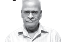
ନିମାଇଁ ଚରଣ ଲେଙ୍କା