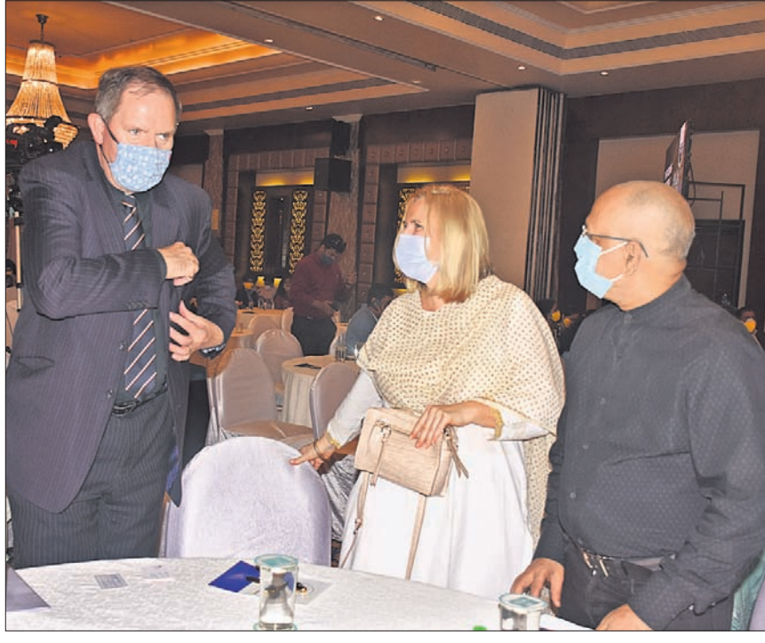
କାର୍ଯ୍ୟକ୍ରମରେ ଯୋଗଦେଇଥିବା ବେଳେ ଏକ ବିଶେଷ ପୂର୍ବରୁରେ ଅତିଥିମାନେ।