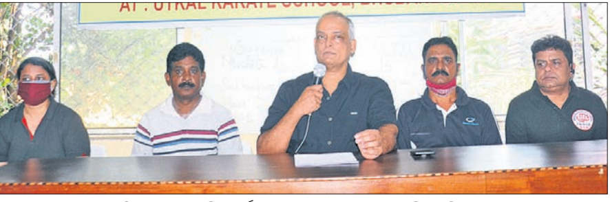
ଖବରଦାତା ସମ୍ମିଳନୀରେ ଉପସ୍ଥିତ ସର୍ବଭାରତୀୟ ଓପନ୍ କରାଟେ ପ୍ରତିଯୋଗିତାର ଆୟୋଜକ।

ଭୁବନେଶ୍ୱର, ୨୪।୧୧ (ସ୍ପୋର୍ଟ୍ସ ଟ୍ୟୁରା): ୧୧ତମ ସର୍ବଭାରତୀୟ ଓପନ୍ କରାଟେ ପ୍ରତିଯୋଗିତା ଆସନ୍ତା ୨୬ ତାରିଖରୁ ସ୍ଥାନୀୟ ଉତ୍କଳ କରାଟେ ସ୍କୁଲରେ ହେବ। କୋଭିଡ କଟକଣାକୁ ଦୃଷ୍ଟିରେ ରଖି ପ୍ରତିଯୋଗୀଙ୍କ ସଂଖ୍ୟାକୁ ସୀମିତ କରାଯାଇଛି। ଏଥିରେ ଓଡ଼ିଶା, ଝାଡ଼ଖଣ୍ଡ, ଛତିଶଗଡ଼ ଓ ଆନ୍ଧ୍ର