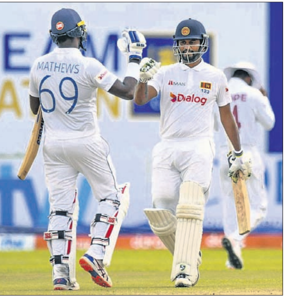
ଶତକାୟ ଭାଗାଦାରି ଅବସରରେ ଆଜେଲୋ ମାଧ୍ୟମ ଓ ଦିପ୍ତ କରୁଣାରାଜେ।

ଗାଲେ, ୨୪।୧୧ ଏଠାରେ ଚାଲିଥିବା ଶ୍ରୀଲଙ୍କା ବିପକ୍ଷ ଗ୍ରାମିଣୀ ଟିମ୍ମେଟ୍ ଟେଷ୍ଟ ମ୍ୟାଚ୍ରେ ଭ୍ରମଣକାରୀ ଫ୍ରେଷ୍ଟକଣ୍ଡିକ ବିପର୍ଯ୍ୟୟର ସମ୍ମୁଖୀନ ହୋଇ ପରାଜୟ ସ୍ୱୀକାର କରି ପହଞ୍ଚିଛି। ପ୍ରଥମ ଇନିଂସରେ ଶ୍ରୀଲଙ୍କା ୧୩୩.୫ ଓଭରରେ ୩୮୬ ରନକରି ଅଲଆଉଟ୍ ହୋଇଥିଲା। ଜବାବରେ ପ୍ରଥମ ଇନିଂସ ଆରମ୍ଭ କରି ଫ୍ରେଷ୍ଟକଣ୍ଡିକ ୮୫.୫ ଓଭରରେ ୨୩୦ ରନକରି ଅଲଆଉଟ୍ ହୋଇ ୧୫୬ ରନ ପଛରେ ପଡିଥିଲା। ଏହାପରେ ଶ୍ରୀଲଙ୍କା ବିତୀର ଇନିଂସ ଆରମ୍ଭ କରି ୪୦.୫ ଓଭରରେ ୪ ଉଇକେଟ୍ ହରାଇ ୧୯୧ ରନକରି ଇନିଂସ ଯୋଷାଣା କରିଥିଲା। ଫଳରେ ଫ୍ରେଷ୍ଟକଣ୍ଡିକ ସମ୍ମୁଖରେ ଧାଟ୍ଟା ରନର ବିଜୟ ଲକ୍ଷ୍ୟ ଧାର୍ଯ୍ୟ ହୋଇଥିଲା। ଜବାବରେ ବିତୀର ଇନିଂସ ଆରମ୍ଭ କରି ଫ୍ରେଷ୍ଟକଣ୍ଡିକ ପ୍ରାରମ୍ଭିକ ବ୍ୟାଟିଂ ବିପର୍ଯ୍ୟୟର ସମ୍ମୁଖୀନ ହୋଇ ରୁଧିରା ବିପର୍ଯ୍ୟୟର ସମ୍ମୁଖୀନ ହୋଇ