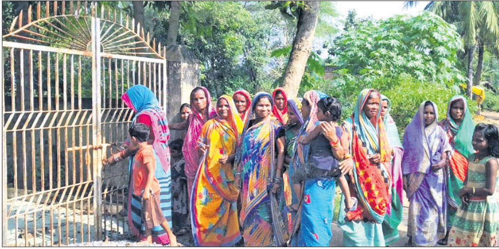
ରାଜୀବ ଗାନ୍ଧୀ ସେବା କେନ୍ଦ୍ର ଫାଟକରେ ପକାଯାଇଥିବା ତାଲାକୁ ମହିଳାମାନେ ଖୋଲୁଛନ୍ତି ।

ଏହି ବିବାଦର ୪୫ ଦିନ ପରେ ମହିଳା ସ୍ୱୟଂ ସହାୟିକା ଗୋଷ୍ଠୀର ସଦସ୍ୟାମାନେ ରାଜୀବ ଗାନ୍ଧୀ ସେବା କେନ୍ଦ୍ରର ମୁଖ୍ୟ ଫାଟକରେ ତାଲା ଖୁଲାଇ ଯାହାକୁ ନେଇ ବିବାଦର ସୂତ୍ରପାତ ହେବା