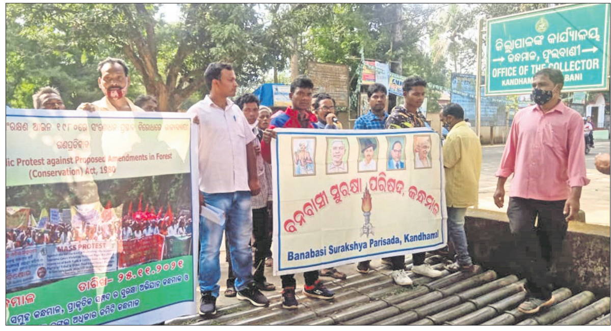
ଜିଲ୍ଲାପାଳଙ୍କ କାର୍ଯ୍ୟାଳୟ ସମ୍ମୁଖରେ ବିରୋଧ ପ୍ରଦର୍ଶନ କରାଯାଇଛି ।