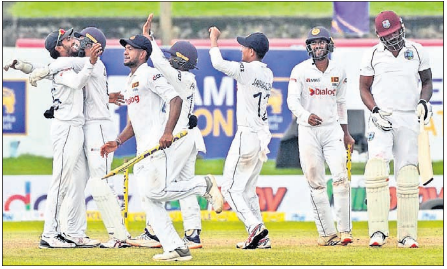
ବିଜୟ ହାସଲ ପରେ ଶ୍ରୀଲଙ୍କା କ୍ରିକେଟର ଖୁସି ମନାଉଛନ୍ତି।

ଗାଲେ, ୨୫।୧୧ ଫ୍ଲୋଇଡିଙ୍ଗ୍ ବିପକ୍ଷ ପ୍ରଥମ ଟେଷ୍ଟ ମ୍ୟାଚରେ ଘରୋଇ ଶ୍ରୀଲଙ୍କା ବୃହତ୍ ବିଜୟ ହାସଲ କରିଛି। ୧୮୭ ରନରେ ବିଜୟୀ ହେବା ସହ ଶ୍ରୀଲଙ୍କା ତୁଳା ମ୍ୟାଚ୍ ବିଶିଷ୍ଟ ଏହି ସିରିଜରେ ୧-୦ରେ ଅଗ୍ରଣୀ ହାସଲ କରିଛି। ଟପ୍ କିଟ୍ ପ୍ରଥମ ଇନିଂସରେ ଶ୍ରୀଲଙ୍କା ୧୩୩.୫ ଓଭରରେ ୩୮୬ ରନକରି ଅଲଆଉଟ ହୋଇଥିଲା। ବନ୍ଦାବରେ ପ୍ରଥମ ଇନିଂସ ଆରମ୍ଭ କରି ଫ୍ଲୋଇଡିଙ୍ଗ୍ ୮୫.୫ ଓଭରରେ ୨୩୦ ରନକରି ଅଲଆଉଟ ହୋଇ ୧୫୬ ରନ ପଛରେ ପଡିଥିଲା। ଏହାପରେ ଶ୍ରୀଲଙ୍କା ଦ୍ୱିତୀୟ ଇନିଂସ ଆରମ୍ଭ କରି ୪୦.୫ ଓଭରରେ ୪ ଓଭରକେଟ୍ ହରାଇ ୧୯୯ ରନକରି ଇନିଂସ ଘୋଷଣା କରିବା ପରେ ଫ୍ଲୋଇଡିଙ୍ଗ୍ ସମ୍ପୃକ୍ତରେ ୩୪୮ ରନର ବିଜୟ ଲକ୍ଷ୍ୟ ଧାରିଣୀ ହୋଇଥିଲା।