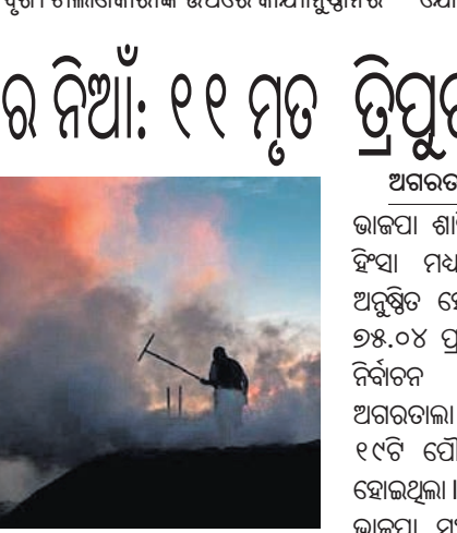
କରିବା ଲାଗି ଉଦ୍ଧାର କାର୍ଯ୍ୟ ଜାରି ରହିଛି। ପୁରୁଣା ନିର୍ମାଣ ଉଲ୍ଲ୍ୟାନ୍ ଯୋଗୁ ଏକଜି ଉଦ୍ଧାର କରାଯାଇଥିଲା। ୪୩ ଜଣଙ୍କୁ ହସ୍ପିଟାଲରେ ଭର୍ତ୍ତି କରାଯାଇଥିବାବେଳେ ସେମାନଙ୍କ ମଧ୍ୟରୁ ୩ ଜଣଙ୍କ ଅବସ୍ଥା ଗୁରୁତର ରହିଛି। ଅନ୍ୟମାନଙ୍କୁ ବାହାର

ମସ୍କୋ, ୨୫।୧୧ ରୁଷିଆର ସାଇବେରିଆରେ ଥିବା ଏକ କୋଇଲା ଖଣିରେ ଗୁରୁବାର ନିଆଁ ଲାଗି ୧୧ ଜଣଙ୍କ ମୃତ୍ୟୁ ଘଟିବା ସହ ୪୦ରୁ ଊର୍ଦ୍ଧ୍ଵ ଆହତ ହୋଇଛନ୍ତି। ଅନ୍ୟ କେତେଜଣ ଖଣି ଭିତରେ ପବିତ୍ରହୁଥିବା ଜଣାପଡ଼ିଛି। କେମେରୋଭୋ ଅଞ୍ଚଳର ଲିସ୍‌କାୟାସୋୟା ଖଣିର କୋଇଲା ଗୁଣ୍ଡରେ ନିଆଁ ଲାଗିଯିବାରୁ ଖଣିରେ ଥିବା ଭର୍ତ୍ତି ହୋଇଯାଇଥିଲା। ସେହି ସମୟରେ ଖଣି ଭିତରେ ୨୮୫ ଜଣ କାମ କରୁଥିଲେ। ସେମାନଙ୍କ ମଧ୍ୟରୁ ୨୩୯ ଜଣଙ୍କୁ ଉଦ୍ଧାର କରାଯାଇଥିଲା। ୪୩ ଜଣଙ୍କୁ ହସ୍ପିଟାଲରେ ଭର୍ତ୍ତି କରାଯାଇଥିବାବେଳେ ସେମାନଙ୍କ ମଧ୍ୟରୁ ୩ ଜଣଙ୍କ ଅବସ୍ଥା ଗୁରୁତର ରହିଛି। ଅନ୍ୟମାନଙ୍କୁ ବାହାର