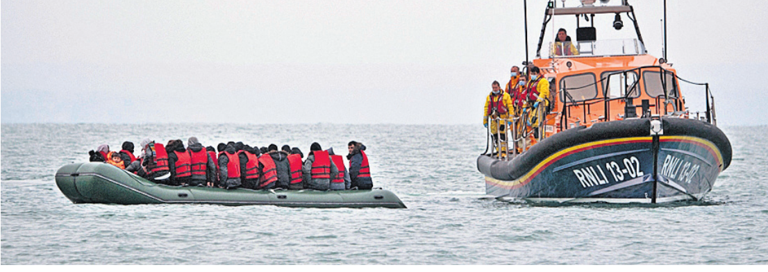
ଇଂଲଣ୍ଡର ଦକ୍ଷିଣପୂର୍ବ ଉପକୂଳରେ ବୁସ୍‌ବାର ଇଂଲିଶ ଚ୍ୟାନେଲ ଅତିକ୍ରମ କରୁଥିବା ପ୍ରବାସୀମାନଙ୍କୁ ରକ୍ଷାକାର ନ୍ୟାଶନାଲ ଲାଇଫ‌ବୋଟ୍ ଇନ୍‌ଷ୍ଟିଚ୍ୟୁଶନ୍ (ଆର୍‌ଏ‌ଏ‌ଏ‌ଲ୍‌ଆଇ) ପକ୍ଷରୁ ଉଦ୍ଧାର କରାଯାଇଛି।

ଇଂଲିଶ ଚ୍ୟାନେଲରେ ବୋର୍ ବୁଡ଼ି ୨୭ ପ୍ରବାସୀଙ୍କ ମୃତ୍ୟୁ ଘଟିବାର ଦିନକ ପରେ ଏହି ଜଳପଥ ଦେଇ ଯାତାୟାତ ବୃଦ୍ଧି ପାଇଛି। ଗୁରୁବାର ପ୍ରାୟ ୪୦ ପ୍ରବାସୀଙ୍କୁ ଲାଇଫ‌ବୋଟ୍ ଚ୍ୟାନେଲ ଆର୍‌ଏ‌ଏ‌ଏ‌ଲ୍‌ଆଇ ପକ୍ଷରୁ ଡୋରରକୁ ଅଣାଯାଇଛି। ଇଂଲିଶ ଚ୍ୟାନେଲର ପ୍ରାୟ ୪୦ ପ୍ରବାସୀଙ୍କ ମୃତ୍ୟୁ ହେଉଥିବା ବେଳେ ଖୁବ୍ ଦୁର୍ଭିକ୍ଷ ହେଉଥିବା ବୋଲି ଜଣାପଡ଼ିଛି। ଏହି ବୋର୍ ବୁଡ଼ି ଚ୍ୟାନେଲରେ ସବୁଠାରୁ ଘାତକ ଦୁର୍ଘଟଣା ବୋଲି ୨୦୧୪ରୁ ଏ ସମ୍ପର୍କରେ ତଥ୍ୟ ସଂଗ୍ରହ କରୁଥିବା ଅନ୍ତର୍ଜାତୀୟ ପ୍ରବାସୀ ସଂଗଠନ ପକ୍ଷରୁ ଜଣାପଡ଼ିଛି। ଇତିମଧ୍ୟରେ ଏହି ପ୍ରଦେଶରେ ହିଁସ୍‌ହୁଇଁ ହୋଇଛି ବ୍ରିଟେନ ଓ ଫ୍ରାନ୍ସ। ଇଂଲିଶ ଚ୍ୟାନେଲରେ ୨୭ ଜଣ ସଜଳ ସମାଧି ନେବା ପରେ ଫ୍ରାନ୍ସ ଓ ବ୍ରିଟେନ ପରସ୍ପର ଉପରେ ଦୋଷ ଲଦିବାରେ ଲାଗିଛନ୍ତି। ଫ୍ରାନ୍ସରୁ ବୁସ୍‌ବାରୀ ଗୋରାଲୁ ଡର୍‌ମାନ୍‌ଡି କହିଛନ୍ତି, ସଦ୍ୟ ଦୁର୍ଘଟଣା ପରେ ୫ ଚାଲଣକାରୀଙ୍କୁ ଗିରଫ କରାଯାଇଛି। ଜଳପଥରେ ପ୍ରବାସୀ ଗୁଣାଚଳ ହେବା ଏକ ଅନ୍ତର୍ଜାତୀୟ ସମସ୍ୟା। ବ୍ରିଟେନର ଆପ୍ରବାସୀ ପରିଚାଳନା ନୀତି ଖରାପ। ଫ୍ରାନ୍ସ ଓ ବ୍ରିଟେନ ଉପକୂଳ ଦେଇ ଅତିକ୍ରମ କରୁଥିବା ଅନ୍ୟ ପ୍ରବାସୀଙ୍କୁ ଡାକ୍ତରୀ ଚିକିତ୍ସା ଦେବା ଏବେ ସମ୍ଭବ।