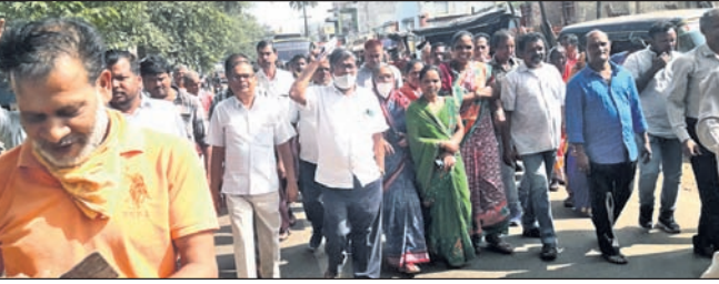
ସଚେତନତା ଶୋଭାଯାତ୍ରା ।

କ.ନୂଆଗାଁ, ୨୫୧୧୧ (ଡି.ଏନ.ଏ.): କନ୍ଧମାଳ ଜିଲ୍ଲା କ.ନୂଆଗାଁ ଠାରେ ପାଳିଥିବା ଜଗନ୍ନାଥ ମନ୍ଦିର ନିର୍ମାଣ କାର୍ଯ୍ୟକୁ ନୂତନ ଭାବେ ଗଠିତ ଗୋଷ୍ଠୀ ସାଧ୍ୟ କେନ୍ଦ୍ର ପୁରୁଣା ମଞ୍ଚ ବିରୋଧ କରୁଛି । ଏହା ସାଧ୍ୟକେନ୍ଦ୍ର ଜାଗାରେ ହେଉଛନ୍ତି ହେଉଛନ୍ତି କର୍ମଚୀ ସହ ଆଲୋଚନା କରିବେ କାର୍ଯ୍ୟକୁ ବିରୋଧ ପ୍ରତିବାଦରେ ଗୁରୁବାର ପୁରୁଣା ପୂଜା କର୍ମଚୀ ଓ ବଜାର କର୍ମଚୀ ପକ୍ଷରୁ ଦୋକାନ ବନ୍ଦ କରାଯାଇଛି । ପରେ ବ୍ଲକର ଶତାଧିକ ଜଗନ୍ନାଥପୂଜା ଏକାଠି ହୋଇ ତହସିଲ ଅଫିସକୁ ଯାଇଥିଲେ ।