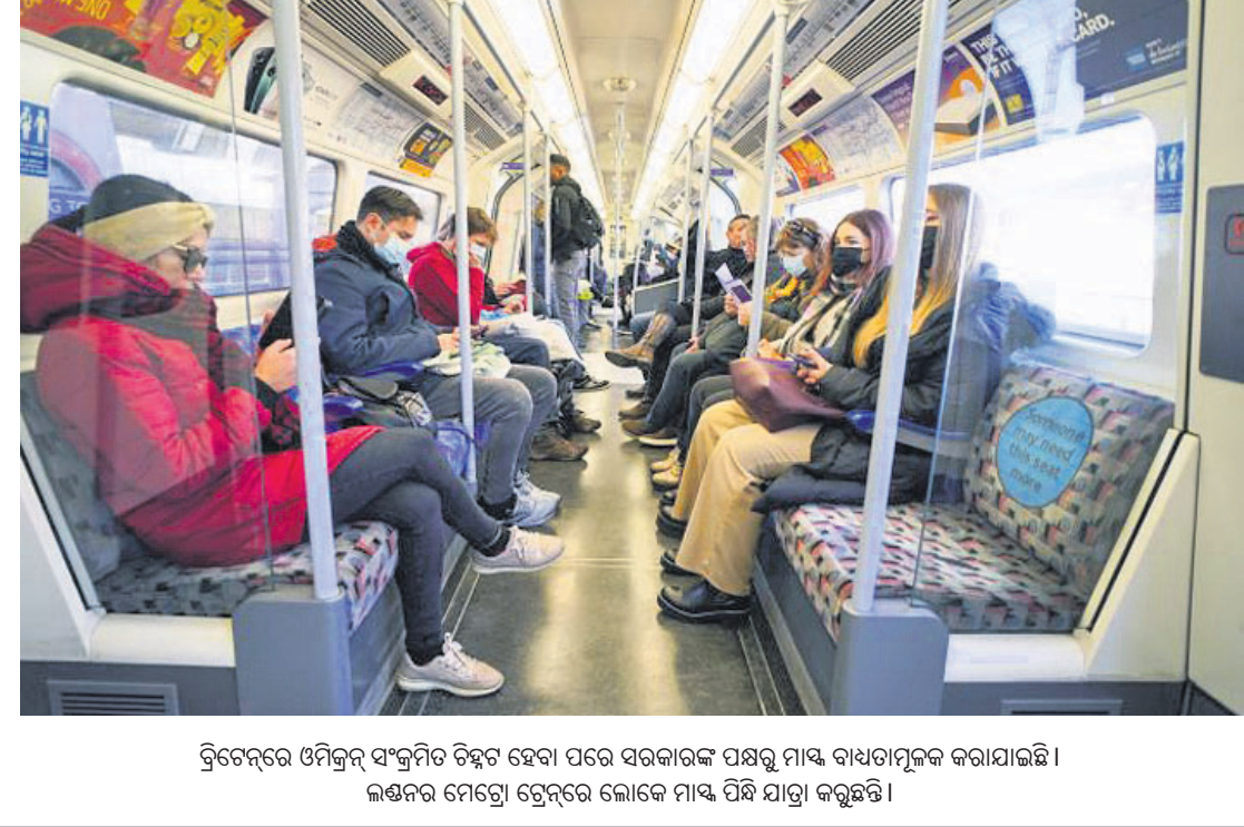
ତ୍ରିଚେନ୍ଦ୍ରରେ ଓମିକ୍ରନ୍ ସଂକ୍ରମିତ ଚିହ୍ନଟ ହେବା ପରେ ସରକାରଙ୍କ ପକ୍ଷରୁ ମାଧ୍ୟ ବାଧ୍ୟତାମୂଳକ କରାଯାଇଛି।

ଯୋଗୁଁ ଟିକାର ରୋଗ ପ୍ରତିରୋଧକ ଶକ୍ତିଠାରୁ ଏହା ବର୍ଦ୍ଧିତପାଇଁ ସମର୍ଥ ୩୦ରୁ ଅଧିକ ପ୍ରକାର ପରିବର୍ତ୍ତନ ବୋଲି ଗୁଲେରିଆ କହିଛନ୍ତି।