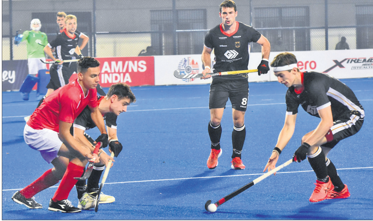
ରବିବାର ଜର୍ମାନୀ ଓ ଇଟିଆଲୀ ମଧ୍ୟରେ ଅନୁଷ୍ଠିତ ମ୍ୟାଚ୍।

କୁବେନଶ୍ଵର, ୨୮।୧୧ (ବ୍ରାହ୍ମା ପ୍ରତିନିଧି) କଲିଙ୍ଗ ଷ୍ଟାଡ଼ିୟମରେ ଚାଲିଥିବା ଏପିଆଇଏଏ ହକି ପୁରୁଷ କ୍ରୀଡ଼ାରେ ବିଶ୍ଵକପର ଲିଗ୍ ପର୍ଯ୍ୟାୟ ରବିବାର ଶେଷ ହୋଇଛି। ପୁଲ୍ 'ଡି'ର ଅଧିନ ମ୍ୟାଚରେ ଜର୍ମାନୀ ୧୧-୦ ଗୋଲରେ ଇଟିଆଲୀ ପରାସ୍ତ କରିଛି। ଏଥିପରେ ପ୍ରତିଯୋଗିତାର କ୍ଵାର୍ଟର ଫାଇନାଲ ଲାଇନ୍‌ଅପ୍ ରୂପାନ୍ତ ହୋଇ ଯାଇଛି। ଡିସେମ୍ବର ୧ରେ