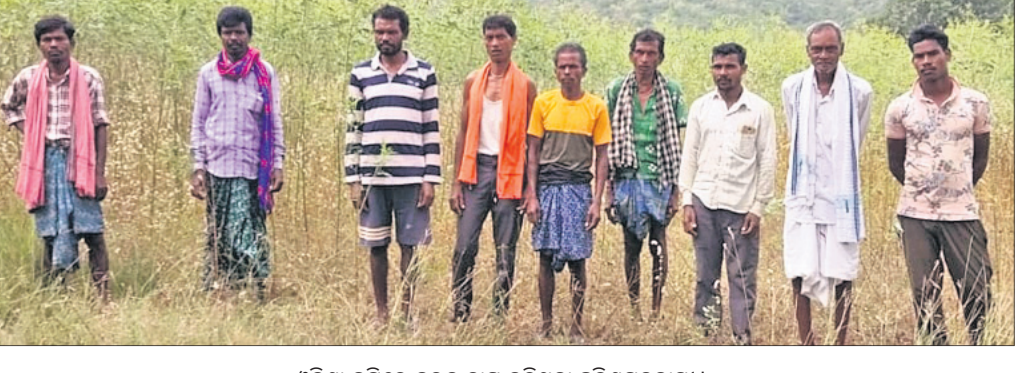
ଓଡ଼ିଶା ଜମିରେ ହରଡ଼ ଚାଷ କରିଥିବା ଛତିଶଗଡ଼ବାସୀ।

ନୂଆପଡ଼ା ଅଫିସ୍, ୨୮।୧୧ ରାଜ୍ୟରେ ଏବେ ସୀମା ବିବାଦ ମୁଣ୍ଡ ଚଢ଼ିଛି। ଓଡ଼ିଶା-ଆନ୍ଧ୍ର, ପଶ୍ଚିମବଙ୍ଗ-ଓଡ଼ିଶା ମଧ୍ୟରେ ସୀମା ବିବାଦ ଲାଗି ରହିଛି। ଏଭଳିସ୍ଥିତିରେ ନୂଆପଡ଼ା ଜିଲ୍ଲା ସିନାପାଲି ରେଖା ଅଞ୍ଚଳ ଉପରେ ଛତିଶଗଡ଼ର ନଜର ପଡ଼ିଛି। ପୂର୍ବରୁ ମଧ୍ୟ ଏଠାରେ ଏହି ବିବାଦ ରହିଛି। ସୂଚନା ଯେ, ସିନାପାଲି ରେଖାର ନୂଆମାଲପତା ନିକଟସ୍ଥ ବୃନ୍ଦବି