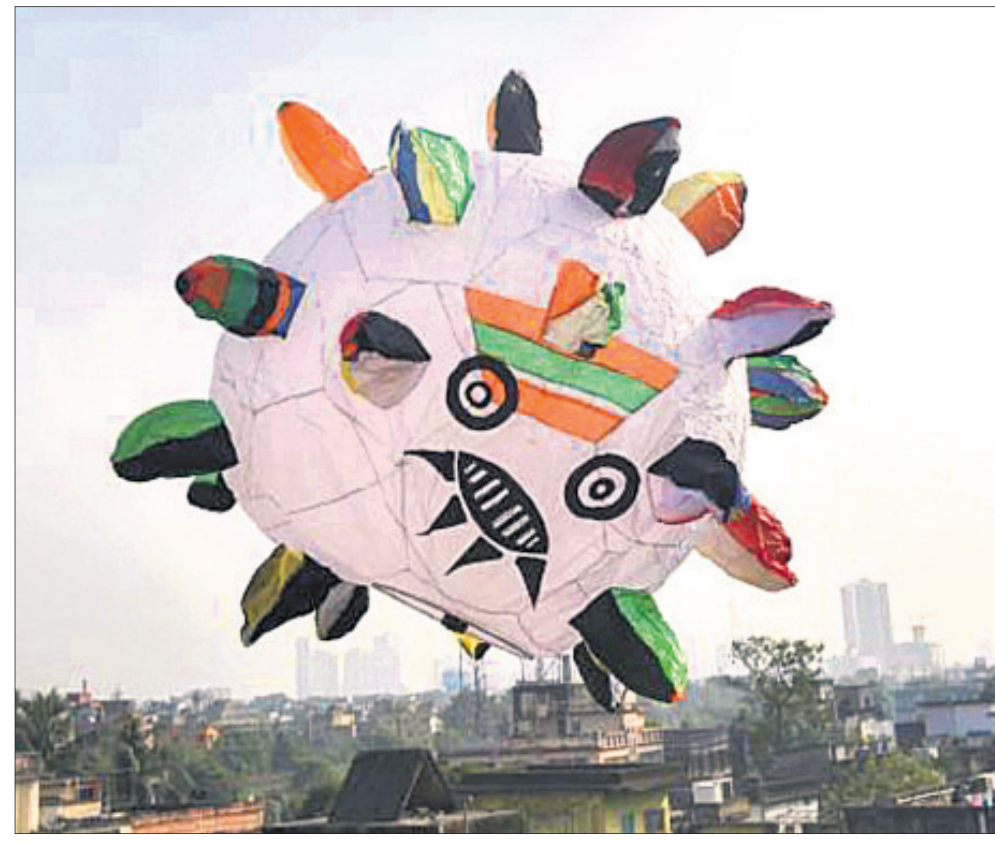
କୋଲକାତାରେ ରବିବାର ଫୁଲ୍ସ ଉତ୍ସବ ବେଳେ ପ୍ରଦର୍ଶିତ କରୋନା ଭୁତାଣୁ ସଦୃଶ ଏକ ବେଲୁନ।