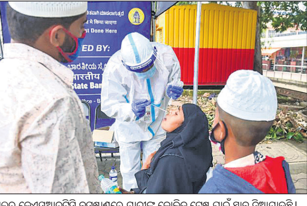
ବେକାଲୁରୁ କେଏସ୍‌ଆର୍‌ଭିସି ବସ୍ତୁଷ୍ଟରେ ଯାତ୍ରୀଙ୍କୁ କୋଭିଡ୍ ଟେଷ୍ଟ ପାଇଁ ସ୍ୱାଗତ ନିଆଯାଇଛି।

କରିବା, ପରୀକ୍ଷା ବଢ଼ାଇବା ସହ ସ୍ୱାସ୍ଥ୍ୟ ଭିତ୍ତିକ ବଢ଼ାଇବାକୁ କହିଛନ୍ତି। ଚିକାକରଣ ଭିତ୍ତିକ ଚିହ୍ନଟ ହୋଇଥିବା ଦେଶଗୁଡ଼ିକୁ ଆସୁଥିବା ଯାତ୍ରୀମାନଙ୍କ ପ୍ରତି ଅଧିକ ସତର୍କ ରହିବାକୁ କୁହାଯାଇଛି। ନୂଆ ଭାରିଆଣ୍ଟ ଯୋଗୁଁ ଯଦି ସଂକ୍ରମଣ ବୃଦ୍ଧି ପାଏ, ତାହାର ପୂର୍ବାବଳା ଲାଗି ପର୍ଯ୍ୟାପ୍ତ ପରୀକ୍ଷା ଭିତ୍ତିକ ପ୍ରସ୍ତୁତ ରଖିବାକୁ କେନ୍ଦ୍ର ସରକାର କହିଛନ୍ତି। ବର୍ତ୍ତମାନ ବିଭିନ୍ନ ରାଜ୍ୟରେ କୋଭିଡ୍ ପରୀକ୍ଷା ଯଥେଷ୍ଟ ହୁଏ ପାଇଛି। ଫଳରେ ହରଷ୍ଟ ଉପରେ ନଜର ରଖିବା, ସଂକ୍ରମଣ ପ୍ରକୃତରେ କେତେ ବ୍ୟାପୁଛି ତାହା ଆକଳନ କରିବା ସମ୍ଭବ ହେଉନାହିଁ।