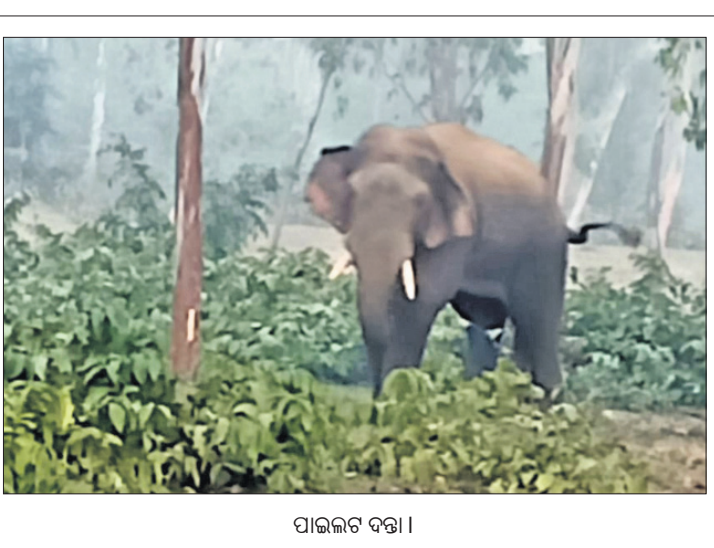
ପାଲଲହଡ଼ା ଦନ୍ତା ।