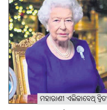
ମହାରାଣୀ ଏଲିଜାବେଥ୍ ଦ୍ୱିତୀୟ

ଦିଶ୍ୱର ଅନେକ ଦେଶକୁ ଶାସନ କରିଥିବା ତ୍ରିଚ୍ଚୋର ହାତରୁ ମୁକ୍ତି ଏବେ ନୂଆକରି ଗଣତନ୍ତ୍ର ଦେଶ ହେବାକୁ ଯାଉଛି ବାର୍ଦ୍ଧାତୋସ। ସାଧାନ ହେବା ସତ୍ତ୍ୱେ ତ୍ରିଚ୍ଚୋର ମହାରାଣୀ ଏଲିଜାବେଥ୍ ଦ୍ୱିତୀୟ ଔପଚାରିକ ଭାବେ ଦେଶର ରାଷ୍ଟ୍ରମୁଖ୍ୟ ରହିଥିଲେ। ମହାରାଣୀଙ୍କୁ ମୁଖ୍ୟତା ପଦରୁ ହଟାଇ ସମ୍ପୂର୍ଣ୍ଣ ରିପବ୍ଲିକ ରାଷ୍ଟ୍ର ହେବାକୁ ଘୋଷଣା କରି ବାର୍ଦ୍ଧାତୋସ ନିକଟ ରାଷ୍ଟ୍ରପତି ଚୟନ କରିସାରିଛି। ନୂଆ ରାଷ୍ଟ୍ରମୁଖ୍ୟ ଭାବେ ଗର୍ଭର୍ଣ୍ଣ ଜେନେରାଲ ସାଣ୍ଡା ମାସୋନ୍ ବାରିଡ୍ ନେବା ପାଇଁ ସୋମବାର ଓ ମଙ୍ଗଳବାର ଦୁଇ ଦିନ ଧରି ସ୍ୱତନ୍ତ୍ର ସମାରୋହର ଆୟୋଜନ କରାଯାଇଛି। ଏ ବାବଦରେ ପ୍ରଧାନମନ୍ତ୍ରୀ ମିଆ ଆମୋର ମୋଜେଲା ସୂଚନା ଦେଇଛନ୍ତି। ଏଥିରେ ମିଳିତାନ୍ତ ପରେ