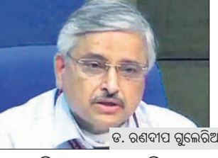
ଡ. ରଶ୍ମୀପ୍ତ ଗୁଲେରିଆ