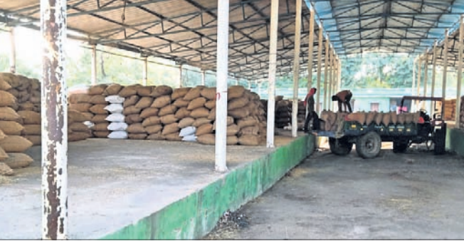
କଳାପାଣି ମଣ୍ଡିରେ ବିକ୍ରି ହୋଇ ନ ପାରି ପଡ଼ି ରହିଥିବା ଧାନ।

କରଗଡ଼ ଅଫିସ୍, ୨୮।୧୧ ବିଭିନ୍ନ ଜିଲ୍ଲାରେ ଖରିଫ୍ ଧାନ ଅମଳ ଆରମ୍ଭ ହୋଇଛି। କିନ୍ତୁ ଅନ୍ୟତମ ଅପେକ୍ଷା ମଣ୍ଡି ଖୋଲିବା ବିଳମ୍ବ ଯୋଗୁ ଚାଷୀଙ୍କୁ ହଇଜା ହେବାକୁ ପଡୁଛି। ସେହିପରି ଧାନ କିଣାବିକାରେ ଟୋକନ କଟକଣା ମଧ୍ୟ ବାଧକ ସାଜିଛି। ଯେଉଁ ଚାଷୀ ଧାନ ଅମଳ କରି ସାରିଛନ୍ତି, ସେମାନେ ଏଯାବତ୍ ଟୋକନ ପାଇନାହାନ୍ତି। କେବଳ ସେତିକି ନୁହେଁ, ପଞ୍ଚାକରଣ ସମୟରେ ଉଦ୍ଦିଷ୍ଟ ଆବେଦନ ଫର୍ମରେ ଚାଷୀମାନଙ୍କୁ ଧାନ ବିକ୍ରି ସମୟ ସୀମା ଦେବାକୁ କୁହାଯାଇଥିଲା। ଚାଷୀମାନେ ତଦନୁଯାୟୀ ସମସ୍ତ ବିକ୍ରି ବିବେଚନା ସମୟ ସୀମା ପୂରଣ କରି ଆବେଦନ କରିଥିଲେ। କିନ୍ତୁ ଟୋକନରେ ବିକ୍ରି ବିବେଚନା ଆହୁରି ୧୫ରୁ ୨୦ଦିନ ଆଗକୁ ବଢ଼ାଇ ଦିଆଯାଇଥିବା ଅଭିଯୋଗ ହୋଇଛି। ଏଭଳି ଅବ୍ୟବସ୍ଥା