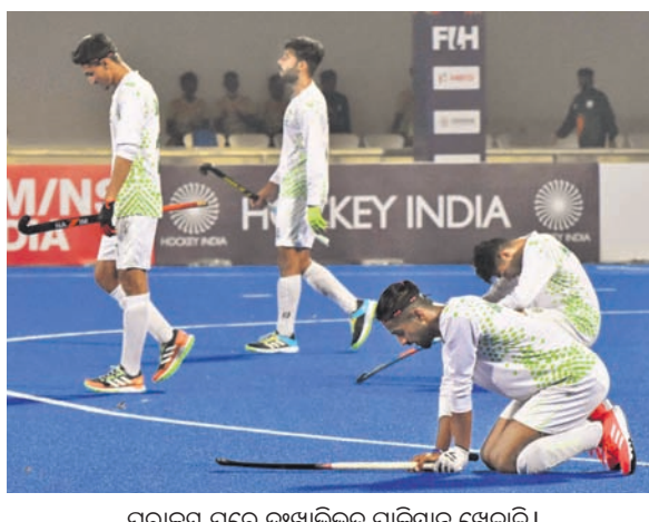
ପରାଜୟ ପରେ ଦୁଃଖାଭିଭୂତ ପାକିସ୍ତାନ ଖେଳାଳି।