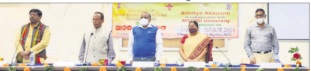
ଆଲୋଚନାଚକ୍ରରେ ଉପସ୍ଥିତ ଅତିଥି।

ଯାନବାହନ ଚଳାଚଳ ସ୍ୱଭାବିକ ଥିଲା। ଗୋପବନ୍ଧୁ ନଗର ବ୍ଲକରେ ବନ୍ଦ ପାଳନ ପ୍ରଭାବ ଶୂନ୍ୟ ଥିଲା। ଯାତ୍ରାବାହୀ ବସ ରୁଡ଼ିକ ବନ୍ଦ ରହିଥିଲା। ଦୋକାନ ବଜାର ଖୋଲା ଥିଲା। ଶରତ ଆଞ୍ଚଳିକ ଆଦିବାସୀ ଏକତା ପରିଷଦର ଆହ୍ୱାନକ୍ରମେ ଶରତ ବଜାର, ସରକାରୀ କାର୍ଯ୍ୟାଳୟ, ଗଢ଼ି ଲକ୍ଷ୍ୟ କରାଯାଇଛି। ବିଶୋଇ ବ୍ଲକ୍ 'ମାସା' ସଭାପତି ଆନନ୍ଦ ବାସ୍ତେକ ନେତୃତ୍ୱରେ ପ୍ରଭାବ ପଡ଼ିଥିଲା। ବସ୍ ଚଳାଚଳ ଓ ବ୍ୟବସାୟିକ ପ୍ରତିଷ୍ଠାନ ବନ୍ଦ ରହିଥିଲା।