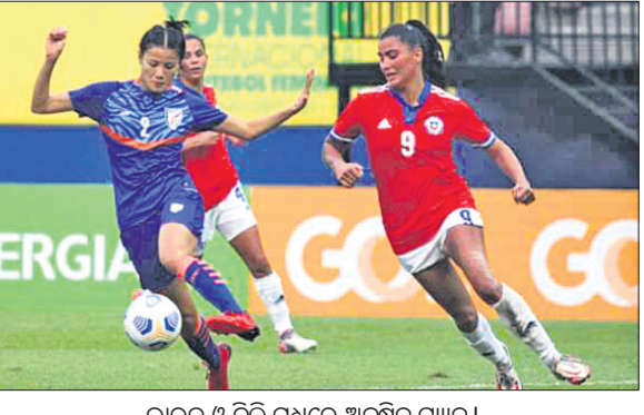
ଭାରତ ଓ ଚିଲି ମଧ୍ୟରେ ଅନୁଷ୍ଠିତ ମ୍ୟାଚ।

ମାନାଭଂ (ଗ୍ରୀକ), ୨୯/୧୧ (ପି.ଟି.) ଲକ୍ଷ୍ମୀ ପ୍ରଦର୍ଶନ ସଭେ ସ୍ଥାନୀୟ ଆମାଜନ ଆନେନାଠାରେ ଚାଲିଥିବା ଚଳଚ୍ଚିତ୍ର ମହିଳା ପୁରସ୍କାର ପୂର୍ବଦଳ ପୂର୍ଣ୍ଣାଙ୍ଗଣରେ ଭାରତ ଚିଲିଠାରୁ ୦-୩ ଗୋଲରେ ପରାସ୍ତ ହୋଇଛି। ପ୍ରଥମ ଚଳଚ୍ଚିତ୍ର ଷ୍ଟାର୍‌ଲାଇଟ୍ ମାରିଆ ରଞ୍ଜିତା (୧୫ତମ ମିନିଟ୍) ଚିଲିକୁ ପ୍ରଥମେ ଅଗ୍ରଣୀ କରାଇଥିଲେ। ପ୍ରଥମ ଗୋଲ ଷ୍ଟୋର କରିଥିଲେ। ମ୍ୟାଚର ଶେଷ ଆଡ଼କୁ ୮୪ତମ