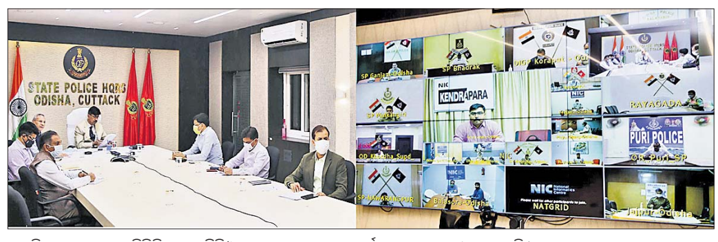
ପୋଲିସ୍ ପୁଞ୍ଜାଳୟରେ ଡିଜିଟାଲ ଡିଭିଓ କମ୍ପରେନ୍ସରେ ଗୁରୁତ୍ଵପୂର୍ଣ୍ଣ ପ୍ରସଙ୍ଗରେ ସମୀକ୍ଷା କରୁଛନ୍ତି।