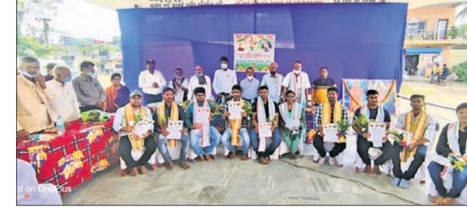
ଅତିଥିଙ୍କ ଗହଣରେ ସମ୍ବର୍ଦ୍ଧିତ ଛାତ୍ରଛାତ୍ରୀ ।