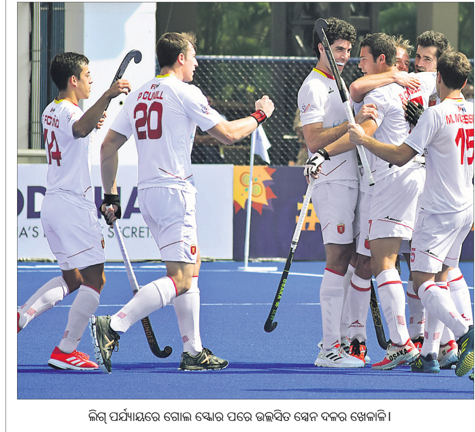
ଲିଗ୍ ପର୍ଯ୍ୟାୟରେ ଗୋଲ ଖେଳି ପରେ ଉଲ୍ଲାସରେ ସେନ ଦଳର ଖେଳାଳି ।