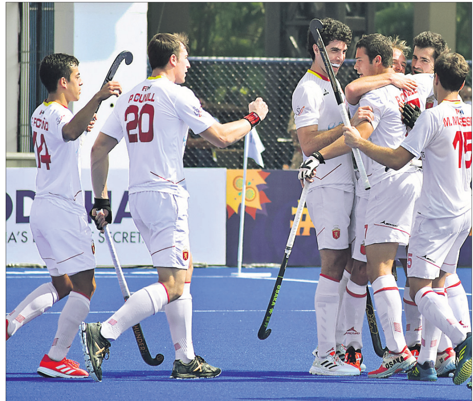
ଲିଗ୍ ପର୍ଯ୍ୟାୟରେ ଗୋଲ ଖୋର ପରେ ଉଲ୍ଲାସରେ ସେନ ଦଳର ଖେଳାଳି ।