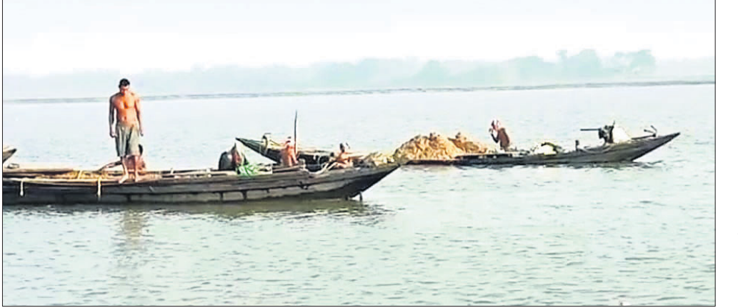
ଦେଶୀ ଡଙ୍ଗା ସାହାଯ୍ୟରେ ନଦୀରୁ ବାଲି ଚୋରି କରାଯାଉଛି।

ପୁରସ୍କରେଖା ନଦୀପାରରେ ୩୦ରୁ ଅଧିକ ବାଲି ଉସ୍ତା ସରକାର ନିଲାମ ଦେଇ କୋଟି କୋଟି ରାଜସ୍ୱ ପାଉଥିଲେ ମଧ୍ୟ ବହୁ ଉସ୍ତା ଏବେ ମାପିଆଳ କବଳରେ ରହିଛି। ବିଶେଷ କରି ବାଲିଆପାଳ ତହସିଲ ବିଶ୍ୱପୁର ପଞ୍ଚାୟତର ଲକ୍ଷ୍ମୀନାଥ ନଦୀକୂଳରେ ମାପିଆଳ ନଦୀ ଦିନରାତି ବାଲି ଚୋରି କରି ଶହ ଶହ ଦେଶୀ ଡଙ୍ଗାରେ ନିଆଯାଉଛି। ଏହି ବାଲି ବୋହେଇ ଡଙ୍ଗା ଭୋଗରାଇ ଲକ୍ଷ୍ମୀନାଥ ପରେ ସେଠାରେ ବାଲି ଅନଲୋଡ଼ କରାଯାଉଛି। ପରେ ଏହି ଚୋରାବାଲିକୁ