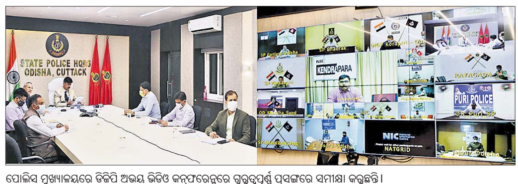
ପୋଲିସ୍ ପୁଞ୍ଜାଳୟରେ ଡିଜିଟାଲ ଡିଭିଓ କମ୍ପରେନ୍ସରେ ଗୁରୁତ୍ଵପୂର୍ଣ୍ଣ ପ୍ରସଙ୍ଗରେ ସମୀକ୍ଷା କରୁଛନ୍ତି।