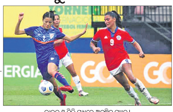
ଭାରତ ଓ ଚିଲି ମଧ୍ୟରେ ଅନୁଷ୍ଠିତ ମ୍ୟାଚ୍।

ବାଂଲାଦେଶ ବିପକ୍ଷ ପ୍ରଥମ ଟେଷ୍ଟ ମ୍ୟାଚ୍ରେ ଭ୍ରମଣକାରୀ ପାକିସ୍ତାନ ପ୍ରଥମ ଦିନିକିରେ ୪୪ ରନ ପଛରେ ପଡ଼ିଥିଲେ ମଧ୍ୟ ପ୍ରତ୍ୟାବର୍ତ୍ତନ କରି ବିଜୟ ସମ୍ଭାବନା ସୃଷ୍ଟି କରିଛି। ପ୍ରଥମ ଦିନିକିରେ ବାଂଲାଦେଶ ୩୩୦ ରନ ଜବାବରେ ପାକିସ୍ତାନ ୨୮୬ ରନ କରି ଅଲଆଉଟ୍ ହୋଇଥିଲା। ଦ୍ୱିତୀୟ ଦିନିକି ଆରମ୍ଭ କରି ବାଂଲାଦେଶ ୧୫୬ ରନରେ ଅଲଆଉଟ୍ ହେବା ପରେ ପାକିସ୍ତାନ ସମ୍ପୂର୍ଣ୍ଣରେ ୨୦୨ ରନ ବିଜୟ ଲକ୍ଷ୍ୟ ଧାର୍ଯ୍ୟ ହୋଇଛି। ଜବାବରେ ଦ୍ୱିତୀୟ ଦିନିକି ଆରମ୍ଭ କରି ପାକିସ୍ତାନ ସୋମବାର ଚତୁର୍ଥ ଦିବସ ଖେଳ ଶେଷ ସୁଦ୍ଧା ୩୩୦ ଓଭରରେ ଦିନାକ୍ଷତିରେ ୧୦୯ ରନ ସଂଗ୍ରହ କରିଛି। ମ୍ୟାଚ୍ ଆଉ ଗୋଟିଏ ଦିନ ବାକି ଥିବା ବେଳେ ପାକିସ୍ତାନ ୧୦ ଉଇକେଟ ହାସଲ କରି ବିଜୟ ପାଇଁ ଆଉ ୯୩ ରନ ଆବଶ୍ୟକ କରୁଛି। ଷ୍ଟ୍ର ଅପସାରଣ ବେଳକୁ