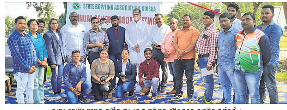
ରାଜ୍ୟ ବୋଲିଂ ସଂଘର ବାର୍ଷିକ ସାଧାରଣ ପରିଷଦ ବୈଠକରେ ଉପସ୍ଥିତ କର୍ମକର୍ତ୍ତା।

ହୋଇଛନ୍ତି। ସେ ପାକିସ୍ତାନ କିମ୍ବଦନ୍ତୀ ଦୁଇ ଦିନିକି ଅଧିନିତ ଆକ୍ରମ (୪୧୪)କୁ ମଧ୍ୟ ଅତିକ୍ରମ କରିଥିଲେ। ଟେଷ୍ଟ ଫର୍ମାଟରେ ଶ୍ରୀଲଙ୍କା କିମ୍ବଦନ୍ତୀ ସିନର ପୁଥୁଆ ପୁରୁଲିଧାନ ସର୍ବାଧିକ ୮୦୦ ଉଇକେଟ ହାସଲ କରି ଶ୍ରୀଲଙ୍କାରେ ରହିଥିବା ବେଳେ ଅଷ୍ଟ୍ରେଲିଆର ଶେର୍ ଷ୍ଟ୍ରିକ୍ ୭୦୮ ଉଇକେଟ ନେଇ ଦ୍ୱିତୀୟ ସ୍ଥାନରେ ରହିଛନ୍ତି। ଅଧିକ କ୍ରମରେ ୬୧୯ ଉଇକେଟ ହାସଲ କରି ଶ୍ରୀଲଙ୍କାରେ ରହିଛନ୍ତି। ଦ୍ୱିତୀୟ ସ୍ଥାନରେ ରହିଛନ୍ତି।