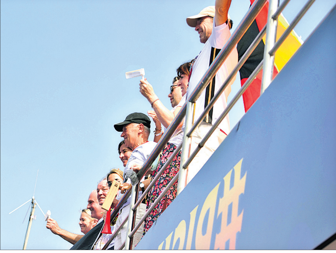
ଜର୍ମାନୀ ସମର୍ଥକମାନେ ନିଜ ଗାତାୟ ଦଳକୁ ଉତ୍ସାହିତ କରୁଛନ୍ତି ।