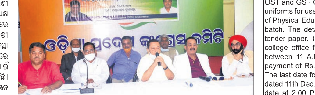
ପ୍ରଦେଶ କିଷାନ କଂଗ୍ରେସ ରାଜ୍ୟ କାର୍ଯ୍ୟକାରୀଣା ବୈଠକରେ ଭାଜପା ବିଧାନସଭାରେ ବିରୋଧୀଙ୍କୁ ଘେରିବାକୁ ପିଏମ୍‌ଏଫ୍‌ଇ ଅସ୍ତ୍ର ବ୍ୟବହାର କରିବାକୁ ଚେଷ୍ଟା କରାଯାଇଛି ।

ପ୍ରଦେଶ କିଷାନ କଂଗ୍ରେସ ରାଜ୍ୟ କାର୍ଯ୍ୟକାରୀଣା ବୈଠକ ବୁଧବାର କଂଗ୍ରେସ ଭବନରେ ଅଧିକାରୀଙ୍କୁ ଲୁଚାଇବାକୁ ବିଜେଡିର ନୂଆ ନାଟକ: ଭାଜପା