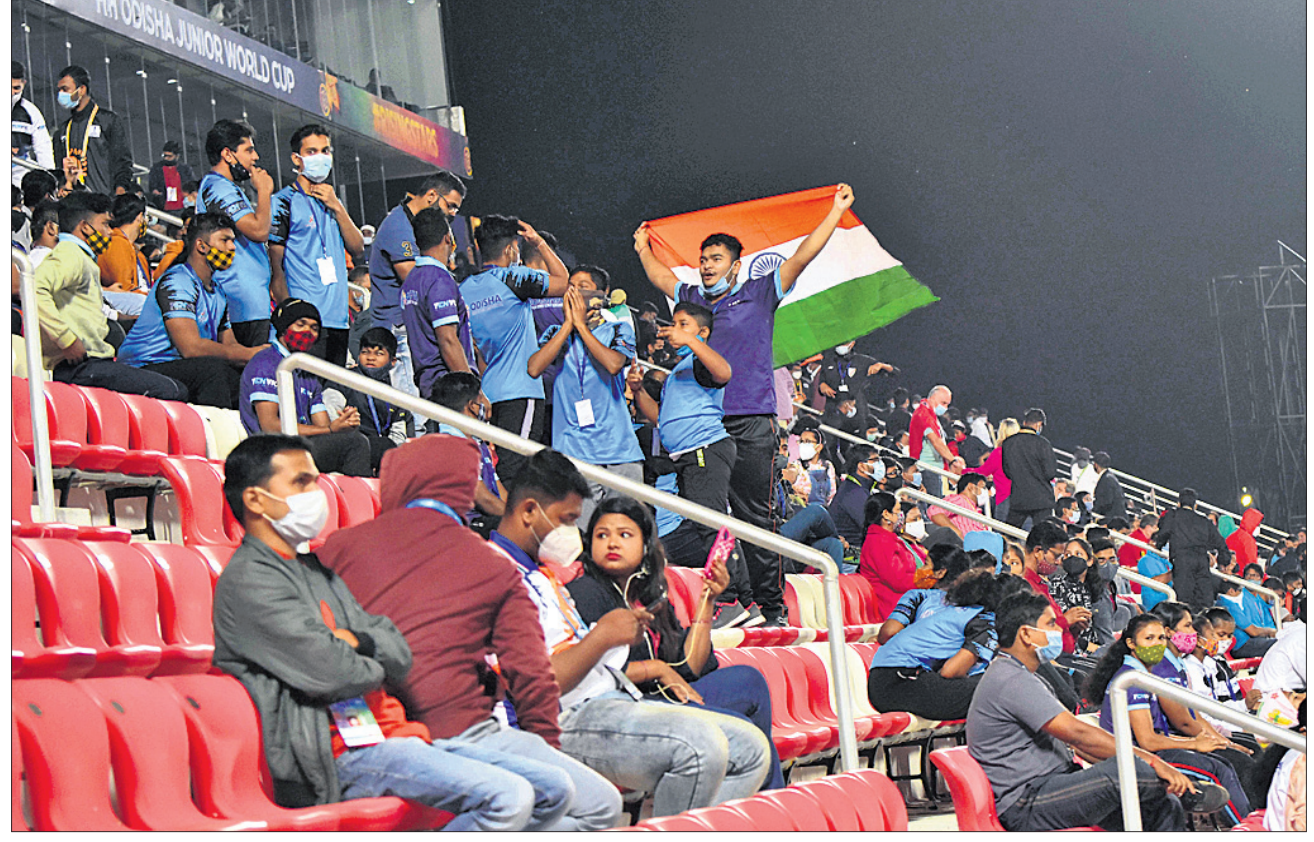
ବେଲଜିୟମ ବିପକ୍ଷ କ୍ୱାର୍ଟର ଫାଇନାଲ ଅବସରରେ କଳିଙ୍ଗ ଷ୍ଟାଡ଼ିୟମର ଖୁସିଖୁସି ଦର୍ଶକଙ୍କ ମ୍ୟାଚର ମଜା ନେଉଛନ୍ତି ।

ନିର୍ଦ୍ଧାରିତ ସମୟରେ ଫଳାଫଳ ନ ମିଳିବାରୁ ଶୁଭ ଆରମ୍ଭର ସହାୟତା ନିଆଯାଇଥିଲା । ଏଥିରେ ଜର୍ମାନୀ ବିଜୟ ହୋଇଥିଲା । ଏଥିରେ ଉଲ୍ଲାସିତ ଜର୍ମାନୀ ସମର୍ଥକ ଗାତାୟ ପତାକା ଉଡ଼ାଇବା ସହ ପରସ୍ପରକୁ ଆଲିଙ୍ଗନ କରି ଖୁସି ମନାଉଥିବା ଦେଖିବାକୁ ମିଳିଥିଲା । ଶ୍ରେୟକୁ ହରାଇ ଜର୍ମାନୀ ସେମି ଫାଇନାଲରେ ପ୍ରବେଶ କରିଥିଲା ।