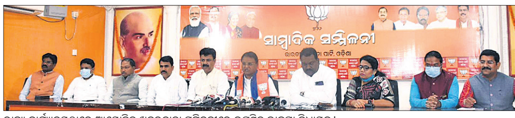
ରାଜ୍ୟ କାର୍ଯ୍ୟାଳୟରେ ଆୟୋଜିତ ଖବରଦାତା ସମ୍ମିଳନୀରେ ଭାଜପା ବିଧାନସଭାରେ ବିରୋଧୀଙ୍କୁ ଘେରିବାକୁ ପିଏମ୍‌ଏଫ୍‌ଇ ଅସ୍ତ୍ର ବ୍ୟବହାର କରିବାକୁ ଚେଷ୍ଟା କରାଯାଇଛି ।

ପ୍ରଧାନମନ୍ତ୍ରୀ ଆବାସ ଯୋଜନାରେ ଓଡ଼ିଶା ପ୍ରତି ଅବିରା ବିରୋଧରେ ବିଜେଡି ବିଧାନସଭାରେ ବିରୋଧୀଙ୍କୁ ଘେରିବାକୁ ପିଏମ୍‌ଏଫ୍‌ଇ ଅସ୍ତ୍ର ବ୍ୟବହାର କରିବାକୁ ଚେଷ୍ଟା କରିବାକୁ ଭାଜପା ପକ୍ଷରୁ ଚେଷ୍ଟା କରାଯାଇଛି । ଭାଜପା ରାଜ୍ୟ କାର୍ଯ୍ୟାଳୟରେ ବୁଧବାର ଆୟୋଜିତ ଖବରଦାତା ସମ୍ମିଳନୀରେ ବିରୋଧୀଙ୍କୁ ଘେରିବାକୁ ପିଏମ୍‌ଏଫ୍‌ଇ ଅସ୍ତ୍ର ବ୍ୟବହାର କରିବାକୁ ଚେଷ୍ଟା କରାଯାଇଛି ।