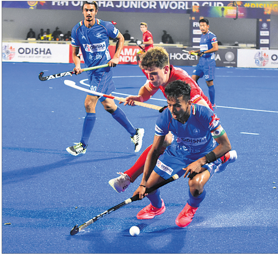
ଭାରତ ଓ ବେଲଜିୟମ କ୍ୱାର୍ଟର ଫାଇନାଲ ମ୍ୟାଚର ଏକ ସଂଘର୍ଷପୂର୍ଣ୍ଣ ମୁହୂର୍ତ୍ତ ।