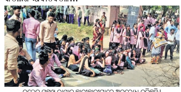
କଲେଜ ସମ୍ମୁଖ ରାସ୍ତାକୁ ଛାତ୍ରଛାତ୍ରୀମାନେ ଅବରୋଧ କରିଛନ୍ତି ।

କିମ୍ବା ନାଗରିକଙ୍କ ଫୁଲ ଆକ୍ରମଣ ହୋଇଥିବା ନେଇ କଂଗ୍ରେସ ଏମ୍ପି କେ.ସି. ବେଣ୍ଟେଗୋପାଳ ପ୍ରଶ୍ନ କରିଥିବାବେଳେ ସ୍ୱରାଷ୍ଟ୍ର ରାଷ୍ଟ୍ରମନ୍ତ୍ରୀ ନିତ୍ୟାନନ୍ଦ ରାୟ ଏଭଳି ଅଭିଯୋଗକୁ ଖଣ୍ଡନ କରିଥିଲେ ।