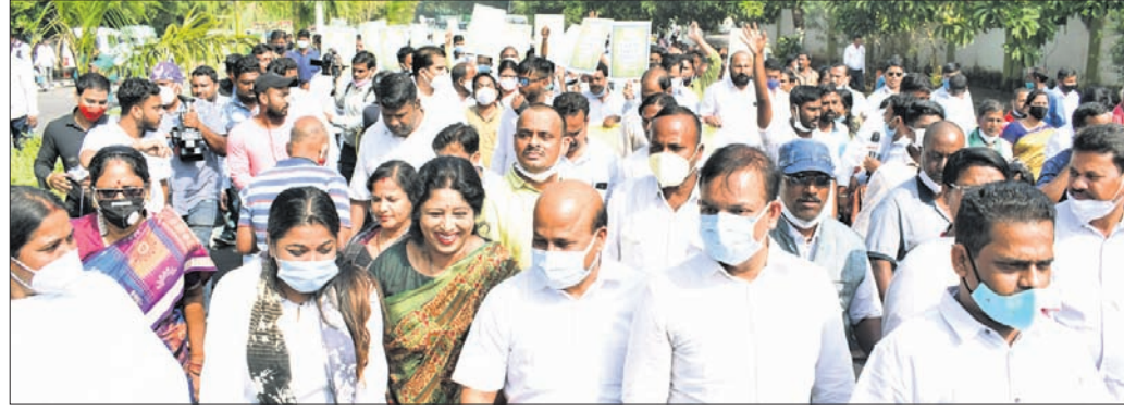
ପ୍ରଧାନମନ୍ତ୍ରୀ ଆବାସ ଯୋଜନାରେ ଓଡ଼ିଶା ପ୍ରତି ଅବିରା ବିରୋଧରେ ବିଜେଡି ବିଧାନସଭାରେ ବୁଧବାର ରାଜ୍ୟପାଳଙ୍କୁ ସ୍ମାରକପତ୍ର ପ୍ରଦାନ ପୂର୍ବରୁ ବିରୋଧ ପ୍ରଦର୍ଶନ କରୁଛନ୍ତି ।

■ ରାଜ୍ୟପାଳଙ୍କୁ ଫେରାଦ ହେଲା ବିଜେଡି ■ ଦୋଷ ଲୁଚାଇବାକୁ ବିଜେଡିର ନୂଆ ନାଟକ: ଭାଜପା