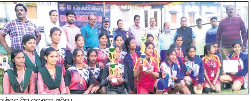
ଚାମ୍ପିୟନ ଚିତ୍ତ ରହଣରେ ଅତିଥି।