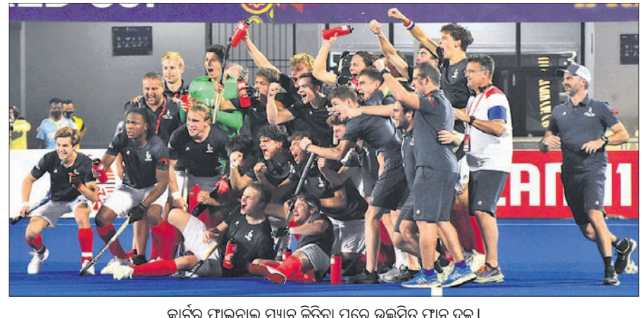
ଭାରତର ଫାଇନାଲ ମ୍ୟାଚ ଜିତିବା ପରେ ଉଲ୍ଲାସିତ ଫ୍ରାନ୍ସ ଦଳ ।