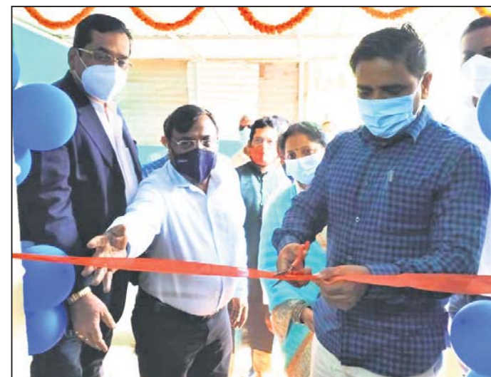
ଜିଲ୍ଲାପାଳ ସ୍ୱାସ୍ଥ୍ୟ ଯାଞ୍ଚ କେନ୍ଦ୍ର ଉଦ୍ଘାଟନ କରୁଛନ୍ତି।