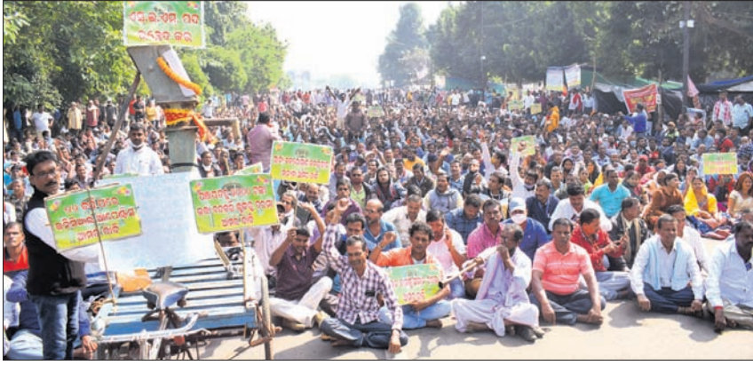
ପଞ୍ଚାୟତ ବଦଳରେ ବୃକ୍ଷର ଦରମା, ଏସ୍‌ଏମ୍‌ଏସ୍ ପଦ ଉଲ୍ଲେଖ କରି ଗ୍ରାମୀଣ ଜଳଯୋଗ୍ୟ କର୍ମଚାରୀ ମାନ୍ୟତା ଆଦି ଦାବି ନେଇ ଏସ୍‌ଏମ୍‌ଏସ୍ ଓ ଗ୍ରାମୀଣ ଜଳଯୋଗ୍ୟ କର୍ମଚାରୀ ମହାସଭା ପକ୍ଷରୁ ରୁଧିରୀର ବିଧାନସଭା ସମ୍ମୁଖରେ ଧାରଣା।