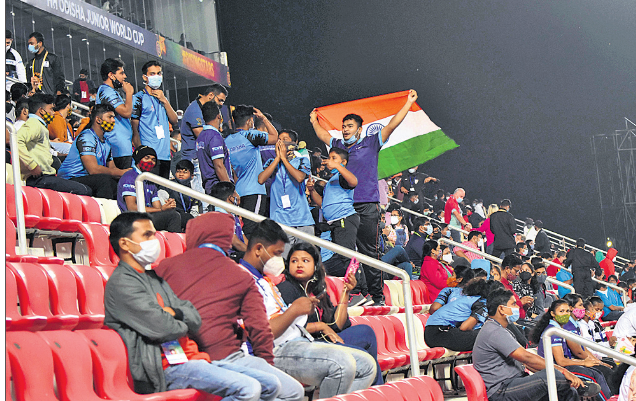
ବେଲଜିୟମ ବିପକ୍ଷ କ୍ୱାର୍ଟର ଫାଇନାଲ ଅବସରରେ କଳିଙ୍ଗ ଷ୍ଟାଡ଼ିୟମରେ ଦୃଶ୍ୟସ୍ପଷ୍ଟରେ ଦର୍ଶକ ମ୍ୟାଚର ମଜା ନେଉଛନ୍ତି।

ନିର୍ଦ୍ଧାରିତ ସମୟରେ ଫଳାଫଳ ନ ମିଳିବାରୁ ଶୁଭ ଆରମ୍ଭର ସହାୟକ ନିଆଯାଇଥିଲା। ଏଥିରେ ଜର୍ମାନୀ ବିଜୟ ହୋଇଥିଲା। ଏଥିରେ ଉଲ୍ଲାସିତ ଜର୍ମାନୀ ସମର୍ଥକ ଗାଡାୟ ପତାକା ଉଡ଼ାଇବା ସହ ପରସ୍ପରକୁ ଆଲିଙ୍ଗନ କରି ଖୁସି ମନାଉଥିବା ଦେଖିବାକୁ ମିଳିଥିଲା। ସ୍ପେନକୁ ହରାଇ ଜର୍ମାନୀ ସେମି ଫାଇନାଲରେ ପ୍ରବେଶ କରିଥିଲା।