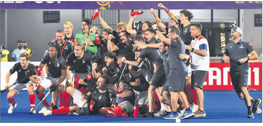
କ୍ୱାର୍ଟର ଫାଇନାଲ ମ୍ୟାଚ ଜିତିବା ପରେ ଉଲ୍ଲାସିତ ଫ୍ରାନ୍ସ ଦଳ।

କଳିଙ୍ଗ ଷ୍ଟାଡ଼ିୟମରେ ଚାଲିଥିବା ଏସିଆଇଏଚ୍ ଓଡ଼ିଶା ହକି ପୁରୁଷ ଲୁନିୟର ବିଶ୍ୱକପର ସେମିଫାଇନାଲରେ ପ୍ରବେଶ କରିଛନ୍ତି। ପ୍ରଥମ କ୍ୱାର୍ଟର ଫାଇନାଲରେ ଶୁଭ ଆରମ୍ଭ ୩-୧ ଗୋଲରେ ହେବାରୁ ଜର୍ମାନୀ, ଦ୍ୱିତୀୟ କ୍ୱାର୍ଟରରେ ଆର୍ଜେଣ୍ଟିନା ୨-୧ ଗୋଲରେ ନେତରଲାଣ୍ଡ ଏବଂ ତୃତୀୟ କ୍ୱାର୍ଟରରେ ଫ୍ରାନ୍ସ ୪-୦ ଗୋଲରେ ମାଲେସିଆକୁ ହରାଇ ସେମିଫାଇନାଲରେ ପ୍ରବେଶ କରିଛନ୍ତି। ଡିସେମ୍ବର ୩ରେ ପ୍ରଥମ ସେମିଫାଇନାଲରେ ଫ୍ରାନ୍ସ ଓ ଆର୍ଜେଣ୍ଟିନା ମଧ୍ୟରେ ଫାଇନାଲ ହେବ। ଭୁବନେଶ୍ୱରରେ ଡାକ୍ତରୀ