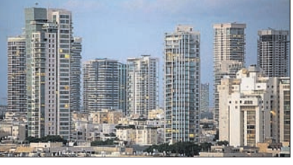
କୋପେନହାଗେନ୍, ୯ମରେ ଲକ୍ଷ ଆଖେଲ୍ୟ ଏବଂ ଓସାକା ୧୦ମ ସ୍ଥାନରେ ରହିଛି। ଗତ ସର୍ଭେରେ ପ୍ୟାରିସ୍, ଚୁଲିଓ ଏବଂ ହୁଏଟ୍ ସହର ଏକାଠି ପ୍ରଥମ ସ୍ଥାନରେ ରହିଥିଲେ। ମାଲ୍ ପରିବହନ ଓ ଦ୍ରବ୍ୟଗୁଡ଼ିକର ଦରଦାମ ବୃଦ୍ଧି ଯୋଗୁ ଚଳିତ ବର୍ଷ ଅଗଷ୍ଟ ଏବଂ ସେପ୍ଟେମ୍ବରରେ ତାମ ସଂଗ୍ରହ କରାଯାଇଥିଲା। ବିଭିନ୍ନ ସହରରେ ସ୍ଥାନୀୟ ମୁଦ୍ରାରେ ଦରଦାମ ହାରାହାରି ୫.୫ ପ୍ରତିଶତ ବୃଦ୍ଧିପାଇଥିବା ଜଣାଯାଇଛି। ତେବେ ତାମାସ୍ତକ୍ ସହରର ପାଇଁ ସବୁ ଶକ୍ତି ସହର ବୋଲି ସର୍ଭେରୁ ଜଣାପଡ଼ିଛି।

ଲକ୍ଷନ, ୧୧୧୨ ପୁରୀରୁ ବୃଦ୍ଧି ଯୋଗୁ ସିଙ୍ଗାପୁର, ଲକ୍ଷନ ଏବଂ ହୁଏଟ୍ ପରି ସହରଗୁଡ଼ିକୁ ପଛରେ ଛାଡ଼ି ଏଲନ ମସ୍କ ଆଦିର ସହର ଦୁନିଆର ମହଙ୍ଗା ସହର ତାଲିକାର ଶୀର୍ଷରେ ରହିଛି। ଇକୋନୋମିକ୍ ଇଣ୍ଡେକ୍ସରେ ସୁନିର୍ (ଇଆଇଏ) ପକ୍ଷରୁ ରୁଧିବାର ପ୍ରକାଶିତ ଏକ ରୋବାଲ୍ ସର୍ଭେରେ ପ୍ରଥମ ଥର ପାଇଁ ତେଲ୍ ଆଦିର ଦୁନିଆର ସବୁ ମହଙ୍ଗା ସହର ହୋଇଛି। ଟପ୍ ୧୦ ସହର ମଧ୍ୟରେ ଭାରତର କୌଣସି ସହର ସ୍ଥାନିତ ହୋଇନାହିଁ। ୧୭ମଟି ସହରରେ ସାମଗ୍ରୀ ଏବଂ ସେବାରେ ମୂଲ୍ୟ ଆମେରିକୀୟ ଡଲାରରେ ମପାଯାଇ ଖୁବ୍ ଉଚ୍ଚ ଲକ୍ଷ ଅର୍ଥ ଲାଭି ଲକ୍ଷେକ ପ୍ରକାଶ କରାଯାଇଥିଲା। ତାଲିକାରେ ପ୍ୟାରିସ୍ ଏବଂ ହଙ୍ଗାରିର ବୁଡାପେଷ୍ଟ ହିଟ୍ ହୋଇଛି। ଏହା ତଳକୁ ଚୁଲିଓ ଏବଂ ହୁଏଟ୍ ରହିଛି। ସ୍ୱାୟତ୍ତ ଶକ୍ତିରେ, କେନ୍ଦ୍ରୀୟ ଖନି, ଗମରେ, ଗମରେ