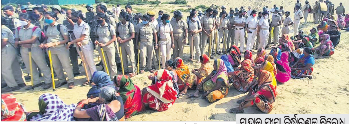
ମାହାଳ ସାମା ନିର୍ଦ୍ଧାରଣ ସମୟରେ ପୋଲିସ ଫୋର୍ସ ଓ ଡିକିଆ ଗ୍ରାମବାସୀ ମୁହାଁମୁହିଁ ଅବସ୍ଥାରେ।

କୁଜଙ୍ଗ, ୧୧୧୨ (ଡି.ଏନ.ଏ.): କରୋନା ସଂକ୍ରମଣ ଜିଲାର ଏରସମା ତହସିଲ ଅନ୍ତର୍ଗତ ଡିକିଆ ଗ୍ରାମର ଦୁଇ ପତା ପାଟଣା ଓ ମାହାଳକୁ ନୂତନ ରାଜ୍ୟ ଗ୍ରାମର ମାନ୍ୟତା ମିଳିଛି। ଏହାକୁ ଡିକିଆ ଗ୍ରାମବାସୀଙ୍କ ପକ୍ଷରୁ ଚାପି ବିରୋଧ କରାଯାଇ ଆସୁଛି। ଏହିସମ୍ପର୍କରେ ରୁଧିରୀର ତହସିଲ ପ୍ରଶାସନ ପୋଲିସ ଫୋର୍ସ ସହ ଜଟାଧାର ମୁହାଣ ନିକଟ ସମୁଦ୍ର କୁଳ ପଶୁ ମାହାଳ ସାମା ନିର୍ଦ୍ଧାରଣ କାର୍ଯ୍ୟ ଆରମ୍ଭ କରିଥିଲା। ହେଲେ ଡିକିଆ ଗ୍ରାମର ଶତାଧିକ ମହିଳାପୁରୁଷ ପଶୁଆରରେ ଯାଇ କର୍ତ୍ତବ୍ୟା ତିକିରା ନିକଟରେ ପହଞ୍ଚି ସାମା ନିର୍ଦ୍ଧାରଣ ପ୍ରକ୍ରିୟାକୁ ବିରୋଧ କରିଥିଲେ। ଫଳରେ ପୋଲିସ ଓ ଗ୍ରାମବାସୀ ମୁହାଁମୁହିଁ ହୋଇଥିଲେ। କିଛି ସମୟ ପାଇଁ ପୋଲିସ ଓ ଉପସ୍ଥିତ ମହିଳାଙ୍କ ମଧ୍ୟରେ ଧସାଧସ ହୋଇଥିଲା। ପରେ