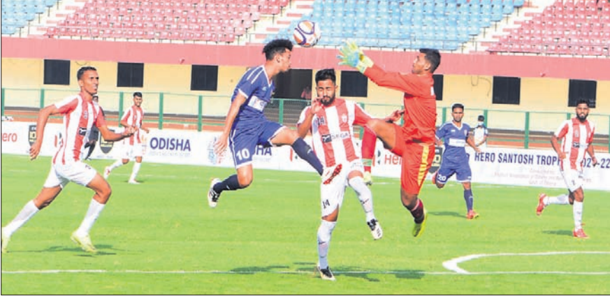
ଓଡ଼ିଶା-ବିହାର ମ୍ୟାଚର ଏକ ସଂଘର୍ଷପୂର୍ଣ୍ଣ ମୁହୂର୍ତ୍ତ।