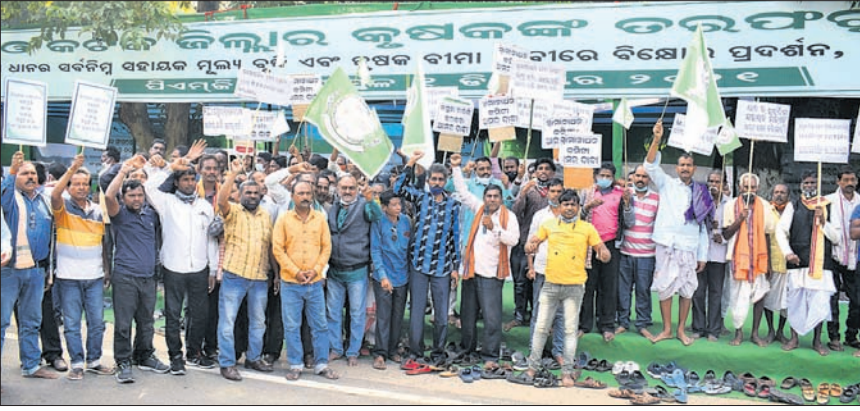
ଧାନର ସର୍ବନିମ୍ନ ସହାୟକ ମୂଲ୍ୟ ବୃଦ୍ଧି, କୃଷକ ବାମା ଲାଗୁ ଆଦି କେତେକ ଦାବି ନେଇ ବରଗଡ଼ ଓ କଟକ ଜିଲାର କୃଷକମାନେ ଭୁବନେଶ୍ୱର ଲୋକସଭା ପରିସରରେ ପିଏମ୍‌ଜି ଧାରଣାସ୍ଥଳରେ ରୁଧିରୀର ବିକ୍ରୟ ପ୍ରଦର୍ଶନ କରୁଛନ୍ତି।