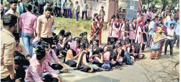
କଲେଜ ସମ୍ମୁଖ ରାସ୍ତାକୁ ଛାତ୍ରଛାତ୍ରୀମାନେ ଅବରୋଧ କରିଛନ୍ତି ।

ସହ ପାଟି କରିଥିଲେ ମଧ୍ୟ ଅପହରଣକାରୀମାନେ କୌଣସି କଥା ଶୁଣି ନ ଥିଲେ । ଶେଷରେ କାରଟି ଛାଡ଼ିଦେଇ କେଜି ଖୁବ୍ଦେଗାରେ ବନ୍ଦୀପକ୍ଷ ଅଭିଯୁକ୍ତ ଚାଲିଯାଇଥିଲା ।