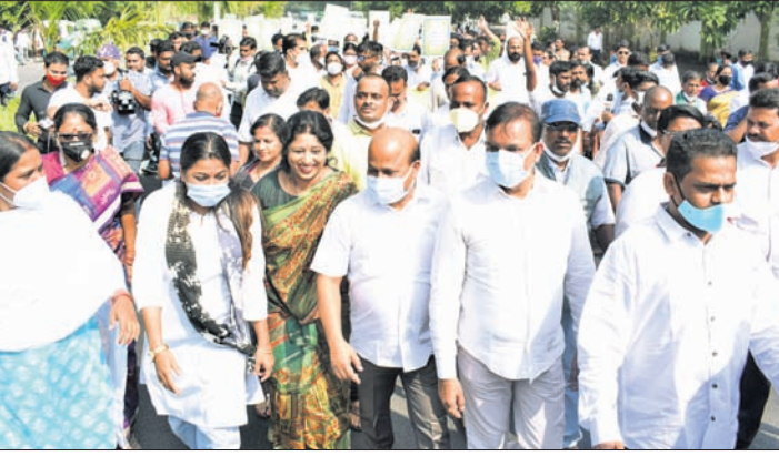
ପ୍ରଧାନମନ୍ତ୍ରୀ ଆବାସ ଯୋଜନାରେ ଓଡ଼ିଶା ପ୍ରତି ଅବହେଳା ବିରୋଧରେ ବିକେଟି ପକ୍ଷରୁ ରୁଧିରୀର ରାଜଭବନ ସମ୍ମୁଖରେ ଧାରଣା। ଏହି ଅବସରରେ ରାଜ୍ୟପାଳଙ୍କୁ ସ୍ମାରକପତ୍ର ପ୍ରଦାନ।