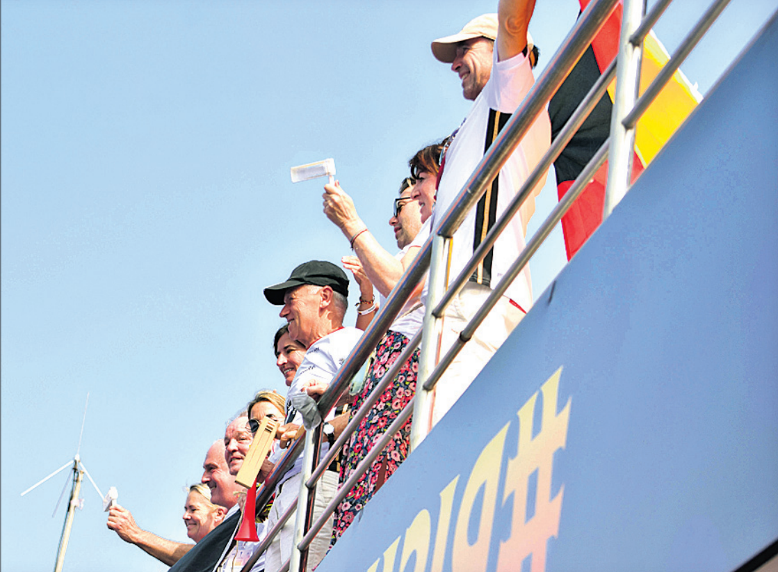
ଜର୍ମାନୀ ସମର୍ଥକମାନେ ନିଜ ଜାତୀୟ ଦଳକୁ ଉତ୍ସାହିତ କରୁଛନ୍ତି।