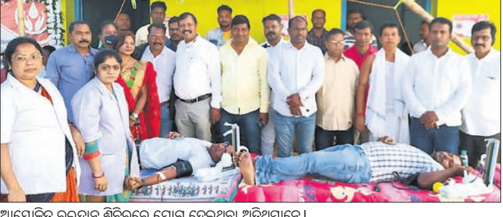
ଆୟୋଜିତ ରତ୍ନଦାନ ଶିବିରରେ ଯୋଗ ଦେଇଥିବା ଅଭିଯୁକ୍ତମାନେ।