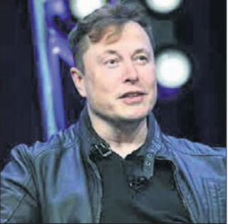
ସପ୍ତାହରେ କାମ କରିବାକୁ ମସ୍କଙ୍କ ପରାମର୍ଶ

ସାନ୍ତପ୍ରାନ୍ତସିଦ୍ଧାନ୍ତ, ୧୧୧୨ ବୈଶ୍ୱିକ ମାନ୍ୟତା ଯୋଗୁ ଆମେରିକୀୟ କମ୍ପାନୀ ସ୍ୱେଚ୍ଛା ଦେବାଲିଆ ହୋଇପାରେ ବୋଲି ଏହାର ସିଲ୍ ଓ ଏଲନ ମସ୍କ କହିଛନ୍ତି। ତେଣୁ ଜରୁରୀ କାମ ନ ଥିଲେ କର୍ମଚାରୀମାନେ ସପ୍ତାହରେ ମଧ୍ୟ କାମ କରି ଉପାଦାନ ବଦଳାଇବାକୁ ମଧ୍ୟ ସେମାନଙ୍କୁ ମେଲ୍ କରିଛନ୍ତି। ଆସନ୍ତା ବର୍ଷ ହେବାକୁ ଥିବା କମ୍ପାନୀର ନୂଆ ସ୍ୱାରଣିୟ ରକେଟର ଫ୍ଲାଜଟ ଖର୍ଚ୍ଚକୁ ଦୃଷ୍ଟିରେ ରଖି ଉପାଦାନ ହ୍ରାସ ପାଇଲେ କମ୍ପାନୀ କ୍ଷତିରେ ପଡ଼ିବ ବୋଲି ସେ ଆଶଙ୍କା କରିଛନ୍ତି। ସାଚେଲାଇଟ୍ ଏଥିରେ କ୍ଷତି ମଧ୍ୟ ସହିବାକୁ ପଡ଼ିଛି। ତନ୍ତ୍ର ଏବଂ ମଙ୍ଗଳକୁ ସ୍ୱାରଣିୟ ଯୋଗେ ଲୋକଙ୍କୁ ବୁଲାଇନେବାକୁ ମଧ୍ୟକ୍ଷ ଯୋଜନା ରହିଛି। ତେବେ ସ୍ୱାରଣିୟ ପ୍ରମୁଖ ଅଂଶ ରାୟର ଇଞ୍ଜିନ୍ ଉପାଦାନରେ ସ୍ୱେଚ୍ଛାକୁ ସମସ୍ୟାର ସାମନା କରିବାକୁ ପଡ଼ିଛି। ଯଦି ଆବଶ୍ୟକ ପରିମାଣରେ ଭରସାଯୋଗ୍ୟ ରାୟର ଇଞ୍ଜିନ୍ ନିର୍ମାଣ ନ ହୁଏ ତେବେ ସ୍ୱାରଣିକ୍ ସାଚେଲାଇଟ୍ ଚିପ୍ରେ ଉଡ଼ାଣ ହୋଇପାରିବି ବୋଲି ମସ୍କ କହିଛନ୍ତି। ଆସନ୍ତା କାର୍ତ୍ତିକରେ ସ୍ୱାରଣିୟକୁ ପୃଥିବୀ କକ୍ଷପଥରେ ସ୍ଥାନିତ କରାଯିବ ବୋଲି ସେ କିଛି ଦିନ ପୂର୍ବରୁ ଘୋଷଣା କରିଥିଲେ।