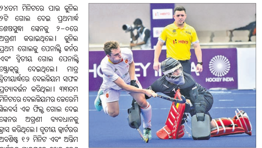
ସ୍ୱେଡେନ୍-ବେଲ୍ଜିୟମ ମ୍ୟାଚର ଏକ ସଫଳତାପୂର୍ଣ୍ଣ ମୁହୂର୍ତ୍ତ।

ଭୁବନେଶ୍ୱର, ୩।୧୨ (କ୍ରୀଡ଼ା ପ୍ରତିନିଧି): କଳିଙ୍ଗ ଷ୍ଟାଡ଼ିୟମରେ ଚାଲିଥିବା ଏସିଆଇଏସ୍ ଓଡ଼ିଶା ହକି ପୁରୁଷ ଭୁବନେଶ୍ୱର ବିଶ୍ୱକପର ଶୁଭକାର ଅନୁଷ୍ଠିତ ଏକ କ୍ୱାର୍ଟରଫାଇନାଲ ମ୍ୟାଚରେ ଶୁଭ ଆରମ୍ଭରେ ବେଲ୍ଜିୟମ ୪-୩ ଗୋଲରେ ସ୍ୱେଡେନ୍କୁ ପରାସ୍ତ କରିଛି। ନିର୍ଦ୍ଧାରିତ ସମୟରେ ଖେଳ ୨-୨ ଗୋଲରେ ବରାବର ରହିଥିଲା। ବିଜୟୀ ବେଲ୍ଜିୟମ ୫-୨ ଗୋଲରେ ସ୍ୱେଡେନ୍କୁ ପରାସ୍ତ କରିଛି। ନିର୍ଦ୍ଧାରିତ ସମୟରେ ଖେଳ ୨-୨ ଗୋଲରେ ବରାବର ରହିଥିଲା। ବିଜୟୀ ବେଲ୍ଜିୟମ ୫-୨ ଗୋଲରେ ସ୍ୱେଡେନ୍କୁ ପରାସ୍ତ କରିଛି। ନିର୍ଦ୍ଧାରିତ ସମୟରେ ଖେଳ ୨-୨ ଗୋଲରେ ବରାବର ରହିଥିଲା। ବିଜୟୀ ବେଲ୍ଜିୟମ ୫-୨ ଗୋଲରେ ସ୍ୱେଡେନ୍କୁ ପରାସ୍ତ କରିଛି।