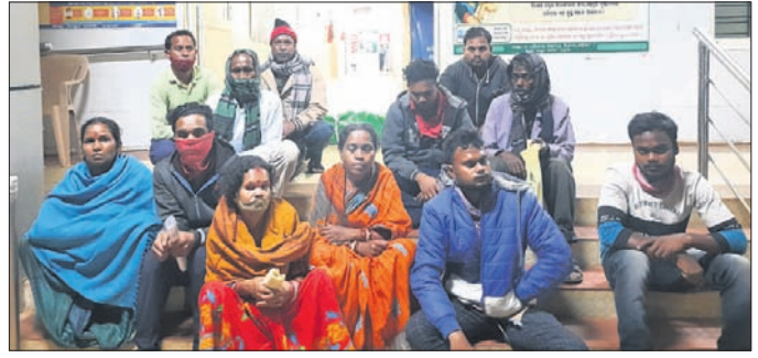
ମୃତଦେହ ରଖି ପରିବାର ଲୋକେ ଧାରଣାରେ ବସିଛନ୍ତି।

ଖୋର୍ଦ୍ଧା ଜିଲ୍ଲା ମୁଖ୍ୟ ଚିକିତ୍ସାଳୟରେ ଚିକିତ୍ସା ଅବହେଳାକୁ ଜଣେ ମହିଳାଙ୍କ ମୃତ୍ୟୁ ଘଟିଥିବା ଅଭିଯୋଗ ହୋଇଛି।