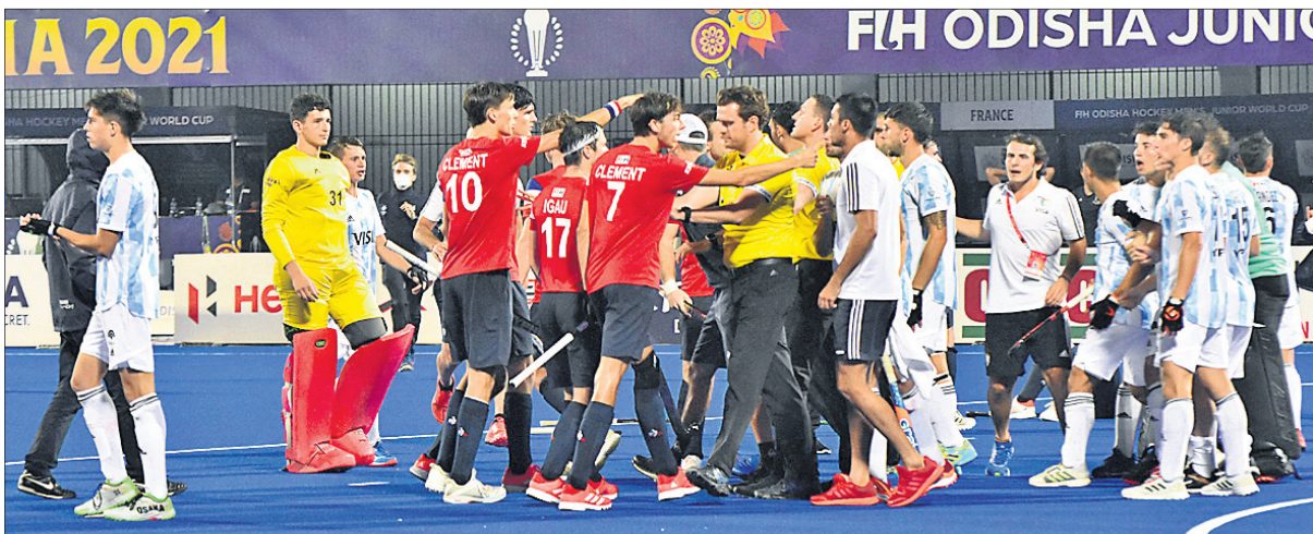
କଳିଙ୍ଗ ଷ୍ଟାଡ଼ିୟମରେ ଚାଲିଥିବା ଭୁବନେଶ୍ୱର ହକି ବିଶ୍ୱକପର ଶୁଭକାର ଅନୁଷ୍ଠିତ ପ୍ରଥମ ସେମିଫାଇନାଲ ଶେଷରେ ପ୍ରାରମ୍ଭ ଓ ଆର୍ଜେଣ୍ଟିନା ଖେଳାଳି ମୁହାଁମୁହିଁ।

ପ୍ରବେଶ କରିଥିବା ପ୍ରାରମ୍ଭ ସେମିଫାଇନାଲରେ ମଧ୍ୟ ଭଲ ଖେଳିଥିଲା। ଫାଇନାଲରେ ବେଶ୍ ସଫଳତା ହାସଲ କରିଥିଲା। ୧୮ତମ ମିନିଟରେ ଆର୍ଜେଣ୍ଟିନା ଓ ୪୦ତମ ମିନିଟରେ ପ୍ରାରମ୍ଭ ପେନାଲ୍ଟି କର୍ନର ପାଇଥିଲେ ମଧ୍ୟ ସେଥିରୁ ଫାଇଦା ନେଇ ପାରି ନ ଥିଲେ। ନିର୍ଦ୍ଧାରିତ ସମୟରେ ମ୍ୟାଚ ରୋଲଡାଉନ୍ ହୋଇଥିଲା। ଫାଇନାଲ ପାଇଁ ପେନାଲ୍ଟି ଶୁଭାଭିତରେ ସହାୟତା ନିଆ ଯାଇଥିଲା। ଏହି ପର୍ଯ୍ୟାୟରେ ଆର୍ଜେଣ୍ଟିନା ପକ୍ଷରୁ ପ୍ରାରମ୍ଭଙ୍କୁ ନିର୍ବାସନ କରିବା ପାଇଁ ଚାହୁଁଥିଲେ। ପ୍ରାରମ୍ଭଙ୍କୁ ନିର୍ବାସନ କରିବା ପାଇଁ ଚାହୁଁଥିଲେ। ପ୍ରାରମ୍ଭଙ୍କୁ ନିର୍ବାସନ କରିବା ପାଇଁ ଚାହୁଁଥିଲେ। ପ୍ରାରମ୍ଭଙ୍କୁ ନିର୍ବାସନ କରିବା ପାଇଁ ଚାହୁଁଥିଲେ।