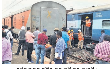
ଦୂରନ୍ଦେ ଏକ୍ସପ୍ରେସ୍ ବରିଷ୍ଠ ମରାମତି କରାଯାଇଛି।

ଧର୍ମଶାଳା/ଚର୍ଚ୍ଚିତା, ୩୧୧୨(ଡି.ଏ.ଏ.) ଯଶୋବନ୍ତପୁର-ସାଞ୍ଜୁ ଦୂରନ୍ଦେ ଏକ୍ସପ୍ରେସ୍ ଏକ ବଡ଼ ଯାତ୍ରୀର ଲାଇନ ଧର୍ମଶାଳା ରୁକ୍ ଅଧୀନ ହରିଦାସପୁର ରେଳଷ୍ଟେସନ ନିକଟରେ ଲାଇନରୁପତ ହୋଇଛି। ଏହି ଦୂରନ୍ଦେ କୋଣାର୍କ ଯାତ୍ରାକ୍ଷତି ହୋଇନାହିଁ। ତେବେ ରେଳଧାରଣା କାର୍ଯ୍ୟ କରୁଥିବା କର୍ମଚାରୀଙ୍କ ଅବହେଳା ପାଇଁ ଦୂରନ୍ଦେ ଘଟିଥିବା ବିବାଦ ପକ୍ଷରୁ ସୂଚନା ଦିଆଯାଇଛି। ତେଣୁ ୩ କର୍ମଚାରୀଙ୍କୁ ନିଲମ୍ବନ କରାଯାଇଛି। ସୂଚନା ମୁତାବକ, ଶୁକ୍ରବାର ପୂର୍ବାହ୍ନ ଏକ୍ସପ୍ରେସ୍ ଗୋଟିଏ ବଡ଼ ଲାଇନରୁପତ ହୋଇଥିଲା। ତେବେ ଚାଳକଙ୍କ ଉପସ୍ଥିତ ରୁହି ଯୋଗୁ ଏକ ବଡ଼ ଦୂରନ୍ଦେ ଟ୍ରେନ୍ଟି ବର୍ତ୍ତମାନ ଲାଇନରୁପତ ହୋଇଥିଲା। ଦୂରନ୍ଦେ ପାର୍ଥକ୍ୟ ବନି ହୋଇଥିବା କୋଣାର୍କ ଯାତ୍ରୀଙ୍କୁ ସୁରକ୍ଷା ଦେବାକୁ ମିଳିଛି। ଖବର ପାଇ ପୂର୍ବରୁ ରେଳଠେ ଖୋର୍ଦ୍ଧା ଡିଭିଜନର ବରିଷ୍ଠ ଅଧିକାରୀ ପହଞ୍ଚି ନ ଜଣାଇ କାମ କରୁଥିବା ଜଣାପଡ଼ିଥିଲା। ପ୍ରାରମ୍ଭିକ ଭାବେ କର୍ତ୍ତବ୍ୟରେ ଅବହେଳା ପାଇଁ ଧାନମଣ୍ଡଳ ବରିଷ୍ଠ ସେକ୍ସନର ସମସ୍ତ ଯାତ୍ରୀ ଆଞ୍ଚଳିକ ଦେଶ କୁମ୍ଭାର ଓ କର୍ମଚାରୀ କୃଷକମାନଙ୍କୁ ମହାପାତ୍ରଙ୍କୁ ନିଲମ୍ବନ କରାଯାଇଛି।