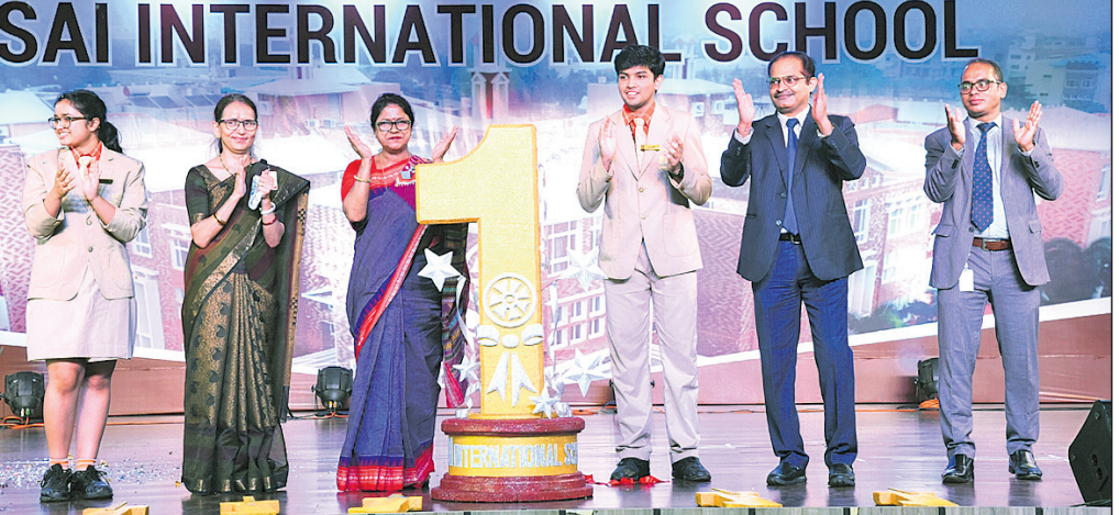
ଭୁବନେଶ୍ୱର, ୩।୧୨ (ବୁଧବୋ)