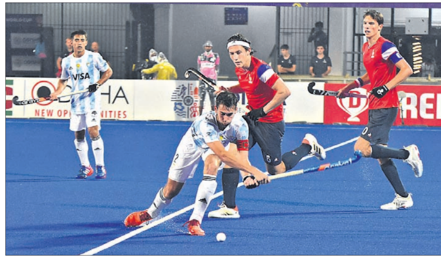
ପ୍ରାରମ୍ଭ ଓ ଆର୍ଜେଣ୍ଟିନା ମଧ୍ୟରେ ଅନୁଷ୍ଠିତ ମ୍ୟାଚ।

ପ୍ରବେଶ କରିଥିବା ପ୍ରାରମ୍ଭ ସେମିଫାଇନାଲରେ ମଧ୍ୟ ଭଲ ଖେଳିଥିଲା। ଫାଇନାଲରେ ବେଶ୍ ସଫଳତା ହାସଲ କରିଥିଲା। ୧୮ତମ ମିନିଟରେ ଆର୍ଜେଣ୍ଟିନା ଓ ୪୦ତମ ମିନିଟରେ ପ୍ରାରମ୍ଭ ପେନାଲ୍ଟି କର୍ନର ପାଇଥିଲେ ମଧ୍ୟ ସେଥିରୁ ଫାଇଦା ନେଇ ପାରି ନ ଥିଲେ। ନିର୍ଦ୍ଧାରିତ ସମୟରେ ମ୍ୟାଚ ରୋଲଡାଉନ୍ ହୋଇଥିଲା। ଫାଇନାଲ ପାଇଁ ପେନାଲ୍ଟି ଶୁଭାଭିତରେ ସହାୟତା ନିଆ ଯାଇଥିଲା। ଏହି ପର୍ଯ୍ୟାୟରେ ଆର୍ଜେଣ୍ଟିନା ପକ୍ଷରୁ ପ୍ରାରମ୍ଭଙ୍କୁ ନିର୍ବାସନ କରିବା ପାଇଁ ଚାହୁଁଥିଲେ। ପ୍ରାରମ୍ଭଙ୍କୁ ନିର୍ବାସନ କରିବା ପାଇଁ ଚାହୁଁଥିଲେ। ପ୍ରାରମ୍ଭଙ୍କୁ ନିର୍ବାସନ କରିବା ପାଇଁ ଚାହୁଁଥିଲେ। ପ୍ରାରମ୍ଭଙ୍କୁ ନିର୍ବାସନ କରିବା ପାଇଁ ଚାହୁଁଥିଲେ।