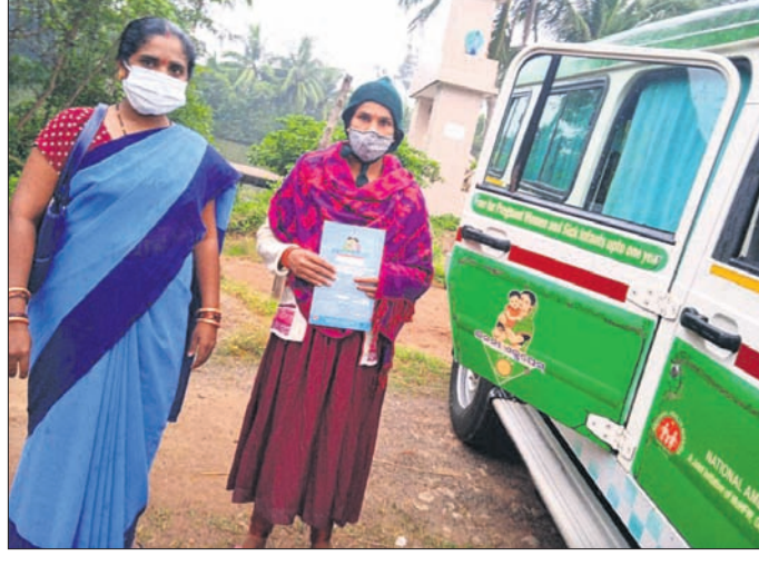
ଜଣେ ଗର୍ଭବତୀଙ୍କୁ ସ୍ଵାସ୍ଥ୍ୟକେନ୍ଦ୍ରକୁ ନିଆଯାଇଛି।

ବାତ୍ୟା ଜଘାମ୍ବ ଲାଗି ବସ୍ତ୍ର ଅଟୋ ସେବା ବନ୍ଦ ଆଜି ଗାନ୍ଧୀଜୀର ଉଡିଓ ରଖିବାକୁ ପରାମର୍ଶ ଛତ୍ରପୁର, ୩୧୨ (ଡି.ଏନ.ଏ.)