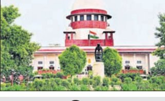
କେ.ଏ.ଏନ୍.ଆର୍. ରାଜ୍ୟକୁ ପ୍ରତିମନ୍ତ୍ରୀଙ୍କ ନିର୍ଦ୍ଦେଶ

ପ୍ରଦୂଷଣ ରୋକିବା ଲାଗି ବାୟୁ ମାନ ପରିଚାଳନା କମିଟି ଦେଇଥିବା ନିର୍ଦ୍ଦେଶାବଳୀ କାର୍ଯ୍ୟକାରୀ କରିବା ନିମନ୍ତେ ପ୍ରତିମନ୍ତ୍ରୀଙ୍କ ଶୁକ୍ରବାର କେନ୍ଦ୍ର ଏବଂ ଜାତୀୟ ରାଜଧାନୀ ଅଞ୍ଚଳ ଅନ୍ତର୍ଗତ ରାଜ୍ୟଗୁଡ଼ିକୁ ନିର୍ଦ୍ଦେଶ ଦେଇଛନ୍ତି। ଜାତୀୟ ରାଜଧାନୀ ଅଞ୍ଚଳ ଓ ଏହାର ପାଖପାଖି ରାଜ୍ୟରେ ବାୟୁ ପ୍ରଦୂଷଣ ରୋକିବା ଲାଗି ବିଭିନ୍ନ ପଦକ୍ଷେପ ନେବାକୁ ବାୟୁ ମାନ ପରିଚାଳନା କମିଶନ ଗୁରୁବାର ପ୍ରସ୍ତାବ ଦେଇଥିଲେ। ପ୍ରଧାନ ବିଚାରପତି ଏନ୍.ଭି. ରମଣାଙ୍କ ଅଧିକାରରେ ଗଠିତ ସ୍ୱତନ୍ତ୍ର ଖଞ୍ଜାପାଠ ଏହାକୁ ଅନୁଧ୍ୟାନ କରିବା ପରେ କେନ୍ଦ୍ର, ଦିଲ୍ଲୀ ଏବଂ ଏନ୍.ପି.ଆର ଅନ୍ତର୍ଗତ ରାଜ୍ୟକୁ ଉଚ୍ଚ ନିର୍ଦ୍ଦେଶାବଳୀ ପାଳନ କରିବାକୁ କହିଛନ୍ତି। କମିଶନ ଦାଖଲ କରିଥିବା ସତ୍ୟପାଠ