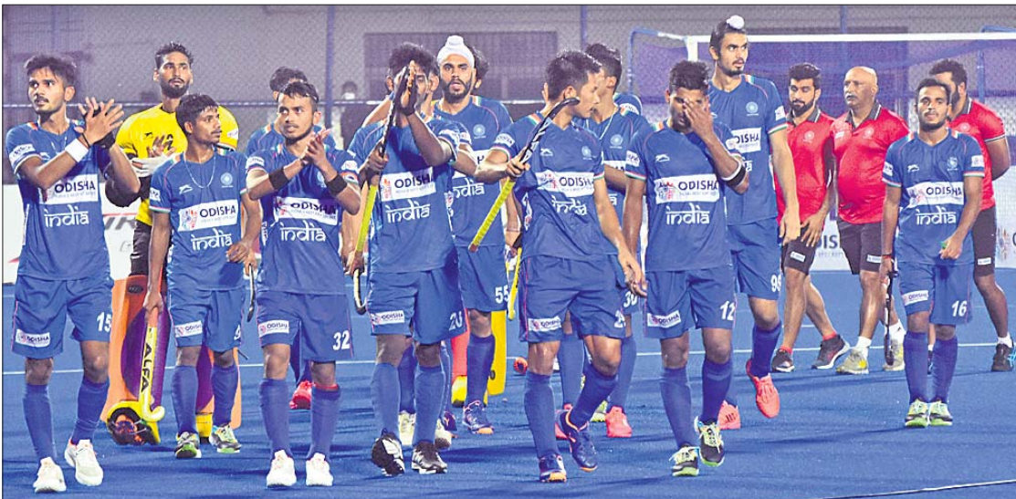
ଜର୍ମାନୀ ବିପକ୍ଷ ମ୍ୟାଚରେ ପରାଜୟ ପରେ ଭାରତୀୟ ଦଳ।

କଲିଙ୍ଗ ଷ୍ଟାଡିୟମରେ ଚାଲିଥିବା ଏଫ୍‌ଆଇଏଚ୍‌ଏ ଓଡ଼ିଶା ହକି ପୁରୁଷ ଜୁନିୟର ବିଶ୍ୱକପ୍‌ର ଶୁକ୍ରବାର ଅନୁଷ୍ଠିତ ଦ୍ୱିତୀୟ ସେମିଫାଇନାଲରେ ଜର୍ମାନୀ ୪-୨ ଗୋଲରେ ଭାରତକୁ ପରାସ୍ତ କରିଛି। ଫଳରେ ୨୦୦୧ ଓ ୨୦୧୨ ଚାମ୍ପିୟନ ଭାରତର ଫାଇନାଲ ପ୍ରବେଶ ଆଶା ଏଥର ଅଧିକ ରହିଛି। ୫ ଚାରିଶେର ହେବାକୁ ଥିବା ଫାଇନାଲରେ ଜର୍ମାନୀ ଓ ଆର୍ଜେଣ୍ଟିନା ମଧ୍ୟରେ ଫୁଲଟାଇମ ହେବ। ସେହିଦିନ ସେମିଫାଇନାଲରେ ପରାଜିତ ହୁଏ ଦଳ ଅର୍ଥାତ୍