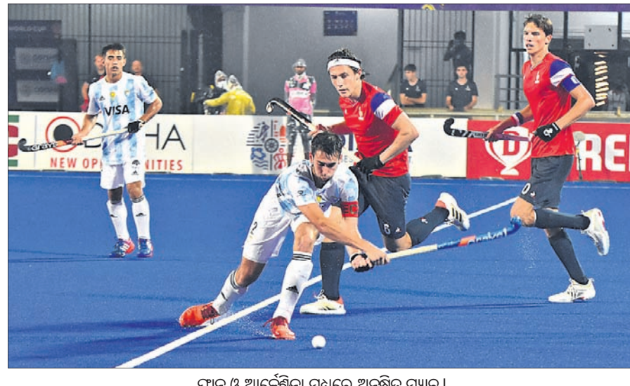
ପ୍ରାନ୍ତ ଓ ଆର୍ଜେଣ୍ଟିନା ମଧ୍ୟରେ ଅନୁଷ୍ଠିତ ମ୍ୟାଚ।