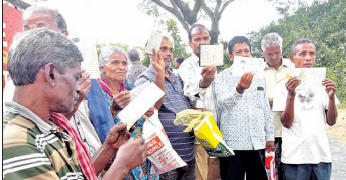
ଜମାକାରୀମାନେ ବ୍ୟାଙ୍କ ଜମାଖାତା ଦେଖାଉଛନ୍ତି ।