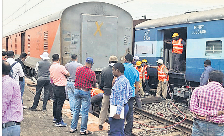
ଦୁର୍ଘଟଣାଗ୍ରସ୍ତ ବନ୍ଦିର ମରାମତି କରାଯାଇଛି।

ବଡ଼ଧରଣ ଦୁର୍ଘଟଣାରୁ ବର୍ତ୍ତିଲେ ଯାତ୍ରୀ, ୩ ନିଲମ୍ବିତ କର୍ମଚାରୀଙ୍କ ଅବହେଳାକୁ ଦାୟୀ