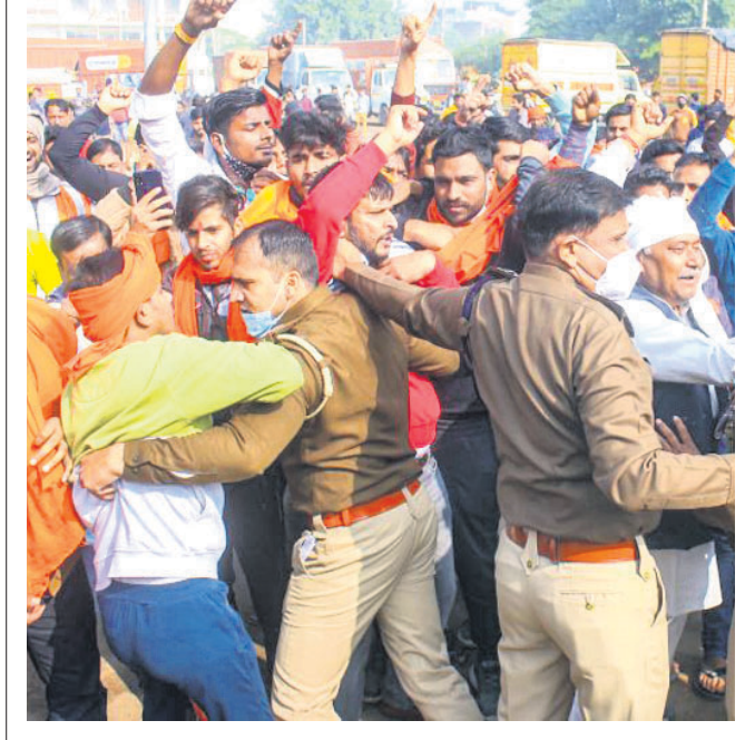
ଗୁରୁଗ୍ରାମର ସେକ୍ଟର ୩ରେ ଥିବା ଏକ ଖୋଲାଘାଟିରେ ପ୍ରଧାନମନ୍ତ୍ରୀଙ୍କ ସମ୍ମାନ ସମ୍ବନ୍ଧରେ ଲୋକେ ଶୁକ୍ରବାର ମନାକପାଠ କରିବାକୁ ଏହାର ପ୍ରତିବାଦରେ ଘାଣ୍ଟା ଝାଡ଼ି ଖବରଦାତାଙ୍କୁ ପକ୍ଷରୁ ବିଶୋଧ କରାଯାଇଛି।

ଭାଜପା ଶାସନରେ ସମାଜ ସବୁ ବର୍ବର ଭାବେ ଆଡ଼ିକାଟା କାରଣ ଏହି ଦଳ ନୀତି ହେଉଛି 'ମାର ଓ ଶାସନ କର୍ମ'। ଲୋକଙ୍କ ପ୍ରତି ବର୍ବରତାରେ ଭାଜପା ବ୍ରିଟିଶ୍ ସରକାରକୁ ମଧ୍ୟ ପଛରେ ପକାଇଦେଇଛି ବୋଲି ଶୁକ୍ରବାର ସମାଜବାଦୀ ପାର୍ଟି (ଏସ୍.ପି) ଅଧ୍ୟକ୍ଷ ଅଖିଲେଶ୍ ଯାଦବ ସମାଲୋଚନା କରିଛନ୍ତି। ଝାଡ଼ିଖଟରେ ଏକ ଖବରଦାତା ସମ୍ମିଳନୀକୁ ସମେୟତ କରି ଅଖିଲେଶ୍ କହିଥିଲେ, ଏହି ସରକାର ବ୍ରିଟିଶ୍ ଅମଳର ଅତ୍ୟାଚାରକୁ ପଛରେ ପକାଇଦେଇଛି, ଯାହାକି ଲକ୍ଷ୍ମୀପୁର ଖେଟିରେ ଦେଖିବାକୁ ପ୍ରସ୍ତୁତ ପାଇଁ। ଅଭିଯୋଗ ବିରୋଧରେ କୋଣାର୍କ ଆଖିପାଖି କାର୍ଯ୍ୟକ୍ରମ ନିଆଯାଇ ନାହିଁ। ଯେହାନୀନ ଏହାକୁ ବିରୋଧ କରୁଛନ୍ତି ସେମାନଙ୍କ କ୍ଷେତ୍ରରେ ମାର ଓ ଶାସନ କର ନୀତି ଆପଣାଯାଉଛି। ଯୋଗା ସରକାର ଅମଳରେ ଫେଡ୍ ଏନ୍କାଉଣ୍ଟର ସଂଖ୍ୟା ବୃଦ୍ଧିରେ ଲାଗିଛି। ଏହାଲାଗି ସରକାରଙ୍କୁ ମାନବଧିକାର କମିଶନଙ୍କ ପକ୍ଷରୁ ସର୍ବଧିକ ନୋଟିସ୍ ପଠାଯାଇଛି। ଯେଉଁ କିରିବା ରୁ ଏ ସମ୍ପର୍କରେ ବାୟୁ ମାନ ପରିଚାଳନା କମିଶନଙ୍କ ସହ ଆଲୋଚନା କରିବା ବୋଲି ଅଖିଲେଶ୍ ପ୍ରଣ କହିଛନ୍ତି।