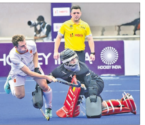
ସ୍ନେନ-ବେଲଜିୟମ ମ୍ୟାଚର ଏକ ସଂଘର୍ଷପୂର୍ଣ୍ଣ ମୁହୂର୍ତ୍ତ।