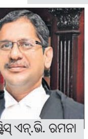
ଇଣ୍ଡିଆନ୍ ବି.ଭି. ରମନା

ତାହା ପରିବାର ସଦସ୍ୟଙ୍କ ମଧ୍ୟରେ ହେଉ, ବ୍ୟବସାୟରେ କିମ୍ବା ପେସାଗତ ଜୀବନରେ ଘଟିଥାଏ। ବୁଦ୍ଧ ବିହାନ ବିଶ୍ୱର ପରିକଳ୍ପନା କରାଯାଇ ନ ପାରେ। ବିବାଦର ମଧ୍ୟ ଏକ ମାନବୀୟ ଦିଗ ରହିଛି, ଯାହାକି ଏହାକୁ ସମାଧାନ କରିବାରେ ସହାୟକ ହୋଇଥାଏ। ବିବାଦର ଉର୍ଦ୍ଧ୍ୱକୁ ଯାଇ ଦେଖିବା ପାଇଁ ଦୂରଦୃଷ୍ଟି ଜରୁରୀ। ବିବାଦ ସମାଧାନ ପଛର ସବୁଠୁ ଗୁରୁତ୍ୱପୂର୍ଣ୍ଣ ଫ୍ୟାକ୍ଟର ହେଲା ମନୋବୃତ୍ତି। ଏଥିପାଇଁ ଅହଂଭାବ, ଆବେଗ, ଅଧିକାରବାଦ ଏବଂ ଆଗ୍ରହକୁ ଆଂଶିକ ତ୍ୟାଗ କରିବାକୁ ପଡ଼ିଥାଏ। ତେବେ ବିବାଦ ଥରେ ଅବାଲତରେ ପହଞ୍ଚିଯିବା ପରେ ସେଗୁଡ଼ିକୁ ହରାଇବାକୁ ହୋଇଥାଏ ବୋଲି ସିଜେଆଇ କହିଛନ୍ତି।