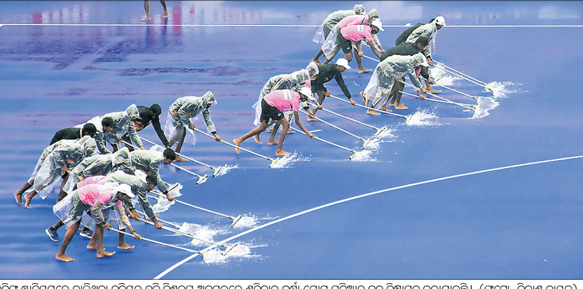
କଳିଙ୍ଗ ଷ୍ଟାଡ଼ିୟମରେ ଚାଲିଥିବା ଜୁନିୟର ହକି ବିଶ୍ୱକପ ଅବସରରେ ଶନିବାର ବର୍ଷା ଯୋଗୁ ପଡ଼ିଆକୁ ଜଳ ନିଷାସନ କରାଯାଇଛି ।