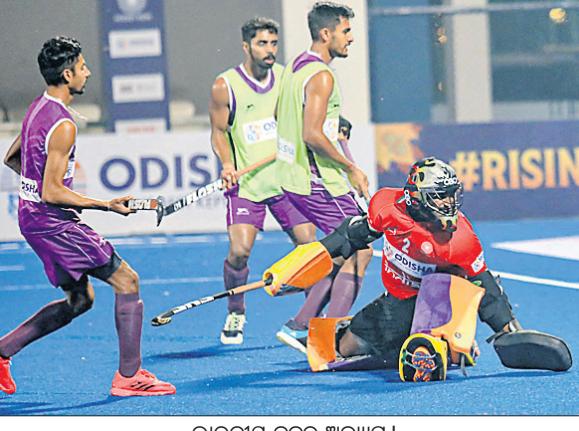
ଭାରତୀୟ ଦଳର ଅଭ୍ୟାସ ।

ଭୁବନେଶ୍ୱର, ୪।୧୨(ବ୍ରାହ୍ମା ପ୍ରତିନିଧି) କଳିଙ୍ଗ ଷ୍ଟାଡ଼ିୟମରେ ଚାଲିଥିବା ଏଫଆଇଏର୍ ଓଡ଼ିଶା ହକି ପୁରୁଷ ଜୁନିୟର ବିଶ୍ୱକପର ଗ୍ରୋଜି ପଦକ ମୁକାବିଲାରେ ଭାରତ ଉପରାଜ୍ୟ ପ୍ରାନ୍ତକୁ ଭେଟିବ । ଉଭୟ ଭାରତ ଓ ପ୍ରାନ୍ତ ସେମିଫାଇନାଲରେ ପ୍ରବେଶ କରିଥିଲେ ହେଁ ଯଥାକ୍ରମେ ଜର୍ମାନୀ ଓ ଆର୍ଜେଣ୍ଟିନାଠାରୁ ହାରି ଚୁଡ଼ାୟ ସ୍ଥାନ ଯେ-ଅଫରେ ଅବତୀର୍ଣ୍ଣ ହୋଇଛନ୍ତି । ଚଳିତ ଟୁର୍ନାମେଣ୍ଟରେ ଭାରତ ଏହାର ପ୍ରଥମ ମ୍ୟାଚରେ ପ୍ରାନ୍ତଠାରୁ ୪-୫ ଗୋଲରେ ହାରି ଯାଇଥିଲା । ତେଣୁ ଆଗାମୀ ମ୍ୟାଚରେ ପ୍ରାନ୍ତକୁ ହରାଇ ପରାଜୟର ମଧୁର ପ୍ରତିଶୋଧ ନେବା ସୁଯୋଗ ଭାରତୀୟ ଦଳ ନିକଟରେ ରହିଛି । ଅପରାହ୍ଣ ୪ଟା ୩୦ରେ ଏହି ମ୍ୟାଚ ଖେଳାଯିବ ।