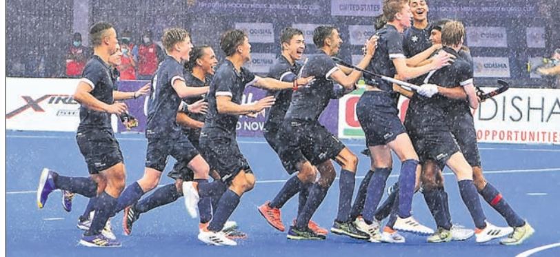
ମ୍ୟାଚ ଜିତିବା ପରେ ଉଲ୍ଲାସିତ ଆମେରିକା ଖେଳାଳି ।