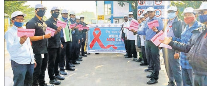
ଏଡସ୍ ସପ୍ତାହ ପାଳିତ। ଏହି ଅଭିଯାନ କରିବାରେ କମ୍ପାନୀ ସପ୍ତାହ ମଧ୍ୟରେ ପ୍ରାୟ ୨୦୦୦ ଗୋଷ୍ଠୀଙ୍କ ନିକଟରେ ପହଞ୍ଚିବା ଲକ୍ଷ୍ୟ ରଖିଛି।

ବେଦାନ୍ତ ଲିମିଟେଡ୍ ଝାରସୁଗୁଡ଼ା ୟୁନିଟ୍ ପକ୍ଷରୁ ବିଶ୍ୱ ଏଡସ୍ ଦିବସ ଉପଲକ୍ଷେ ସପ୍ତାହସମାପୀ ସାମ୍ବନ୍ଧ ଭିକ୍ଷା କାର୍ଯ୍ୟକ୍ରମ ଆୟୋଜନ କରାଯାଇଛି। ବିଶେଷ କରି ଏଫ୍ଆଇଭି ଏଡସ୍ ସମ୍ପର୍କରେ କମ୍ପାନୀର କର୍ମଚାରୀଙ୍କୁ ଉଦ୍ଦେଶ୍ୟ ସହଯୋଗୀ ପର୍ଯ୍ୟନ୍ତ ଏବଂ ସ୍ଥାନୀୟ ଗୋଷ୍ଠୀ ସମୂହଙ୍କୁ ଏ ସମ୍ପର୍କରେ ସଚେତନ କରାଇବା ହେଉଛି ଏହି କାର୍ଯ୍ୟକ୍ରମର ମୂଳ ଉଦ୍ଦେଶ୍ୟ। ଏହି ଅଭିଯାନର ଅଂଶ ଭାବେ ଖଳାଡ଼ି ଫାଉଣ୍ଡେସନ, ଓଡ଼ିଶା ରାଜ୍ୟ ଏଡସ୍ ନିୟନ୍ତ୍ରଣ ସମିତି ଓ ସ୍ୱେଚ୍ଛାସେବୀଙ୍କ ସହିତ ବେଦାନ୍ତର ମୋବାଇଲ୍ ହେଲ୍ପ ଲାଇନ୍ ୬୦୦୦୭୭ ଉର୍ଦ୍ଧ୍ୱ କର୍ମଚାରୀ ଓ ବ୍ୟବସାୟିକ ସହଯୋଗୀ ନିକଟରେ