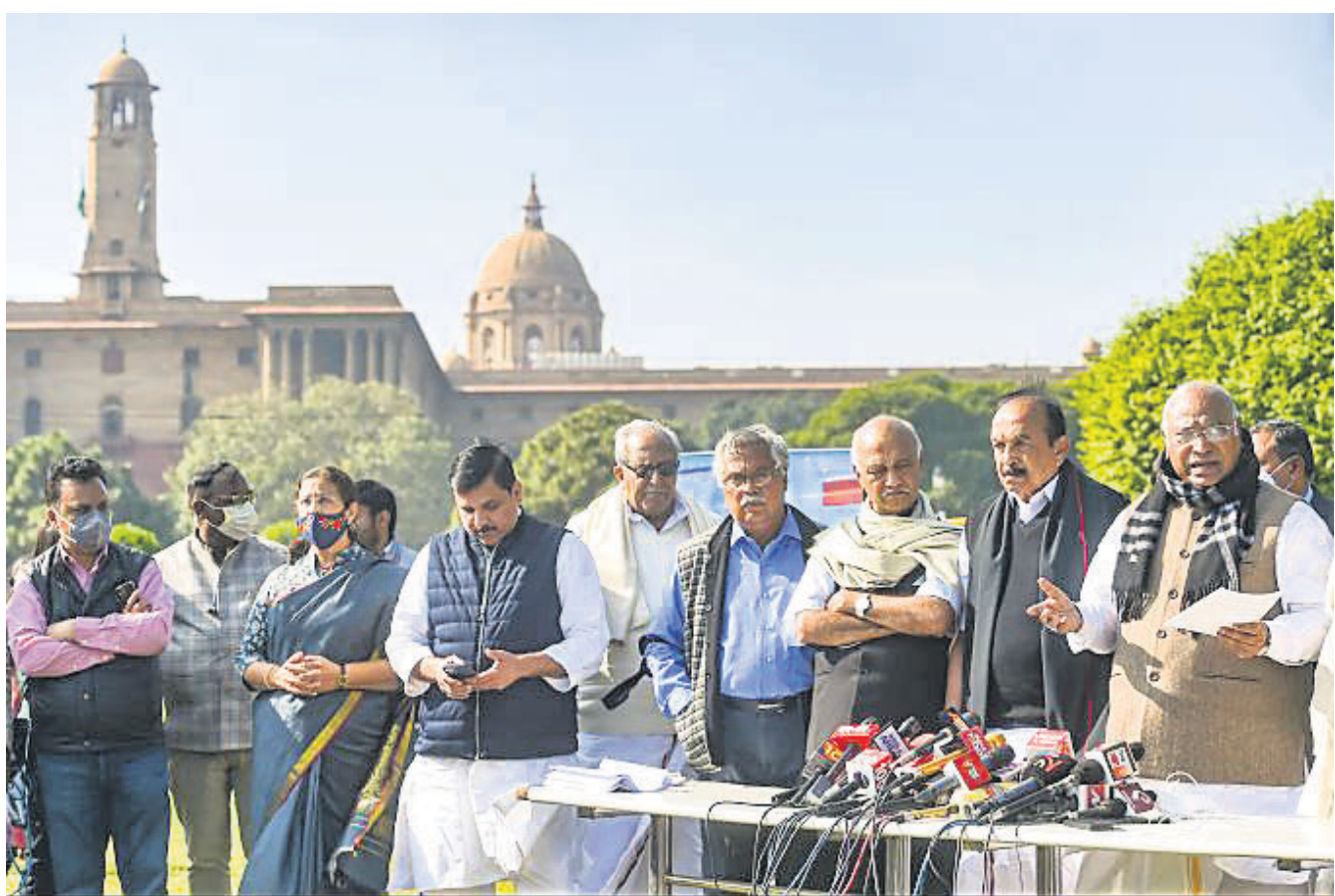
ନୂଆଦିଲ୍ଲୀର ବିଜୟ ଚୌକରେ ବିରୋଧୀ ଦଳ ନେତା ମଲ୍ଲିକାର୍ଜୁନ ଖାଟ୍ଟି, ଭାଇକୋ, ସଞ୍ଜୟ ସିଂଘ ଓ ଅନ୍ୟମାନେ।

ଲକ୍ଷ୍ନୌ, ୨୧୧୨: ଉତ୍ତରପ୍ରଦେଶର ମୁକାଫରନଗର ଜିଲ୍ଲାରେ ୧୦ମ ଶ୍ରେଣୀର ୧୭ ଛାତ୍ରୀଙ୍କୁ ଏକ ଘରୋଇ ଶୁଳ୍କ ପ୍ରତିପାଳ ପ୍ରାକ୍ରିୟାଳୟ ପରୀକ୍ଷା ବାହାନରେ ଯୌନ ନିର୍ଯାତନା ଦେଇଥିବା ଅଭିଯୋଗ ହୋଇଛି।