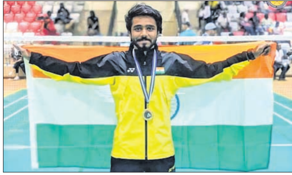
ଅମନ ପାରୋ ସଞ୍ଜୟ

ବକ୍ସିଂ: ସାବରା ଡବ୍ଲ୍ୟୁବିସି ଇଣ୍ଡିଆର ପ୍ରଥମ ଚାମ୍ପିୟନ