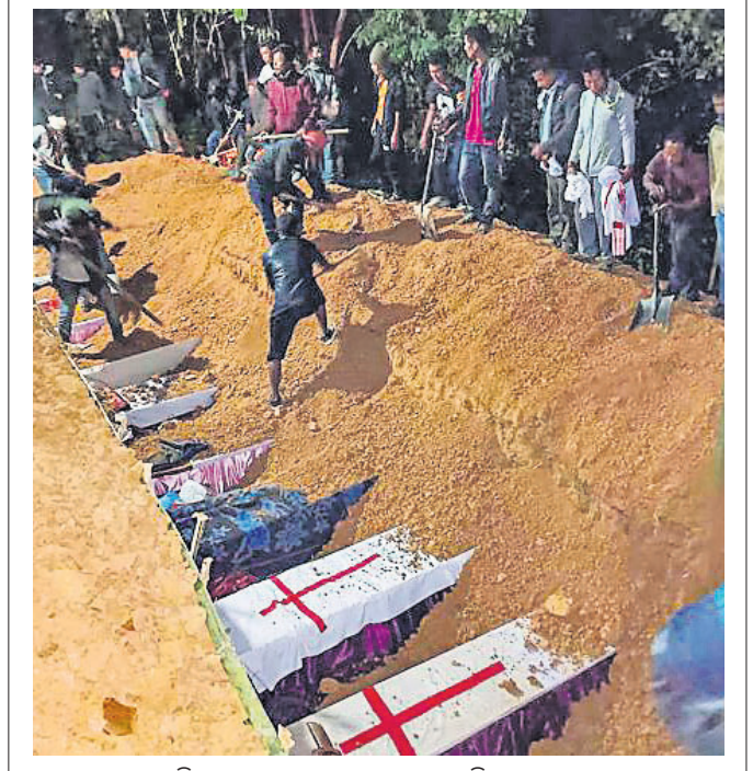
ମଣିପୁରର ମୋନରେ ସଶସ୍ତ୍ର ବଳର ରୁକ୍ମିଣୀଦେବ ପ୍ରାଣ ହରାଇଥିବା ୧୩ ଜଣଙ୍କୁ ସୋମବାର ସମ୍ପୂର୍ଣ୍ଣ ସମାଧି ଦିଆଯାଇଛି।

ଆଇଏମ୍‌ପିର ଚେତାବନୀ ଦୁଇ ଅଳ୍ପ ବିଶିଷ୍ଟ ସଂକ୍ରମଣ ସଂଖ୍ୟା ମାମଲା ତିକ୍ତ ବଢ଼ାଇଥିବାବେଳେ ଭାରତୀୟ ମେଡିକାଲ ଆୟୋଗିକମିଟି (ଆଇଏମ୍‌ପି) ସତର୍କତା ଘୋଷଣା କରିଛନ୍ତି।