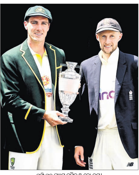
ରୁଫି ସହ ପ୍ୟାଟ କୁମ୍ବ୍ ଓ ଡୋ ରୁଟ୍।

ଆଶୋସ କ୍ରିକେଟ ଟେଷ୍ଟ ସିରିଜ ବୁଧବାରଠାରୁ ଆରମ୍ଭ ହେବାକୁ ଯାଉଛି। ୫ ମ୍ୟାଚ ବିଶିଷ୍ଟ ଏହି ହାଇପ୍ରେସାୟାଲ ସିରିଜର ପ୍ରଥମ ମ୍ୟାଚ ଘ୍ଲାନୀୟ ଗାବା ଗ୍ରାଉଣ୍ଡରେ ଖେଳାଯିବ। ଟେଷ୍ଟ ଲଢେଇ ପାଇଁ ଇଂଲଣ୍ଡ ଓ ଘରୋଇ ଅଷ୍ଟ୍ରେଲିଆ ସମ୍ପୂର୍ଣ୍ଣ ରୂପେ ପ୍ରସ୍ତୁତ ଅଛନ୍ତି। ଅଷ୍ଟ୍ରେଲିଆ ଅଭିଜ୍ଞ ବୁଟ ବୋଲର ଅଷ୍ଟ୍ରେଲିଆର ନେତୃତ୍ୱ ନେବେ। ସେହିପରି ରୁଟ୍ ନିଜର ଅଧ୍ୟାଧିକାର ବ୍ୟାଟିଂ ଦଳରେ ଇଂଲଣ୍ଡକୁ ନୁଆ ନେତୃତ୍ୱ ପ୍ରଦାନ କରିବେ। ସିରିଜରେ ଜଣେ ବୋଲିଂ ଓ ବ୍ୟାଟିଂ ଅଧିନାୟକଙ୍କ ମଧ୍ୟରେ ମୁକାବିଲା ଦେଖିବାକୁ ମିଳିବ। ଦୁଇ ଦଳ ମଧ୍ୟରେ ଲଢେଇ ସଂଘର୍ଷପୂର୍ଣ୍ଣ ହେବ ବୋଲି ଇଂଲଣ୍ଡ ଉଇକେଟ କିପର ଜୋଶ ବଟଲର ପ୍ରଥମ ଟେଷ୍ଟର ଅଧ୍ୟକ୍ଷତାରେ ପୂର୍ବରୁ କହିଛନ୍ତି। ଇଂଲଣ୍ଡର ସଫଳତମ ବୁଟ ବୋଲର ଜେମ୍ସ ଆଣ୍ଡରସନ