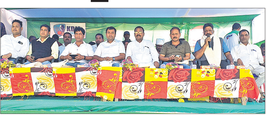
ଉଦ୍‌ଘାଟନା ଉତ୍ସବରେ ଉପସ୍ଥିତ ଅତିଥି।

ଯାଜପୁର ଜିଲ୍ଲା ବସୁଲପୁର ବ୍ଲକ୍ ଅଧୀନ ଅରକାପୁର ଖେଳ ପଡ଼ିଆରେ ୭ମ ବାର୍ଷିକା କଳ୍ପତରୁ ଦାସ ମେମୋରିଆଲ୍ (କେଟିଏମ୍) କ୍ରିକେଟ ଟୁର୍ଣ୍ଣାମେଣ୍ଟର ବରା ଜୋନସ୍ତ୍ରୋୟ ଖେଳ ମଙ୍ଗଳବାର ଉଦ୍‌ଘାଟିତ ହୋଇଯାଇଛି। ଆୟୋଜିତ ୨ଟି ମ୍ୟାଚ୍ରେ