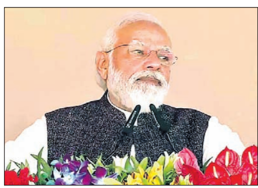
ପ୍ରଧାନମନ୍ତ୍ରୀ ନରେନ୍ଦ୍ର ମୋଦି

ଭରତ ପ୍ରଦେଶ ବିଧାନସଭା ନିର୍ବାଚନ ଯେତେକ ପାଖେଇ ଆସୁଛି ଶାସକ ବିରୋଧୀଙ୍କ ବାକ୍ସୁକ ସେତେକ ଚାନ୍ଦ ହେବାରେ ଲାଗିଛି। ପ୍ରଧାନମନ୍ତ୍ରୀ ନରେନ୍ଦ୍ର ମୋଦି ମଙ୍ଗଳବାର ଗୋରଖପୁରରେ ଭାଜପାର ଏକ ନିର୍ବାଚନ ସଭାକୁ ସମ୍ବୋଧିତ କରି ସମାଜବାଦୀ ପାର୍ଟି (ଏସ୍ପି)କୁ ଚାଲେନ୍ଜ କରିଥିଲେ। କହିଥିଲେ, ଯୁପି ପାଇଁ ଲାଇଟୋପି ଏକ ରେଡ୍ ଆଲର୍ଟ। ଏସ୍ପି ଅଧକ୍ଷ ଅଖିଳେଶ ଯାଦବ କାଳ ନିଲମ୍ବ ନ କରି ଏହାର ଜବାବରେ କହିଛନ୍ତି, ଲାଇଟୋପି ଯୁପି ପାଇଁ ନୁହେଁ, ବରଂ ଭାଜପା ଲାଗି ବିପଦ। ତୁଳ ନେତାଙ୍କ ଏକ ବିକାଶ ବିନିମୟ ଯୁପି ଭୋଟରଙ୍କୁ ଆମୋଦିତ କରିଛି।