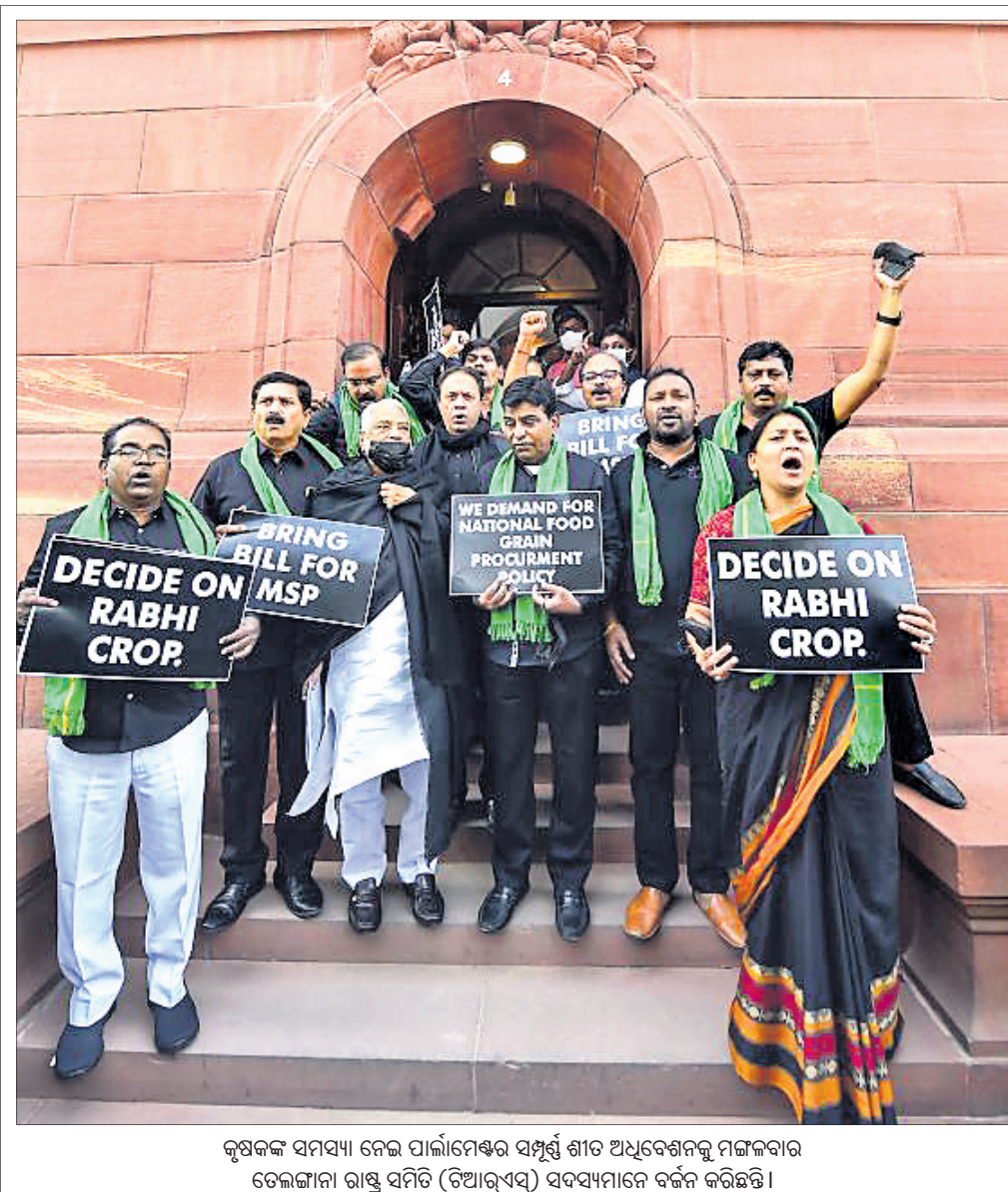
କୃଷକଙ୍କ ସମସ୍ୟା ନେଇ ପାଇଁମେଣ୍ଟର ସମ୍ପୂର୍ଣ୍ଣ ଶୀତ ଅଧିବେଶନକୁ ମଙ୍ଗଳବାର ତେଲଙ୍ଗାନା ରାଷ୍ଟ୍ର ସମିତି (ଟିଆର୍କ୍ସସ୍ପି) ସଦସ୍ୟମାନେ ବର୍ଜନ କରିଛନ୍ତି।