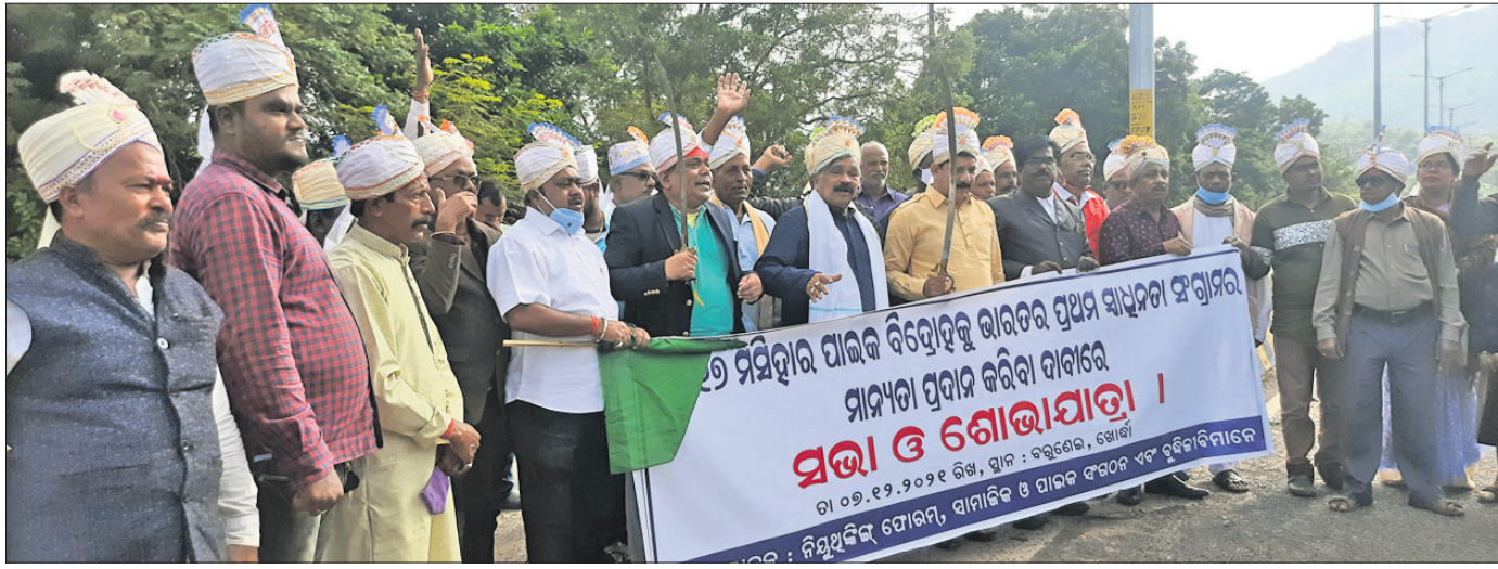
ପାଇକ ବିଦ୍ରୋହକୁ ପ୍ରଥମ ସ୍ୱାଧୀନତା ସଂଗ୍ରାମ ମାନ୍ୟତା ଦାବିରେ ମଙ୍ଗଳବାର ଖୋର୍ଦ୍ଧା ବରୁଣେଇରୁ ବିଧାୟକମାନେ ଶୋଭାଯାତ୍ରାରେ ବାହାରିଛନ୍ତି।