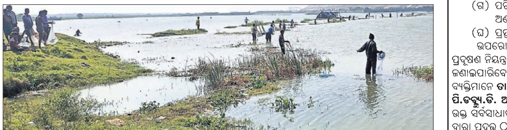
ଲୋକମାନେ ନଦୀକୁ ମାଛ ଧରୁଛନ୍ତି।