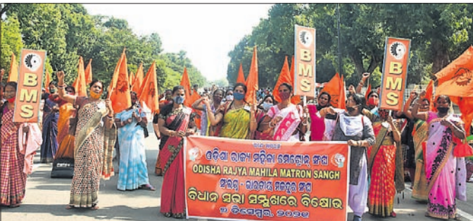
ରାଜ୍ୟ ମାଗ୍ରନ ସଂଘ ପକ୍ଷରୁ ବିରୋଧ ପ୍ରଦର୍ଶନ କରାଯାଇଛି।

ଅନୁସୂଚିତ ଜାତି ଓ ଜନଜାତି ବିଭାଗ ଦ୍ୱାରା ପରିଚାଳିତ ଆଶ୍ରମ ଏବଂ ସେବାଗ୍ରାମଗୁଡ଼ିକରେ ନିୟୁତ ମହିଳା ମାଗ୍ରନମାନଙ୍କ ବିଭିନ୍ନ ଦାବି ନେଇ ମାଗ୍ରନମାନଙ୍କ ବିଭିନ୍ନ ଦାବି ନେଇ ଓଡ଼ିଶା ରାଜ୍ୟ ମେନ୍ତୋର ସଂଘ ପକ୍ଷରୁ ଆଲୋଚନା କରିଥିଲେ। କେତୋଟି ଦାବି ପୂରଣ କରିଥିବାବେଳେ ଅନ୍ୟ କେତୋଟି ଦାବି ପାଇଁ ସମୟ ଲାଗିବ ବୋଲି କହି ପ୍ରତିଶ୍ରୁତି ଦେଇଥିବା ସଂଘର ମୁଖ୍ୟ