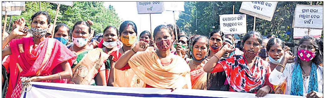
ଜମି ଅଧିଗ୍ରହଣ ଉପରେ ମଙ୍ଗଳବାର ଫୋରମ୍ ଫର୍ ଗ୍ରାମସଭା କମିଟି, ରାଜଗାଙ୍ଗପୁର ପକ୍ଷରୁ ଭୁବନେଶ୍ୱର ପିଏମ୍‌ଜିରେ ବିରୋଧ।