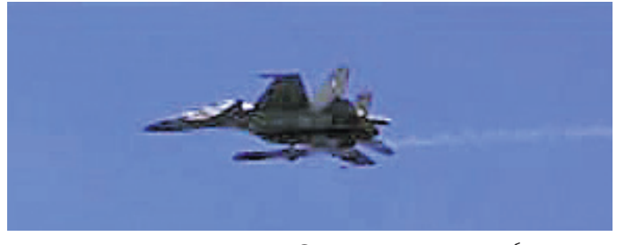
ବୁଧବାର- 'ବ୍ରହ୍ମୋସ' ସୁପରସୋନିକ୍ ଜୁଜ୍ କ୍ଷେପଣାସ୍ତ୍ର ସଫଳ ପରୀକ୍ଷଣ।

ବାଲେଶ୍ୱର ଅଫିସ, ୮୧୨ ଏଥିରେ ବ୍ୟବହୃତ ଅଧିକାଂଶ ଯନ୍ତ୍ରାଂଶ ସ୍ୱଦେଶୀ ଛାନକୋଶଳରେ ବିକଶିତ। ଏଥିରେ ଅନ୍ତର୍ଭୁକ୍ତ ହୋଇଛି ଧାତବ ଏବଂ 'ବ୍ରହ୍ମୋସ' ସୁପରସୋନିକ୍ ଜୁଜ୍ କ୍ଷେପଣାସ୍ତ୍ର ସଫଳ ପରୀକ୍ଷଣ ପରୀକ୍ଷଣ ସଫଳ ହୋଇଛି। ବୁଧବାର ପୂର୍ବାହ୍ନ ୧୦ଟା ୩୦ମିନିଟ୍ ସମୟରେ ପୁଣ୍ୟାଳ-୩୦ ଏମ୍ବିଏ-୧ ମୁକ୍ତିପାନରୁ ଏହି କ୍ଷେପଣାସ୍ତ୍ର ପରୀକ୍ଷଣ କରାଯାଇଥିଲା। ବିମାନରୁ ସମସ୍ତ ମିଶନ ଉଦ୍ଦେଶ୍ୟ ପୂରଣ ଲାଗି ପୂର୍ବ-ଯୋଜନାବଦ୍ଧ ଗ୍ରାଜେଟ୍ରେଟି ଅନୁସରଣ କରାଯାଇଥିଲା। ଏହି ମିଶନର ପରୀକ୍ଷଣ ସଫଳ ହୋଇଥିବା ପ୍ରତିରକ୍ଷା ଉଦ୍ଦେଶ୍ୟ ଓ ବିକାଶ ସଙ୍ଗଠନ (ଡିଆରଡିଓ) ପକ୍ଷରୁ କୁହାଯାଇଛି। ଏନେଇ ପ୍ରତିରକ୍ଷା ମନ୍ତ୍ରୀ ରାଜନାଥ ସିଂ ଡିଆରଡିଓ ସହିତ ପରୀକ୍ଷଣରେ ସଫଳତା ଟିପ୍ପଣୀ ଶୁଭେଚ୍ଛା ଜଣାଇଛନ୍ତି। 'ବ୍ରହ୍ମୋସ' ବିକାଶରେ ଏହି ସଫଳତା ଏକ ପ୍ରମୁଖ ମାଇଲସ୍ଟୋକ୍। ଦେଶରେ ସଫଳତା ଅର୍ଜନ 'ବ୍ରହ୍ମୋସ' କ୍ଷେପଣାସ୍ତ୍ର କ୍ରମିକ ଉତ୍ପାଦନ ବ୍ୟବସ୍ଥା ଲାଗି ବାଟ ପିଟିଛି।