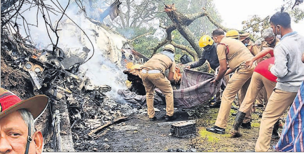
ଦୁର୍ଘଟଣାସ୍ଥଳରେ ଚାଲିଥିବା ଉଦ୍ଧାର କାର୍ଯ୍ୟ ।