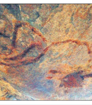
୨୦୦୦ ବର୍ଷ ପୂର୍ବରୁ ସାଙ୍କେତିକ ଚିତ୍ର, ଚିତ୍ର ରହିଛି। ରକ୍ଷଣାବେକ୍ଷଣ ପାଇଁ ପ୍ରତ୍ନତତ୍ତ୍ୱ ବିଭାଗ ଦୃଷ୍ଟି ଦେଉ।

ଆକିଥିବାର ଅନୁମାନ କରାଯାଇଛି। ଗୁମ୍ଫାଟିରେ ଦେଖାଯାଉଥିବା ଅନେକ ଚିତ୍ର ମଧ୍ୟରୁ ମହୁଡ଼େଣା, ମାଛ, ଫୁଲ, ହୁଏତ ଅନେକ ବର୍ଷ ପୂର୍ବେ ସ୍ଥାନୀୟରେ ଏକ ସଭ୍ୟତା ରାଜି ଉଠିଥିଲା ଓ ଗୁମ୍ଫାଟିକୁ ସେହି ଆଦିନ ଅଧିବାସୀମାନେ ଧାର୍ମିକ ଉପାସନାର ସ୍ଥାନ ଭାବେ ବ୍ୟବହାର କରୁଥିଲେ। ସେ ସମୟରେ ଲିପିତରୂପେ ବା ମୂର୍ତ୍ତିକାଦି ବ୍ୟବହାର ଆରମ୍ଭ ହୋଇ ନ ଥିବାରୁ ଅଧିବାସୀମାନେ ନିଜ ସାମାଜିକ ଚାଳିଚଳଣୀ ସୂଚନା ଦେବାକୁ ଏପ୍ରକାର ସାଙ୍କେତିକ ଚିତ୍ର