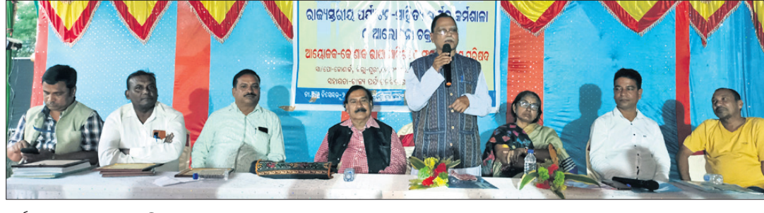
କର୍ମଶାଳାରେ ମଞ୍ଚାସୀନ ଅତିଥି।