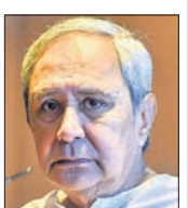
ସିଡିଏସ୍ ରାଓଙ୍କ ପ୍ରାଣହାନି ଦେଖି ପାଇଁ ଏକ ଅପୂରଣୀୟ କ୍ଷତି। ଶୋକସଂପୂର୍ଣ୍ଣ ପରିବାରବର୍ଗକୁ ସମବେଦନା କରାଯାଇଛି। ଆହତ ବ୍ୟକ୍ତିଙ୍କ ଆଶୁ ଆରୋଗ୍ୟ କାମନା କରୁଛି।

ହେଲିକପ୍ଟର ଦୁର୍ଘଟଣାରେ ଟିଏସ୍‌ଆର୍‌ଟିଏଫ୍‌ଏ (ସିଡିଏସ୍) ବିପିନ ରାଓଙ୍କ ସମେତ ୧୩ ଜଣଙ୍କର ପ୍ରାଣହାନି ଅତ୍ୟନ୍ତ ଦୁଃଖଦାୟକ।