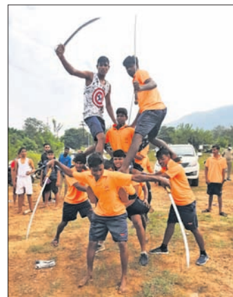
ଯୁବକମାନେ ପାଇକ ଆଖଡ଼ା କରୁଛନ୍ତି ।