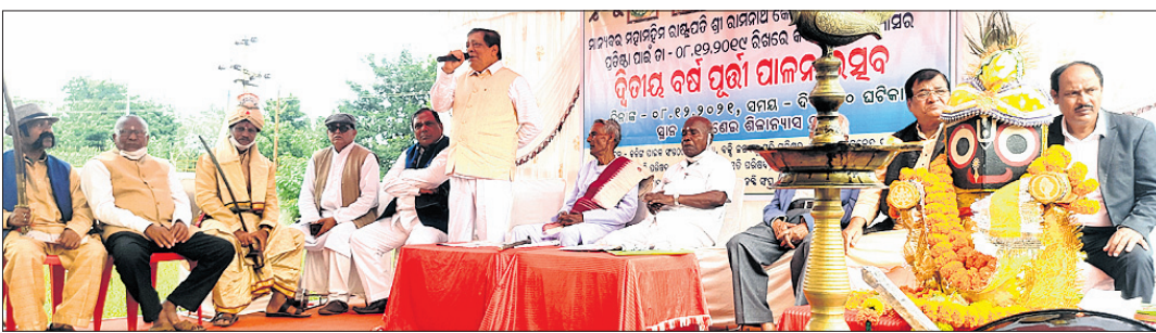
ଶିଳାନାୟ ପୂର୍ଣ୍ଣ ଉତ୍ସବରେ ଯୋଗ ଦେଇଥିବା ଅତିଥିମାନେ ।