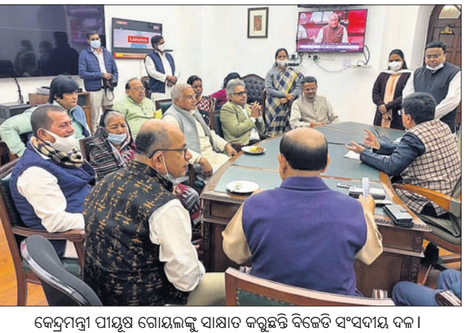
କେନ୍ଦ୍ରମନ୍ତ୍ରୀ ପ୍ରଫୁଲ୍ଲ ଗୋୟାଙ୍କୁ ସ୍ମାରକପତ୍ର ଦେଇ ବିଜେଡି ସଂସଦୀୟ ଦଳ।

ଭୁବନେଶ୍ୱର, ୮୧୨ (ବୁଧବାର) ଭାରତୀୟ ଖାଦ୍ୟ ନିଗମ (ଏସ୍‌ସିଆଇ) ଓଡ଼ିଶାରୁ ବଳିକା ଉତ୍ତୁନା ଚାଉଳ ସଂଗ୍ରହ କରିବାକୁ ରାଜ୍ୟ ସରକାର ବାରମ୍ବାର ଦାବି କରି ଆସୁଛନ୍ତି। ଏ ନେଇ ବିଜେଡି ସଂସଦୀୟ ଦଳ ବୁଧବାର କେନ୍ଦ୍ର ଖାଦ୍ୟମନ୍ତ୍ରୀ ପ୍ରଫୁଲ୍ଲ ଗୋୟାଙ୍କୁ ସ୍ମାରକପତ୍ର ପ୍ରଦାନ କରିଛନ୍ତି। ବିଜେଡି ସଂସଦୀୟ ଦଳ ସମସ୍ତ ପ୍ରଦାନ ସ୍ମାରକପତ୍ରରେ ଉଲ୍ଲେଖ କରାଯାଇଛି ଯେ, ୨୦୨୧-୨୨ ବର୍ଷ ପାଇଁ ରାଜ୍ୟରେ ୫୨ ଲକ୍ଷ ମେଟ୍ରିକ୍ ଟନ୍ ଚାଉଳ ଅମଳ ହେବାର ଆଶା କରାଯାଇଛି। ଏଥିରୁ ବିଜିନ ଯୋଜନା ବାବଦରେ ୨୦ଲକ୍ଷ ମେଟ୍ରିକ୍ ଟନ୍ ଉତ୍ତୁନା ଓ ୫ ଲକ୍ଷ ମେଟ୍ରିକ୍ ଟନ୍ ଅର୍ଥୁଆ ଚାଉଳ ବଣ୍ଟନ ସରିଲା ପରେ ଆଉ ୨୪ଲକ୍ଷ ମେଟ୍ରିକ୍ ଟନ୍ ଉତ୍ତୁନା ଚାଉଳ ବଳିକା ହେବ। ଯଦି କେନ୍ଦ୍ର ସରକାର ଏହି ଉତ୍ତୁନା ଚାଉଳ ଓଡ଼ିଶାରୁ ସଂଗ୍ରହ କରିବେ ନାହିଁ, ତାହାହେଲେ ରାଜ୍ୟର ପ୍ରାୟ ୧୦ ଲକ୍ଷ ଚାଷୀ ପରିବାର ପ୍ରଭାବିତ ହେବେ। ପୂର୍ବରୁ ଏହି