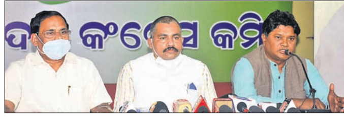
ଖବରଦାତା ସମ୍ମିଳନୀରେ କଂଗ୍ରେସ ନେତୃବୃନ୍ଦ

୧୫ରେ ରାଜଭବନ ସମ୍ମୁଖରେ କଂଗ୍ରେସର ଧାରଣା ଚେତାବନୀ