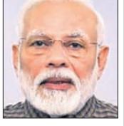
ନରେନ୍ଦ୍ର ମୋଦି, ପ୍ରଧାନମନ୍ତ୍ରୀ

ସିଡିଏସ୍ ଜେନେରାଲ ବିପିନ ରାଓଙ୍କ ଜଣେ ଅଭିଭାବକ ଯୋଗା ଥିଲେ। ଜଣେ ପ୍ରକୃତ ଦେଶଭକ୍ତ ଭାବେ ସମସ୍ତଙ୍କ ପାଇଁ ଆଧୁନିକୀକରଣ କ୍ଷେତ୍ରରେ ତାଙ୍କ ଅବଦାନ ଦେଶବାସୀଙ୍କ ପାଇଁ ସ୍ମରଣୀୟ ହୋଇରହିବ। ରାଓଙ୍କ ପରଲୋକରେ ଗଭୀର ମର୍ମାହତ।