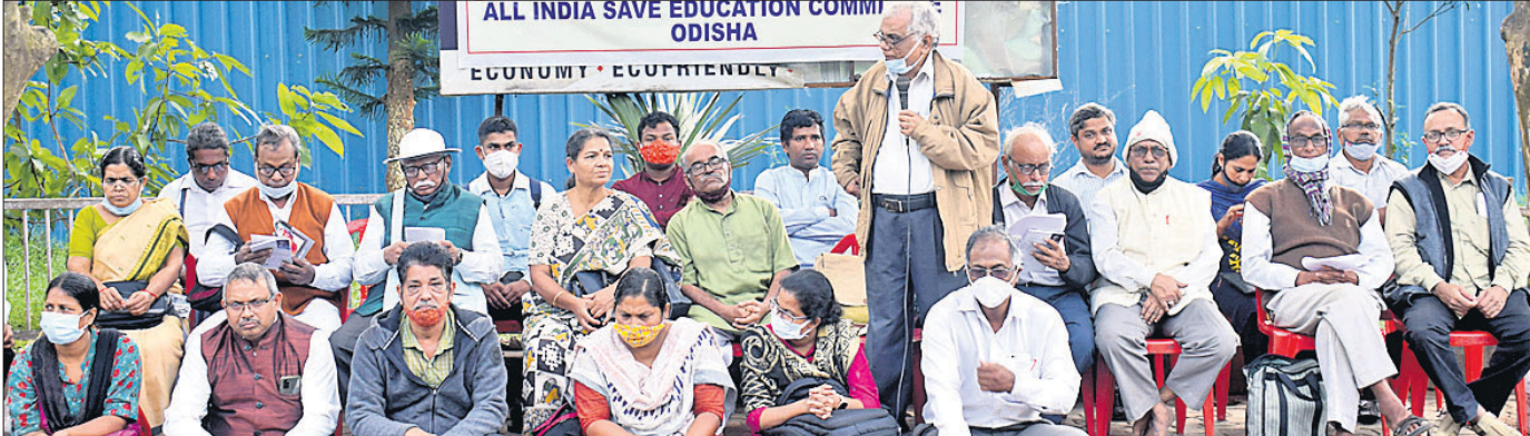
ଜାତୀୟ ଶିକ୍ଷା ନୀତି ୨୦୨୦ ପ୍ରତ୍ୟାହାର ଦାବିରେ ରୁଧିରା ସର୍ବଭାରତୀୟ ପ୍ରତିବାଦ ଦିବସ ପରିବେଷଣରେ ଅଲ୍ ଇଣ୍ଡିଆ ସେବା ଏକ୍ସକେଶନ କମିଟି ପକ୍ଷରୁ ଭୁବନେଶ୍ୱରଠାରେ ରାଜ୍ୟପାଳ ପ୍ରଫେସର ଗଣେଶୀ ଲାଲକୁ ଦାବିପତ୍ର ପ୍ରଦାନ ପୂର୍ବରୁ ରାଜଭବନ ସମ୍ମୁଖରେ ଧାରଣା ଦିଆଯାଇଛି ।

ବ୍ୟବସ୍ଥା ମାଧ୍ୟମରେ ସମସ୍ତ ଦସ୍ତାବିଜ ସହ ଆବେଦନ କରି ଏହି ଯୋଜନାରେ ସାମିଲ ହୋଇପାରିବେ । ବିଜେଡି ସଭ୍ୟ ପ୍ରଫୁଲ୍ଲ ସାମଲ ଏକ ଲିଖିତ ପ୍ରଶ୍ନର ଉତ୍ତରରେ କୃଷି ଓ କୃଷକ ସମ୍ପ୍ରଦାୟର ମନ୍ତ୍ରୀ ଅରୁଣ ସାହୁ ରୁଧିରା ବିଧାନସଭାରେ ଏହି ସୂଚନା ଦେଇଛନ୍ତି ।