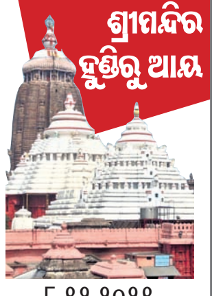
ଶ୍ରୀମନ୍ଦିର ସୁଖିରୁ ଆୟ ୮.୧୨.୨୦୨୧ ୩,୧୫,୯୪୧ ଟଙ୍କା ସୁନା ୮୫୦ ମିଲିଗ୍ରାମ ରୁପା ୧୦.୫୦୦ ଗ୍ରାମ