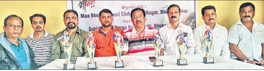
ଖବରଦାତା ସମ୍ମିଳନୀରେ କର୍ମକର୍ମୀମାନେ ଚୁନାବଣ ସମ୍ପର୍କରେ ସୂଚନା ଦେଉଛନ୍ତି।

ଉପଯୋଗୀ ହୋଇଥାଏ। ତାଙ୍କ ସ୍ଥାନରେ ଅକ୍ଷୟ ପଟେଲ ଥିଲେ କିପାରି, ମାତ୍ର ସେ ମଧ୍ୟ ଆହତ ସମସ୍ୟା ଯୋଗୁ ବାଦ ପଡ଼ିଛନ୍ତି। ଏ କ୍ଷେତ୍ରରେ ବିବେଚନା ଅଧିକ ଓ କ୍ରମିତ ଯାଦବଙ୍କ ଉପରେ ଗୁରୁତ୍ୱାଧିକାର ରହିବ। ଏବେ ଭାରତୀୟ 'ଏ' ଦଳ ସହ ଦକ୍ଷିଣ ଆଫ୍ରିକା ଗସ୍ତରେ ଥିବା ଉତ୍ତର ପ୍ରଦେଶ ବାମହାତୀ ସିନର ଓ ବ୍ୟାଟର ସୌରଭ କୁମାରଙ୍କୁ ଷ୍ଟାଣ୍ଡବାଲରେ ରଖା ଯାଇଛି। ସେଠାରେ ସେ ଭଲ ପ୍ରଦର୍ଶନ କରୁଥିବାରୁ ଆଗାମୀ ସିରିଜରେ ଯଦି ସେ ପୂର୍ଣ୍ଣ ଦଳରେ ସାମିଲ ହୁଅନ୍ତି ତେବେ ଆଶ୍ଚର୍ଯ୍ୟ ହେବାର କିଛି ନାହିଁ। ଭାରତୀୟ ଚେଷ୍ଟା ଦଳ: ବିରାଟ କୋହଲି (ଅଧିନାୟକ), ରୋହିତ ଶର୍ମା (ଉପ-ଅଧିନାୟକ), ଲୋକେଶ ରାହୁଲ, ମୟଙ୍କ ଅଗ୍ରୱାଲ, ଚେତେଶ୍ୱର ପୂଜାରୀ, ଅଜିଙ୍କ୍ୟ ରାହାନେ, ଶ୍ରେୟାସ ଆୟାର, ହର୍ମୁଦା ବିହାରୀ, ରିଷଭ ପଟ (ଉଇକେଟ କିପର), ରିକିମାନ ଶାହା (ଉଇକେଟ କିପର), ବିବେକନ ଅଶ୍ୱିନ, ଜୟନ୍ତ ଯାଦବ, ଲକ୍ଷ୍ମଣ ଶର୍ମା, ମହମ୍ମଦ ସାମି, ଉମେଶ ଯାଦବ, ଯଶପ୍ରୀତ କୁମାର, ଶାନ୍ତନୁ ଠାକୁର, ମହମ୍ମଦ ସିରାଜ। ଷ୍ଟାଣ୍ଡବାଲ ଖେଳାଳି: ନବଦୀପ ସଜନୀ, ସୌରଭ କୁମାର, ଦୀପକ ଚହର, ଆର୍ଜୁନ ନାୟାସାଲ।