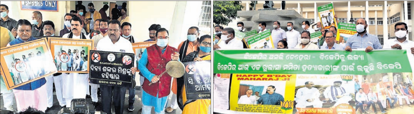
ଭାଜପା ଓ ବିଜେଡି ବିଧାୟକମାନେ ପରସ୍ପର ବିରୋଧରେ ପିନିଡ଼ା ହତ୍ୟାକାଣ୍ଡ ଅଭିଯୁକ୍ତ ସହ ସମ୍ପର୍କିତ ଫଟୋ ଦେଖାଇ ବିଧାନସଭା ପରିସରରେ ବୁଧବାର ବିକ୍ଷୋଭ କରୁଛନ୍ତି।