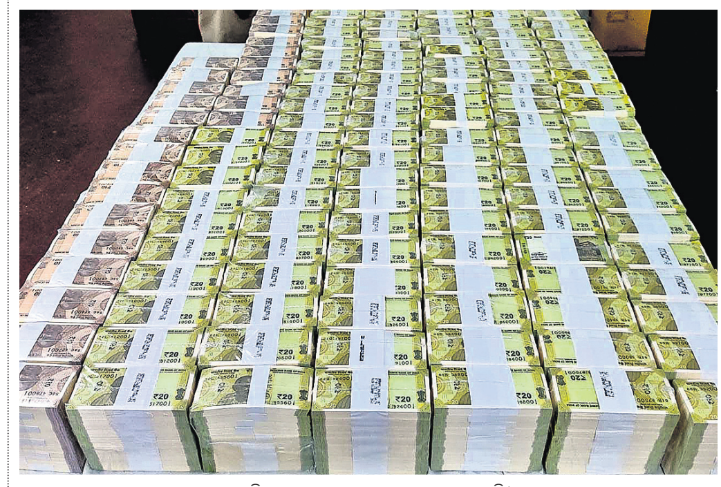
ଆର୍ବିଏସ୍ ଆନରେ କଟକ ଟଙ୍କାକୁ ଯାଞ୍ଚ କରାଯାଉଛି।

ପରିସରୀ ଆଦି ଶସ୍ୟ ନଷ୍ଟ ହେବା କାରଣରୁ ଚାଷୀଙ୍କୁ ଅସନ୍ତୋଷ ହେଉ ବୋଲି ରାଜ୍ୟ ସରକାର କ୍ଷତିପୂରଣ ଦେବା ପାଇଁ କୌଣସି ଯୋଷା କରୁନାହିଁ କି ପଦକ୍ଷେପ ଗ୍ରହଣ କରିନାହିଁ। ନଭେମ୍ବର ୧୯ରୁ ରାଜ୍ୟରେ ସମସ୍ତ ଧାନମଣ୍ଡି ଖୋଲାଯିବା ବ୍ୟବସ୍ଥା ଥିବା ସତ୍ତ୍ୱେ ବର୍ତ୍ତମାନ ବୁଝା ୮୦ ପ୍ରତିଶତ ଧାନମଣ୍ଡି ଖୋଲି ନାହିଁ। ଟୋକନ ଅବଧି ପୂରିବାକୁ ବସିଲାଣି। ମଣ୍ଡି ନ ଖୋଲିବାରୁ ମିଳିବାରୁ ଚାଷୀମାନଙ୍କୁ ଶୋଷଣ କରି ଧାନ କୁଳଖିଲ ପ୍ରତି ୧୦୦ରୁ ୧୨୦୦ ଟଙ୍କାରେ କିଣିଛନ୍ତି। ଅର୍ଥୁଆ, ଉତ୍ତୁନା କଥା କହି ଚାଷୀଙ୍କଠାରୁ ୧୦-୧୨ କେଜି କଟନା ଛତନା କରାଯାଇଛି। ବସ୍ତା, ପୁରୁଲି, ପରିବହନ ପାଇଁ କେନ୍ଦ୍ର ସରକାର ପ୍ରଦାନ କରୁଥିବା ଅର୍ଥୁକୁ ଲୁଚି କରାଯାଇଛି। ଗତ ୧୦ ବର୍ଷରେ ୨୨୦୦ କୋଟିରୁ ଉର୍ଦ୍ଧ୍ୱ ଟଙ୍କା ଲୁଚି କରାଯାଇଛି। ଚାଷୀ ଅସନ୍ତୋଷରୁ ବର୍ତ୍ତିତା ପୃଷ୍ଠା-୬