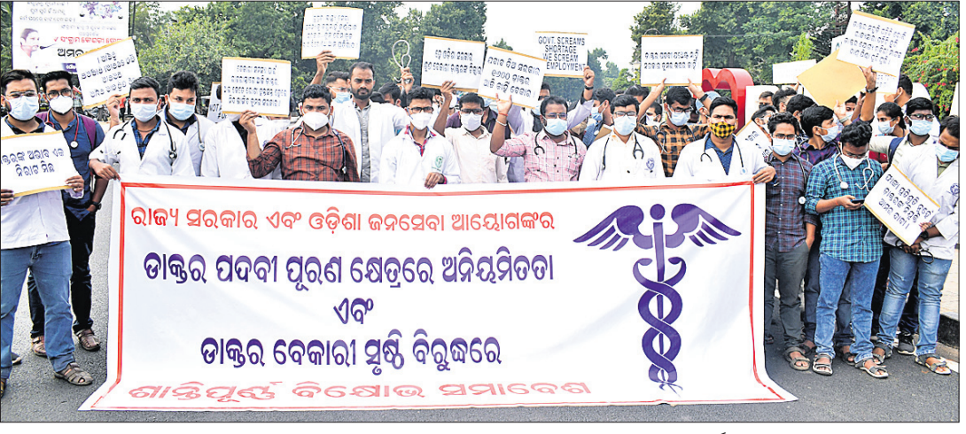
ଭୁବନେଶ୍ୱର ଲୋକସଭା ପିଏମ୍‌ଜିଠାରେ ରୁଧିରା ଅଣନିୟନ୍ତ୍ର ଡାକ୍ତରମାନେ ବିରୋଧ ପ୍ରଦର୍ଶନ କରୁଛନ୍ତି।

ଭୁବନେଶ୍ୱର, ୮୧୨ ସରକାର କରୁଛନ୍ତି ରାଜ୍ୟରେ ଡାକ୍ତର ନାହାନ୍ତି। କିନ୍ତୁ ଏପଡ଼େ ୧୬୦୦ ଡାକ୍ତର ବେକାର ହୋଇ ବସିଛନ୍ତି। ଏଭଳି ଅଭିଯୋଗ ଆଣି ବେକାର ବସିଥିବା ଡାକ୍ତରମାନେ ରୁଧିରା ଆୟୋଜନକୁ ଓହ୍ଲାଇଥିଲେ। ବିଧାନସଭା ସମ୍ମୁଖ ଲୋକସଭା ପିଏମ୍‌ଜିରେ ଧାରଣାରେ ବସିବା ସହ ବିରୋଧ ପ୍ରଦର୍ଶନ ମାଧ୍ୟମରେ ଦାବି ରଖୁଥିଲେ। ଓପିଏସ୍‌ସି ଦ୍ୱାରା ୨୦୧୧-୨୨ ପାଇଁ ଆସିଥିବା ନିୟୁତ୍ତିପତ୍ରକୁ ବାତିଲ କରିବା ସହ ଯଥାସମ୍ଭବ ନିୟୁତ୍ତି ପ୍ରକ୍ରିୟା ଆରମ୍ଭ କରିବା ଓ ପରୀକ୍ଷା ପରେ ଫ୍ରେଟ୍ ଲିଷ୍ଟ ଜାରି କରିବାକୁ ସେମାନେ ଦାବି କରିଛନ୍ତି।