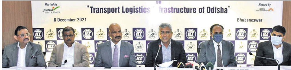
"Transport Logistics Infrastructure of Odisha" meeting in Bhubaneswar.

ରାଜ୍ୟର ସହକା, ରେଳପଥ, ଆକାଶଚାରୀ କଳାପଥ, ସୁର ପରିବହନ, ସାଧାରଣ ପରିବହନ, ବନ୍ଦର ଏବଂ ବିମାନ ଯୋଗାଯୋଗ ଭଳି ସମସ୍ତ ପ୍ରକାର ଲଜିଷ୍ଟିକ୍ସ ଉଦ୍ଦିଷ୍ଟକୁ ନେଇ ଇଣ୍ଡିଆନ ଗାୟର ଅଫ୍ କର୍ପୋ (ଆଇସିଏସି) ପକ୍ଷରୁ ଏକ ସର୍ବେକ୍ଷଣ କରିବାକୁ ନିଷ୍ପତ୍ତି ନିଆଯାଇଛି। ଏହି ସର୍ବେକ୍ଷଣ କାର୍ଯ୍ୟ କରିବା ପାଇଁ ଏକ ବ୍ୟାପକ ରିପୋର୍ଟ ପ୍ରସ୍ତୁତ କରିବା ଲାଗି ଓଡ଼ିଶା ସରକାର ଓ କେନ୍ଦ୍ରୀୟ ରାଷ୍ଟ୍ରୀୟ ସଂସ୍ଥା ରାଜ୍ୟର ଲିମିଟେଡ୍ ସହ ଆଇସିଏସି ହାତ ମିଳାଇଛି।