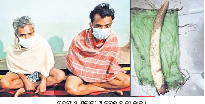
ଗିରଫ ୨ ଶିକାରୀ ଓ ଜବତ ହାତୀ ଦାନ୍ତ।

ଭୁବନେଶ୍ୱର, (ଭୁବନେଶ୍ୱର)/ ବଲାଙ୍ଗୀର ଅଫିସ, ୮୧୨ କଠୋର ଆଇନ ଓ ବାରମ୍ବାର ଚଢ଼ାଇ ସଫଳ ବନ୍ଦୀଗୁଡ଼ିକ ଶିକାର ଏବଂ ଚୋରା ଚାଲାଣ ବନ୍ଦ ହୋଇପାରି ନାହିଁ। ନଭେମ୍ବର ୧୪ରେ ବରଗଡ଼ ଜିଲ୍ଲା ପଲ୍ଲୀପୁର ଉପଖଣ୍ଡ କେନ୍ଦ୍ରଭାଗରେ କ୍ରାନ୍ତମୁଖୀର ଶେଖାଲ ଟାଏଲ୍ ଫୋର୍ସ (ଏସ୍‌ଟିଏଫ୍) ଚଢ଼ାଇ କରି ଜଣେ ଶିକାରୀଙ୍କୁ ଗିରଫ କରିବା ସହ ହାତୀଦାନ୍ତ ଜବତ କରିଥିଲା। ମଙ୍ଗଳବାର ବଲାଙ୍ଗୀରରୁ ଆଉ ଏକ ହାତୀଦାନ୍ତ ର୍ୟାକେଟ ଧରାପଡ଼ିଛି। ବନ ବିଭାଗ ସହାୟତାରେ ଏସ୍‌ଟିଏଫ୍ ଚିମ୍ବୁ ବଲାଙ୍ଗୀର ଜିଲ୍ଲା ରୁଷ୍ଟରା ଥାନା ରୁଡ଼େଇଲା ଗ୍ରାମ ନିକଟରେ ଚଢ଼ାଇ କରି ହାତୀ ଦାନ୍ତ ଜବତ କରିବା ସହ ଦୁଇଦିନରେ ୨ଜଣଙ୍କୁ ଗିରଫ କରିଛି। ଗିରଫ ଅଭିଯୁକ୍ତ ଦୁଇ ହେଲେ