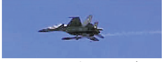
ବୁଧବାର- 'ବ୍ରହ୍ମୋସ' ସୁପରସୋନିକ୍ ଜୁଜ୍ କ୍ଷେପଣାସ୍ତ୍ର ସଫଳ ପରୀକ୍ଷଣ।