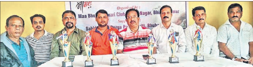
ଖବରଦାତା ସମ୍ମିଳନୀରେ କର୍ମକର୍ତ୍ତାମାନେ ଚୁନାବଳୀ ସମ୍ପର୍କରେ ସୂଚନା ଦେଉଛନ୍ତି।

ଉପଯୋଗୀ ହୋଇଥାଏ। ତାଙ୍କ ସ୍ଥାନରେ ଅକ୍ଷୟ ପଟେଲ ଥିଲେ କିପାରି, ମାତ୍ର ସେ ମଧ୍ୟ ଆହତ ସମସ୍ୟା ଯୋଗୁ ବାଦ ପଡ଼ିଛନ୍ତି। ଏ କ୍ଷେତ୍ରରେ ରବିବନ୍ଦ୍ର ଅକ୍ଷୟ ଓ ଜୟଦିତ୍ତ ଯାଦବଙ୍କ ଉପରେ ଗୁରୁତ୍ୱ ଦିଆ ହେବ। ଏବେ ଭାରତୀୟ 'ଏ' ଦଳ ସହ ଦକ୍ଷିଣ ଆଫ୍ରିକା ଗସ୍ତରେ ଥିବା ଉତ୍ତର ପ୍ରଦେଶ ବାମହାତୀ ସିନିତ ଓ ବ୍ୟାଟର ସୌରଭ କୁମାରଙ୍କୁ ଷ୍ଟାଣ୍ଡବାଲରେ ରଖା ଯାଇଛି। ସେଠାରେ ସେ ଭଲ ପ୍ରଦର୍ଶନ କରୁଥିବାରୁ ଆଗାମୀ ସିରିଜରେ ଯଦି ସେ ପୂର୍ଣ୍ଣ ଦଳରେ ସାମିଲ ହୁଅନ୍ତି ତେବେ ଆଶ୍ଚର୍ଯ୍ୟ ହେବାର କିଛି ନାହିଁ। ଭାରତୀୟ ଚେଷ୍ଟା ଦଳ: ବିରାଟ କୋହଲି (ଅଧିନାୟକ), ରୋହିତ ଶର୍ମା (ଉପ-ଅଧିନାୟକ), ଲୋକେଶ ରାହୁଲ, ମୟଙ୍କ ଅଗ୍ରୱାଲ, ଚେଷ୍ଟାରେ ପୂଜାରୀ, ଅଧିକାରୀ ରାହାନେ, ଶ୍ରେୟାସ ଆୟାର, ହର୍ମୁଦା ବିହାରୀ, ରିଷଭ ପଟ୍ଟ (ଉଇକେଟ କିପର), ରିକିମାନ ଶାହା (ଉଇକେଟ କିପର), ରବିବନ୍ଦ୍ର ଅକ୍ଷୟ, ଜୟଦିତ୍ତ ଯାଦବ, ଲକ୍ଷ୍ମଣ ଶର୍ମା, ମହମ୍ମଦ ସାମି, ଉମେଶ ଯାଦବ, ଯଶପ୍ରୀତ୍ କୁମାର, ଶାନ୍ତନୁ ଠାକୁର, ମହମ୍ମଦ ସିରାଜ। ଷ୍ଟାଣ୍ଡବାଲ ଖେଳାଳି: ନବଦୀପ ସଜନୀ, ସୌରଭ କୁମାର, ଦୀପକ ଚହର, ଆର୍ଜୁନ ନାୟାସାଲ।