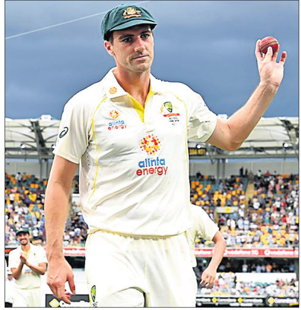
୫ ଉଇକେଟ ସଫଳତା ହାସଲ ପରେ ପ୍ୟାର୍ କୁମ୍ଭୀରୁ।

କ୍ରିକେଟ, ୮୧୨ ଇଂଲଣ୍ଡ ଓ ଘରୋଇ ଅଷ୍ଟ୍ରେଲିଆ ମଧ୍ୟରେ ଆଶେସ ସିରିଜ କୁଧବାରଠାରୁ ଆରମ୍ଭ ହୋଇଛି। ଘାମାୟ ଗାବା ଷ୍ଟୁଡିଓମରେ ଆରମ୍ଭ ହୋଇଥିବା ସିରିଜର ପ୍ରଥମ ଟେଷ୍ଟରେ ଘରୋଇ ବୋଲରଙ୍କ ଆଧିପତ୍ୟ ଦେଖିବାକୁ ମିଳିଛି। ପ୍ରଥମ ଆଶେସ ଟେଷ୍ଟ ଏକ ଜିତି ଇଂଲଣ୍ଡ ଅଧିନାୟକ ଜେ ରୁଟ୍ ରୁଟ୍ ପ୍ରଥମେ ବ୍ୟାଟିଂ ନିଷ୍ପତ୍ତି ନେଇଥିଲେ। ସିରିଜର ପ୍ରଥମ ବଲ୍ରେ ଓପନର ରୋରି ବର୍ଡ୍ ଆଉଟ ହୋଇଥିଲେ। ବ୍ୟାଟିଂ ନିଷ୍ପତ୍ତି ଇଂଲଣ୍ଡ ପାଇଁ କୁମ୍ଭୀରୀ ସାବ୍ୟସ୍ତ ହୋଇଥିଲା। ଇଂଲଣ୍ଡ ପ୍ରଥମ ଦିନରେ ବିପର୍ଯ୍ୟୟର ସମ୍ମୁଖୀନ ହୋଇ ପ୍ରଥମ ଇନିଂସରେ ୫୦.୧ ଓଭରରେ ୧୪୭ ରନକରି ଅଲ୍ ଆଉଟ ହୋଇଛି। ଅଷ୍ଟ୍ରେଲିଆ ଦ୍ରୁତ ବୋଲରଙ୍କ ସମ୍ମୁଖୀନ ହୋଇପାରି ନ ଥିଲେ ଇଂଲଣ୍ଡ ବ୍ୟାଟ୍ସମ୍ୟାନ। ପ୍ୟାର୍ କୁମ୍ଭୀରୁ ଅତିମ ଘଟି ଉଇକେଟ ନେବା ସହ ମୋର୍ଟ ୫ ଉଇକେଟ ସଫଳତା ପାଇଛନ୍ତି। ଏଥିସହ ସେ ଏକାଧିକ ରେକର୍ଡ ହାସଲ କରିଛନ୍ତି। ଇଂଲଣ୍ଡ ଅଲ୍ ଆଉଟ ହେବା ପରେ ଗାବାରେ ପ୍ରବଳ ବର୍ଷା, ଘଟପଟ ହୋଇଥିଲା। ଖରାପ ଆଲୋକ କାରଣରୁ ଏହାପରେ ଖେଳ ସମ୍ପର୍କ ହୋଇ ନ ଥିଲା। ମ୍ୟାର୍ ଆରମ୍ଭରୁ ଇଂଲଣ୍ଡ ଟେକା ଖାଲିଥିଲା। ମ୍ୟାର୍ରେ ପ୍ରଥମ ବଲ୍ରେ ଓପନର ବର୍ଡ୍ ଖାତା ଖୋଲିବା ପୂର୍ବରୁ ମିଡେଲ ଷ୍ଟାକ୍ ବାବା କ୍ଲିନ୍ ବୋଲ୍