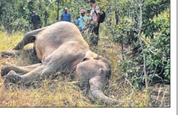
ବିଦ୍ୟୁତ୍ ତାର ସଂକ୍ଷରଣରେ ଆସି ମାଛ ହାତୀ ମୃତ।

କେନ୍ଦୁଝର, ୮୧୨ (ସ.ପ୍ର./ଡି.ଏନ.ଏ.) କେନ୍ଦୁଝର ସଦର ରେଞ୍ଜ ନରଗପୁର ସେକ୍ଟର ଅନ୍ତର୍ଗତ ନେକଟାଘର ନିକଟ ନରଗପୁର ସଂରକ୍ଷିତ ଜଙ୍ଗଲରେ ୩୩ କେଜି ବିଦ୍ୟୁତ୍ ତାର ସଂକ୍ଷରଣରେ ଆସି ଏକ ମାଛ ହାତୀର ମୃତ୍ୟୁ ହୋଇଛି। ସଦର ବୃକ୍ଷ ଗୁହାଳଚରୁଆ ଗ୍ରାମ ପଛୁ ୧୮୦୮୩ ହାତୀପଲ ମଙ୍ଗଳବାର ରାତିରେ ନରଗପୁର ସଂରକ୍ଷିତ ଜଙ୍ଗଲ ବେଇ ଗାଁ ଭିତରକୁ ଆସିଥିବା ବେଳେ ଏହି ଅଘଟଣ ଘଟିଥିଲା। ମୃତ ମାଛ ହାତୀର ସମୟ ୧୫ରୁ ୨୦ ବର୍ଷ ହେବ ବୋଲି ଆକଳନ କରାଯାଇଛି। ବିଦ୍ୟୁତ୍ ଖୁଣ୍ଟର ଇନସୁଲେଟରକୁ କଣ୍ଠକୂର ବାହାରି ଯାଇଥିବାରୁ ଏହା ଚାକି ହୋଇଯାଇଥିଲା। ବିଦ୍ୟୁତ୍ ଆଘାତରେ ହାତୀଟି ଛତାପତ ହୋଇ ମୃତ୍ୟୁବରଣ କରିଥିଲା। ସୌଭାଗ୍ୟବଶତଃ ଅନ୍ୟ ହାତୀମାନେ ବଞ୍ଚିଯାଇଥିଲେ। ହାତୀପଲରେ ୪ଟି ଦନ୍ତା, ୧୦ଟି ମାଠ ଓ ୪ଟି ଛୁଆ ହାତୀ ଥିବା ପୂର୍ବରୁ ବିଦ୍ୟୁତ୍ ବିଭାଗ ଏବଂ ଜଙ୍ଗଲ ବିଭାଗକୁ ସୂଚନା ଦିଆଯାଇଥିଲା। ଏହା ସତ୍ତ୍ୱେ ବିଦ୍ୟୁତ୍ ବିଭାଗ ପକ୍ଷରୁ ଲାଇଟ୍ କରାଯାଇ ନ ଥିଲା। ଫଳରେ ଏଭଳି ଅଘଟଣ ଘଟିଲା ବୋଲି ଗ୍ରାମୀଣ ଲୋକ ଅଭିଯୋଗ କରିଛନ୍ତି।