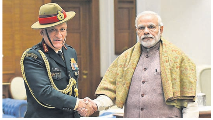
ପ୍ରଧାନମନ୍ତ୍ରୀ ନରେନ୍ଦ୍ର ମୋଦିଙ୍କ ସହ ବିପିନ ରାଓଙ୍କୁ ।

ଭାରତୀୟ ସ୍ତ୍ରୀକର୍ମଚାରୀ ପୂର୍ବତନ ମୁଖ୍ୟ ଜେନେରାଲ ବିପିନ ରାଓଙ୍କୁ ଅବସର ପରେ ତତ୍କାଳ ଦେଶର ପ୍ରଥମ ଟିଏ ଅଫ ଡିଫେନ୍ସ ଷ୍ଟାଫ୍ (ସିଡିଏସ୍) ନିଯୁକ୍ତ କରାଯାଇଥିଲା । ସେ ପ୍ରତ୍ୟକ୍ଷ ଭାବେ କୌଣସି ମୁକ୍ତ ଲଢ଼ି ନ ଥିଲେ ହେଁ ତିନି ସଶସ୍ତ୍ର ବାହିନୀର ସର୍ବୋଚ୍ଚ ପଦବୀ ଅଧିକାର କରିବାର ସୁଯୋଗ ପାଇଥିଲେ । ଦୁଇଜଣ ସେନା ଅଧିକାରୀଙ୍କ ବରିଷ୍ଠତାକୁ ଶ୍ରଦ୍ଧା ଦେଖା କରି ତାଙ୍କୁ ନିଲିତ୍ୱ ନିଯୁକ୍ତି ପଛରେ ରାଜନୈତିକ ପୁଷ୍ପପୋଷକତା କାମ କରିଥିବା ବିବେଚନା କରାଯାଏ । ପ୍ରଧାନମନ୍ତ୍ରୀ ନରେନ୍ଦ୍ର ମୋଦିଙ୍କ ସହ ଘନିଷ୍ଠତା ଓ ଭାଜପାକୁ ସୁହାଇଲା ଭଳି ମନ୍ତବ୍ୟ ଦେଇ ରାଓଙ୍କୁ ଅନେକ ସମୟରେ ବିବାଦୀୟ ହୋଇଥିଲେ । ସେନାରେ ଥିବା ପଦାଧିକାରୀମାନେ କୌଣସି ରାଜନୈତିକ ମନ୍ତବ୍ୟ ଦେଇପାରିବେ ନାହିଁ ବୋଲି ଆର୍ମି ରୁଲ୍, ୧୯୫୪ର ଚାପୁର ୪ରେ ବାରଣ କରାଯାଇଛି । ଏହାସତ୍ତ୍ୱେ ଜେନେରାଲ ରାଓଙ୍କୁ ତାଙ୍କ ୪୨ ବର୍ଷର କ୍ୟାରିୟରରେ ଅନେକ ରାଜନୈତିକ ମନ୍ତବ୍ୟ ଦେଇ ବିରୋଧୀଙ୍କ ସମାଲୋଚନାର ଶିକାର ହୋଇଥିଲେ । ଏପରି କି ପଡ଼ୋଶୀ ପାକିସ୍ତାନ, ଚାଇନା ଓ ମ୍ୟାନ୍ମାର ବିରୋଧରେ ରାଓଙ୍କୁ ମନ୍ତବ୍ୟ ତାଙ୍କୁ ବିବାଦ ଘେରକୁ ଚାଣିନେଇଥିଲା । ଏସବୁକୁ ଅନୁଧ୍ୟାନ କଲେ ସ୍ବର୍ଗତ ରାଓଙ୍କ ଜଣେ ପଲିଟିକାଲ୍ ଜେନେରାଲ୍ ଥିଲେ ବୋଲି ମନେହୁଏ ।