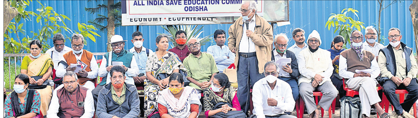
ଭାଜପା ଶିଖାମତି ୨୦୨୦ ପ୍ରତ୍ୟାହାର ଦାବିରେ ରୁଧିର ସର୍ବଭାରତୀୟ ପ୍ରତିବାଦ ଦିବସ ପରିପ୍ରେକ୍ଷାରେ ଅଲ ଇଣ୍ଡିଆ ସେବା ଏକ୍ସକେନ କମିଟି ପକ୍ଷରୁ ଭୁବନେଶ୍ୱରରେ ରାଜ୍ୟପାଳ ପ୍ରଫେସର ଗଣେଶୀ ଲାଲଙ୍କୁ ଦାବିପତ୍ର ପ୍ରଦାନ ପୂର୍ବରୁ ରାଜଭବନ ସମ୍ମୁଖରେ ଧାରଣା ଦିଆଯାଇଛି।

ଗୁରୁତ୍ୱାରୋପ କରିଥିଲେ। ଏହି ଅବସରରେ ଆୟୋଜିତ ମିଶ୍ରଣ ପର୍ବରେ ନିମାପଡ଼ା ବ୍ଲକର ବିଭିନ୍ନ ପଞ୍ଚାୟତର ଶତାଧିକ ବିଜେଡି ଓ କଂଗ୍ରେସ କର୍ମୀ ଦଳ ତ୍ୟାଗ କରି ଭାଜପାରେ ସାମିଲ ହୋଇଛନ୍ତି। ଏହି କର୍ମୀମାନଙ୍କୁ ଅତିଥିମାନେ ଉତ୍ତରାୟ ଦେଇ ସ୍ୱାଗତ ସମ୍ବର୍ଦ୍ଧନା ଜଣାଇଥିଲେ। ଏହି ସମାରୋହରେ ବିଭିନ୍ନ ମଣ୍ଡଳର ସଭାପତି, କାର୍ଯ୍ୟକର୍ତ୍ତାଙ୍କ ସମେତ ୫୫ରୁ ଉର୍ଦ୍ଧ୍ୱ ନେତୃବୃନ୍ଦ ଓ କର୍ମୀ ଯୋଗଦେଇଥିଲେ।