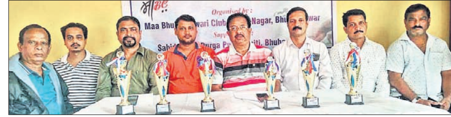
ଖବରଦାତା ସମ୍ମିଳନୀରେ କର୍ମକର୍ତ୍ତାମାନେ ଚୁନାବେଳେ ସମ୍ପର୍କରେ ସୂଚନା ଦେଇଛନ୍ତି।

ଭୁବନେଶ୍ୱର, ୮ ଡିସେମ୍ବର (କ୍ରୀଡ଼ା ପ୍ରତିନିଧି): ମା' ଭୁବନେଶ୍ୱରୀ କ୍ଲବ ଆନୁକୁଲ୍ୟରେ ଚଳିତ ମାସ ୧୧ ଓ ୧୨ ତାରିଖ ଦୁଇଦିନଧରି ସହସ୍ରାଳୟ ଚୁନାବେଳେ କର୍ମକର୍ତ୍ତାମାନେ ଚୁନାବେଳେ ସମ୍ପର୍କରେ ସୂଚନା ଦେଇଛନ୍ତି। ଭୁବନେଶ୍ୱରୀ କ୍ଲବ ଆନୁକୁଲ୍ୟରେ ଚଳିତ ମାସ ୧୧ ଓ ୧୨ ତାରିଖ ଦୁଇଦିନଧରି ସହସ୍ରାଳୟ ଚୁନାବେଳେ କର୍ମକର୍ତ୍ତାମାନେ ଚୁନାବେଳେ ସମ୍ପର୍କରେ ସୂଚନା ଦେଇଛନ୍ତି। ଭୁବନେଶ୍ୱରୀ କ୍ଲବ ଆନୁକୁଲ୍ୟରେ ଚଳିତ ମାସ ୧୧ ଓ ୧୨ ତାରିଖ ଦୁଇଦିନଧରି ସହସ୍ରାଳୟ ଚୁନାବେଳେ କର୍ମକର୍ତ୍ତାମାନେ ଚୁନାବେଳେ ସମ୍ପର୍କରେ ସୂଚନା ଦେଇଛନ୍ତି।