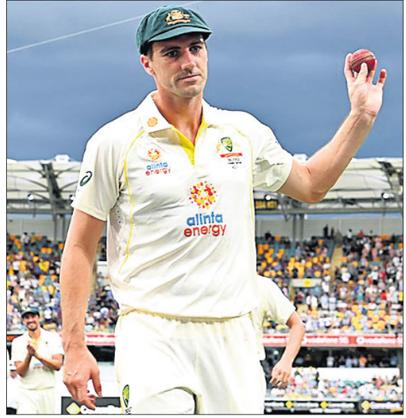
୫ ଉଇକେଟ ସଫଳତା ହାସଲ ପରେ ପ୍ୟାର୍ କୁମ୍ଭୀର।

ବ୍ରସବେନ, ୮୧୨ ଇଂଲଣ୍ଡ ଓ ଘରୋଇ ଅଷ୍ଟ୍ରେଲିଆ ମଧ୍ୟରେ ଆଶେସ ସିରିଜ କୁଧବାରଠାରୁ ଆରମ୍ଭ ହୋଇଛି। ଘାମାୟ ଗାବା ଷ୍ଟୁଡିଓମରେ ଆରମ୍ଭ ହୋଇଥିବା ସିରିଜର ପ୍ରଥମ ଟେଷ୍ଟରେ ଘରୋଇ ବୋଲରଙ୍କ ଆଧିପତ୍ୟ ଦେଖିବାକୁ ମିଳିଛି।