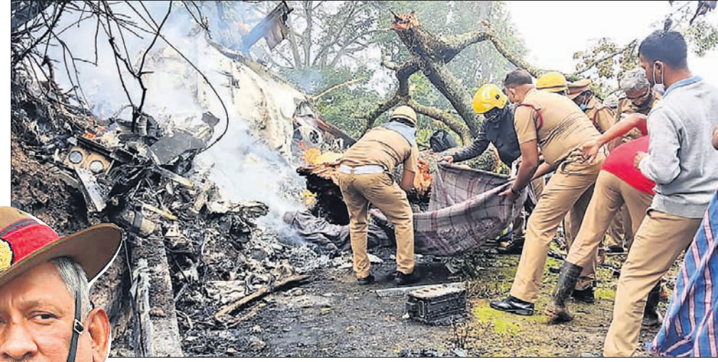
ଦୁର୍ଘଟଣାସ୍ଥଳରେ ଚାଲିଥିବା ଉଦ୍ଧାର କାର୍ଯ୍ୟ ।

ଏମ୍. ଭେକାୟା ନାଲଡୁ, ପ୍ରଧାନମନ୍ତ୍ରୀ ନରେନ୍ଦ୍ର ମୋଦି ଓ କଂଗ୍ରେସ ନେତା ରାହୁଲ ଗାନ୍ଧୀଙ୍କ ସମେତ ବହୁ ବିଶିଷ୍ଟ ବ୍ୟକ୍ତି ଗତାବ୍ଦି ଶୋକ ବ୍ୟକ୍ତ କରିବା ସହ ମୃତକଙ୍କ ପରିବାରକୁ ସମବେଦନା ଜଣାଇଛନ୍ତି। ୬୩ ବର୍ଷୀୟ ଜେନେରାଲ ବିପିନ ରାଓଙ୍କୁ ୨୦୧୯ ଡିସେମ୍ବର ୩୧ରେ ଭାରତର ୨୬ତମ ଗୃହସେନା ମୁଖ୍ୟ ପଦକୁ ଅବସର ନେବାର ଦିନକ ପରେ ପ୍ରଥମ ସିଡିଏସ୍ ଭାବେ ଦାୟିତ୍ଵ ଗ୍ରହଣ କରିଥିଲେ। ପ୍ରତିରକ୍ଷା ବଳର ଆଧୁନିକୀକରଣରେ ମୁଖ୍ୟ ଭୂମିକା ନେଇଥିବା ରାଓଙ୍କୁ ରୁଧିରା ସମାଜେ ତାଙ୍କ ସ୍ତ୍ରୀ ଓ ବ୍ୟକ୍ତିଗତ ପୁରୁଣା ଅଧିକାରୀମାନଙ୍କ ସହ ଚାମିଲନାପୁର ନାକରିରି ପର୍ବତମାଳା ପୁଷ୍ପା-୪