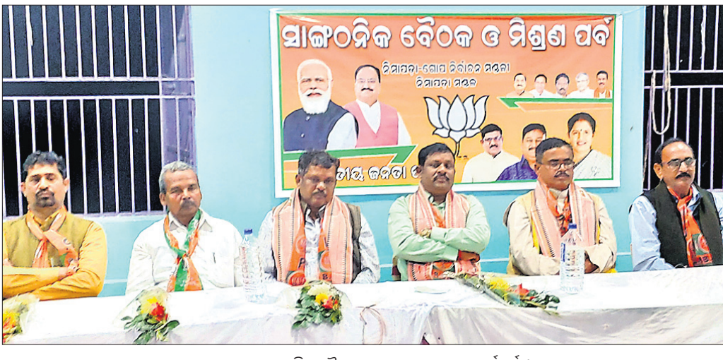
ଭାଜପାର ସାଙ୍ଗଠନିକ ବୈଠକରେ ଯୋଗଦେଇଥିବା କର୍ମକର୍ତ୍ତା