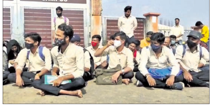
ଲାଲବେରୀ, ଲବରୋଗାଠାରେ ସମସ୍ତ ଜିନିଷ ଉପଲବ୍ଧ ରହିବା ପାଇଁ ମଧ୍ୟ ଦାବି କରିଛନ୍ତି। ବିଭିନ୍ନ ସମସ୍ୟା ନେଇ କ୍ୟାମ୍ପସର ନିବେଶକଙ୍କୁ ଅବଗତ କରାଇଥିଲେ।

କେନ୍ଦ୍ରୁର, ୮୧୨ (ସ.ପ୍ର./ଡି.ଏନ.ଏ.) କେନ୍ଦ୍ରୁର ଠାରେ ଥିବା ଉତ୍ତରଓଡ଼ିଶା ବିକ୍ଷୟ ବିଦ୍ୟାଳୟ ବିତ୍ରୀୟ କ୍ୟାମ୍ପସରେ ପ୍ରଥମ ବର୍ଷର ଛାତ୍ରଛାତ୍ରୀମାନେ ବିଭିନ୍ନ ଦାବି ନେଇ ବୁଧବାର କ୍ୟାମ୍ପସର ଗେଟ ବନ୍ଦ କରି ଧାରଣା ଦେଇଛନ୍ତି। ଫର୍ମ ପୂରଣ ପାଇଁ ମାତ୍ର ଦୁଇ ଦିନ ସମୟ ଦିଆଯାଇଛି। ତା'ସହିତ ଚଳିତବର୍ଷ ଫିସ୍ ବୃଦ୍ଧିକୁ ନେଇ ଛାତ୍ରଛାତ୍ରୀଙ୍କ ମଧ୍ୟରେ ଅସନ୍ତୋଷ ଦେଖାଦେଇଛି। ଏଠାରେ ୪ଟି ବିଭାଗରେ ପ୍ରଥମ ଓ ବିତ୍ରୀୟ ବର୍ଷ ପାଇଁ ପ୍ରାୟ ୩୦୦ରୁ ଊର୍ଦ୍ଧ୍ୱ ଛାତ୍ରଛାତ୍ରୀ ପଢ଼ୁଥିଲେ। କ୍ୟାମ୍ପସରେ ହଷ୍ଟେଲ ଥାଇ ମଧ୍ୟ ଛାତ୍ରଛାତ୍ରୀଙ୍କୁ ରହିବାକୁ ଦିଆଯାଇନାହିଁ। ଉଚ୍ଚତ ମାନର