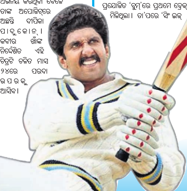
ଚଳଚ୍ଚିତ୍ର '୮୩'ରେ ରଣବୀର

ବହୁ ପ୍ରତୀକ୍ଷିତ ବାୟୋପିକ୍ '୮୩' ଏବେ ପୁଣି ଥରେ ଚର୍ଚ୍ଚାରେ । କାରଣ ଏଥିରେ ସଂଯୋଜିତ ଗୀତ 'ଲେହେରା ଦୋ' ବର୍ତ୍ତମାନ ବେଶ୍ ଭାଇଭାଇ ହୋଇଛି । ୧୯୮୩ ଭାରତୀୟ କ୍ରିକେଟ ଇତିହାସରେ ସ୍ଵର୍ଣ୍ଣକାଳରେ ଲିପିବଦ୍ଧ ହୋଇ ରହିବ । ଏହି ବର୍ଷ ଭାରତ ପ୍ରଥମ ଥର ପାଇଁ ବିଶ୍ଵକପ୍ ହାସଲ କରିଥିଲା ଏବଂ ଏହି ଦଳର ନେତୃତ୍ଵ ନେଇଥିଲେ ଅଲରାଉଣ୍ଡର କପିଳଦେବ । ତାଙ୍କ ଜୀବନୀକୁ ନେଇ ନିର୍ମିତ ଫିଲ୍ମ '୮୩'ରେ ଏପରି ଏକ ଦେଶାତ୍ମବୋଧକ ଗୀତ ଦେଖିବାକୁ ମିଳିବ । ଭାରତ କପ୍ ଜିତିବା ପରେ ପାଳନ କରାଯାଉଥିବା ବିଜୟ ଉତ୍ସବକୁ ନେଇ ଏ ହି । ର ଦୃଶ୍ୟାୟନ କରାଯାଇଛି ।