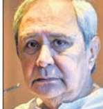
ନବୀନ ପଟ୍ଟନାୟକ, ମୁଖ୍ୟମନ୍ତ୍ରୀ

ହେଲିକପ୍ଟର ଦୁର୍ଘଟଣାରେ ଚିତ୍ ଅଫ୍ ଡିଫେନ୍ସ୍ ଷ୍ଟାଫ୍(ସିଡିଏସ୍) ବିପିନ ରାଓଙ୍କ ସମେତ ୧୩ ଜଣଙ୍କର ମୃତ୍ୟୁ ଘଟିଛି। ସିଡିଏସ୍ ରାଓଙ୍କ ପ୍ରାଣହୀନ ଦେଶ ପାଇଁ ଏକ ଅପୂରଣୀୟ କ୍ଷତି। ଶୋକସନ୍ତପ୍ତ ପରିବାରବର୍ଗଙ୍କୁ ସମବେଦନା ଜଣାଇଛି। ଆହତ ବ୍ୟକ୍ତିଙ୍କ ଆଶୁ ଆରୋଗ୍ୟ କାମନା କରୁଛି।