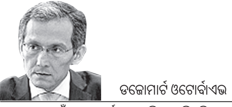
ଡକ୍ଟୋରାଟ୍ ଓ ଟୋପିକାଲ