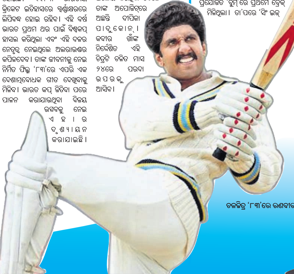
ଚଳଚ୍ଚିତ୍ର '୮୩'ରେ ରଣବୀର