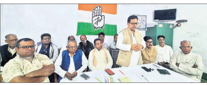
ଖବରଦାତା ସମ୍ମିଳନୀରେ ଉପସ୍ଥିତ କଂଗ୍ରେସ ନେତାମାନେ।