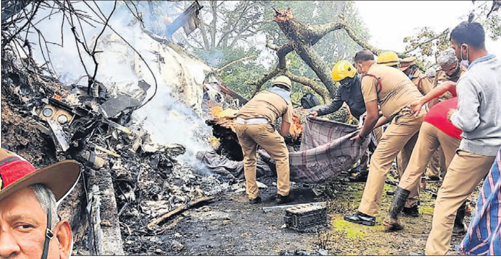
ଦୁର୍ଘଟଣାସ୍ଥଳରେ ଚାଲିଥିବା ଉଦ୍ଧାର କାର୍ଯ୍ୟ ।