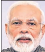
ନରେନ୍ଦ୍ର ମୋଦି, ପ୍ରଧାନମନ୍ତ୍ରୀ

ସିଡିଏସ୍ ଜେନେରାଲ ବିପିନ ରାଓଙ୍କ ଜଣେ ଅଭିଭାବକ ଯୋଗା ଥିଲେ। ଜଣେ ପ୍ରକୃତ ଦେଶଭକ୍ତ ଭାବେ ସମସ୍ତଙ୍କର ଆଧୁନିକୀକରଣ କ୍ଷେତ୍ରରେ ତାଙ୍କ ଅବଦାନ ଦେଶବାସୀଙ୍କ ପାଇଁ ସ୍ମରଣୀୟ ହୋଇରହିବ। ରାଓଙ୍କ ପରଲୋକରେ ଗଭୀର ମର୍ମାହତ।