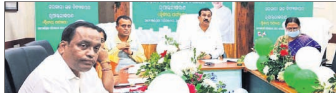
ଭିଡିଓ କନ୍ଫରେନ୍ସରେ ଉପସ୍ଥିତ ଅଧିକାରୀମାନେ।