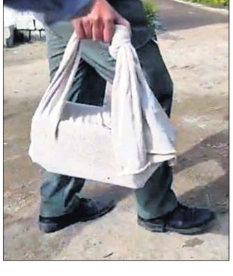
ରାଜ୍ୟ ସମ୍ବନ୍ଧରେ ହେଉଛି ଏୟାରମେଣ୍ଟରେ ସଂଲଗ୍ନ କରାଯାଇଥିବା ଏକ ଉପକରଣ। ହେଲିକପ୍ଟର ବା ବିମାନ ଦୁର୍ଘଟଣାଗ୍ରସ୍ତ ହେଲେ ତାହା ସମ୍ପୂର୍ଣ୍ଣ ରୂପେ ଭାଙ୍ଗିଯିବ ବୋଲି କୁହାଯାଇଛି। ରାଜ୍ୟ ସମ୍ବନ୍ଧରେ ପୂର୍ଣ୍ଣାବସ୍ଥାରେ କିଛି ଅନୁଧ୍ୟାନ କରିବା ପରେ ହେଲିକପ୍ଟର ଦୁର୍ଘଟଣାରେ ପ୍ରକୃତ କାରଣ ଜଣାପଡ଼ିବ।