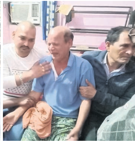
ଚାକଚର କୁଳ କଣ୍ଠାଳ ପଞ୍ଚାୟତର କୃଷ୍ଣଚନ୍ଦ୍ରପୁର ନୂତନ ଯବାନଙ୍କ ଘର ସମ୍ମୁଖରେ ନାରବତାର ବାତାବରଣ।