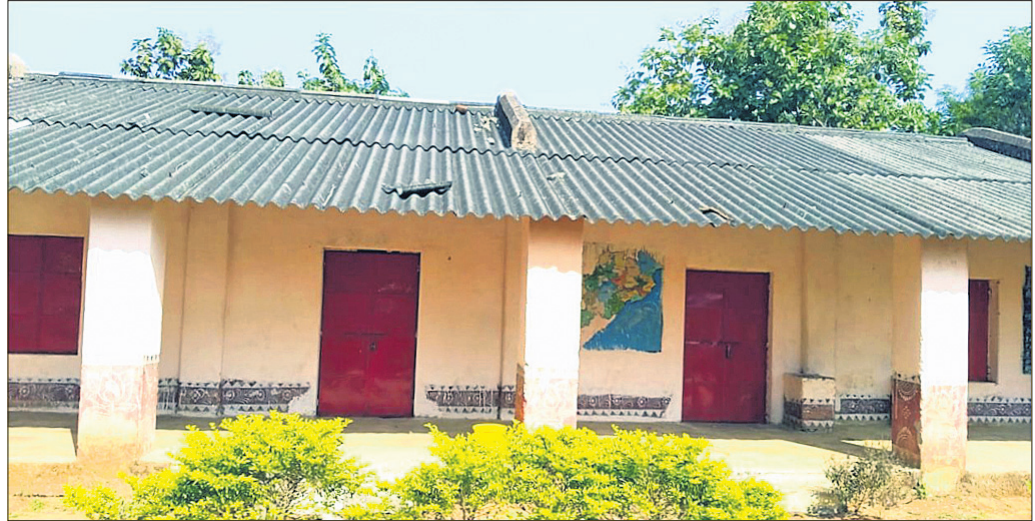
ସମ୍ବଲପୁର ଜିଲାର ସ୍ନାତ୍ତ୍ୱ ଯୋଜନାରେ ନିଆଯାଇଥିବା ଏକ ସ୍କୁଲ।

ପୂର୍ବଭଳି ଅସମ୍ପୂର୍ଣ୍ଣ ସ୍କୁଲ ପରିବେଶ ଟଙ୍କା ନ ମିଳିବାରୁ ଠିକାଦାରଙ୍କ ପଛଘୁଆ