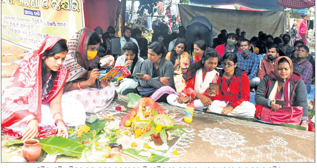
ଓଡ଼ିଶା କନିଷ୍ଠ ଶିକ୍ଷକ ସଂଘ ପକ୍ଷରୁ ଭୁବନେଶ୍ୱର ସିଏମ୍‌ସିଠାରେ ଗୁରୁବାର ଧାରଣାସ୍ଥଳରେ ମାଣ ବସାଯାଇଛି।

ରାଜ୍ୟ ସରକାରଙ୍କ ୫-ଟି ବିଭାଗ ପରିଚାଳନାରେ ହାଇସ୍କୁଲ ରୂପାନ୍ତରଣ କରାଯାଇଛି। ଘରୋଇ ସ୍କୁଲ ଭଳି ସମସ୍ତ ସୁବିଧା ଯୋଗାଇ ଦେବାକୁ ଯୋଜନା କରାଯାଇଛି।