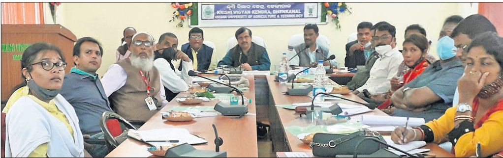
ବୈଠକରେ ଉପସ୍ଥିତ ବିଭିନ୍ନ ବିଭାଗର ବିଶେଷଜ୍ଞମାନେ।