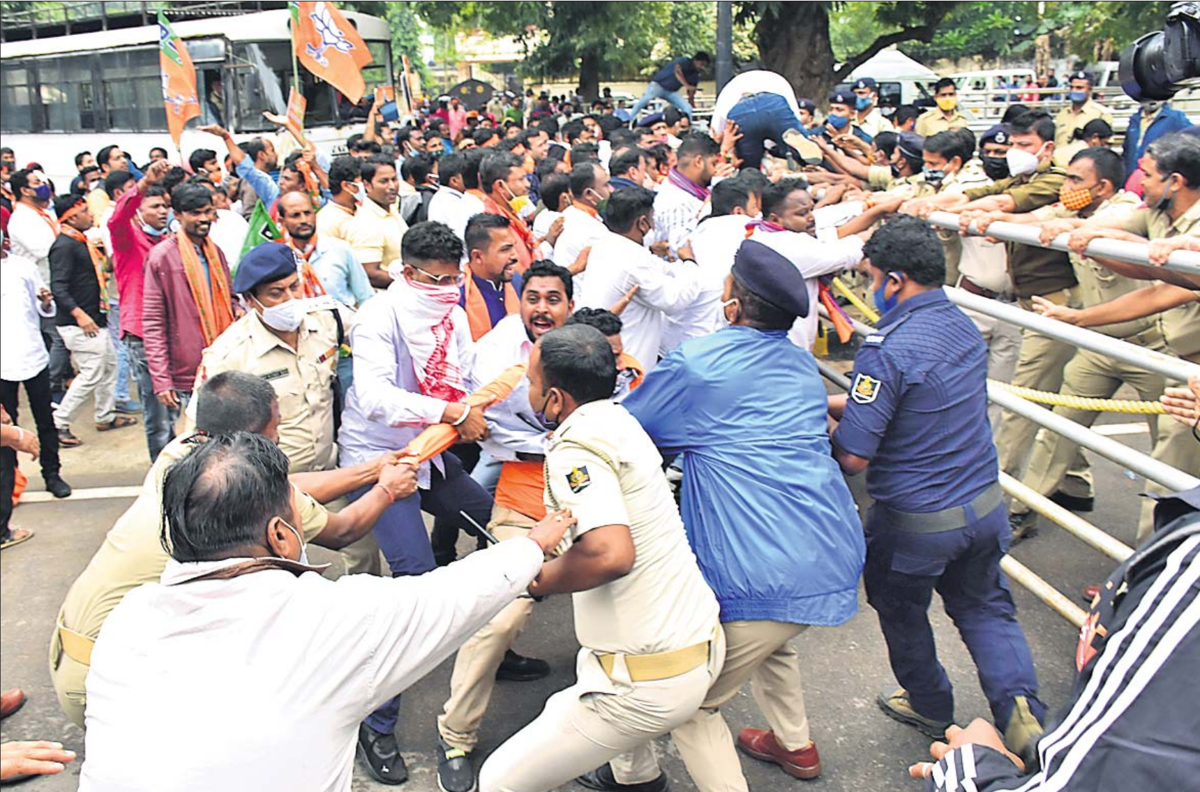
ମନିତା ମେହେର ହତ୍ୟା ଘଟଣାକୁ ନେଇ ଭାଜପା ଯୁବମୋର୍ଚ୍ଚା ପକ୍ଷରୁ ଗୁରୁବାର ବିଧାନସଭା ଘେରାଇ ଉଦ୍ୟମବେଳେ ଭୁବନେଶ୍ୱର ଲୋୟର ପିଏମ୍‌ଜିରେ ପୋଲିସ୍ ସହ ମୁହାଁମୁହିଁ।