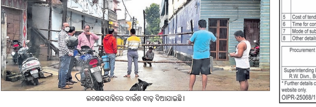
କଣ୍ଠେନମେଣ୍ଟ ବାରିକ ବାଡ଼ି ଦିଆଯାଇଛି।