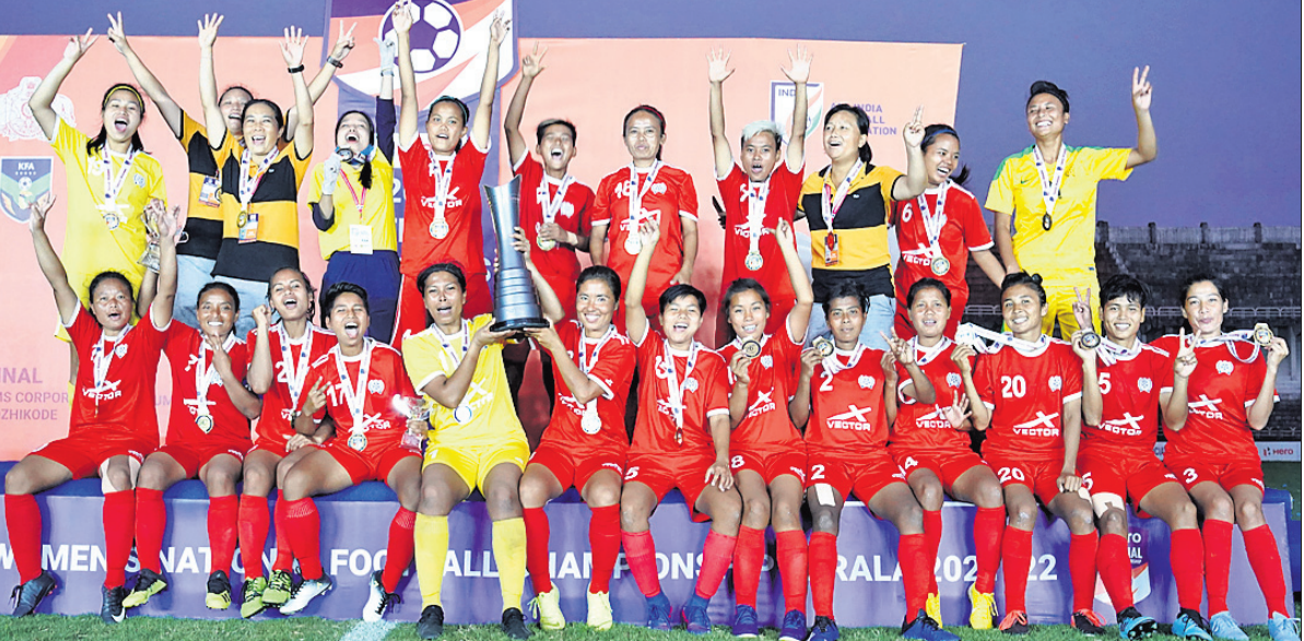
କାତୀୟ ସିନିୟର ମହିଳା ଫୁଟବଲ ଚାମ୍ପିୟନଶିପ୍‌ରେ ଚାଲିଚାଲି ବିଜୟୀ ମଣିପୁର ଦଳ ଗ୍ରୁପ୍ ସହ।

ସଂକ୍ଷିପ୍ତ ସ୍ଵାଭାବ ଇଂଲଣ୍ଡ ପ୍ରଥମ ଇନିଂସ୍- ୫୦.୧ ଓଭରରେ ୧୪୭ ଅଲଆଉଟ୍। ଅଷ୍ଟ୍ରେଲିଆ ପ୍ରଥମ ଇନିଂସ୍- ୮୪ ଓଭରରେ ୩୪୩/୭ (ଗ୍ରାଭିସ୍ ହେଡ୍- ୧୧୨*, ଡେଭିଡ୍ ଫାର୍ନର- ୯୪, ମାର୍ଟିନ୍ ଲାଭୁସେନ- ୭୪, ଓଲି ରବିନ୍ଦ୍ରନାଥ- ୩/୪୮, ମାର୍କ ଉଡ୍- ୧/୫୭, କ୍ୟାକ ଲିଟ୍- ୧/୯୫, ଜୋ ରୁଟ୍- ୧/୨୯)।