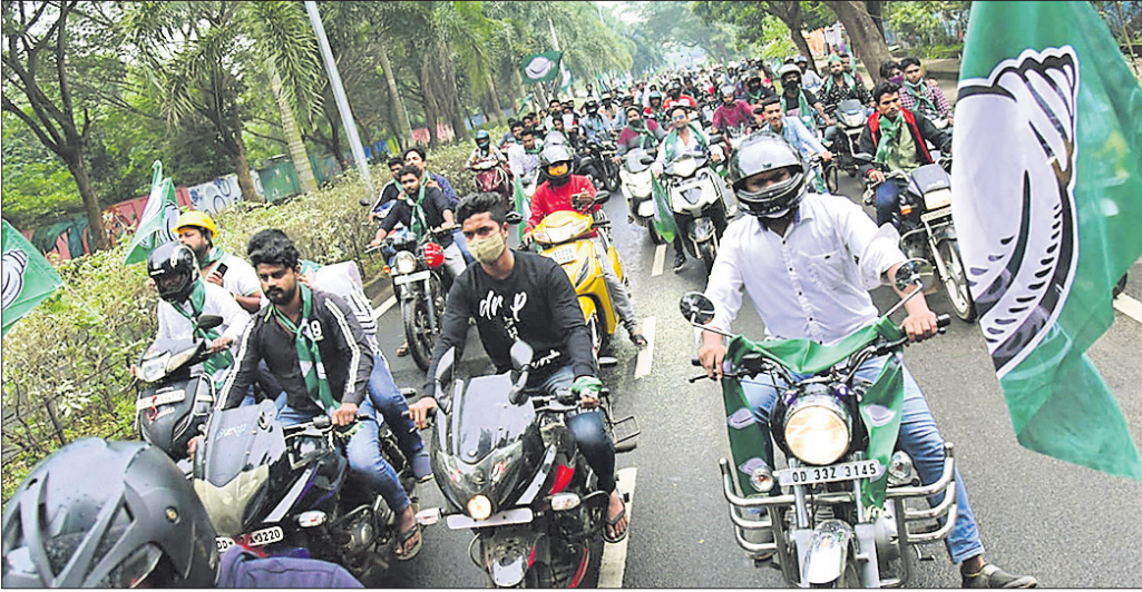
ଦରଦାମ୍ ବୃଦ୍ଧି ପ୍ରତିବାଦରେ ଗୁରୁବାର ଛାତ୍ର ଓ ମୁଦ୍ର ଜନତା ଦଳ ପକ୍ଷରୁ ଭୁବନେଶ୍ୱରରେ ବାଇକ ରାଲି।