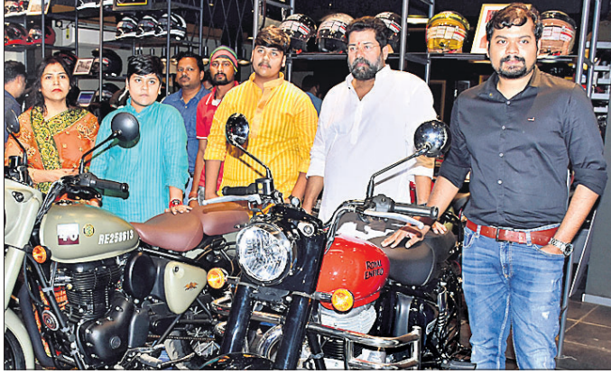
ରାମ ମନ୍ଦିର ଛକ ନିକଟସ୍ଥ ଶୁଭମ୍ ମାର୍କେଟ ପରିସରରେ ରୟାଲ ଏନ୍ଫିଲ୍ଡର ନୂତନ ଶୋରୁମ୍ ଉଦ୍ଘାଟନ ଅବସରରେ ଉପସ୍ଥିତ ଅତିଥିବୃନ୍ଦ।