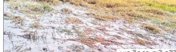
ଧାନ ବିଲରେ ପାଣି ଜମିଛି।

ବନ୍ଧୁ ଥିବାବେଳେ ପୁଣି ବର୍ଷା ଯୋଗୁ ଧାନ ବିଲରେ ପାଣି ଠିଆ ହୋଇଛି। କାଟିବାରେ ବିଳମ୍ବ ହେଲେ ପାଟିଲା ଧାନ କେଣ୍ଡା ବିଲରେ ଭାଙ୍ଗି ପଡ଼ିବାର ଆଶଙ୍କା କରିଛନ୍ତି ଗାଷୀ। ବାରମ୍ବାର ବର୍ଷା ଯୋଗୁ ଅମଳ ଅଧା କମିଯିବ ଓ ବହୁତ କ୍ଷତି ସହିବାକୁ ପଡ଼ିବ ବୋଲି ଗାଷୀମାନେ ପ୍ରକାଶ କରିଛନ୍ତି। ତହସିଲ ଓ କୃଷି ବିଭାଗ ପକ୍ଷରୁ ଯତ୍ନଶୀଳ ଆକଳନ କରି କ୍ଷତିପୂରଣ ପ୍ରଦାନ ଲାଗି ସେମାନେ ଦାବି କରିଛନ୍ତି।