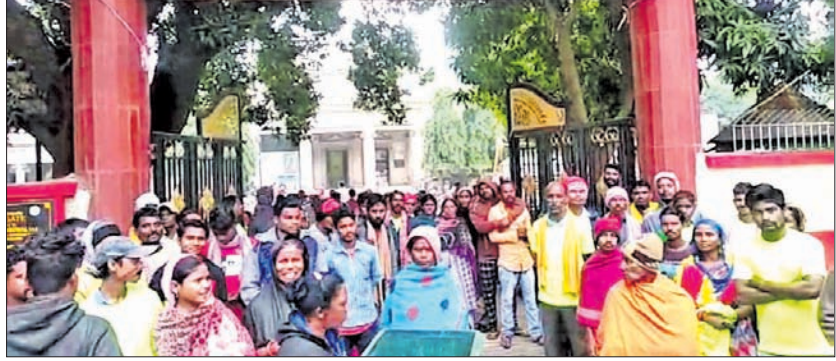
ବିରୋଧ ପ୍ରଦର୍ଶନ କରୁଥିବା ସଫେଇ କର୍ମଚାରୀ।

ବାଲିପଦା ଅଫିସ୍, ୯୧୨୨ ବୃକ୍ଷା ଲିପିସଂଘ ଟଙ୍କା ପ୍ରଦାନ କରାଯିବ ବୋଲି ପୌର ଅଧିକାରୀମାନେ ପ୍ରତିଶ୍ରୁତି ଦେଇଥିଲେ। ମାତ୍ର ୭ମାସକୁ ଅଧିକ ସମୟ ବିତି ଯାଇଥିଲେ ହେଁ ବକେୟା ଟଙ୍କା ପ୍ରଦାନ କରାଯାଇ ନାହିଁ। ଏନେଇ ଅଧିକାରୀଙ୍କ ସହ ବାରମ୍ବାର ଆଲୋଚନା ପରେ କୌଣସି ସୁଫଳ ନ ମିଳିବାରୁ ୨୮୦ରୁ ଉର୍ଦ୍ଧ୍ୱ ସଫେଇ କର୍ମଚାରୀପୌରପାଳିକା କାର୍ଯ୍ୟାଳୟ ଆଗରେ ରୁଦ୍ଧବାରୀରୁ ବିରୋଧ ପ୍ରଦର୍ଶନ କରିବା ସହ ରୁଦ୍ଧବାରୀରୁ କାର୍ଯ୍ୟ ବନ୍ଦ କରାଯାଇଥିବା ସଫେଇ କର୍ମଚାରୀ ଅଧିକାରୀଙ୍କୁ ପ୍ରକାଶ କରିଛନ୍ତି।