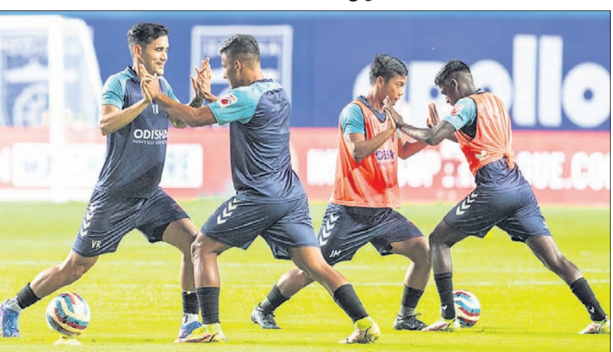
ଓଡ଼ିଶା ଏଫସି ଖେଳାଳିଙ୍କ ଅଭାସା।

ଭାସ୍କୋ, ୯।୧୨: ଚଳିତ ଇଣ୍ଡିଆନ୍ ସୁପର ଲିଗ୍ (ଆଇଏସ୍‌ଏଲ୍)ର ଅଷ୍ଟମ ସଂସ୍କରଣରେ ଶୁକ୍ରବାର ଓଡ଼ିଶା ଏଫସି ଓ ନର୍ଥ ଇଷ୍ଟ ଯୁଗାଲଟେ ଏଫସି ପରସ୍ପରକୁ ଭେଟିବେ। ଦେଶର ଏହି ସର୍ବବୃହତ୍ ଫୁଟବଲ ଲିଗ୍‌ରେ ଓଡ଼ିଶା ଚା'ର ପ୍ରଥମ ବୁକ୍‌ଟି ମ୍ୟାଚ୍‌ରେ ବିଜୟ ହୋଇ ଅଭିମାନ ଆରମ୍ଭ କରିଥିଲା। ଗତ ସଂସ୍କରଣରେ ଓଡ଼ିଶା ପଏଣ୍ଟ ଟାଲିକାର ନିମ୍ନରେ ରହିଥିଲା। ଏଥର ଓଡ଼ିଶା ପ୍ରଥମ ମ୍ୟାଚ୍‌ରେ ୩-୧ ଗୋଲରେ ବେଙ୍ଗାଲୁରୁ ଏଫସିକୁ ଓ ଦ୍ଵିତୀୟ ମ୍ୟାଚ୍‌ରେ ଇଷ୍ଟ ବେଙ୍ଗାଲୁକୁ ୬-୪ ଗୋଲରେ ହରାଇଥିଲା। ତେବେ ତୃତୀୟ ମ୍ୟାଚ୍‌ରେ ଓଡ଼ିଶା