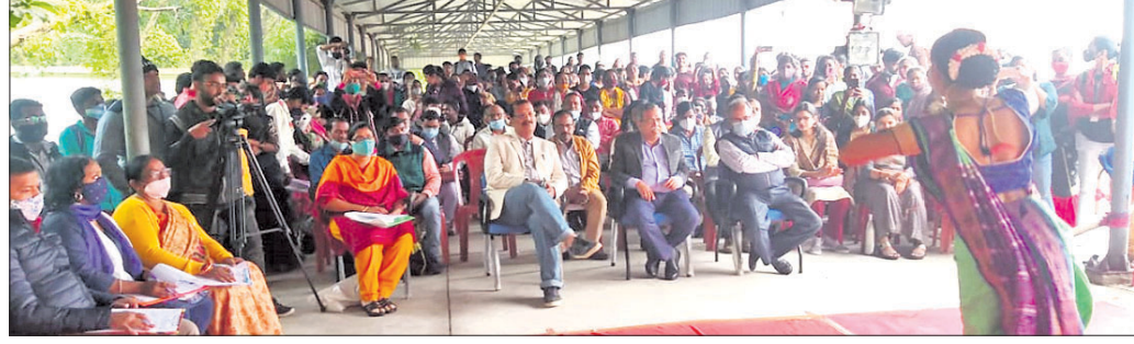
ସାଂସ୍କୃତିକ ସମାବେଶରେ ଉପସ୍ଥିତ ଅତିଥି ଓ ଛାତ୍ରଛାତ୍ରୀ।