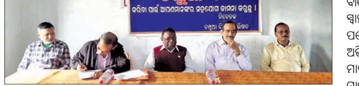
ଖବରଦାତା ସମ୍ମିଳନୀରେ ବିକାଶ ପରିଷଦର କର୍ମକର୍ତ୍ତା।