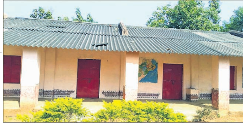
ସମ୍ବଲପୁର ଜିଲ୍ଲାର ସ୍ନାତ୍ତ୍ଵିକ ଯୋଜନାରେ ନିଆଯାଇଥିବା ଏକ ସ୍କୁଲ ।

ଠିକାଦାର ଓ ଯୋଗାଣ ସାମ୍ବନ୍ଧୀୟ ବିତିଫନାମ ଓ ପଞ୍ଚାୟତ ଅଫିସରଙ୍କୁ ଆସି ବକେୟା ଟଙ୍କା ଦାବି କରୁଛନ୍ତି । ବିତିଫନାମ ଓ ପଞ୍ଚାୟତ ସ୍ତରର ଅଧିକାରୀ ଅସହାୟ ପ୍ରକାଶ କରି କିଛିଦିନ ଅପେକ୍ଷା କରିବାକୁ କହୁଛନ୍ତି । ମିଳିଥିବା ରିପୋର୍ଟ ଅନୁସାରେ ସ୍ନାତ୍ତ୍ଵିକ ପାଇଁ ରାଜ୍ୟ ସରକାରଙ୍କ ୪୫ ଲକ୍ଷ ଟଙ୍କା ଅନୁଦାନ ରହିଛି । ଏଥିରୁ ୧୦ ଲକ୍ଷ ଟଙ୍କା ସ୍କୁଲ ପରିଚାଳନା କମିଟି ଜମା ଖାତାରେ ରହିବ । ସେମାନେ ଉଚ୍ଚ ଟଙ୍କାକୁ ଶିକ୍ଷକମାନଙ୍କୁ, ଶିକ୍ଷକ, ଛାତ୍ରାଛାତ୍ରୀ, ଅଭିଭାବକଙ୍କୁ ନେଇ ତାଲିମ କାର୍ଯ୍ୟକ୍ରମ କରିବେ । ୧୫ ଲକ୍ଷ ଟଙ୍କାରେ ସାକ୍ଷର ଲ୍ୟାବରେ ବ୍ୟବହୃତ ସାମଗ୍ରୀ, ବେଞ୍ଚ ଡେସ୍କ, କମ୍ପ୍ୟୁଟର, ପ୍ରୋଜେକ୍ଟର ଭଳି ସାମଗ୍ରୀ କିଣାଯାଇଛି । ବାକି ୩୫ ଲକ୍ଷ ଟଙ୍କାରେ ପୁରାତନ ସ୍କୁଲ ରୂପାନ୍ତରଣ କାର୍ଯ୍ୟକୁ ଯୋଜନା କରାଯାଇଛି । ସମ୍ବଲପୁର ସମେତ ଅଧିକାଂଶ ଜିଲ୍ଲାରେ ହାତସୁଲରେ ୨ରୁ ୩ଟି କୋଠା ରହିଛି । ବାକି ମାଟିକାଢ଼ ଥିବା ଆରବେଷ୍ଟସ ଘର ରହିଛି । ଏହାକୁ ମରାମତି କଲେ ଅଧିକ ଅନୁଦାନ ଆବଶ୍ୟକ । ଏ ସମ୍ପର୍କରେ ତିଆରି-ସିତି ବିଲ୍ଡିଂ ପ୍ରମାଣ ବଳ କହିଛନ୍ତି, ସ୍ନାତ୍ତ୍ଵିକ ଶୀଘ୍ର ସମ୍ପୂର୍ଣ୍ଣ କରିଯିବା ସହ ଅନୁଦାନ ଅଭାବ ଦୂର କରିବା ପାଇଁ ବ୍ୟବସ୍ଥା କରାଯାଇଛି । ବିତିଫନାମ ପର୍ଯ୍ୟାୟରେ ୫୩୩ ସ୍କୁଲ ହାତକୁ ନିଆଯାଇଛି । କେତେଜଣଙ୍କ ବକେୟା ଟଙ୍କା ରହିଛି, ତାହା ମଧ୍ୟ ଦିଆଯିବ ବୋଲି କହିଥିଲେ ।