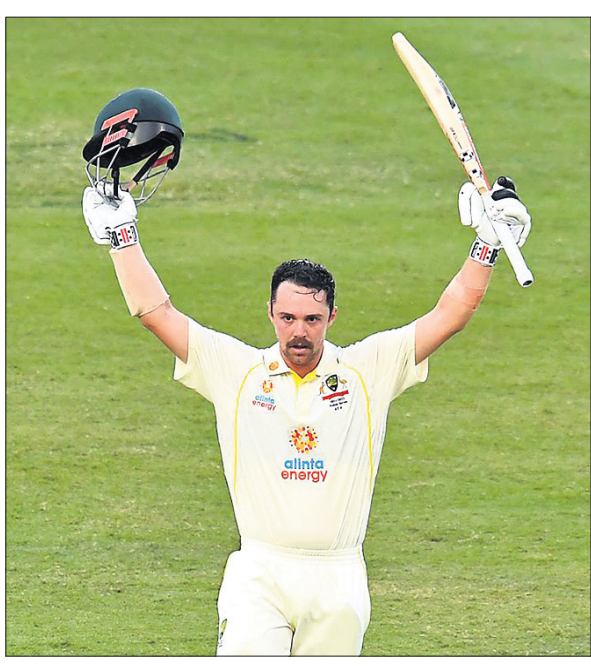
ଶତକ ହାସଲ ପରେ ଗ୍ରାଭିସ୍ ହେଡ୍‌।

ପ୍ରଥମ ଦିନରେ ଇଂଲଣ୍ଡ ଅଲଆଉଟ୍ ହେବା ପରେ ବର୍ଷା ହୋଇଥିଲା ଓ ଖେଳ ସମ୍ପର୍କ ହୋଇପାରି ନ ଥିଲା। ଅଷ୍ଟ୍ରେଲିଆ ରୁଧିରୀ ସମ୍ଭାବନା ପ୍ରଥମ ଇନିଂସ୍ ଆରମ୍ଭ କରି ମାର୍କିଟ୍ ହାରିବୁକୁ ହରାଇ ପ୍ରାରମ୍ଭିକ ଝଟ୍କା ପାଇଥିଲା। ହାରିବୁ ତୃତୀୟ ଦିବସରେ ଶତକ ଅର୍ଜନ କରିଛନ୍ତି।