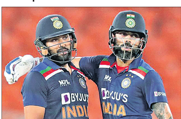
ରୋହିତ ଶର୍ମା ଓ ବିରାଟ କୋହଲି।

ବିରାଟ କୋହଲିଙ୍କ ପରି କଣେ କ୍ଵାଲିଟି ବ୍ୟାଟର ଏବଂ ଟାକ୍‌ପରି ନେତୃତ୍ଵ ଦକ୍ଷତା ସମ୍ପୂର୍ଣ୍ଣ ବ୍ୟକ୍ତି ଭାବରେ ଆବଶ୍ୟକ ବୋଲି ଭାରତୀୟ ଦଳର ନୂଆ ଦିନକିଆ ଅଧିନାୟକ ରୋହିତ ଶର୍ମା ପ୍ରକାଶ କରିଛନ୍ତି। ପୂର୍ବରୁ ତିନି ଥର ଥିବା ରୋହିତ ଏବେ ଦିନକିଆ ଦାୟିତ୍ଵ ନେଇଛନ୍ତି। “ଟାକ୍‌ପରି କ୍ଵାଲିଟି ଖେଳାଳି ସବୁଦିନେ ଦଳ ଆବଶ୍ୟକ କରିଥାଏ। ତିନି ଫର୍ମାଟରେ ୫୦ରୁ ଉର୍ଦ୍ଧ୍ଵ ଆଉଟ୍‌ରେ ସହଜ ରୁହେଁ। ନିଜ ଅଭିଜ୍ଞତାର ଉପଯୋଗ କରି କୋହଲି ଅନେକ ସମୟରେ ଭାରତକୁ ସଙ୍କଟସ୍ଥିତିରୁ ଉଦ୍ଧାର କରିଛନ୍ତି” ବୋଲି ରୋହିତ କହିଛନ୍ତି। ରୋହିତଙ୍କ ମତରେ ଜଣେ ଅଧିନାୟକ ନିଜ ଦାୟିତ୍ଵକୁ ପ୍ରଥମେ ବୁଝିବା ବହୁ ଗୁରୁତ୍ଵପୂର୍ଣ୍ଣ। ଦଳରେ ଯେପରି ଠିକ୍ ଖେଳାଳି ରହିବ, ତିନି କମିନେଶନ ଏବଂ ଅନେକ ଚାଲୁଥିବା ଦିନକିଆ ବିଶେଷ ଧ୍ୟାନ ଦେବାକୁ ପଡ଼ିଥାଏ। ଜଣେ ଅଧିନାୟକ ପ୍ରଥମେ ନିଜ ପ୍ରଦର୍ଶନ ପ୍ରତି ସଚେତନ ରହିବା ଜରୁରୀ। କାରଣ ସେ ହେଉଛି ଦଳର ଗୁରୁତ୍ଵପୂର୍ଣ୍ଣ ସଦସ୍ୟ। ଅନ୍ୟ ଖେଳାଳିମାନେ ମଧ୍ୟ ତାଙ୍କୁ ଉପଯୁକ୍ତ ସହାୟତା କରିବା ଆବଶ୍ୟକ। ରୋହିତଙ୍କ ଅନୁସାରେ ଜଣେ ଅଧିନାୟକ ପଡ଼ିଆ ମଧ୍ୟରେ ୨୦ ପ୍ରତିଶତ ଏବଂ ପଡ଼ିଆ ବାହାରେ ୮୦ ପ୍ରତିଶତ କାର୍ଯ୍ୟ କରିଥାଏ। “ମୋ ଭୂମିକା ପଡ଼ିଆ ଭିତର ଅପେକ୍ଷା ବାହାରେ ଅଧିକ। ଏହି ଅବସରରେ ସବୁ ଖେଳାଳିଙ୍କ ସହିତ ଭାବ ବିନିମୟ