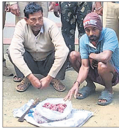
ଜବତ ହରିଶ ମାଂସ ସହ ଗିରଫ ପ୍ରଧାନ ଶିକ୍ଷକ।

ରାଜନଗର, ୧୦୧୨(ଡି.ଏନ.ଏ.) ଭିତରକନିକା ଜାତୀୟ ଉଦ୍ୟାନ ପେଣ୍ଠା ବେଳାଭୂମି ସଂଲଗ୍ନ ବରୁଣେଇ ସଂରକ୍ଷିତ ଜଙ୍ଗଲରୁ ହରିଶ ଶିକାର କରି ଶୁକ୍ରବାର ୨ଜଣ ଶିକାରୀ ଗିରଫ ହୋଇଛନ୍ତି। ଗିରଫକାରୀ ମଧ୍ୟରେ ଜଣେ ବଗପାଟିଆ ପ୍ରାଥମିକ ବିଦ୍ୟାଳୟର ପ୍ରଧାନ ଶିକ୍ଷକ ଅଛନ୍ତି। ଗୁରୁବାର