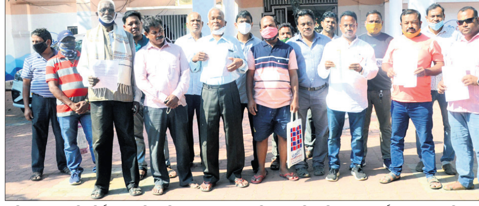
ମାଟିଆପାଠା ଓଭରବ୍ରୁକ୍ ନିର୍ମାଣରେ କ୍ଷତିଗ୍ରସ୍ତ ହୋଇଥିବା ଉପଯୁକ୍ତ କ୍ଷତିପୂରଣ ଦାବିରେ ଜିଲ୍ଲାପାଳଙ୍କ କାର୍ଯ୍ୟାଳୟ ଆଗରେ ବିକ୍ଷୋଭ କରୁଛନ୍ତି ।