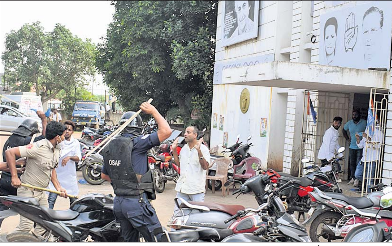
ଓଡ଼ିଶା ପ୍ରବେଶ ଛାତ୍ର କଂଗ୍ରେସ ପକ୍ଷରୁ ଶୁକ୍ରବାର ଅପରାହ୍ଣରେ ବିଧାନସଭା ଘେରାଇ ଉଦ୍ୟମବେଳେ ପୋଲିସ୍ କଂଗ୍ରେସ ଭବନରେ ପଶି ଲାଠିଚାଳି କରୁଛି (ବାମ)। ଲାଠି ମାଡ଼ରେ ଜଣେ କଂଗ୍ରେସ କର୍ମୀଙ୍କ ମୁଣ୍ଡ ଫାଟିଯାଇଛି।

ପୁରୀ ଅଫିସ୍, ୧୦/୧୨: ନାଳାଦ୍ରି ଭକ୍ତନିବାସ ପରିସରରେ ଶୁକ୍ରବାର ଶ୍ରୀମନ୍ଦିର ମୁଖ୍ୟ ପ୍ରଶାସକ କ୍ରମେ କୁମାରଙ୍କ ଅଧିକାରୀଙ୍କ ଦ୍ୱାରା ନିୟୋଗ ଓ ନାତି ସମ୍ବନ୍ଧିତ ବୈଦିକ ଅନୁଷ୍ଠିତ ହୋଇଯାଇଛି। ବୈଦିକରେ ଆସନ୍ତା ଜାନୁୟାରୀ ମାସ ପାଇଁ ନାତିକାନ୍ତି ଏବଂ ଏସଓପିକୁ ନେଇ କିଛି ପରିବର୍ତ୍ତନ ଉପରେ ମୋହର ଦାଖଲ ପହିଲି ଭୋଗ, ମକର ସଂକ୍ରାନ୍ତି ଓ ଦେବାଭିଷେକ ପୂର୍ଣ୍ଣିମା ନାତିକାନ୍ତି ମଧ୍ୟ ବୃତ୍ତାନ୍ତ ହୋଇଛି। ବୈଦିକ ପରେ ମୁଖ୍ୟ ପ୍ରଶାସକ ସୂଚନା ଦେଇ କହିଛନ୍ତି, ଆସନ୍ତା ଜାନୁୟାରୀ ୧ ତାରିଖ ନୂଆବର୍ଷ ସମେତ ଗର୍ବିନ ସର୍ବସାଧାରଣ ଦର୍ଶନ ବନ୍ଦ ରହିବ। ସେହିପରି ବିଦିବାଗପୁଡ଼ିକ ମଧ୍ୟ ଏହି ପୃଷ୍ଠା-୭