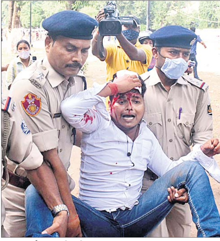
ଓଡ଼ିଶା ପ୍ରବେଶ ଛାତ୍ର କଂଗ୍ରେସ ପକ୍ଷରୁ ଶୁକ୍ରବାର ଅପରାହ୍ଣରେ ବିଧାନସଭା ଘେରାଇ ଉଦ୍ୟମବେଳେ ପୋଲିସ୍ କଂଗ୍ରେସ ଭବନରେ ପଶି ଲାଠିଚାଳି କରୁଛି (ବାମ)। ଲାଠି ମାଡ଼ରେ ଜଣେ କଂଗ୍ରେସ କର୍ମୀଙ୍କ ମୁଣ୍ଡ ଫାଟିଯାଇଛି।