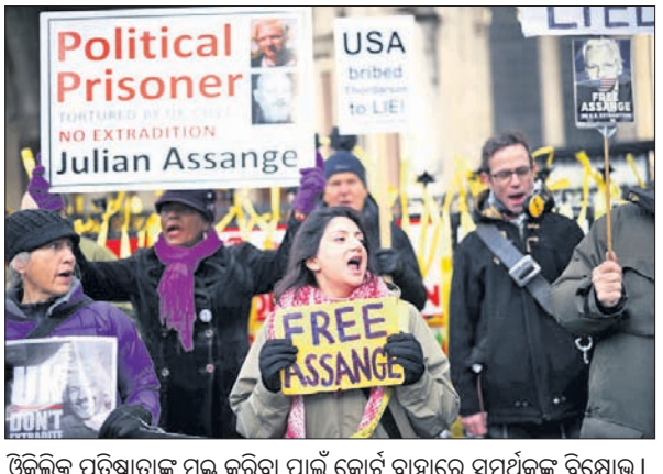
ଓଡ଼ିଶାକୁ ପ୍ରତିଷ୍ଠାତାକୁ ମୃତ୍ତ କରିବା ପାଇଁ କୋର୍ଟ ବାହାରେ ସମର୍ଥକଙ୍କ ବିକ୍ଷୋଭ ।

ମିଡିଆ ସଂସ୍ଥା ଓଡ଼ିଶାକୁ ପ୍ରତିଷ୍ଠାତା ଭୂମିକା ଆସେଞ୍ଜାକୁ ପ୍ରତ୍ୟର୍ପଣ ନିମନ୍ତେ ବ୍ରିଟେନ ହାଇକୋର୍ଟରେ ଆପେରିକା କରିଥିବା ଆବେଦନକୁ ଶୁଣ୍ଠିକାର ମଞ୍ଜୁରୀ ମିଳିଛି । ଏବେ ତାଙ୍କୁ ହାଇ ସିକ୍ୟୁରିଟି ସେଲ୍‌ମାର୍ଗେ ଜେଲକୁ ଆପେରିକା ପଠାଯିବା ଏକ ପ୍ରକାର ନିଶ୍ଚିତ । ୫୦ ବର୍ଷୀୟ ଆସେଞ୍ଜା ନାଗରିକ ଆସେଞ୍ଜା ବିରୋଧରେ ଆପେରିକାରେ ୧୮ ସଜିନ ମାମଲା ରହିଛି । ସେ ଆପେରିକାର ଗୋପନୀୟ ସେନା ତତ୍ତ୍ୱାବଳୀକୁ ଓଡ଼ିଶାକୁ ପ୍ରକାଶ କରିବା ସହ ସେଠାରେ ଗୁପ୍ତଚରଗିରି କରିଥିବା ଅଭିଯୋଗ ରହିଛି । ତେବେ ପ୍ରତ୍ୟର୍ପଣ କରାଯିବା ପରେ ଆପେରିକା ତାଙ୍କ ସହ ମାନବୀୟ ବ୍ୟବହାର କରିବ ବୋଲି ସୁନିଶ୍ଚିତ କରିଥିବା କୋର୍ଟ କହିଛନ୍ତି । ପ୍ରତ୍ୟର୍ପଣ ସମ୍ପର୍କିତ ଅନୁରୋଧ ଗୃହ ସଚିବ ପ୍ରୀତି ପଟ୍ଟେକ ନିମ୍ନ ଅଫିସର ବିଚାରପତିଙ୍କୁ ହାଇକୋର୍ଟ ନିର୍ଦ୍ଦେଶ ଦେଇଛନ୍ତି । ପ୍ରୀତି ପଟ୍ଟେକ ଏହା ଉପରେ ଶେଷ ନିଷ୍ପତ୍ତି ନେବେ । କୋର୍ଟରେ ମାମଲାର ଶୁଣାଣିବେଳେ ଆସେଞ୍ଜା ବେଲମାର୍ଗେ ଜେଲକୁ ଭିଡିଓ ଲିଭି ଯୋଗେ ଉପସ୍ଥିତ ଥିଲେ । ଆସେଞ୍ଜା ମାନସିକ ଭାବେ ଅସୁସ୍ଥ ଥିବାରୁ ସେ