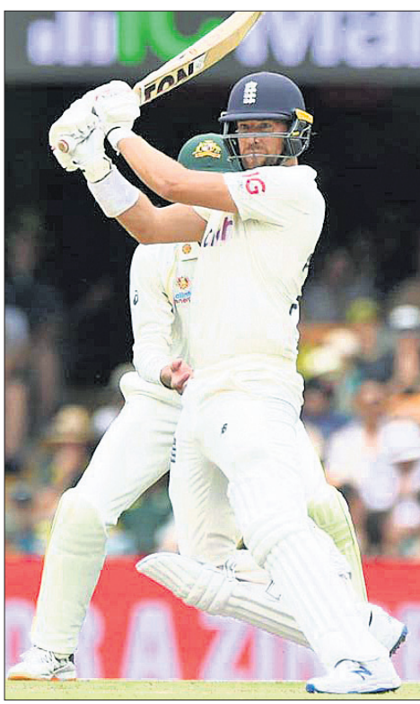
ଶର୍ ଖେଳିବା ଅବସରରେ ଦାଫ୍ରିଦ ମଲନ। ତୃତୀୟ ଦିବସରେ ଅପରାଜିତ ରହି ପ୍ୟାଭିଲିୟନ ଫେରୁଛନ୍ତି ଜୋ ରୁଟ୍।

ଇନିଂସ ଆରମ୍ଭ କରି ଇଂଲଣ୍ଡ ଶୁକ୍ରବାର ତୃତୀୟ ଦିବସ ଖେଳ ଶେଷ ହୁଏ। ୭୦ ଓଭରରେ ୨ ଉଇକେଟ ହରାଇ ୨୨୦ ରନ ସଂଗ୍ରହ କରିଛି। ଫଳରେ ଇଂଲଣ୍ଡ ୮ ଉଇକେଟ ହାତରେ ରଖି ଏବେ ମଧ୍ୟ ୫୮ ରନ ପଛରେ ରହିଛି। ଷ୍ଟ୍ରୀ ଅପସାରଣ ବେଳକୁ ରୁଟ୍ ୮୬ ଓ ମଲନ ୮୦ ରନ କରି ଅପରାଜିତ ରହିବା ସହ ସ୍ଥିତି ସମ୍ଭାଳି ଥିଲେ। ତେବେ ଏହା ପୂର୍ବରୁ ତୁଳ୍ ଓପନର ବଡ଼ ଷ୍ଟୋର ହାସଲ କରିବାରେ ବିଫଳ ହୋଇଥିଲେ। ହାସିବ ହସିଦ ୨୭ ଓ ରୋରି ବର୍ଟ୍ ୧୩ ରନ କରି ପ୍ୟାଭିଲିୟନ ଫେରିଥିଲେ। ଗାବାରେ ତୃତୀୟ ଦିବସ ମଝିରେ ପିର୍ ବ୍ୟାଟିଂ ଉପଯୋଗୀ ହୋଇଥିଲା। ରୁଟ୍ ଓ ମଲନ ଏହାର ଫାଇଦା ଉଠାଇବାରେ ସମର୍ଥ ହୋଇଥିଲେ। ଅସମାପ୍ତ ପ୍ରଥମ ଇନିଂସ ଷ୍ଟୋର ୩୪୩/୭୭ ରୁ ଖେଳ