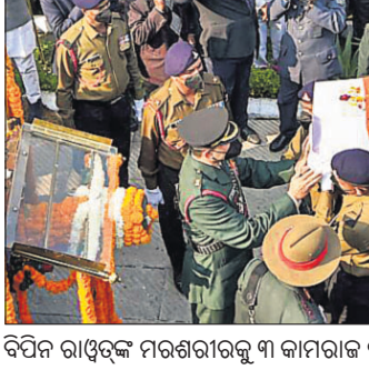
ବିପିନ ରାଓଙ୍କ ମରଣର ମରଣୋତ୍ସବ କାମଗାର ମାର୍ଗରୁ ଦ୍ରାଘ ଚାଲିଥିବା ଶୁଣାଣିକୁ ନିଆଯାଇଛି ।

ମୁଖ୍ୟ ଭୂମିକା ନେଇଥିଲେ । ତେଣୁ ଏହି ଘଟଣାକୁ ନେଇ ଲୋକଙ୍କ ମନରେ ସନ୍ଦେହ ସୃଷ୍ଟି ହେବା ସ୍ୱାଭାବିକ । ତେବେ ଗଭୀର ସରକାରୀ ଗଣମତାଧିକାର ଗଣମତାଧିକାର 'ଗୋପାଳ ଉକ୍ତି' ମାଧ୍ୟମରେ ଏହାକୁ ଏକ ଉପସ୍ଥାପନା ବୋଲି ବିବେଚନା କରୁଛନ୍ତି । ଶିବସେନାର ରାଜ୍ୟ ସଭା ସଦସ୍ୟ ସଞ୍ଜୟ ରାଓଙ୍କ କହିଛନ୍ତି, କେନ୍ଦ୍ରରେ ରାଓଙ୍କ ଗଭୀର ଓ ପାଳିଆର ବିରୋଧରେ ଭାରତୀୟ ସାମରିକ ବଳର ଶକ୍ତି ବୃଦ୍ଧିରେ