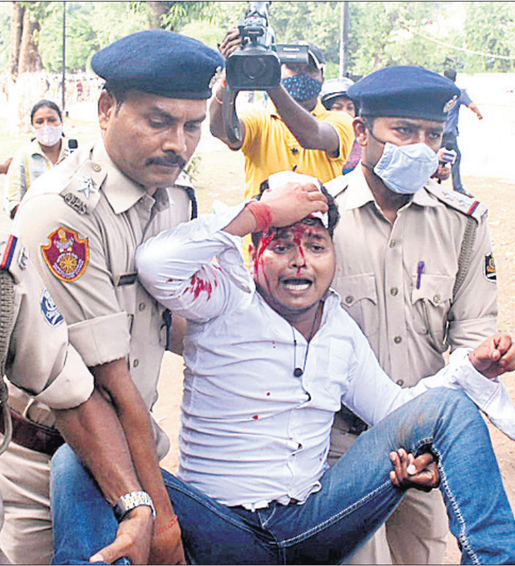
ଓଡ଼ିଶା ପ୍ରଦେଶ ଛାତ୍ର କଂଗ୍ରେସ ପକ୍ଷରୁ ଶୁକ୍ରବାର ଅପରାହ୍ନରେ ବିଧାନସଭା ଘେରାଇ ଉଦ୍ୟମବେଳେ ପୋଲିସ୍ କଂଗ୍ରେସ୍ ଭବନରେ ପଶି ଲାଠିଚାଳି କରୁଛି (ବାମ)। ଲାଠି ମାଡ଼ରେ ଜଣେ କଂଗ୍ରେସ୍ କର୍ମୀ ମୃତ୍ୟୁ ପାଇଁ ଯାଇଛି।