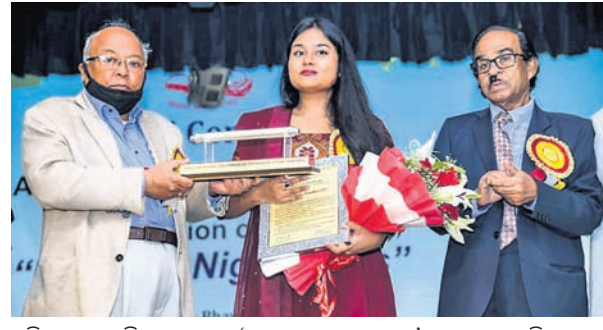
ଅତିଥିମାନେ ମହିମା ସେଠାକୁ 'ଶାରଳା ଯୁବ ପୁରସ୍କାର' ପ୍ରଦାନ କରୁଛନ୍ତି।

ଭୁବନେଶ୍ୱର, ୧୧/୧୨ (ଭୁବନେ) ଗଜୁପାଟଣା ୨ରେ ସର୍ବଭାରତୀୟ ସ୍ୱାଧୀନତା ସଂଗ୍ରାମୀ ଦିବସ ମହୋତ୍ସବ ଭୁବନେଶ୍ୱରରେ ଅନୁଷ୍ଠିତ ହେବ।