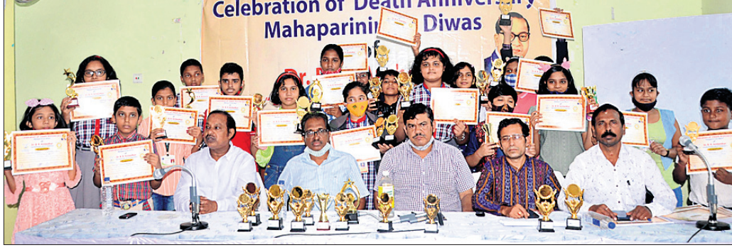
Celebration of Death Anniversary of Mahaparini Diwas

ପୁରୀ ଅଧିକ, ୧୧/୧୨ ଭୋଇ ଏବଂ ଲକ୍ଷ୍ମଣ ସାହି। ଏ ନେଇ ବେଆଇନ ଦେଶୀ ମଦ ବିକ୍ରି କରିବା ଅବକାରୀ ପୋଲିସ୍ ପକ୍ଷରୁ ନଂ ୧୦୩, ୧୦୪, ୧୦୫/୨୧ରେ ପୂର୍ଣ୍ଣା ବିଭାଗ ପକ୍ଷରୁ ଚଢ଼ାଉ ଥାନା ଅଞ୍ଚଳରେ ଚଢ଼ାଉ କରାଯାଇ ଲକ୍ଷ୍ମଣଙ୍କୁ ଗିରଫ କରାଯାଇଛି। ଅତିରୁଦ୍ଧମାନେ ଏବଂ ଲକ୍ଷ୍ମଣଙ୍କଠାରୁ ୧୪ ଲିଟର ହେଲେ ଧନେଶ୍ୱର ଭୋଇ, କାଳିଆ ଦେଶୀ ମଦ ଜବତ କରାଯାଇଛି।