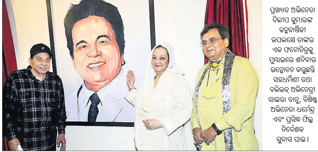
ପ୍ରମୁଖ ଅଭିନେତା ଦିଲୀପ କୁମାରଙ୍କ ଉପଲକ୍ଷେ ତାଙ୍କର ଏକ ପଟ୍ଟାଭିଷେକ ପୂର୍ବାହାର ଶନିବାର ଉତ୍ସାହପୂର୍ଣ୍ଣ ଭାବରେ ସମ୍ପର୍କିତ।

ମୁଖ୍ୟମନ୍ତ୍ରୀ ନବୀନ ପଟ୍ଟନାୟକ ରବିବାର ଗଞ୍ଜାମ ଜିଲ୍ଲା ଗସ୍ତରେ ଆସି ବିଭିନ୍ନ ପ୍ରକଳ୍ପର ଉଦ୍ଘାଟନ ଓ ଭିତ୍ତିପ୍ରସ୍ତର ଗ୍ରହଣ କରିବେ।