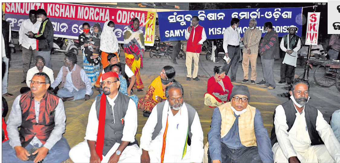
କେନ୍ଦ୍ର ସରକାରଙ୍କ ୩ କୃଷି ଆଇନ ପ୍ରତ୍ୟାହାରକୁ କୃଷକ ଆନ୍ଦୋଳନର ଅଭିଭାବକ ବିଜୟ ରୂପେ ବିବେଚନା କରି ସଂଯୁକ୍ତ କିଷାନ ମୋର୍ଚ୍ଚା ପକ୍ଷରୁ ଭୁବନେଶ୍ୱର ମାଷ୍ଟର କ୍ୟାଣ୍ଟିନ ଛକରେ ଶନିବାର ଅନୁଷ୍ଠିତ 'ବିଜୟ ଉତ୍ସବ' ପାଇନ ଅବସରରେ ଉପସ୍ଥିତ କୃଷକ ଓ ଶ୍ରମିକଙ୍କ ସହ ନେତୃତ୍ୱ।