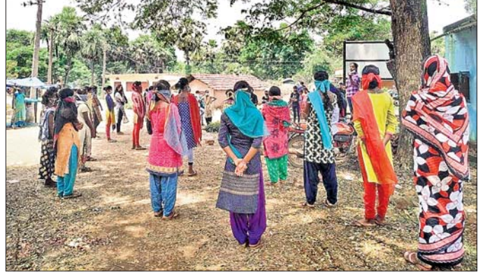
କୋଣାର୍କରେ ସମ୍ପ୍ରଦାୟର ଲୋକେ ଏକାଠି ହୋଇଛନ୍ତି।

ପିଢ଼ି ପିଢ଼ି ଧରି କୋଣାର୍କରେ ସମ୍ପ୍ରଦାୟର ଜନସାଧାରଣ ଆଦିବାସୀ ଜନଜାତି ମାନସତା ଦାବି କରି ଆନ୍ଦୋଳନ କରି ଆସିଛନ୍ତି।