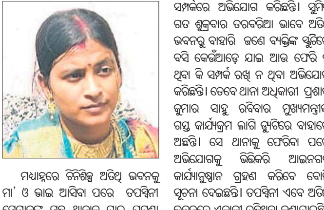
ମଧ୍ୟାହ୍ନରେ ଜିଲ୍ଲିକା ଅଧିକାରୀଙ୍କୁ ଭେଟିବା ପାଇଁ ଆସିକାରେ ତପସ୍ୱିନୀ ସେମାନଙ୍କ ସହ ଆନାକୁ ଯାଇ ଘଟଣା

ଗଞ୍ଜାମ ଜିଲ୍ଲା ଆସିକା ଜିଲ୍ଲିକା ଅଧିକାରୀଙ୍କୁ ଉପସ୍ଥାପନା କରିବାକୁ ଏକାକୀ ଛାଡ଼ି ତାହାର ସାମାଜିକ ଦାୟିତ୍ୱକୁ ଗ୍ରହଣ କରିବାକୁ ପ୍ରକାଶ କରିଛନ୍ତି।