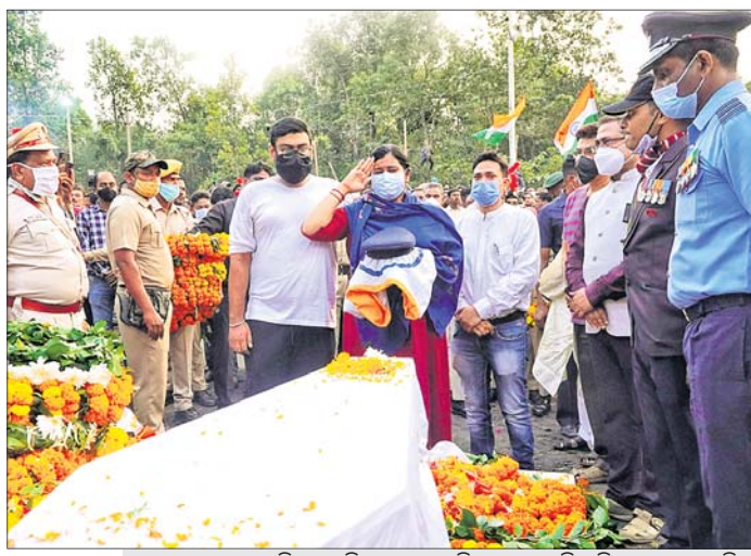
ରାଜ୍ୟପ୍ରତ୍ୟକ୍ତ ସ୍ତ୍ରୀ ଶିକ୍ଷା ଦାମ୍ ସାମ୍ବନ୍ଧୀୟ କର୍ମ ସମାପନ କରି ସାମାଜିକ ଅଭିବୃଦ୍ଧି କରାଯାଇଛି।