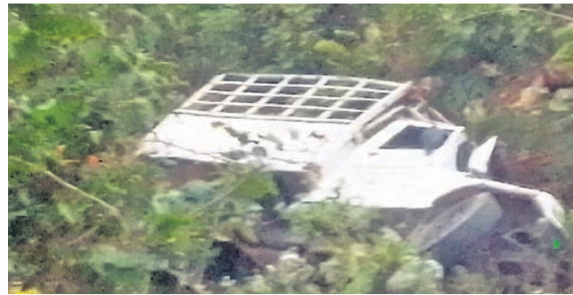
ଓଲଟି ପଡ଼ିଥିବା ପିକ୍‌ଅପ୍।

ପାରଳାଖେମୁଣ୍ଡି/ରାୟଗଡ଼ (ଗଜପତି), ୧୧୧୨୭ (ଡି.ଏନ.ଏ.)