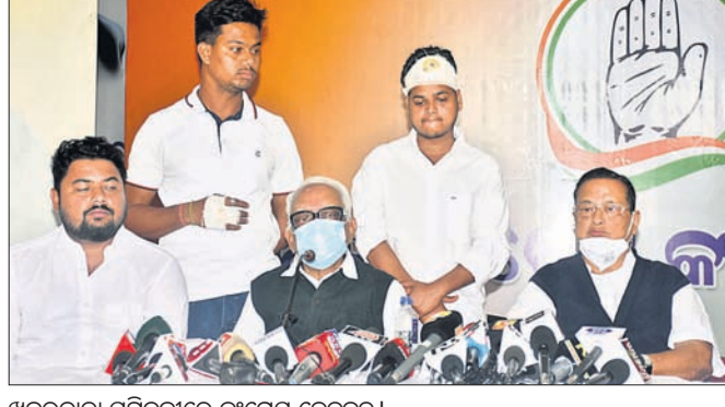
ଖବରଦାତା ସମ୍ମିଳନୀରେ କଂଗ୍ରେସ ନେତୃବୃନ୍ଦ।

■ ପୋଲିସ ଉପରୁ ଆସୁ ଚୁଟିଲେ ସ୍ଥିତି ଉଗ୍ରରୂପ ନେବ ■ ଆଗାମୀ ସ୍ଥିତି ପାଇଁ ସରକାର ଦାୟୀ ରହିବେ