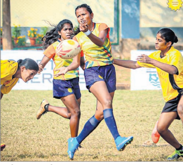
ଚାମ୍ପିୟନଶିପ୍ରେ ମ୍ୟାଚ୍ ଖେଳୁଥିବା ଅବସରରେ ଓଡ଼ିଶା ବାଳକ ଓ ବାଳିକା ଦଳ।

ଫାଇନାଲରେ ପ୍ରବେଶ କରିଛନ୍ତି। ଏହାପରେ ଭାରତୀୟ ଫାଇନାଲରେ ଓଡ଼ିଶା ଓଡ଼ିଶା ବିହାରକୁ ଭେଟିବ। ବାଳିକା ବିଭାଗର ଅନ୍ୟ ସେମିଫାଇନାଲରେ ଦିଲ୍ଲୀ ଓ ମହାରାଷ୍ଟ୍ର ପୂର୍ଣ୍ଣାହୁ ହେବେ। ୪ଟି ଯାକ ସେମିଫାଇନାଲ ରବିବାର ଆୟୋଜନ ହେବ। ଶନିବାର ପ୍ରତିଯୋଗିତାର ଦ୍ୱିତୀୟ ଦିବସରେ ଓଡ଼ିଶା ଦଳ ପ୍ରତି ଭାରତୀୟ ଫାଇନାଲରେ ଜଣ୍ଟି ଓ କର୍ଣ୍ଣାଟକକୁ ୪୦-୦ରେ ପରାସ୍ତ କରି ଭାରତୀୟ ଫାଇନାଲରେ ପ୍ରବେଶ କରିଛନ୍ତି।