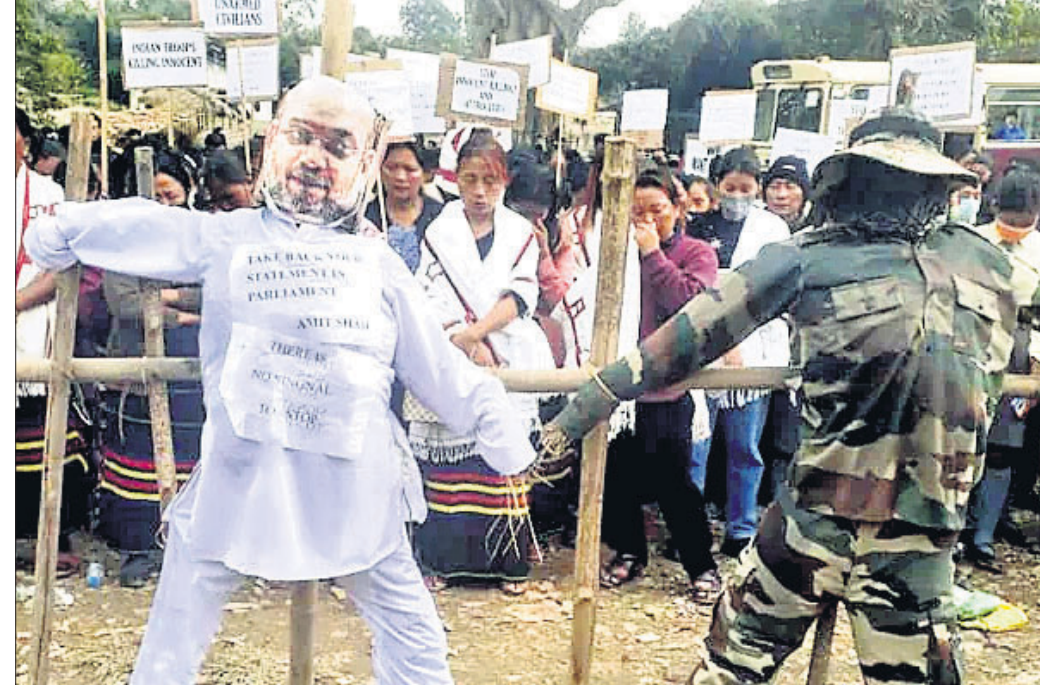
ନାଗାଲାଣ୍ଡର ମୋର୍ ଜିଲ୍ଲାରେ ବିରୋଧକାରୀମାନେ ସ୍ୱରାଷ୍ଟ୍ର ମନ୍ତ୍ରୀ ଅମିତ୍ ଶାହାଙ୍କ କୁଶପୂଜନିକା ଦାହ କରିବାକୁ ଯାଉଛନ୍ତି।

ନାଗାଲାଣ୍ଡ ହତ୍ୟାକାଣ୍ଡ ବିରୋଧରେ ବିଶାଳ ରାଲି କୋହିମା, ୧୧/୧୨