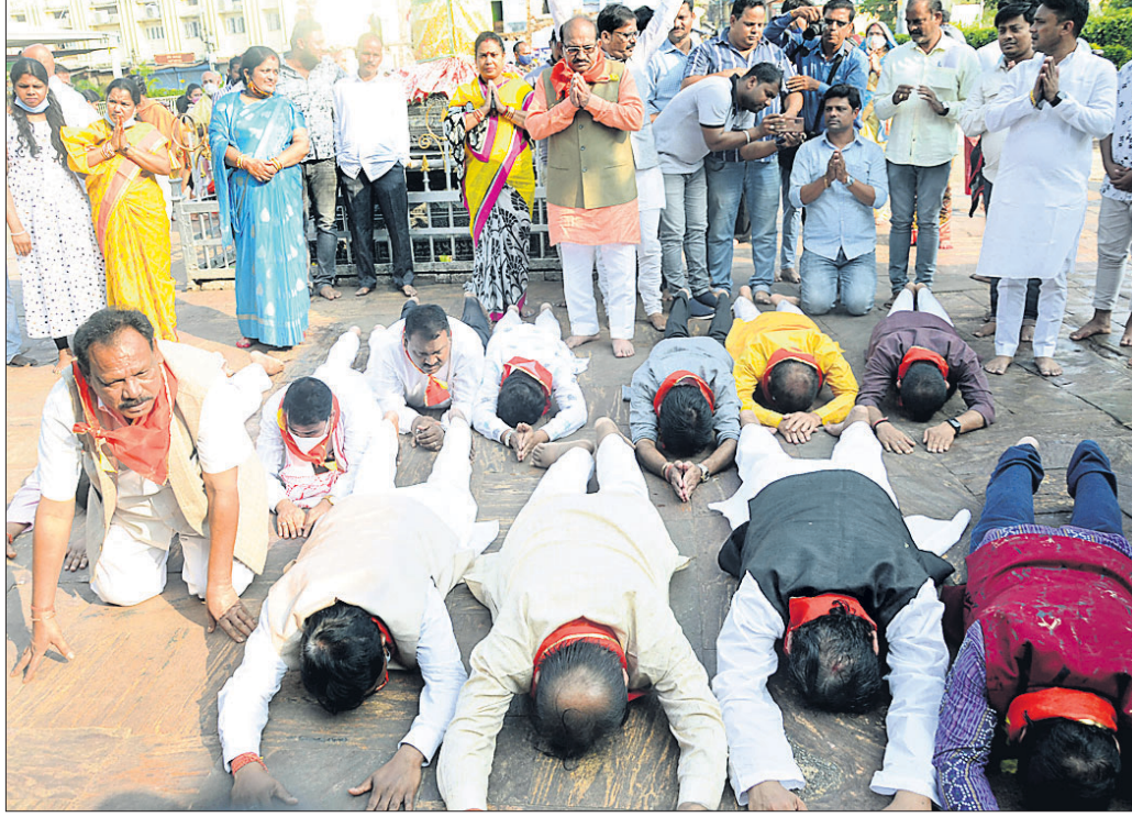
ଶ୍ରୀମନ୍ଦିର ସାମ୍ନାରେ ଶନିବାର ଅଧିକାର ପଡ଼ି ମହାପ୍ରଭୁ ଶ୍ରୀଜଗନ୍ନାଥଙ୍କୁ ଗୁହାରି ଜଣାଇଛନ୍ତି ଭାଜପା ବିଧାୟକ।