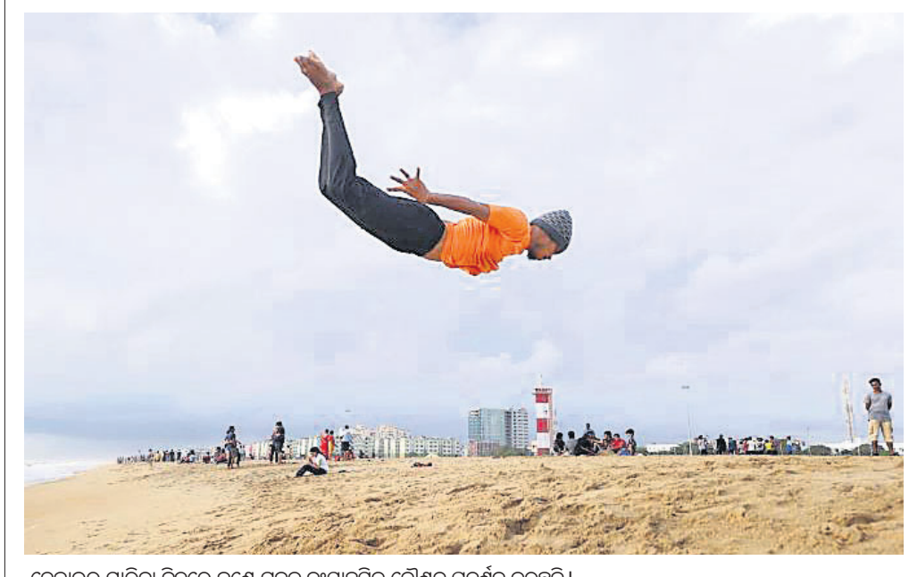
ଚେନାଇର ମାରିନା ବିଚ୍ଚରେ ଜଣେ ଯୁବକ ଦୁଃସାହସିକ କୌଶଳ ପ୍ରଦର୍ଶନ କରୁଛନ୍ତି।

ସାଧାରଣତନ୍ତ୍ର ଦିବସରେ ୫ କେନ୍ଦ୍ରୀୟ ଏସୀୟ ରାଷ୍ଟ୍ର ନେତା ଅତିଥି ହୋଇପାରନ୍ତି। ଏଥିପାଇଁ କାଳାକ୍ରମେ, କିରଗିସ୍ତାନ, ତାଜିକିସ୍ତାନ, ଉର୍ବମେନିସ୍ତାନ ଏବଂ ଉଜ୍ବେକିସ୍ତାନକୁ ଭାରତ ଆମନ୍ତ୍ରଣ କରିଛି।