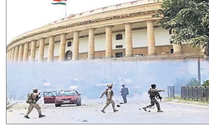
ଭାରତର ପାର୍ଲିମେଣ୍ଟ ଭବନ ଉପରେ ଆକ୍ରମଣ କରିଥିବା ଆତଙ୍କବାଦୀମାନେ ପାର୍ଲିମେଣ୍ଟ ପରିସରରେ ପ୍ରବେଶ କରିଥିଲେ।

ଭାରତର ପାର୍ଲିମେଣ୍ଟ ଭବନ ଉପରେ ଆକ୍ରମଣକୁ ୨୦ବର୍ଷ ପୂରିଛି। ୨୦୦୧ ଡିସେମ୍ବର ୧୩ରେ ଆତଙ୍କବାଦୀମାନେ ପାର୍ଲିମେଣ୍ଟ ପରିସରରେ ପ୍ରବେଶ କରି ଆକ୍ରମଣ କରିଥିଲେ, ଯାହା ଦେଶକୁ ଯୁଦ୍ଧ କରିଦେଇଥିଲା।