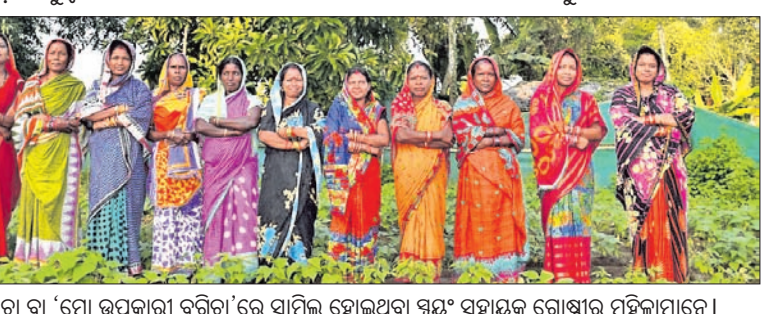
ପୁଷ୍ଟି ବରିତା ବା 'ମୋ ଉପକାରୀ ବରିତା'ରେ ସାମିଲ ହୋଇଥିବା ସ୍ୱୟଂ ସହାୟକ ଗୋଷ୍ଠୀର ମହିଳାମାନେ।

ବିଶାଳ ପୁଷ୍ଟି ଉତ୍ସବ। ଏହା ରାଜ୍ୟରେ ପୁଷ୍ଟି ସମ୍ବନ୍ଧୀୟ ସଚେତନତାକୁ ଦର୍ଶାଇଥିବାବେଳେ ମୋ ଉପକାରୀ ବରିତା ଲୋକଙ୍କ ପୁଷ୍ଟିକର ଖାଦ୍ୟର ଆବଶ୍ୟକତାକୁ ପୂରଣ କରିପାରିଛି।