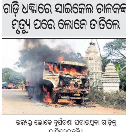
ଉତ୍ତମ ଲୋକେ ଦୁର୍ଘଟଣା ଘଟଣାସ୍ଥଳୀ ଗାଡ଼ିକୁ ଜାଳିଦେଇଛନ୍ତି।

କୋଲାବିରା, ୧୨।୧୨(ଡି.ଏନ.ଏ.): ଝାରସୁଗୁଡ଼ା ଜିଲାର କୋଲାବିରା ଥାନା ଅନ୍ତର୍ଗତ ୪୯ନଂ. ଜାତୀୟ ରାଜପଥର ବଡ଼ବାହାଲଠାରେ ରବିବାର ଦୁର୍ଘଟଣା ଘଟିଛି।