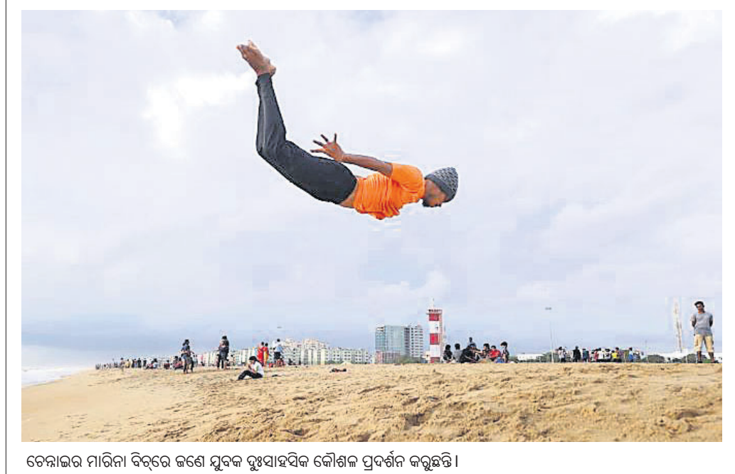
ଚେନାଇର ମାରିନା ବିଚ୍ଚରେ ଜଣେ ମୁଦକ ଦୁଃସାହସିକ କୌଶଳ ପ୍ରଦର୍ଶନ କରୁଛନ୍ତି।

ନୂଆଦିଲ୍ଲୀ, ୧୨୧୨: ୨୦୨୨ ସାଧାରଣତନ୍ତ୍ର ଦିବସରେ ୫ କେନ୍ଦ୍ରୀୟ ଏସୀୟ ରାଷ୍ଟ୍ର ନେତା ମୁଖ୍ୟ ଅତିଥି ହୋଇପାରନ୍ତି। ଏଥିପାଇଁ କାଳକ୍ରମେ, କିରଗିଜସ୍ତାନ, ତାଜିକସ୍ତାନ, ଉର୍ବମେନିସ୍ତାନ ଏବଂ ଉଜ୍ବେକିସ୍ତାନକୁ ଭାରତ ଆମନ୍ତ୍ରଣ କରିଛି। ଏହା ଗୃହୀତ ହେଲେ ପ୍ରଥମ ଥର ପାଇଁ ସମସ୍ତ ୫ କେନ୍ଦ୍ରୀୟ ଏସୀୟ ରାଷ୍ଟ୍ର ପ୍ରତିନିଧି ସାଧାରଣତନ୍ତ୍ର ଦିବସର ମୁଖ୍ୟ ଅତିଥି ହେବେ। ୨୦୧୮ ଆସିଆନ୍ ସମିତ୍ତରେ ଏହି ନେତାମାନେ ଏକାଠି ହୋଇଥିଲେ।