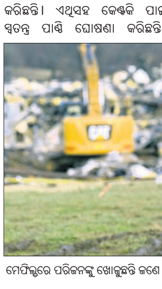
ମେହରୁବା ପରିବର୍ତ୍ତନ ଖୋଜୁଛନ୍ତି ଜଣେ ମହିଳା।

କରିଛନ୍ତି। ଏଥିସହ କେଣ୍ଟିକି ପାଇଁ ସ୍ୱତନ୍ତ୍ର ପାଣି ଘୋଷଣା କରିଛନ୍ତି। ଏପରି ବିପର୍ଯ୍ୟୟ ସୃଷ୍ଟିକାରୀ ବାତ୍ୟା ଜୀବନରେ କେବେ ଦେଖି ନ ଥିବା ଶ୍ରମିକମାନଙ୍କୁ କୋମଳତା ପ୍ରଦାନ କରିବା ପାଇଁ କରୁଥିବା ପ୍ରଶମନ ଚିମ୍ତ ପ୍ରାଣପଣେ ଉଦ୍ୟମ ଜାରି ରଖିଛି।