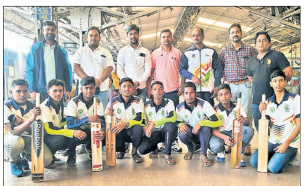
ମଙ୍ଗଳବାର ଲକ୍ଷ୍ମଣା ଯାତ୍ରା ପୂର୍ବରୁ ଅଭିଯୁକ୍ତ କର୍ମକର୍ତ୍ତାଙ୍କ ସହ ଓଡ଼ିଶା ଦଳ ।

ଭୁବନେଶ୍ୱର, ୧୪୧୨ (କ୍ରୀଡ଼ା ପ୍ରତିନିଧି): ଉତ୍କଳ ପ୍ରଦେଶରେ ଲକ୍ଷ୍ମଣାଠାରେ ଚଳିତ ମାସ ୧୬ରୁ ହେବାକୁ ଯାଉଥିବା ୨୭ତମ ଜାତୀୟ ସବୁଜିନିୟର ଚେନିସ ବଲ୍ କ୍ରିକେଟ ଚାମ୍ପିୟନସ୍ଥିତ ପାଇଁ ମଙ୍ଗଳବାର ଓଡ଼ିଶା ଦଳ ଯୋଗିତ ହୋଇଛି। ଓଡ଼ିଶା ଦଳର ସଦସ୍ୟମାନେ ଟୁର୍ଣ୍ଣାମେଣ୍ଟରେ ଅଂଶଗ୍ରହଣ ପାଇଁ ଲକ୍ଷ୍ମଣା ଯାତ୍ରା କରିଛନ୍ତି। ଏହି ଚାମ୍ପିୟନସ୍ଥିତରେ ୨୮ଟି ରାଜ୍ୟଦଳ ଅଂଶ ଗ୍ରହଣ କରୁଛନ୍ତି। ୫ ଦିନର ପ୍ରଶିକ୍ଷଣ ଶିବିର ପରେ ଓଡ଼ିଶା ଦଳ ଯୋଗ୍ୟତା କରାଯାଇଥିଲା। ଓଡ଼ିଶା ଚେନିସ ବଲ୍ କ୍ରିକେଟ୍ ସଂଘର ଅଧ୍ୟକ୍ଷ