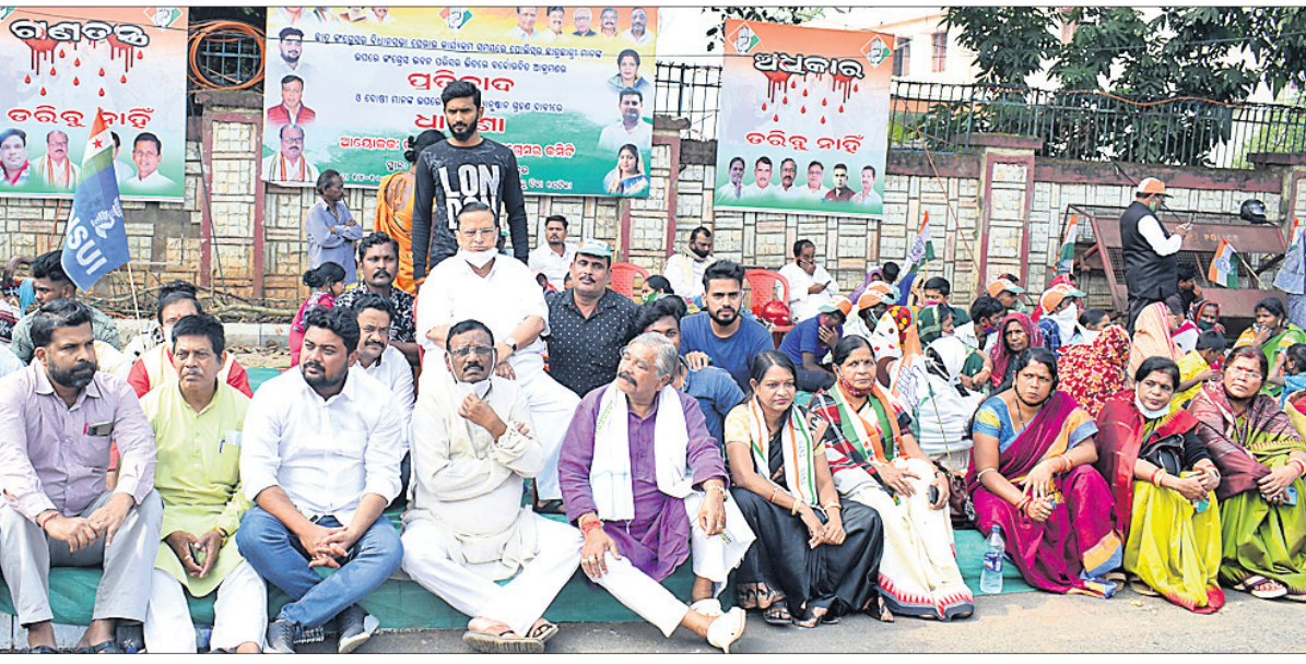
ଭୁବନେଶ୍ୱରରେ ବିଧିପିଟି କାର୍ଯ୍ୟକ୍ରମ ସମ୍ପନ୍ନରେ ମଙ୍ଗଳବାର କଂଗ୍ରେସ ନେତା ଓ କର୍ମୀମାନେ ଧାରଣା ଦେଇଛନ୍ତି।

କଂଗ୍ରେସ ଭବନ ଭିତରେ କର୍ମୀଙ୍କୁ ଯୋଲିସର ଆକ୍ରମଣ ପ୍ରସଙ୍ଗ