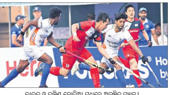
ଭାରତ ଓ ଦକ୍ଷିଣ କୋରିଆ ମଧ୍ୟରେ ଅନୁଷ୍ଠିତ ମ୍ୟାଚ ।

କାକା, ୧୫୧୨ (ପି.ଡି.): ଭାରତର ଚାମ୍ପିୟନ୍ ଭାବରେ ଚଳିତ ଏସିଆନ୍ ଚାମ୍ପିୟନ୍ସ ଟ୍ରଫି ହକିରେ ନିଜର ପ୍ରଥମ ମ୍ୟାଚ ତ୍ରୁ ରଖି ଅଭିଯାନ ଆରମ୍ଭ କରିଛନ୍ତି । ମଙ୍ଗଳବାର ଅନୁଷ୍ଠିତ ଭାରତ-ଦକ୍ଷିଣ କୋରିଆ ମ୍ୟାଚ ୨-୨ ଗୋଲରେ ତ୍ରୁ ରହିଥିଲା । ଭାରତ ପ୍ରଥମାଦେଶରେ ମ୍ୟାଚକୁ