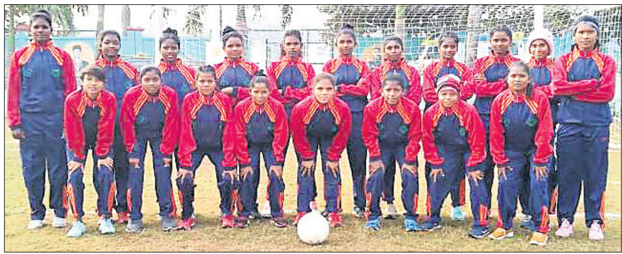
କ୍ରୀଡ଼ାଗତ ଦ୍ୱିତୀୟ ବିଜୟ ହାସଲ କରିଥିବା କିଟ୍ ବିଶ୍ୱବିଦ୍ୟାଳୟ ଦଳ ।

ଭୁବନେଶ୍ୱର, ୧୪୧୨ (କ୍ରୀଡ଼ା ପ୍ରତିନିଧି) ଇଣ୍ଡିଆନ ୟୁନିଭର୍ସିଟି (ଏଆଇୟୁ) ସହଯୋଗରେ କିଟ୍ ବିଶ୍ୱବିଦ୍ୟାଳୟ ଆନୁକୁଲ୍ୟରେ ଚାଲିଥିବା ପୂର୍ଣ୍ଣାଙ୍ଗ ଆନ୍ତର୍ଜାତୀୟ ବିଶ୍ୱବିଦ୍ୟାଳୟ ମହିଳା ପୁଲ୍ ଟୁର୍ଣ୍ଣାମେଣ୍ଟରେ ମଙ୍ଗଳବାର ଓଡ଼ିଶାରୁ ପ୍ରତିନିଧିତ୍ୱ କରୁଥିବା କିଟ୍ ଓ ଉତ୍କଳ ବିଶ୍ୱବିଦ୍ୟାଳୟ ବିଜୟ