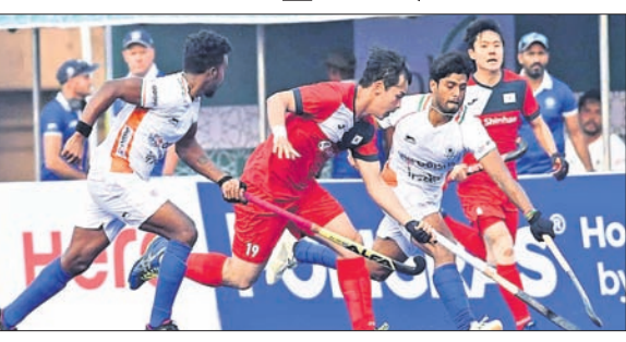
ଭାରତ ଓ ଦକ୍ଷିଣ କୋରିଆ ମଧ୍ୟରେ ଅନୁଷ୍ଠିତ ମ୍ୟାଚ ।

କାକା, ୧୪୧୨ (ପି.ଟି.): ଗତଥର ଚାମ୍ପିୟନ ଭାବେ ଚଳିତ ଏସିଆନ ଚାମ୍ପିୟନ୍ସ ଟ୍ରଫି ହକିରେ ନିଜ ପ୍ରଥମ ମ୍ୟାଚ ତ୍ରୁ ରଖି ଅଭିଯାନ ଆରମ୍ଭ କରିଛନ୍ତି । ମଙ୍ଗଳବାର ଅନୁଷ୍ଠିତ ଭାରତ-ଦକ୍ଷିଣ କୋରିଆ ମ୍ୟାଚ ୨-୨ ଗୋଲରେ ତ୍ରୁ ରହିଥିଲା । ଭାରତ ପ୍ରଥମାଦେଶରେ ମ୍ୟାଚକୁ