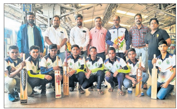
ମଙ୍ଗଳବାର ଲକ୍ଷ୍ମୀ ଯାତ୍ରା ପୂର୍ବରୁ ଅଭିଯୁକ୍ତ କର୍ମଚାରୀଙ୍କ ସହ ଓଡ଼ିଶା ଦଳ ।