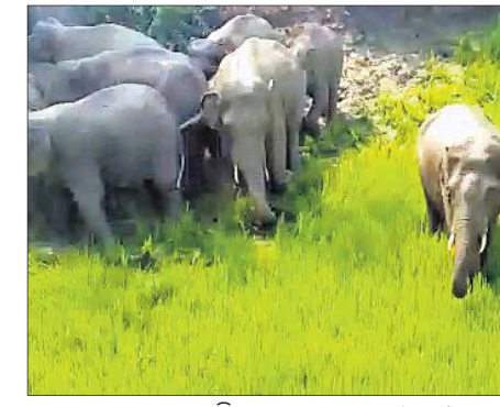
ସମଲପୁର ମହାନଗର ନିଗମ ଅଞ୍ଚଳରେ ହାତୀପଲ।

ସମଲପୁର,୧୫।୧୨(ବୁଧବୋ) ସମଲପୁର ମହାନଗର ନିଗମ ଉପକଣ୍ଠ ଅଞ୍ଚଳରେ କିଛିଦିନ ହେବ ହାତୀ ଚଳାଚଳ ବୃଦ୍ଧି ପାଇଛି। ହାତୀଙ୍କ ସୁରକ୍ଷା ପାଇଁ ବନ ବିଭାଗର ଆବଶ୍ୟକତାକୁ ଦୃଷ୍ଟିରେ ରଖି ବିଦ୍ୟୁତ୍ କାଟ କରାଯିବ ବୋଲି ଗଣ ପାଖର ପକ୍ଷରୁ ସୂଚନା ଦିଆଯାଇଛି। ସୂଚନା ଅନୁସାରେ ଡିସେମ୍ବର ୩ରେ ଧମା ରେଞ୍ଜ ଜଙ୍ଗଲରୁ ୧୪ରୁ ଅଧିକ ହାତୀ କୌଶସିମତେ ମହାନଦୀ ପାର ହୋଇ ଚାଆଁରପୁର ଅଞ୍ଚଳକୁ ଆସିଥିଲେ। ଖାଦ୍ୟ ଅନ୍ଵେଷଣରେ ସେମାନେ ଗୋଶାଳା, ବ୍ରହ୍ମପୁରା ଗ୍ରାମକୁ ଆସି ଫସଲ ନଷ୍ଟ କରିଥିଲେ। ହାତୀପଲ ଲୟେଜ ଗୁଲୁର ଅଞ୍ଚଳରେ ଯାତାୟତ କରୁଥିବା ନିଜର ରହିଛି। ନିକଟରେ ୧୨ ବର୍ଷ କିମ୍ପା ଜଙ୍ଗଲ ରହିଥିଲେ ବି ହାତୀମାନେ ଗାଁ ଯୁଆଁ ହେଉଛନ୍ତି। ଧାନ ଓ ପରିପରିବା ଫସଲ ଖାଇବା ପାଇଁ ସନ୍ଧ୍ୟା ହେଲେ ଗ୍ରାମ ନିକଟରେ ପହଞ୍ଚି ଯାଉଛନ୍ତି। ବନ ବିଭାଗ ଅଧିକାରୀ ଏମାନଙ୍କ ଉପରେ ନଜର ରଖୁଛନ୍ତି। ଜଙ୍ଗଲ ଓ ଗ୍ରାମ ଗୁଡ଼ିକରେ ବିଦ୍ୟୁତ୍ ତାର ଲାଗି କାଳେ ସେମାନଙ୍କ ଜୀବନ ପ୍ରତି ବିପଦ ସୃଷ୍ଟି ହେବ ସେଥିପାଇଁ ବିଦ୍ୟୁତ୍ କାଟ କରିବାକୁ ସ୍ଥିର କରାଯାଇଛି। ହାତୀଙ୍କୁ ଓ ସମଲପୁର ସଡ଼ିଫିକେନ୍ସରେ ଥିବା ରକ୍ଷଣାବେକ୍ଷଣ ଟିମ୍ ଏବଂ ବନ ବିଭାଗ ମିଳିତ ଭାବେ ଆଲୋଚନା କରି ଏହି ନିଷ୍ପତ୍ତି ନେଇଛନ୍ତି। ଏହା ଦ୍ଵାରା କଟପାଲି ଓ ଚାଉଁରପୁର ପାଖର ସବଞ୍ଚେଶ୍ଵର ନ୍ୟାସନେଲ ଗ୍ରାଉଣ୍ଡର ବିଦ୍ୟୁତ୍ ଯୋଗାଣ ପ୍ରଭାବିତ ହେବ। ବନ୍ୟପ୍ରାଣୀଙ୍କ ସୁରକ୍ଷାକୁ ଗଣ ପାଖର ପ୍ରାଥମିକତା ଦେଇ ଏହି ନିଷ୍ପତ୍ତି ନେଇଛି। ବିଦ୍ୟୁତ୍ ଆଘାତରେ ସନ୍ଧ୍ୟା ବୁର୍ଜିଶିଶୁ ଏତାଡ଼ିଆ ଲାଗି ବନ ବିଭାଗଙ୍କ ପରାମର୍ଶ ନିଆଯାଇଛି। ଅନିଚ୍ଛିାକୃତ ବିଦ୍ୟୁତ୍ କାଟ ଯୋଗୁ ଗ୍ରାହକ, ସାଧାରଣ ଜନତା ଓ ଅଞ୍ଚଳରେ ଥିବା କିଛି ଶିଳ୍ପ