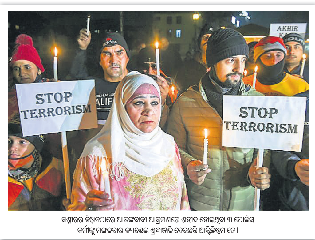
କମ୍ପାନୀର ଜିଅ୍ଠିନଠାରେ ଆତଙ୍କବାଦୀ ଆକ୍ରମଣରେ ଶହୀଦ ହୋଇଥିବା ୩ ପୋଲିସ୍ କର୍ମୀଙ୍କୁ ମଙ୍ଗଳବାର କ୍ୟାଣ୍ଟେଲ ଶ୍ରଦ୍ଧାଞ୍ଜଳି ଦେଉଛନ୍ତି ଆକ୍ଟିଭିଷ୍ଟମାନେ।

କଂଗ୍ରେସ୍ ଅଧ୍ୟକ୍ଷା ସୋନିଆ ଗାନ୍ଧୀ ମଙ୍ଗଳବାର କେତେଜଣ ବରିଷ୍ଠ ବିରୋଧୀ ନେତାଙ୍କୁ ଭେଟି ପାଲିମେଣ୍ଟର ଶୀତ ଅଧିବେଶନ ଲାଗି ମିଳିତ ରଣନୀତି ବାହାର କରିବା ଉପରେ ଆଲୋଚନା କରିଛନ୍ତି।