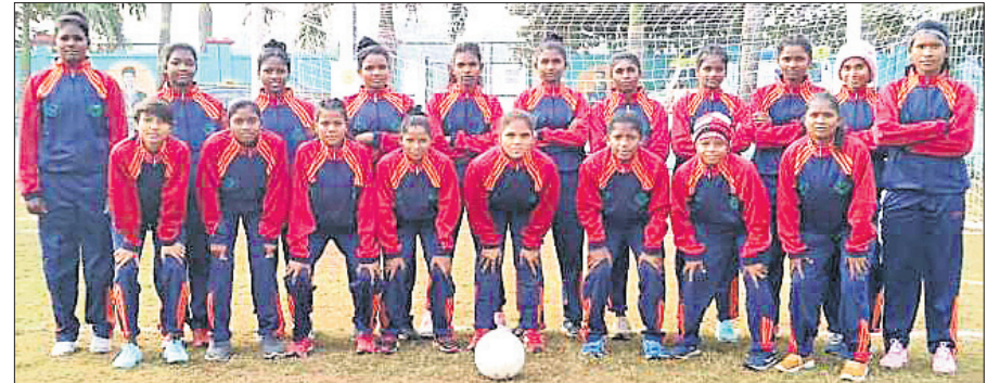
କ୍ରୀଡ଼ାଗତ ଦ୍ଵିତୀୟ ବିଜୟ ହାସଲ କରିଥିବା କିଟ୍ ବିଶ୍ଵବିଦ୍ୟାଳୟ ଦଳ ।