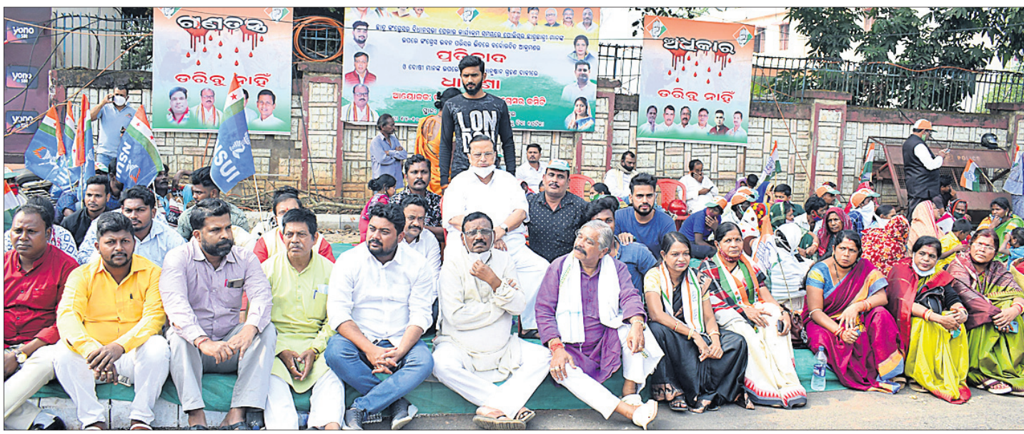
ଭୁବନେଶ୍ୱରରେ ବିଧିପିତ୍ୱ କାର୍ଯ୍ୟକ୍ରମ ସମ୍ପନ୍ନରେ ମଙ୍ଗଳବାର କଂଗ୍ରେସ ନେତା ଓ କର୍ମୀମାନେ ଧାରଣା ଦେଇଛନ୍ତି ।

କଂଗ୍ରେସ ଭବନ ଭିତରେ କର୍ମୀଙ୍କୁ ଯୋଗାଯୋଗ ଆକ୍ରମଣ ପ୍ରସଙ୍ଗ ରାଜ୍ୟବ୍ୟାପୀ ତଳ ତରଫରୁ ଏସପି ଅଫିସ୍ ଯୋଗାଯୋଗ