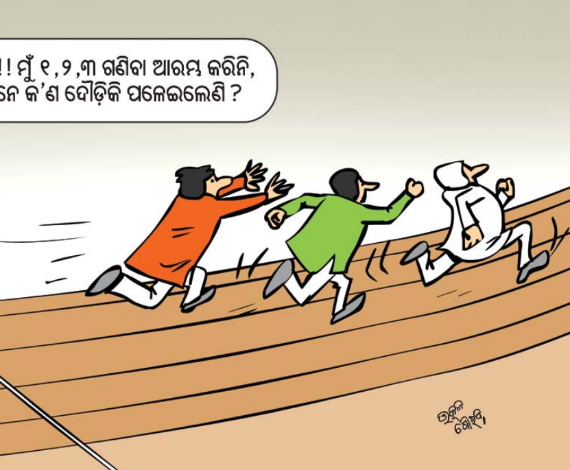
ରାଜ୍ୟ ନିର୍ବାଚନ ନିର୍ବାଚନ

ଆରେ!! ମୁଁ ୧,୨,୩ ଗଣିବା ଆରମ୍ଭ କରିନି, ଏମାନେ କ'ଣ ଦୌଡ଼ିକି ପଲେଲଲେଣି?