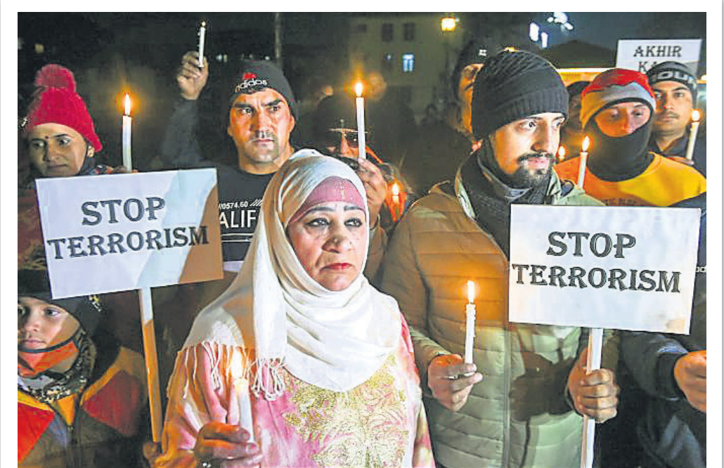
କଣ୍ଟାରର ଜିଆରଠାରେ ଆତଙ୍କବାଦୀ ଆକ୍ରମଣରେ ଶହୀଦ ହୋଇଥିବା ୩ ପୋଲିସ୍ କର୍ମୀଙ୍କୁ ମଙ୍ଗଳବାର କ୍ୟାଣ୍ଡେଲ ଶ୍ରଦ୍ଧାଞ୍ଜଳି ଦେଉଛନ୍ତି ଆକ୍ଟିଭିଷ୍ଟମାନେ।

ରବିବାର ଅସନ୍ତୋଷ ବ୍ୟକ୍ତ କରିଛନ୍ତି। ପ୍ରଧାନମନ୍ତ୍ରୀଙ୍କ କାର୍ଯ୍ୟାଳୟ (ପିଏମୱଓ) ରାଷ୍ଟ୍ରମନ୍ତ୍ରୀ ଜିତେନ୍ଦ୍ର ସିଂ ଏକ ବିବୃତିରେ କହିଛନ୍ତି, ସେମାନେ ସାଧାରଣ ସମ୍ମତି ପ୍ରତ୍ୟାହାର କରିଥିବା ରାଜ୍ୟଗୁଡ଼ିକ ସହାର ଚାର୍ଜେ କରିବା ପାଇଁ ସିବିଆଇକୁ କରନ୍ତୁ ଏକ ନିର୍ଦ୍ଦିଷ୍ଟ ବାଧ୍ୟତା ଚାହାନ୍ତି।