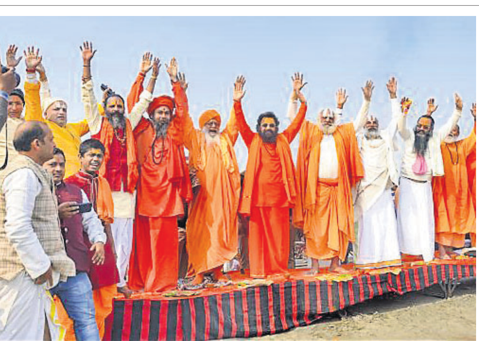
ପ୍ରଧାନମନ୍ତ୍ରୀଙ୍କ ସମ୍ମାନ ପୂର୍ବକ ମଙ୍ଗଳବାର ଆଖ୍ୟା ପରିଷଦ ମହତ୍ତ୍ୱ ରବାସ୍ତ୍ର ପୂର୍ତ୍ତା ଓ ଅନ୍ୟ ସାଧୁମାନେ ଗଜା ପୂଜନ ନୀତି ପାଳନ କରୁଛନ୍ତି।

ଆଇଲାଣ୍ଡରେ ଏକ ସେନା ହେଲିକପ୍ଟର ମଙ୍ଗଳବାର ଦୁର୍ଘଟଣାଗ୍ରସ୍ତ ହୋଇଛି।