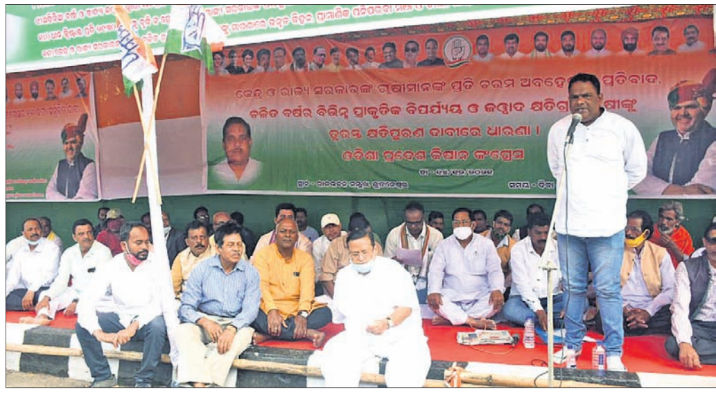
ବାଦ୍ୟାକ୍ଷରଣ ଦର୍ଶାରେ କ୍ଷତିଗ୍ରସ୍ତ ଚାଷୀଙ୍କୁ କ୍ଷତିପୂରଣ ଦାବିରେ ରୁଧିର ରାଜଭବନ ସମ୍ମୁଖରେ କିଷାନ କଂଗ୍ରେସ ପକ୍ଷରୁ ଧାରଣା।