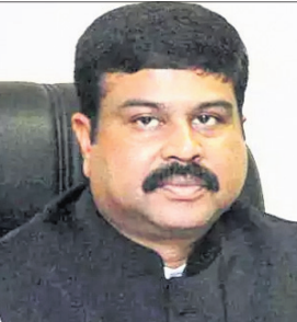
ବିଶ୍ଵପ୍ରସିଦ୍ଧ ଲକ୍ଷ୍ମେନିକ ହସ୍ ଭାବେ ବିକଶିତ କରିବା, ମେକ୍ ଇନ୍ ଇଣ୍ଡିଆ ରଚି ଦେବା, ସୈଦିକଶ୍ଚର୍ଚ୍ଚ ଚିପ୍ପର ଡିଜାଇନ, ଫେବ୍ରିକେଶନ, ପ୍ୟାକେଜିଂ ଏବଂ ଚେଷ୍ଟା ଶ୍ରେଣୀରେ ରୋଜଗାର ଓ ସୁରୋଜଗାରର ପ୍ରସାରଣ ତିଆରି କରିବା ଦିଗରେ ଏହା ଏକ ମହତ୍ଵପୂର୍ଣ୍ଣ ପଦକ୍ଷେପ। ଏହାବ୍ୟତୀତ ରୂପେ ଡେଭିଡ୍ କାର୍ଡ ତଥା କମ୍ ମୂଲ୍ୟର ଜିମ୍ ସୁପିଆଲ ଗ୍ରାହକଙ୍କୁ ପ୍ରୋତ୍ସାହନ ଦେବା ପାଇଁ ୧୩୦୦ କୋଟିର ସହାୟତା ରାଶିକୁ କ୍ୟାବିନେଟ ମଞ୍ଜୁର ଦେଇଛି। ଏହି ନିଷ୍ପତ୍ତି ଡିଜାଇନ ପେନେଟ୍‌ସ ବ୍ୟବସ୍ଥାକୁ ଅଧିକ ବଢ଼ାଇବାରେ ସହାୟକ ହେବ ବୋଲି ଧର୍ମେନ୍ଦ୍ର କହିଛନ୍ତି।

ପ୍ରଧାନମନ୍ତ୍ରୀ କୃଷି ସିଦ୍ଧାନ୍ତ ଯୋଜନା ସମ୍ପ୍ରଦାୟକୁ ଅନୁମୋଦନ