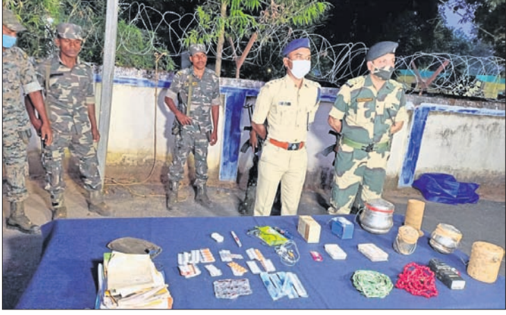
ଏସ୍‌ଡିଓ ଓ ଏସ୍‌ଏସ୍‌ଏସ୍‌ ଅଧିକାରୀ ଜବତ ମାଓବାଦୀ ସାମଗ୍ରୀ ବିସ୍ଫୋରକ

ମାଲକାନଗିରି ପୁରୁଣା ସାହନାକୁଡ଼ ସଫଳତା ମିଳିଛି। ଯୋଡ଼ାମ ଥାନା ଅଧୀନ ନାଡ଼ମେଞ୍ଜେରି ଗ୍ରାମ ନିକଟ ଜଙ୍ଗଲରେ ମାଓବାଦୀମାନେ ଲୁଚାଇ ରଖିଥିବା ବିସ୍ଫୋରକ ପରିମାଣର ବିସ୍ଫୋରକ ସାମଗ୍ରୀ ଜବତ କରାଯାଇଛି। ସୂଚନା ଅନୁଯାୟୀ, ଯୋଡ଼ାମ ଥାନା ଅନ୍ତର୍ଗତ ଘନବେଡ଼ାଠାରେ ବିସ୍ଫୋରକ କ୍ୟାମ୍ପ ପ୍ରତିଷ୍ଠା ପୂର୍ବରୁ ବିସ୍ଫୋରକ, ଏସ୍‌ଡିଓ ଓ ଡିଏସ୍‌ଏସ୍‌ର ଯବାନମାନେ ମିଳିତ କୋର୍ସ୍ ଅପରେଶନ ଆରମ୍ଭ କରିଥିଲେ। ନାଡ଼ମେଞ୍ଜେରି ଗ୍ରାମ ନିକଟ ଜଙ୍ଗଲରେ ମାଟିତଳେ ମାଓବାଦୀମାନେ ବିସ୍ଫୋରକ