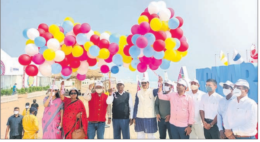
କୋରାପୁଟ ଇକୋ ରିଟ୍ରିଟ୍ ମୁଖ୍ୟ ପୀଠ (ଉପର) କୋଶାଳ ରାମଚଣ୍ଡୀ ନିକଟ ଇକୋ ରିଟ୍ରିଟ୍ ଉଦ୍‌ଘାଟନ ଅବସରରେ ଉପସ୍ଥିତ ଅତିଥିମାନେ।

■ ୭ ଇକୋ ରିଟ୍ରିଟ୍ ଉଦ୍‌ଘାଟନ କଲେ ମୁଖ୍ୟମନ୍ତ୍ରୀ ■ କୋରାପୁଟ, ଗଞ୍ଜାମରେ ଖୋଲିଲା ନୂଆ ଇକୋ ରିଟ୍ରିଟ୍