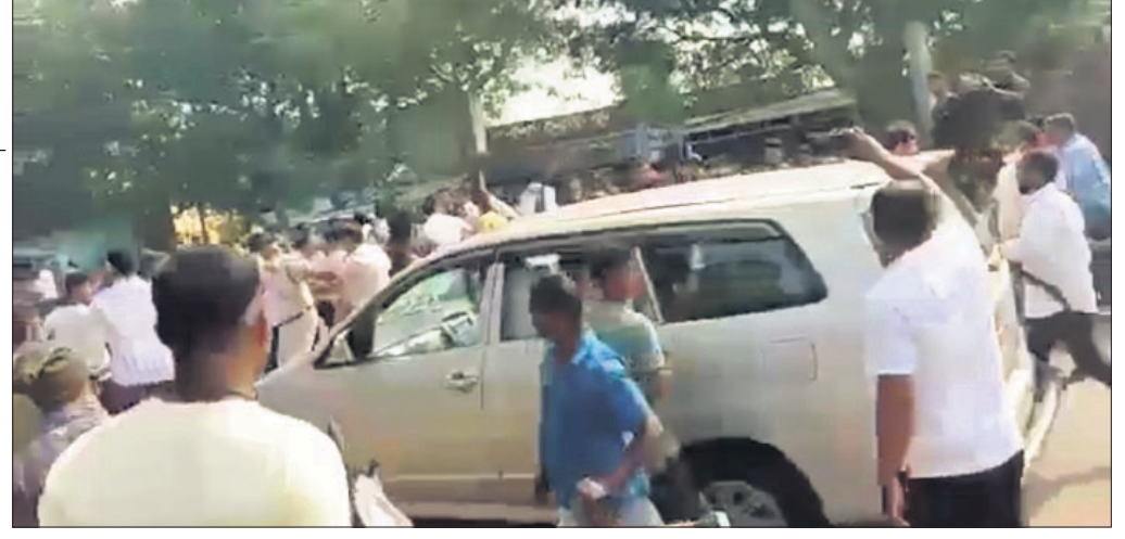
ଅଣ୍ଟାମାଡ଼ ଓ କଳାପତାକା ସମୟରେ ଦେଖାଦେଇଥିବା ଉତ୍ତେଜନା।