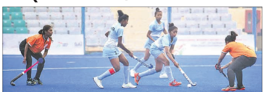
ଓଡ଼ିଶା ନାଭାଲ ଗାଗା ହାଇ ପରଫରମାନ୍ସ ସେଣ୍ଟର ଓ ପୁଣ୍ୟାଳ ସ୍କୁଲ ଷ୍ଟାଡ଼ିଆରେ ଆୟୋଜିତ ମ୍ୟାଚରେ ଅନୁଷ୍ଠିତ ମ୍ୟାଚ।

ଭୁବନେଶ୍ଵର, ୧୬୧୨ (କ୍ରୀଡ଼ା ପ୍ରତିନିଧି) ନୂଆଦିଲ୍ଲୀରେ ଚାଲିଥିବା ପ୍ରଥମ ଖେଳୋ ଇଣ୍ଡିଆ ୨୧ ବର୍ଷରୁ କମ୍ ମହିଳା ହକି ଲିଭ୍ (ଫେବ୍-୧)ରେ ଓଡ଼ିଶା ନାଭାଲ ଗାଗା ହାଇ ପରଫରମାନ୍ସ ସେଣ୍ଟର (ଓଡ଼ିଶା ଖେଳୋ ଇଣ୍ଡିଆ ୨୧ ବର୍ଷରୁ କମ୍ ମହିଳା ହକି ଲିଭ୍)