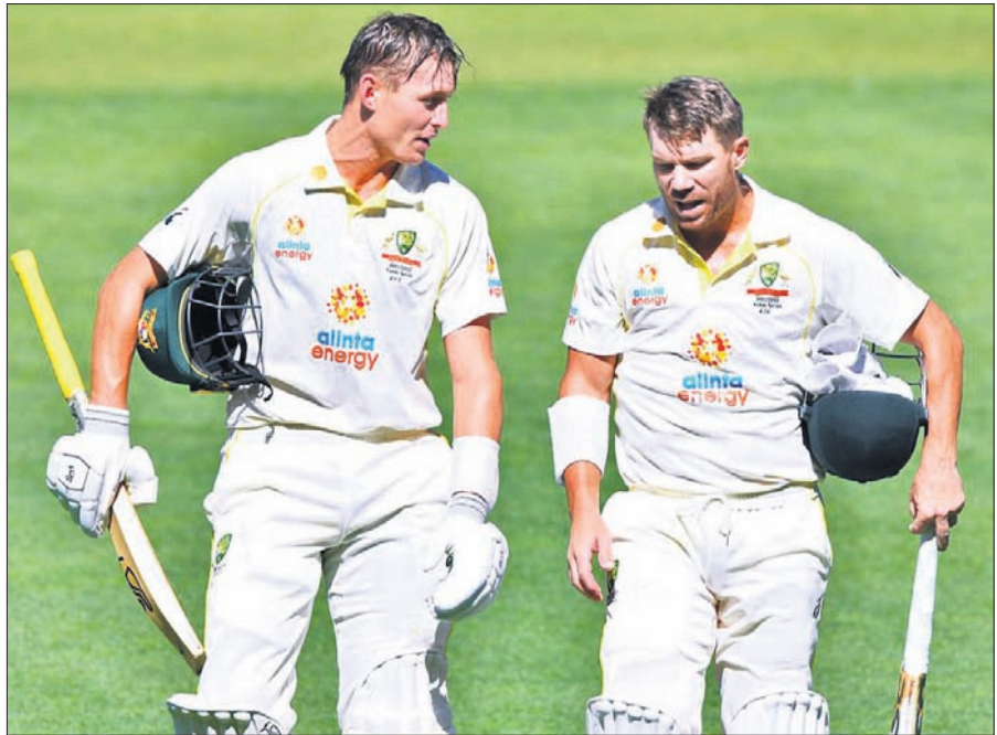
ମାର୍ନସ ଲାବୁସେନ ଓ ଡେଭିଡ଼ ଓ୍ଵାନର୍।

ଆତିଲେଡ, ୧୬୧୨ ସ୍ଥାନୀୟ ଆତିଲେଡ ଓଭାଲ ଗ୍ରାଉଣ୍ଡରେ ଶୁକ୍ରବାରଠାରୁ ଆଶେସ ସିରିଜର ଦ୍ଵିତୀୟ ଟେଷ୍ଟ ଆରମ୍ଭ ହୋଇଛି। ଦିବାରାତ୍ର ଭିଜିଟିଂ ଏହି ଫିଲ୍ଡ ବଲ୍ ଟେଷ୍ଟର ପ୍ରଥମ ଦିବସରେ ଘରୋଇ ବ୍ୟାଟ୍ସମ୍ୟାନଙ୍କ ଆୟତ୍ତପତ୍ତ ଦେଖିବାକୁ ମିଳିଛି। ଅଭିଜ୍ଞ ଓପନର ଡେଭିଡ଼ ଓ୍ଵାନର୍ କ୍ରମାଗତ ଦ୍ଵିତୀୟଥର ପାଇଁ ଅକ୍ଟକେ ଶତକ ହାସଲକୁ ବଞ୍ଚିତ ହୋଇଛନ୍ତି। ତେବେ ପୁନ ବ୍ୟାଟର ମାର୍ନସ ଲାବୁସେନ ମଧ୍ୟ ଶତକର ନିକଟତର ହୋଇଛନ୍ତି। ଟ୍ଵେ ଲିଟି ଅଷ୍ଟେଲିଆ ବ୍ୟାଟିଂ କରିବାକୁ ନିଷ୍ପତ୍ତି ନେଇଥିଲା। ପ୍ରଥମ