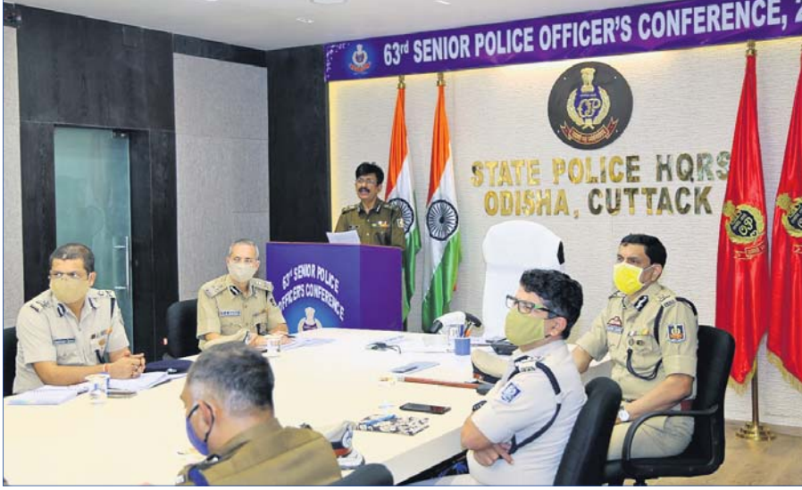
ସମ୍ମିଳନୀରେ ଡିଜିପି ଅଭୟ ଉଦ୍ଘାଟନା ଦେଉଛନ୍ତି।

୨୩ତମ ବରିଷ୍ଠ ପୋଲିସ ଅଧିକାରୀ ସମ୍ମିଳନୀ ଉଦ୍ଘାଟିତ