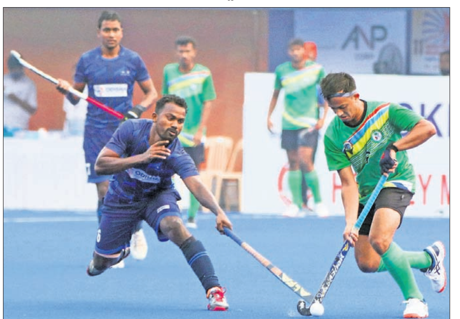
ଓଡ଼ିଶା-ଗୋଆ ମ୍ୟାଚରେ ଦୁଇ ଖେଳାଳି ବଲ୍ ପାଇଁ ସଂଘର୍ଷରେ।

ଗୋଲ ଦେଇଥିବାରୁ କ୍ଵାର୍ଟର ପାଇନାଲରେ ପ୍ରବେଶ କରିଥିଲା ଏବଂ ଓଡ଼ିଶାକୁ ନିରାଶ ହେବାକୁ ପଡ଼ିଥିଲା। ଅନ୍ୟ ପୁଲ୍ଗୁଡ଼ିକରେ ଭଲ ପ୍ରଦର୍ଶନ କରିଥିବା ଉତ୍ତର ପ୍ରଦେଶ, ଚାମିଲନାଡୁ ଓ ମହାରାଷ୍ଟ୍ର କ୍ଵାର୍ଟର ପାଇନାଲରେ ପ୍ରବେଶ କରିଛନ୍ତି। ପୂର୍ବରୁ କର୍ନାଟକ, ପଞ୍ଜାବ ଓ ଚଣ୍ଡିଗଡ଼ କ୍ଵାର୍ଟର ପାଇନାଲରେ ପହଞ୍ଚି ସାରିଛନ୍ତି। ରୁକୁବାର ପୁଲ୍ ଲିଂ ଉତ୍ତର ପ୍ରଦେଶ ୬-୦ ଗୋଲରେ ଆସାମକୁ ହରାଇଥିବାବେଳେ ଝାଡ଼ଖଣ୍ଡ ୨-୧ରେ କେରଳକୁ ପରାସ୍ତ କରିଥିଲା। ତେବେ ଏହି ଦଳକୁ ପୁଲ୍ରେ ଦ୍ଵିତୀୟ ସ୍ଥାନରେ ସବୁଷ୍ଟ ହେବାକୁ ପଡ଼ିଥିଲା। ପୁଲ୍ ଏସିରେ ଚାମିଲନାଡୁ ୧୧-୦ ଗୋଲରେ ହିମାଚଳକୁ ହରାଇଥିଲା। ଫଳରେ ଚାମିଲନାଡୁ ପ୍ରଥମ ଓ ହିମାଚଳ ଦ୍ଵିତୀୟ ସ୍ଥାନରେ ରହିଥିଲା। ପୁଲ୍ ଏସି ମ୍ୟାଚରେ ମହାରାଷ୍ଟ୍ର ୫-୧ ଗୋଲରେ ବିହାରକୁ ଓ ଛତିଶଗଡ଼ ୬-୧ ଗୋଲରେ ମିଜୋରାମକୁ ପରାସ୍ତ କରିଥିଲା।