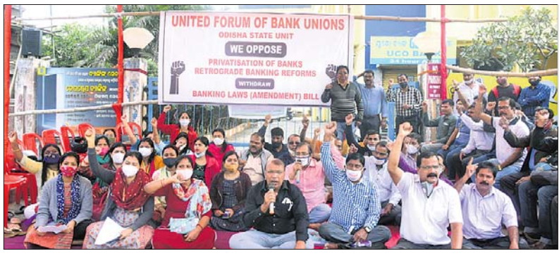
ରାଷ୍ଟ୍ରୀୟ ବ୍ୟାଙ୍କ ଘରୋଇକରଣକୁ ବିରୋଧ କରି ଯୁବପୁଞ୍ଜର ଓଡ଼ିଶା ଶାଖା ପକ୍ଷରୁ ସ୍ଥାନୀୟ ଅଶୋକ ନଗରସ୍ଥିତ ଯୁକୋ ବ୍ୟାଙ୍କ ସମ୍ମୁଖରେ ଧାରଣା ଦେଇଥିବା ବ୍ୟାଙ୍କ କର୍ମଚାରୀଗଣ।