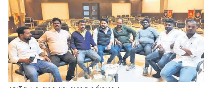
ପୋଲିସ୍ ଦ୍ୱାରା ଅଟକ ଥିବା କଂଗ୍ରେସ କର୍ମୀମାନେ।

କ୍ରୀଡ଼ାଭିତ୍ତିକୁମ୍ଭୀରୋଜ୍ଜ୍ୱଳକାର୍ଯ୍ୟ ଅନୁଧ୍ୟାନ ସହ ନବନିଯୁକ୍ତ ଶିକ୍ଷୟିତ୍ରୀଶିକ୍ଷକଙ୍କ ପ୍ରଶିକ୍ଷଣ ସମାବେଶରେ ଯୋଗଦେବା ପାଇଁ ମୁଖ୍ୟମନ୍ତ୍ରୀ ନବୀନ ପଟ୍ଟନାୟକ କଲିଙ୍ଗ ସ୍ମୃତିଭବନରେ ଯାଉଥିବାବେଳେ ପୋଲିସ୍ ବହୁ କଂଗ୍ରେସ କର୍ମୀଙ୍କୁ ଉଠାଇ ଆଣିଥିଲା। କଂଗ୍ରେସ ଭବନ ଭିତରେ ପୋଲିସ୍ ଭଙ୍ଗାହୁଇ ଏବଂ ଛାତ୍ର କଂଗ୍ରେସ କର୍ମୀଙ୍କୁ ମରଣାନ୍ତକ ଆକ୍ରମଣ ପ୍ରତିବାଦରେ ମୁଖ୍ୟମନ୍ତ୍ରୀଙ୍କ ଗସ୍ତକୁ ବିରୋଧ କରିବା ସହ ପ୍ରଶ୍ନ ପଚାରିବା ପାଇଁ କଂଗ୍ରେସ ପ୍ରସ୍ତୁତ ରହିଥିଲା। ହେଲେ ଏହା ପୂର୍ବରୁ ପୋଲିସ୍ ସୂଚନା ପାଇବା ପରେ ପ୍ରଦେଶ ଛାତ୍ର କଂଗ୍ରେସ