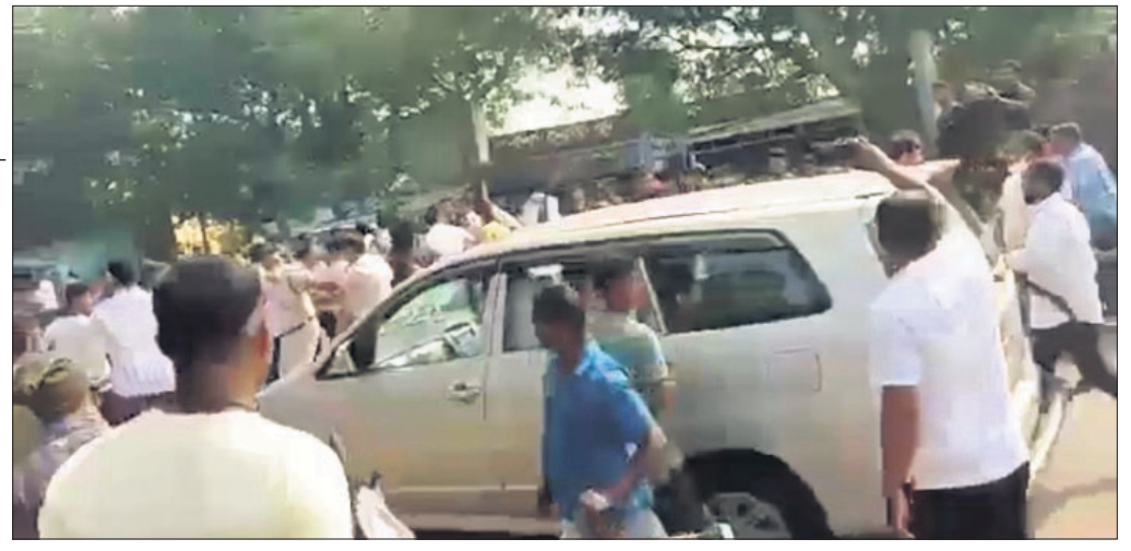
ଅଣ୍ଟାମାଡ଼ ଓ କଳାପତାକା ସମୟରେ ଦେଖାଦେଇଥିବା ଉତ୍ତେଜନା ।