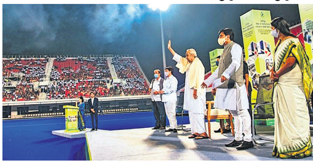
ଶିକ୍ଷକ ପ୍ରଶିକ୍ଷଣ କାର୍ଯ୍ୟକ୍ରମରେ ମୁଖ୍ୟମନ୍ତ୍ରୀ ନବୀନ ପଟ୍ଟନାୟକ ସମେତ ଅନ୍ୟମାନେ।

ଭୁବନେଶ୍ୱର, ୧୬/୧୨ (ବ୍ୟୁରୋ) ପିଲାମାନେ ଅନନ୍ତ ସମ୍ଭାବନାର ପ୍ରତୀକ। ସେମାନଙ୍କ ମଧ୍ୟରେ ନୂଆ ଆଶା ଜାଗ୍ରତ କରିବା, ସେମାନଙ୍କ କଳ୍ପନାକୁ ଶକ୍ତିଦେବା ଏବଂ ଅଧ୍ୟୟନ ପ୍ରତି ଆଗ୍ରହ ସୃଷ୍ଟି କରିବାରେ ଶିକ୍ଷକମାନେ ପ୍ରମୁଖ ଭୂମିକା ଗ୍ରହଣ କରିଥାନ୍ତି। ଛାତ୍ରାଛାତ୍ରୀଙ୍କ ମଧ୍ୟରେ ସୃଜନଶକ୍ତିର ବିକାଶ ସହିତ ଆତ୍ମବିଶ୍ୱାସ ବଢ଼ାଇବା ଦିଗରେ କାର୍ଯ୍ୟ କରିବାକୁ ମୁଖ୍ୟମନ୍ତ୍ରୀ ନବୀନ ପଟ୍ଟନାୟକ ଶିକ୍ଷକ ସମାଜକୁ ପରାମର୍ଶ ଦେଇଛନ୍ତି। ଭୁବନେଶ୍ୱରସ୍ଥିତ କଳିଙ୍ଗ ଷ୍ଟାଡ଼ିୟମରେ ଗୁରୁବାର ଆୟୋଜିତ ୬, ୧୩୧ ନବନିଯୁକ୍ତ ଶିକ୍ଷକମାନଙ୍କ ପ୍ରଶିକ୍ଷଣ କାର୍ଯ୍ୟକ୍ରମରେ ଉଦ୍‌ଘାଟନା ଦେଇ ମୁଖ୍ୟମନ୍ତ୍ରୀ କହିଛନ୍ତି, ଶିକ୍ଷା ହେଉଛି ସମାଜର ସାମୁହିକ ଆଶା ଓ ଆକାଂକ୍ଷାର ପ୍ରତୀକ। ଶିକ୍ଷା ବ୍ୟବସ୍ଥାର ଆଗ ଭାବେ ଶିକ୍ଷକଙ୍କୁ ଭବିଷ୍ୟତ ପିଢ଼ି ତଥା ନୂଆ ଓଡ଼ିଶା ଗଠନରେ ଯୋଡ଼ିଦେବାକୁ ପଡ଼ିବ। ନିକଟରେ ଆରମ୍ଭ ହୋଇଥିବା ରୂପାନ୍ତରଣରେ ସମ୍ପର୍କ ସହଯୋଗୀ ଭାବେ ଦାୟିତ୍ୱ ଗ୍ରହଣକାରୀ ମୁଖ୍ୟମନ୍ତ୍ରୀ ସମସ୍ତଙ୍କୁ ଆହ୍ୱାନ ଦେଇଛନ୍ତି। ଏହି ଅବସରରେ ପୂର୍ବତନ ରାଷ୍ଟ୍ରପତି ଡ.