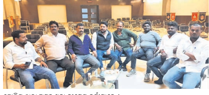
ପୋଲିସ୍ ଦ୍ୱାରା ଅଟକ ଥିବା କଂଗ୍ରେସ କର୍ମୀମାନେ ।

କ୍ରୀଡ଼ାଭିତ୍ତିକୁମ୍ଭୀରୋଜ୍ଜ୍ୱଳକାର୍ଯ୍ୟ ଅନୁଧ୍ୟାନ ସହ ନବନିଯୁକ୍ତ ଶିକ୍ଷୟିତ୍ରୀଶିକ୍ଷକଙ୍କ ପ୍ରଶିକ୍ଷଣ ସମାବେଶରେ ଯୋଗଦେବା ପାଇଁ ମୁଖ୍ୟମନ୍ତ୍ରୀ ନବୀନ ପଟ୍ଟନାୟକ କଲିଙ୍ଗ ସ୍ମୃତିଭବନରେ ଯାଉଥିବାବେଳେ ପୋଲିସ୍ ବହୁ କଂଗ୍ରେସ କର୍ମୀଙ୍କୁ ଉଠାଇ ଆଣିଥିଲା । କଂଗ୍ରେସ ଭବନ ଭିତରେ ପୋଲିସ୍ ଭଙ୍ଗାହୁଏ ଏବଂ ଛାତ୍ର କଂଗ୍ରେସ କର୍ମୀଙ୍କୁ ମରଣାନ୍ତକ ଆକ୍ରମଣ ପ୍ରତିବାଦରେ ମୁଖ୍ୟମନ୍ତ୍ରୀଙ୍କ ଗସ୍ତକୁ ବିରୋଧ କରିବା ସହ ପ୍ରଶ୍ନ ପଚାରିବା ପାଇଁ କଂଗ୍ରେସ ପ୍ରସ୍ତୁତ ରହିଥିଲା । ହେଲେ ଏହା ପୂର୍ବରୁ ପୋଲିସ୍ ସୂଚନା ପାଇବା ପରେ ପ୍ରବେଶ ଛାତ୍ର କଂଗ୍ରେସ