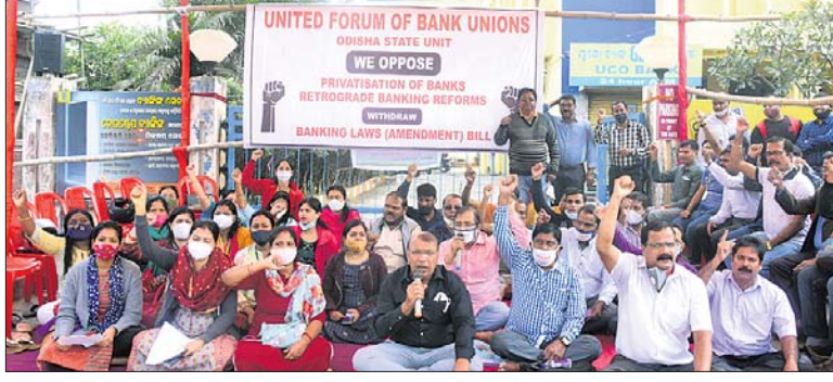
ରାଷ୍ଟ୍ରୀୟ ବ୍ୟାଙ୍କ ଘରୋଇକରଣକୁ ବିରୋଧ କରି ଯୁବପୁଞ୍ଜର ଓଡ଼ିଶା ଶାଖା ପକ୍ଷରୁ ସ୍ଥାନୀୟ ଅଶୋକ ନଗରସ୍ଥିତ ଯୁକୋ ବ୍ୟାଙ୍କ ସମ୍ମୁଖରେ ଧାରଣା ଦେଇଥିବା ବ୍ୟାଙ୍କ କର୍ମଚାରୀଗଣ।