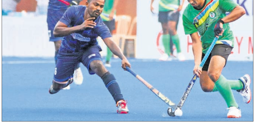
ଓଡ଼ିଶା-ଗୋଆ ମ୍ୟାଚରେ ଦୁଇ ଖେଳାଳି ବଲ୍ ପାଇଁ ସଂଘର୍ଷରେ।

ଗୋଲ ଦେଇଥିବାରୁ କ୍ଵାର୍ଟର ପାଇନାଲରେ ପ୍ରବେଶ କରିଥିଲା ଏବଂ ଓଡ଼ିଶାକୁ ନିରାଶ ହେବାକୁ ପଡ଼ିଥିଲା। ଅନ୍ୟ ପୁଲ୍ଗୁଡ଼ିକରେ ଭଲ ପ୍ରଦର୍ଶନ କରିଥିବା ଉତ୍ତର ପ୍ରଦେଶ, ଚାମିଲନାଡୁ ଓ ମହାରାଷ୍ଟ୍ର କ୍ଵାର୍ଟର ପାଇନାଲରେ ପ୍ରବେଶ କରିଛନ୍ତି। ପୂର୍ବରୁ କର୍ନାଟକ, ପଞ୍ଜାବ ଓ ଚଣ୍ଡିଗଡ଼ କ୍ଵାର୍ଟର ପାଇନାଲରେ ପହଞ୍ଚି ସାରିଛନ୍ତି। ଗୁରୁବାର ପୁଲ୍ ଲିଂ ଉତ୍ତର ପ୍ରଦେଶ ୬-୦ ଗୋଲରେ ଆସାମକୁ ହରାଇଥିବାବେଳେ ଝାଡ଼ଖଣ୍ଡ ୨-୧ରେ କେରଳକୁ ପରାସ୍ତ କରିଥିଲା। ତେବେ ଏହି ଦଳକୁ ପୁଲ୍ରେ ଦ୍ଵିତୀୟ ସ୍ଥାନରେ ସବୁଷ୍ଟ ହେବାକୁ ପଡ଼ିଥିଲା। ପୁଲ୍ ଏବଂ ଚାମିଲନାଡୁ ୧୧-୦ ଗୋଲରେ ହିମାଚଳକୁ ହରାଇଥିଲା। ଫଳରେ ଚାମିଲନାଡୁ ପ୍ରଥମ ଓ ହିମାଚଳ ଦ୍ଵିତୀୟ ସ୍ଥାନରେ ରହିଥିଲା। ପୁଲ୍ ଏବଂ ମ୍ୟାଚରେ ମହାରାଷ୍ଟ୍ର ୫-୧ ଗୋଲରେ ବିହାରକୁ ଓ ଛତିଶଗଡ଼ ୬-୧ ଗୋଲରେ ମିଜୋରାମକୁ ପରାସ୍ତ କରିଥିଲା।