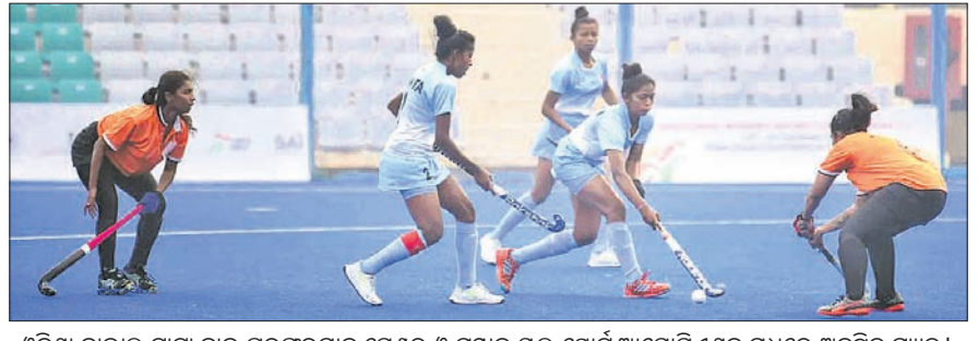
ଓଡ଼ିଶା ନାଭାଲ ଗାଗା ହାଇ ପରଫରମାନ୍ସ ସେଣ୍ଟର ଓ ପୁଣ୍ୟାଳ ସ୍କୁଲ ଷ୍ଟୋର୍ସ ଆସୋସିଏସନ ମଧ୍ୟରେ ଅନୁଷ୍ଠିତ ମ୍ୟାଚ।

ଭୁବନେଶ୍ଵର, ୧୬୧୨ (କ୍ରୀଡ଼ା ପ୍ରତିନିଧି) ନୂଆଦିଲ୍ଲୀରେ ଚାଲିଥିବା ପ୍ରଥମ ଖେଳୋ ଇଣ୍ଡିଆ ୨୧ ବର୍ଷରୁ କମ୍ ମହିଳା ହକି ଲିଭ୍ (ଫେବ୍-୧)ରେ ଓଡ଼ିଶା ନାଭାଲ ଗାଗା ହାଇ ପରଫରମାନ୍ସ ସେଣ୍ଟର (ଓଡ଼ିଶା ଖେଳୋ ଇଣ୍ଡିଆ ୨୧ ବର୍ଷରୁ କମ୍ ମହିଳା ହକି ଲିଭ୍)