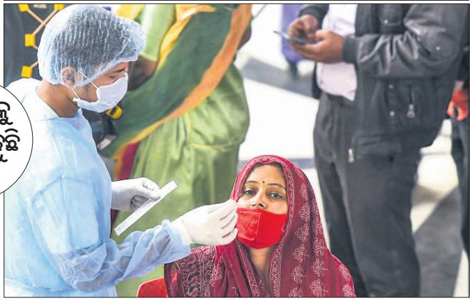
ଓମିକ୍ରନ୍‌କୁ ନେଇ ବହୁଛି ଚିନ୍ତା