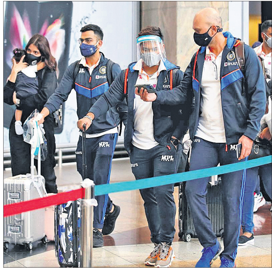
ରୁରୁବାର ଦକ୍ଷିଣ ଆଫ୍ରିକାରେ ପହଞ୍ଚିବା ପରେ ସ୍ତ୍ରୀ ଅନୁଷ୍ଠାନ ଶର୍ମିଷ୍ଠା ସହ ଅଧିକାରୀଙ୍କ ବିରାଟ କୋହଲି ଓ ଅନ୍ୟମାନେ।