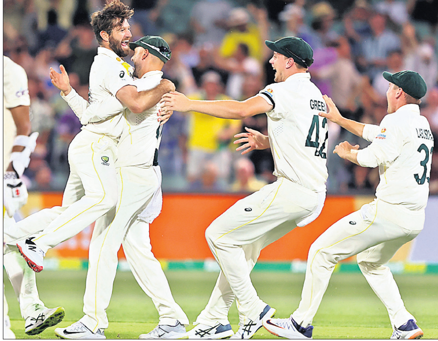
ହସିବ୍ ହମିଦ୍ ଉଇକେଟ ନେବାପରେ ଖୁସି ମୁହୂର୍ତ୍ତରେ ଆଷ୍ଟ୍ରେଲିଆର ମାଇକେଲ ନେସର (ବାମ) ।

ଇଂଲଣ୍ଡ ବିପକ୍ଷ ଦ୍ୱିତୀୟ ଆଶେଷ କ୍ରିକେଟ ଟେଷ୍ଟରେ ଶୁକ୍ରବାର ଦ୍ୱିତୀୟ ଦିନରେ ଆଷ୍ଟ୍ରେଲିଆ ୪୭୩/୯ ଘୋରରେ ଏହାର ପ୍ରଥମ ଇନିଂସ ଘୋଷଣା କରିଛି।