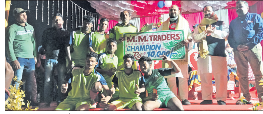
ଫାଇଲ୍ ସ୍କାରକୀ ପୁରବଳ ଚୁର୍ଣ୍ଣମେଣ୍ଟ ଚାମ୍ପିୟନ ଭଦ୍ରକ ଦଳର ଖେଳାଳିମାନେ ଅତିଥିଙ୍କଠାରୁ ପୁରସ୍କାର ଗ୍ରହଣ କରୁଛନ୍ତି।