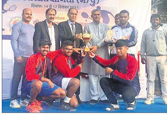
ଚାମ୍ପିୟନ କିଟ୍ ଦଳର ଖେଳାଳିମାନେ ଗ୍ରୀଟି ସହ ଅତିଥିଙ୍କୁ ରହଣରେ।

ଇତିଗଣତର ରାଜ୍ୟପୁରସ୍ଥିତ ପଶ୍ଚିମ ରବିଶଙ୍କର ଶୁକ୍ଳା ବିଶ୍ୱବିଦ୍ୟାଳୟ ପରିସରରେ ପୂର୍ବାଞ୍ଚଳ ଆନ୍ଧ୍ର ବିଶ୍ୱବିଦ୍ୟାଳୟ (ପୁରୁଷ) ଚେନିସ ଚୁର୍ଣ୍ଣମେଣ୍ଟ ଶୁକ୍ରବାର ଉଦ୍‌ଘାଟିତ ହୋଇଛି। ଏଥିରେ କିଛି ବିଶ୍ୱବିଦ୍ୟାଳୟ ଖେଲେ।