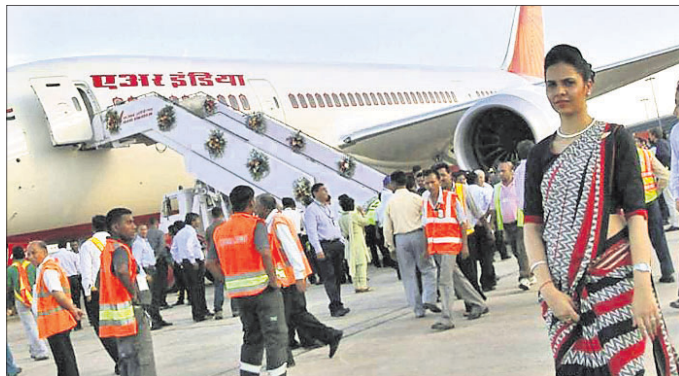
ହୋଇଯାଇଥିଲା । ମେ' ୨୫ ୨୦୨୦ରେ ଦେଶ ମଧ୍ୟରେ ବିମାନ ଚଳାଚଳ ପୁନଃ ଆରମ୍ଭ ହୋଇଥିଲାବେଳେ ୨୦୨୧ରେ ଲକ୍ଷ ଥିଲା । କରୋନା ଯୋଗୁ ଗତବର୍ଷ ମାର୍ଚ୍ଚ ଶେଷରେ ବିମାନ ଚଳାଚଳ ବନ୍ଦ ପାଇଁ ଅନୁମତି ଦିଆଯାଇଥିଲା । ପରବର୍ତ୍ତୀ ସମୟରେ କୋଭିଡ୍ କଟକଣାରେ କୋହଳ ଯୋଗୁ ଘରୋଇ ବିମାନ ଚଳାଚଳ କ୍ଷେତ୍ରରେ ଯାତ୍ରା ସଂଖ୍ୟାରେ ବୃଦ୍ଧି ଘଟିଥିଲା । ଗତ ଅକ୍ଟୋବରରେ

■ ଘରୋଇ ବିମାନ ଚଳାଚଳ କ୍ଷେତ୍ର ■ ୨୦୨୦ ନଭେମ୍ବର ତୁଳନାରେ ୬୫% ବୃଦ୍ଧିଲା