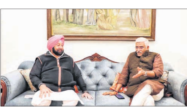
ମୁଖ୍ୟମନ୍ତ୍ରୀ ପ୍ରାଣୀ କରାଯିବ କି ଉତ୍ତର ଖୁବ୍ଖାନ୍ଦ ମିଳିଯିବ। ଅମରିନ୍ଦର ପ୍ରଶ୍ନରେ ଗଜେନ୍ଦ୍ର କହିଥିଲେ, ମେଣ୍ଟ କହିଛନ୍ତି, ମେଣ୍ଟ ସମ୍ପର୍କରେ କିଛିଦିନ ନିଜେ ହେଉଛି ପରିଚୟ। ସବୁକିଛି ହେଲା ଭାଜପା ନେତୃତ୍ୱ ସହ

ଦଳ ସହ ଏକାଠି ଲଢ଼ିବ ବୋଲି ଗଜେନ୍ଦ୍ର ଘୋଷଣା କରିଛନ୍ତି। ପୂର୍ବରୁ ଗଜେନ୍ଦ୍ର ବୃତ୍ତିଗତରେ ଅମରିନ୍ଦରଙ୍କ ସହ ଆଲୋଚନା କରିଥିଲେ।