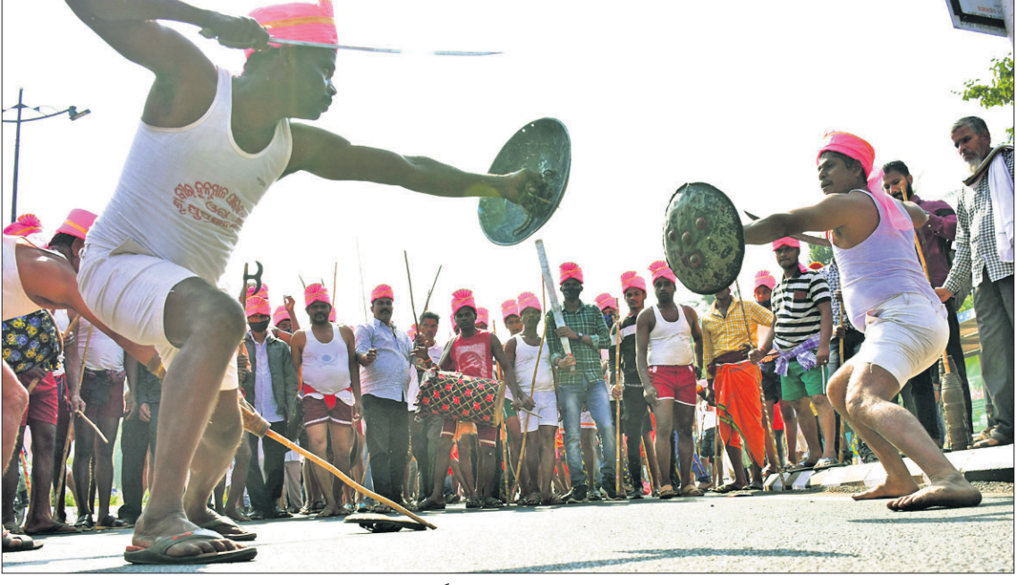
ଭୁବନେଶ୍ୱର ଜନପଥରେ ଶୁକ୍ରବାର ପାଇକମାନେ ସମରକଳା ପ୍ରଦର୍ଶନ କରୁଛନ୍ତି।