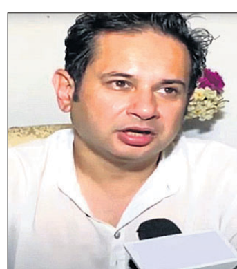
ପ୍ରଦେଶୀୟ କିଶୋର ଦେବ ବର୍ମା

ତ୍ରିପୁରାରେ ୨ ଆଞ୍ଚଳିକ ଦଳ ମଧ୍ୟରେ ସଂଘର୍ଷ ଘଟିଛି। ତ୍ରିପୁରା ରାଜ ପରିବାରର ସଦସ୍ୟ ତଥା ପ୍ରୋଗ୍ରେସିଭ୍ ରିଜିଅନାଲ ଆଲିଆନ୍ସ (ଟିଆଇଆର୍ଏ) ମୋଥର ଅଧ୍ୟକ୍ଷ ପ୍ରଦେଶୀୟ କିଶୋର ଦେବ ବର୍ମାଙ୍କ ଦଳ ଓ ତ୍ରିପୁରା ପିପୁଲ୍ସ ଫ୍ରଣ୍ଟ (ଟିପିଏଫ୍)ର କର୍ମୀମାନଙ୍କ ମଧ୍ୟରେ ହେଉଥିଲା।