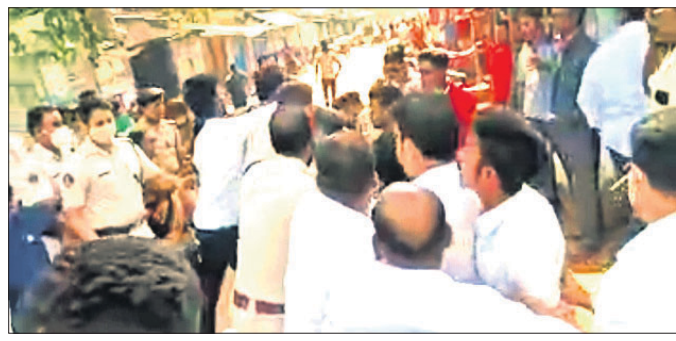
ଜରଣା ହରିଭାଇନା ଛକରେ କଂଗ୍ରେସ ଓ ବିଜେଡି କର୍ମୀମାନେ ମୁହାଁମୁହିଁ