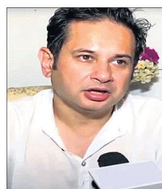
ପ୍ରଦେଶୀୟ କିଶୋର ଦେବ ବର୍ମା

ତ୍ରିପୁରାରେ ୨ ଆଞ୍ଚଳିକ ଦଳ ମଧ୍ୟରେ ସଂଘର୍ଷ ଘଟିଛି। ତ୍ରିପୁରା ରାଜ ପରିବାରର ସଦସ୍ୟ ତଥା ପ୍ରୋଗ୍ରେସିଭ୍ ରିଜିଅନାଲ ଆଲିଆନ୍ସ (ଟିଆଇଆର୍ଏ) ମୋଥର ଅଧ୍ୟକ୍ଷ ପ୍ରଦେଶୀୟ କିଶୋର ଦେବ ବର୍ମାଙ୍କ ଦଳ ଓ ତ୍ରିପୁରା ପିପୁଲ୍ସ ଫ୍ରଣ୍ଟ (ଟିପିଏଫ୍)ର କର୍ମୀମାନଙ୍କ ମଧ୍ୟରେ ହୋଇଥିଲା।