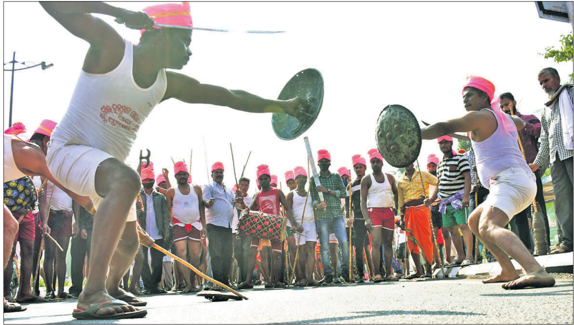
ଭୁବନେଶ୍ୱର ଜନପଥରେ ଶୁକ୍ରବାର ପାଇକମାନେ ସମରକଳା ପ୍ରଦର୍ଶନ କରୁଛନ୍ତି।