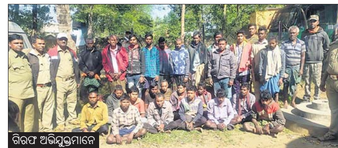
କେନ୍ଦ୍ରସର, ୧୭।୧୨ (ସ.ପ୍ର.)

କେନ୍ଦ୍ରସର ଜିଲା ଘଟଣା ରୋଜି ଅଧୀନ ଅଟେ। ଜଙ୍ଗଲରୁ ଗଛ କାଟିବା ଅଭିଯୋଗରେ ୨୬ଜଣଙ୍କୁ ବନ୍ଦ ଦିଆଗଲା।