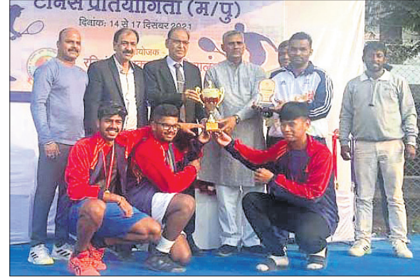
ଚାମ୍ପିୟନ କିଟ୍ ଦଳର ଖେଳାଳିମାନେ ଚୁପ୍ଟି ସହ ଅତିଥି ଗ୍ରହଣ କରୁଛନ୍ତି।

ଇତିଶଗଡ଼ର ରାୟପୁରସ୍ଥିତ ପଣ୍ଡିତ ରବିଶଙ୍କର ଶୁକ୍ଳା ବିଶ୍ୱବିଦ୍ୟାଳୟ ପରିସରରେ ପୂର୍ବାଞ୍ଚଳ ଆନ୍ଧ୍ର ବିଶ୍ୱବିଦ୍ୟାଳୟ (ପୁରୁଷ) ଚେନିସ ରୁନିମେଣ୍ଟ ଶୁକ୍ରବାର ଉଦ୍‌ଘାଟିତ ହୋଇଛି। ଏଥିରେ କିଟ୍ ବିଶ୍ୱବିଦ୍ୟାଳୟ ଖେଳେ।