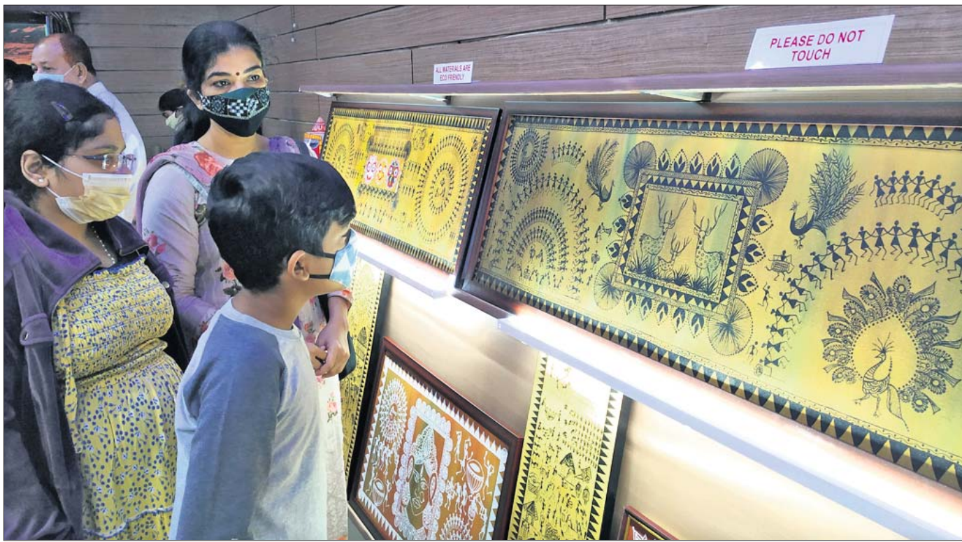
କଟକ ଯୋଗାଣିତ ରାଜ୍ୟ ନୌବାଣିଜ୍ୟ ସଂଗ୍ରହାଳୟ ସଭାଗୃହରେ ଶୁକ୍ରବାର ଆୟୋଜିତ ଆଦିବାସୀ କଳା ପ୍ରଦର୍ଶନୀକୁ ଲୋକେ ବୁଲି ଦେଖୁଛନ୍ତି।

କୋରାପୁଟ/କନ୍ୟପୁର, ୧୭।୧୨ (ନି.ପ୍ର.): କେ-କେ ଲାଇନରେ ଶୁକ୍ରବାର ମାଲବାହୀ ଟ୍ରେନ ଲାଇନରୁ ଫଳାଣି। ଫଳାଣିରେ କିରଣ୍ଡୁଲ-କୋରାପୁଟ ମଧ୍ୟରେ ଯାତ୍ରାବାହୀ ଟ୍ରେନ ଚଳାଚଳ ବାଧାପ୍ରାପ୍ତ ହୋଇଛି। ଏହି ଲାଇନରେ ଯାତ୍ରାବାହୀ ସମସ୍ତ ଯାତ୍ରାବାହୀ ଟ୍ରେନ ଚଳାଚଳକୁ ରେଳ ବିଭାଗ ବାତିଲ କରିଛି। କିରଣ୍ଡୁଲରୁ କୁହାପଥର ଧରି ବିଶାଖାପାଟଣା ଯାତ୍ରାବାହୀ ଏହି ମାଲବାହୀ ଟ୍ରେନ ଛଡ଼ିଗାତ ରାଜ୍ୟ ବାହାରେ ଲାଇନରୁ ଫଳାଣି ହୋଇଥିଲା। ଖବରପାଇଁ ପଟଣା ସ୍ଥଳରେ ୨ଟି ଟିମ୍ ପହଞ୍ଚି ଉଦ୍ଧାର କାର୍ଯ୍ୟ କରି ରଖିଛନ୍ତି। ମାଲବାହୀ ଟ୍ରେନ ଲାଇନରୁ ଫଳାଣି କିରଣ୍ଡୁଲରୁ କୋରାପୁଟ ଯାଏ ଏକପ୍ରକାର ଟ୍ରେନ ବାତିଲ କରାଯାଇଛି। ତେବେ କୋରାପୁଟରୁ ବିଶାଖାପାଟଣା ଟ୍ରେନ ଚଳାଚଳ ସ୍ୱାଭାବିକ ରହିବ ବୋଲି ରେଳ ବିଭାଗ ସୂଚନା ଦେଇଛି।