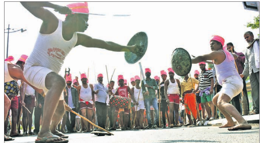
ଭୁବନେଶ୍ୱର ଜନପଥରେ ଶୁକ୍ରବାର ପାଇକମାନେ ସମରକଳା ପ୍ରଦର୍ଶନ କରୁଛନ୍ତି।

୧୮୧୭ ମସିହା ପାଇକ ବିଦ୍ରୋହକୁ ଭାରତର ପ୍ରଥମ ସ୍ୱାଧୀନତା ସଂଗ୍ରାମ ମାନ୍ୟତା ପ୍ରଦାନ ଓ ପାଇକ ସ୍ଥାନକା ନିର୍ମାଣ ଦାବିରେ ରାଜରାସ୍ଥୀକୁ ଓହ୍ଲାଇଛି ଓଡ଼ିଶା ବୀର ମହାସଂଘ। ରାଜ୍ୟର ପାଇକଙ୍କୁ ଏକାଠି କରିବା ସହ ଆଉଏକ ସଂଗ୍ରାମ ପାଇଁ ବୀର ଧ୍ୱନି ବଜାଇଛି। ଏଥିପାଇଁ ଶୁକ୍ରବାର ଖୋର୍ଦ୍ଧାରେ ବରୁଣେଇ ପାଦଦେଶ ଓ ରାଜଧାନୀ ଭୁବନେଶ୍ୱରଠାରେ ପାଇକ ମେଳି ହୋଇଥିଲା। ଖୋର୍ଦ୍ଧା, ଗଞ୍ଜାମ, ପୁରୀ, କନ୍ଧମାଳ, ଅନୁଗୋଳ, ତେଜାନାଳ ଆଦି ଅଞ୍ଚଳରୁ ମହାଜାରରୁ ଉର୍ଦ୍ଧ୍ୱ ପାଇକ ଆଖଡ଼ା ଦଳ, ଦଳେଇ, ଦଳବେହେରା, ପାଇକ ସର୍ଦ୍ଦାର, ଐତିହାସିକ ଓ ସାମରିକ ପରମ୍ପରାର ଗବେଷକ ସାମିଲ ହୋଇଥିଲେ। ମା ବରୁଣେଇକୁ ପୂଜାର୍ଚ୍ଚନା କରି ଶୋଭାଯାତ୍ରାରେ ଖୋର୍ଦ୍ଧାଗଡ଼ରୁ ବୀର ମାଟି ସଂଗ୍ରହ କରି ପଞ୍ଚପାଇକ ମହାରଥୀଙ୍କୁ ପୁଷ୍ପମାଳ୍ୟ ପ୍ରଦାନ କରିବା ପରେ ସେମାନେ ଖୋର୍ଦ୍ଧା ସହର ପରିକ୍ରମା କରିଥିଲେ। ପରେ ମଶାଳ ଯାତ୍ରା ଭୁବନେଶ୍ୱର ଅଭିଯୁକ୍ତ ବାହାରିଥିଲା। ପାଇକ ବୀରଙ୍କ ବୀରତ୍ୱର ଗାଥା ଉଚ୍ଚାରିତ