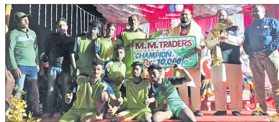
ଫୁଲ୍ ସ୍ମାରକୀ ପୁରବଳ ରୁନିମେଣ୍ଟର ଚାମ୍ପିୟନ ଭଦ୍ରକ ଦଳର ଖେଳାଳିମାନେ ଅତିଥିକଠାରୁ ପୁରସ୍କାର ଗ୍ରହଣ କରୁଛନ୍ତି।

ଲକ୍ଷ୍ମୀ ପ୍ରାଞ୍ଚିକର ମୁଖ୍ୟ କୋର୍ ଭାବେ ଶୁକ୍ରବାର ନିମ୍ନି ପାଇଛନ୍ତି। ଫ୍ଲୋର ଇତିମଧ୍ୟରେ ପଞ୍ଚାବ କିଙ୍ଗ୍ସ ସହକାରୀ କୋର୍ ପଦବୀକୁ ଓହରି ଯାଇଥିଲେ। ଗତ ଦୁଇ ଦିନ ପଞ୍ଚାବର ଅଧିନାୟକ ରହିଥିବା କେ.ଏଲ. ରାହୁଲ ମଧ୍ୟ ପଞ୍ଚାବ ଗୋଏଙ୍କାଙ୍କ ପ୍ରାଞ୍ଚିକରେ ଯୋଗଦାନ କରିବେ ବୋଲି ଆଶା କରାଯାଉଛି। ଫ୍ଲୋର ଆଇପିଏଲ୍-୨୦୨୦ ପୂର୍ବରୁ ଗତ ଦୁଇ ଦିନ ଧରି ମୁଖ୍ୟ କୋର୍ ଅନିଲ କୁମ୍ଭଲେଙ୍କ ସହ କାର୍ଯ୍ୟ କରିଆସୁଥିଲେ। ଜିୟାଫ୍ରେ ଏହି ମହାନ୍ ଖେଳାଳିଙ୍କ କୋର୍ଟ ସମୟରେ ଇଂଲଣ୍ଡ ଟି୨୦ ବିଶ୍ୱକପ୍ ଚାଲିଗଲେ ଚିତ୍ତହୀନ। ଏହି ଦଳ ଆହୁରି ମଧ୍ୟ ଟେଷ୍ଟ ରାକ୍ଷାକର୍ତ୍ତାରେ ନୟରଫୁନ ଘ୍ନାନ ଦଖଲ କରିଥିଲା। ଆଣ୍ଡି ଆହୁରି ମଧ୍ୟ କାରବନ୍ଧନ ପ୍ରିମିୟର ଲିଗ୍ (କେପିଏଲ୍)ରେ ପିବି କେଏସ୍ ମାଲିକାଦେବ ରହିଥିବା ବେଳେ ଲକ୍ଷ୍ମୀ କିଙ୍ଗ୍ସ ଦଳ ପାଇଁ କାର୍ଯ୍ୟ କରିଛନ୍ତି। ଗୋଏଙ୍କାଙ୍କ ନେତୃତ୍ୱାଧୀନ ଆଇପିଏଲ୍-୨୦୧୦ କୋର୍ଟ ବଙ୍କା ବିନିମୟରେ ଲକ୍ଷ୍ମୀ ପ୍ରାଞ୍ଚିକ ଜୟ କରିଛି।