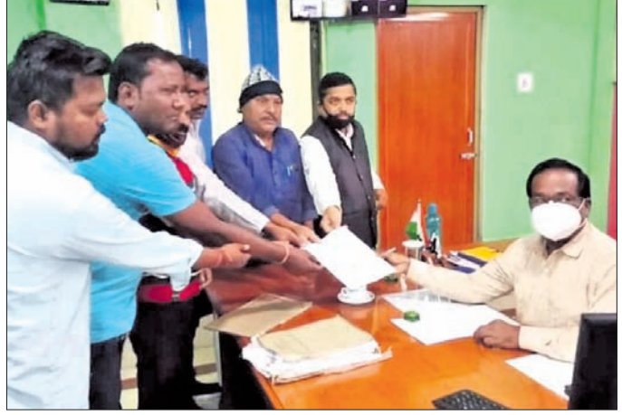
ଏଡିଏମ୍‌ଙ୍କୁ ଜିଲା କଂଗ୍ରେସ ପଛୁଆଦର୍ଶ ବିଭାଗ ପକ୍ଷରୁ ଦାବିପତ୍ର ଦିଆଯାଇଛି।