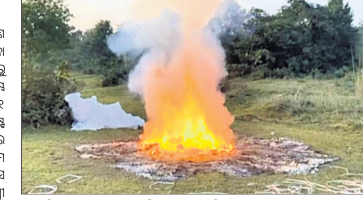
ଜବତ ବିଚ୍ଛୋରକ ସାମଗ୍ରୀକୁ ପୋଡ଼ି ନଷ୍ଟ କରାଯାଇଛି।