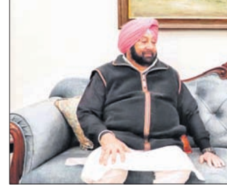
ମୁଖ୍ୟମନ୍ତ୍ରୀ ପ୍ରାଣୀ କରାଯିବ କି ଉତ୍ତର ଖୁଦ୍‌ଶାନ୍ତ ମିଳିଯିବ। ଅମରିନ୍ଦର ପ୍ରଶ୍ନରେ ଗଜେନ୍ଦ୍ର କହିଥିଲେ, ମେଣ୍ଟ କହିଛନ୍ତି, ମେଣ୍ଟ ସମ୍ପର୍କରେ କିଛିଦିନ ହେଲା ଭାଜପା ନେତୃତ୍ୱ ସହ ଦେବେ ବୋଲି ଅମରିନ୍ଦର କହିଛନ୍ତି।

ଦଳ ସହ ଏକାଠି ଲଢ଼ିବ ବୋଲି ଗଜେନ୍ଦ୍ର ଘୋଷଣା କରିଛନ୍ତି। ପୂର୍ବରୁ ଗଜେନ୍ଦ୍ର ଚଣ୍ଡିଗଡ଼ରେ ଅମରିନ୍ଦରଙ୍କ ସହ ଆଲୋଚନା କରିଥିଲେ। ସ୍ୱରାଷ୍ଟ୍ର ମନ୍ତ୍ରୀ ଅମିତ୍ ଶାହା ଏବଂ ଭାଜପା ରାଷ୍ଟ୍ରପତି ଅଧ୍ୟକ୍ଷ ଜେ.ପି. ନନ୍ଦା ମେଣ୍ଟ ପାଇଁ ସହମତି ଦେଇସାରିଛନ୍ତି। ତେବେ ଆସନ ଭାଗବଣ୍ଟା ସମ୍ପର୍କରେ ଉପଯୁକ୍ତ ସମୟରେ ଜଣାଇ ଦିଆଯିବ ବୋଲି କେନ୍ଦ୍ରମନ୍ତ୍ରୀ କହିଛନ୍ତି। ତେବେ ନିର୍ବାଚନରେ ଅମରିନ୍ଦରଙ୍କ ମେଣ୍ଟର