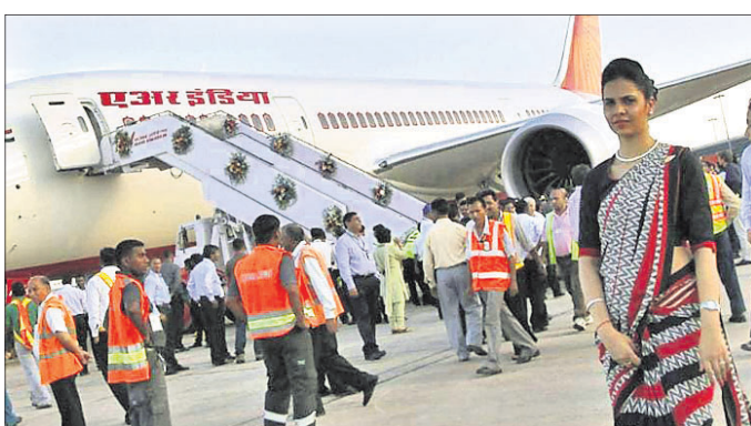
ଘରୋଇ ବିମାନ ଚଳାଚଳ ଶ୍ରେଣୀ ୨୦୨୦ ନଭେମ୍ବର ତୁଳନାରେ ୬୫% ବୃଦ୍ଧିଲା

ନୂଆଦିଲ୍ଲୀ, ୧୭।୧୨ କୋଭିଡ୍ ସଂକ୍ରମଣ ହାର କମିବା ସହିତ କଟକଣା ହ୍ରାସ ପାଇବା ଏବଂ ଅର୍ଥନୀତିରେ ସୁଧାର ଯୋଗୁ ନଭେମ୍ବରରେ ଭାରତରେ ଘରୋଇ ବିମାନ ଚଳାଚଳ ଶ୍ରେଣୀରେ ଯାତ୍ରୀଙ୍କ ସଂଖ୍ୟା ବୃଦ୍ଧି ଘଟିଛି। ଏହି ସଂଖ୍ୟା ୨୦୨୦ ନଭେମ୍ବର ତୁଳନାରେ ପ୍ରାୟ ୬୫% ଏବଂ ଚଳିତବର୍ଷ ଅକ୍ଟୋବର ତୁଳନାରେ ପ୍ରାୟ ୧୨% ବୃଦ୍ଧି। ବେସାମରିକ ବିମାନ ଚଳାଚଳ ନିର୍ଦ୍ଦେଶନା (ଡିଜିଏସ୍)ର ତଥ୍ୟ ଅନୁଯାୟୀ, ଗତ ମାସରେ ୧.୦୫ କୋଟି ଯାତ୍ରୀ ବେଶ ମଧ୍ୟରେ ଯାତ୍ରା କରିଛନ୍ତି। ଏହି ସଂଖ୍ୟା ନଭେମ୍ବର ୨୦୨୦ରେ ୬୩.୫୪ ଲକ୍ଷ ଥିଲା। କରୋନା ଯୋଗୁ ଗତବର୍ଷ ମାର୍ଚ୍ଚ ଶେଷରେ ବିମାନ ଚଳାଚଳ ବନ୍ଦ ପାଇଁ ଅନୁମତି ଦିଆଯାଇଥିଲା। ପରବର୍ତ୍ତୀ ବେଶ ମଧ୍ୟରେ ବିମାନ ଚଳାଚଳ ପୁନଃ ଆରମ୍ଭ ହୋଇଥିଲା ବେଳେ ୨୦୨୧ରେ ମହାମାରୀର ଦ୍ୱିତୀୟ ଲହରୀ ସମୟରେ ସାମିତ ବେସାମରିକ ବିମାନ ଚଳାଚଳ ପାଇଁ ଅନୁମତି ଦିଆଯାଇଥିଲା। ପରବର୍ତ୍ତୀ ବେଶ ମଧ୍ୟରେ ବିମାନ ଚଳାଚଳ ପୁନଃ ଆରମ୍ଭ ହୋଇଥିଲା ବେଳେ ୨୦୨୧ରେ ମହାମାରୀର ଦ୍ୱିତୀୟ ଲହରୀ ସମୟରେ ସାମିତ ବେସାମରିକ ବିମାନ ଚଳାଚଳ ପାଇଁ ଅନୁମତି ଦିଆଯାଇଥିଲା। ପରବର୍ତ୍ତୀ ବେଶ ମଧ୍ୟରେ ବିମାନ ଚଳାଚଳ ପୁନଃ ଆରମ୍ଭ ହୋଇଥିଲା ବେଳେ ୨୦୨୧ରେ ମହାମାରୀର ଦ୍ୱିତୀୟ ଲହରୀ ସମୟରେ ସାମିତ ବେସାମରିକ ବିମାନ ଚଳାଚଳ ପାଇଁ ଅନୁମତି ଦିଆଯାଇଥିଲା।