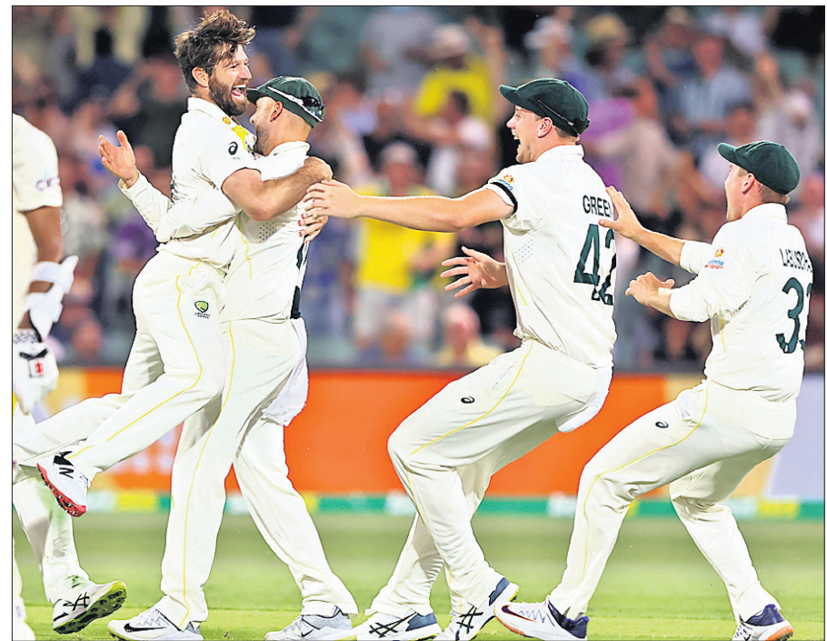
ହସିଦ୍ ହମିଦ୍ ରଜକେଟ୍ ନେବାପରେ ଷ୍ଟିଭ୍ ବ୍ଲିଥ୍ ପୂର୍ବଦିନ ଅଷ୍ଟ୍ରେଲିଆର ମାଇଲକେଲ ନେସେର (ବାମ)।

ହୋଇଛନ୍ତି। ଲାବୁସେନ୍ ୧୦୩ ରନ କରିଥିବା ବେଳେ ବ୍ଲିଥ୍ ୯୩ ରନ କରି ଅଧିକତଃ ଶତକକୁ ବଞ୍ଚିତ ହୋଇଥିଲେ। ଟେଷ୍ଟର ଘୋଷଣା କରିଥିଲା। ଇଂଲଣ୍ଡ ଦ୍ୱିତୀୟ ଦିନ ଖେଳ ଶେଷ ହୁଏ ୮.୪ ଓଭରରେ ୨ ରଜକେଟ୍ ବିନିମୟରେ ୧୭୨ରନ କରି ଏଂଗ୍ଲ୍ୟ ଟକାଉଛି। ଅଷ୍ଟ୍ରେଲିଆ ପ୍ରଥମ ଇନିଂସ ଘୋରାଠାରୁ ଭ୍ରମଣକାରୀ ଦଳ ଆହୁରି ୪୫୭ ରନ୍ ପଛୁଆ ରହିଛି। ଘରୋଇ ଦଳ ପୂର୍ବଦିନ ଅପମାତ୍ର ପ୍ରଥମ ଇନିଂସ ଘୋର ୨୨୧/୨୭