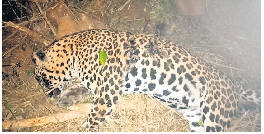
ପାଖରେ ପଡ଼ି ମରିଥିବା କଲରାପତରିଆ ବାଘ।