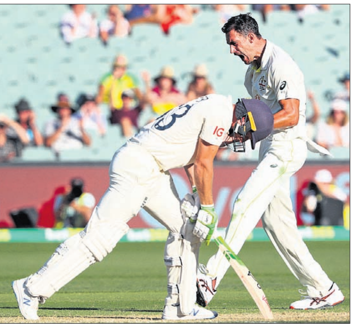
ଲକ୍ଷ୍ମୀ ଟେଷ୍ଟର ଚତୁର୍ଥ ଦିନରେ ଭାରତୀୟ ଟିମ୍ ପାଇଁ ଟେଷ୍ଟକୁ ନିୟନ୍ତ୍ରଣ କରିବା ପାଇଁ ଚ୍ୟାଲିଜିଂ ଅଷ୍ଟ୍ରେଲିଆ ପ୍ରଥମ ଇନିଂସରେ ଦମ୍ଭାବର ବ୍ୟାଟିଂ କରି ୧୫୦.୪ ଓଭରରେ

ଆଡିଲେଡ, ୧୮ ଡିସେମ୍ବର ୧୯୧୯ ଅଷ୍ଟ୍ରେଲିଆ ଓ ଭାରତ ଗ୍ରୀଷ୍ମଋତୁରେ ଚାଲିଥିବା ଲକ୍ଷ୍ମୀ ଟେଷ୍ଟ ଦ୍ଵିତୀୟ ଦିନ ଅଷ୍ଟ୍ରେଲିଆ ପ୍ରଥମ ଇନିଂସରେ ବୃହତ୍ ଅଗ୍ରଣୀ ହାସଲ କରି ଏହି ଟେଷ୍ଟ-ନାଭଟ୍ ଟିମ୍ ପାଇଁ ଟେଷ୍ଟକୁ ନିୟନ୍ତ୍ରଣ କରିବା ପାଇଁ ଚ୍ୟାଲିଜିଂ ଅଷ୍ଟ୍ରେଲିଆ ପ୍ରଥମ ଇନିଂସରେ ଦମ୍ଭାବର ବ୍ୟାଟିଂ କରି ୧୫୦.୪ ଓଭରରେ