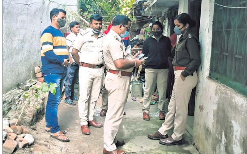
ଶନିବାର ପରେନିର୍ଦ୍ଦିଷ୍ଟ ଚିଠି ଓ ପୋଲିସ୍ ଘଟଣାସ୍ଥଳରେ ଛାନଭିତ୍ତ କରୁଛନ୍ତି ।

ବଲାଙ୍ଗୀର ସହର ଗାନ୍ଧୀନଗରପଡ଼ା ବରଫ ମିଲ୍ ସମ୍ମୁଖ ରିଭର ଶୁକ୍ରବାର ଅପରାହ୍ଣରେ ଘରେ ପଶି ଯୁବକଙ୍କୁ ହତ୍ୟା ଘଟଣାରେ ପୋଲିସ୍ ଜଣେ ନାବାଳକଙ୍କ ସମେତ ଦୁଇ ଜଣଙ୍କୁ ଧରିଥିଲା ।