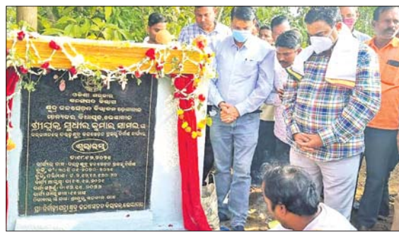
ବିଧାୟକ ପ୍ରକାଶ ଚନ୍ଦ୍ର ପ୍ରସାଦ ଗୁପ୍ତାଙ୍କ ଦ୍ୱାରା ପଢ଼ାଯାଇଥିବା ପଠ୍ୟପତ୍ର ।