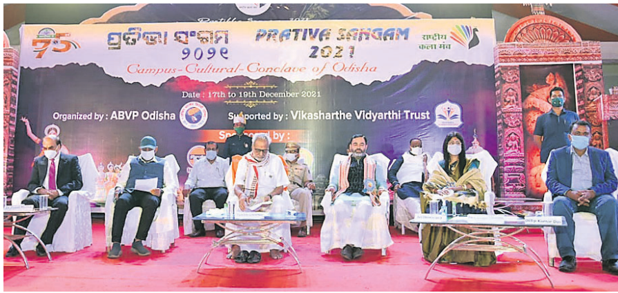
'ପ୍ରତିଭା ସଙ୍ଗମ'ର ରବିବାର ଉଦ୍‌ଘାଟନ ଅବସରରେ ରାଜ୍ୟପାଳ ପ୍ରଫେସର ଗଣେଶୀ ଲାଲଙ୍କ ସମେତ ଅନ୍ୟ ଅତିଥି ବୃନ୍ଦ।

ଭୁବନେଶ୍ୱର, ୧୯/୧୨(ବୁଧବେ) ଇତିହାସ ସାକ୍ଷୀ ଅଛି, ବିଦେଶରୁ ମହାନ ବ୍ୟକ୍ତିତ୍ୱମାନେ ଭାରତର ସୁନ୍ଦରତାରେ ନିଜକୁ ଉତ୍ସର୍ଗ କରି ନିଜ ଦେଶ ଛାଡି ୩୦୦୦ ଚାଲି ଆସିଛନ୍ତି। ଭାରତ ଏକ ବିଶେଷ ଯେଉଁଠି ଭାଇଭାଉ ଓ କଳା ସଂସ୍କୃତି ଭରପୁର ରହିଛି। ଏହା ରାଷ୍ଟ୍ରୀୟ କଳାର ମଞ୍ଚ, ଅର୍ଥ ହେଉଛି ସମଗ୍ର ବିଶ୍ୱ ଏକତା। ଆଜି ଆମ ମୁହଁରେ ମୁଖା (ମାଝ) ଲାଗିଛି। ଥରେ ସେ ମାଝକୁ କାଢି ଦେଖିବେ ସମସ୍ତେ ଆପଣଙ୍କୁ ନିଜର ଲାଗିବେ। ଆମେ ନିଜ ନିଜ ଭିତରେ ଯେଉଁ ଆକ୍ରୋଶ ମନୋଭାବ ରଖିଛେ, ଆକ୍ରୋଶର ମାଝ ପିନ୍ଧିଛେ, ତାକୁ ହଟେଇଲେ ହିଁ ଆମେ ଆମ ଏକତାକୁ ଆହୁରି ମଜଭୁତ କରିପାରିବା ବୋଲି ରାଜ୍ୟପାଳ ପ୍ରଫେସର ଗଣେଶୀ ଲାଲ କହିଛନ୍ତି। ଆଖି ଭାରତୀୟ ବିଦ୍ୟାର୍ଥୀ ପରିଷଦର ସାଂସ୍କୃତିକ ଗତିବିଧି ଓ ରାଷ୍ଟ୍ରୀୟ କଳା ମଞ୍ଚ ଓଡ଼ିଶାର