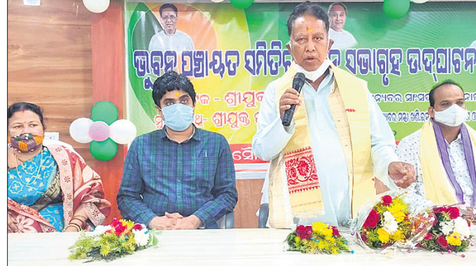
ବୈଠକରେ ମନ୍ତ୍ରୀଙ୍କ ସମେତ ଅନ୍ୟ ଅତିଥିବୃନ୍ଦ।

ଦେଶାନ୍ତରାଳ ଜିଲ୍ଲା ଭୁବନ କୁଳ କାର୍ଯ୍ୟାଳୟ ପରିସରରେ ଶନିବାର ମନ୍ତ୍ରୀ ପ୍ରଫୁଲ୍ଲ ମଲିକ କୌଟିଏ ଟଙ୍କା ବ୍ୟୟରେ ନିର୍ମିତ ୫ ନୂତନ ପ୍ରକଳ୍ପ ଉଦ୍ଘାଟନ କରିଛନ୍ତି। ୫ ନୂତନ ପ୍ରକଳ୍ପ ଉଦ୍ଘାଟନ କରିଛନ୍ତି। ତନ୍ମଧ୍ୟରେ ଅଧିକ ମୁଖ୍ୟ ଫାଟକ, କର୍ମଚାରୀଙ୍କ କ୍ୟାମ୍ପ, ଆଇସିଡିଏସ୍ ପରିବାର କ୍ୟାମ୍ପ, ନୂତନ ସଭାଗୃହ, ପରିସଂଖ୍ୟାନ କାର୍ଯ୍ୟାଳୟ ରହିଛି। ନୂତନ ସଭାଗୃହରେ ଅନୁଷ୍ଠିତ ଏକ ବୈଠକରେ ମନ୍ତ୍ରୀ ଯୋଗଦେଇ ତ୍ରୁପୁରୀୟ ପଞ୍ଚାୟତ ପ୍ରତିନିଧି ଏବଂ କର୍ମଚାରୀଙ୍କ ସହିତ ବିଭିନ୍ନ ଉନ୍ନୟନମୂଳକ କାର୍ଯ୍ୟ ସମ୍ପର୍କରେ ଆଲୋଚନା କରିଥିଲେ।