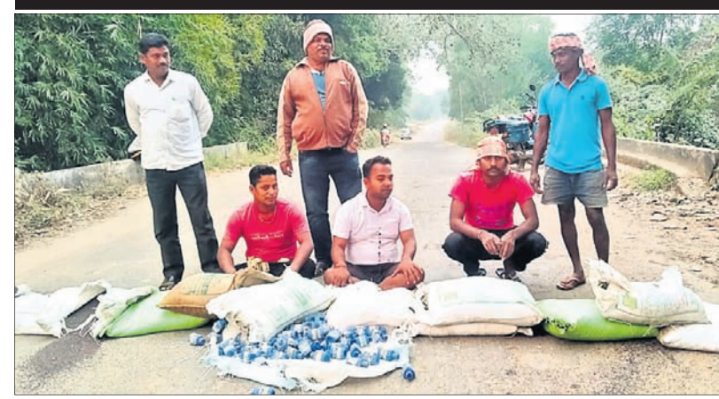
କୃଷି ସାମଗ୍ରୀ ଫୋପଡ଼ା ଯାଇଥିବା ଚାଷୀମାନେ ରାସ୍ତାରେକୋ କରିଛନ୍ତି।

ପର୍ଯ୍ୟନ୍ତ ଫୋପଡ଼ା ଯାଇଥିବା ସାମଗ୍ରୀ କେଉଁ ବିଭାଗର ସମ୍ପତ୍ତି ହେବ ତ ସ୍ପଷ୍ଟ ନ ଥିବା ବେଳେ ଘଟଣାର ଉଚ୍ଚସ୍ତରୀୟ ତଦନ୍ତ କରି କାର୍ଯ୍ୟାଳୟ ନେବାକୁ ଚାଷୀମାନେ ଦାବି କରିଛନ୍ତି। ନଚେତ୍ ଆଗାମୀ