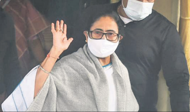
କେଏମ୍‌ସି ନିର୍ବାଚନ ପାଇଁ ଏକ ଗୁପ୍ତରେ ଭୋଟ ଦେଇ ଫେରୁଛନ୍ତି ପଶ୍ଚିମବଙ୍ଗ ମୁଖ୍ୟମନ୍ତ୍ରୀ ମମତା ବାନାର୍ଜୀ।