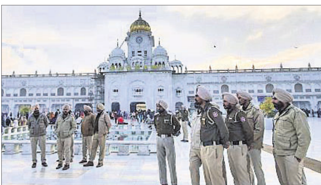
ଲିଞ୍ଚି ପରେ ସ୍ୱର୍ଣ୍ଣମନ୍ଦିର ବାହାରେ କଡ଼ା ସୁରକ୍ଷା ବ୍ୟବସ୍ଥା।

ପଞ୍ଜାବ ଅନୁପସରଣିତ ସ୍ୱର୍ଣ୍ଣମନ୍ଦିରରେ ଉତ୍ତ୍ୟକ୍ତ ଲୋକେ ଜଣଙ୍କୁ ପିଟି ମାରିଦେବା ଘଟଣାର ୨୪ ଘଣ୍ଟା ନ ପୂରୁଣ୍ଣ କପୁରଥାଲା ଜିଲ୍ଲାରେ ଅନ୍ୟ ଜଣେ ଯୁବକଙ୍କୁ ପିଟି ହତ୍ୟା କରିଛନ୍ତି। ସ୍ୱର୍ଣ୍ଣ ମନ୍ଦିରରେ ଶିକାରୀ ସମ୍ପ୍ରଦାୟ ପ୍ରାର୍ଥନା ତାଲିକାରେ ବେଳେ ଯୁବକ ଜଣଙ୍କ ରେଲିଂ ଡେଇଁ ମନ୍ଦିର ମଧ୍ୟରେ ପ୍ରବେଶ କରି ଗୁରୁଗ୍ରନ୍ଥ ସାହିବ ସମ୍ମୁଖରେ ଥିବା ଖଣ୍ଡକୁ ଛୁଇଁବାକୁ ଉଦ୍ୟମ କରିଥିଲେ ବୋଲି ଅଭିଯୋଗ ହୋଇଥିଲା। ଗୁରୁଗ୍ରନ୍ଥ ସାହିବକୁ ଅସମ୍ମାନ ଅଭିଯୋଗରେ ଉତ୍ତ୍ୟକ୍ତ ଲୋକେ ଯୁବକଙ୍କୁ