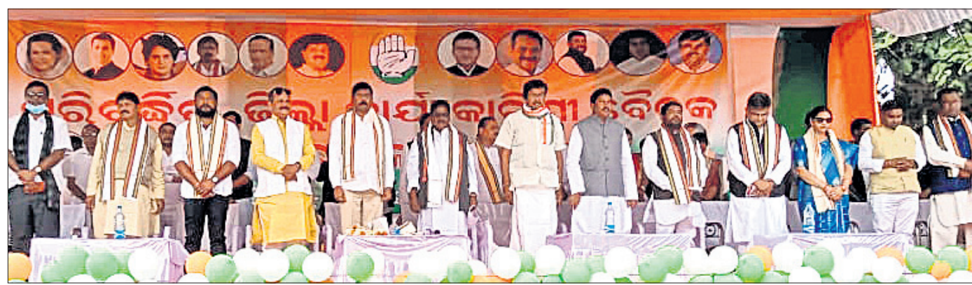
ବୈଠକରେ କଂଗ୍ରେସ ରାଜ୍ୟ ପ୍ରଭାସୀ ଚେଳା କୁମାରଙ୍କ ସହ ଅନ୍ୟମାନେ ।