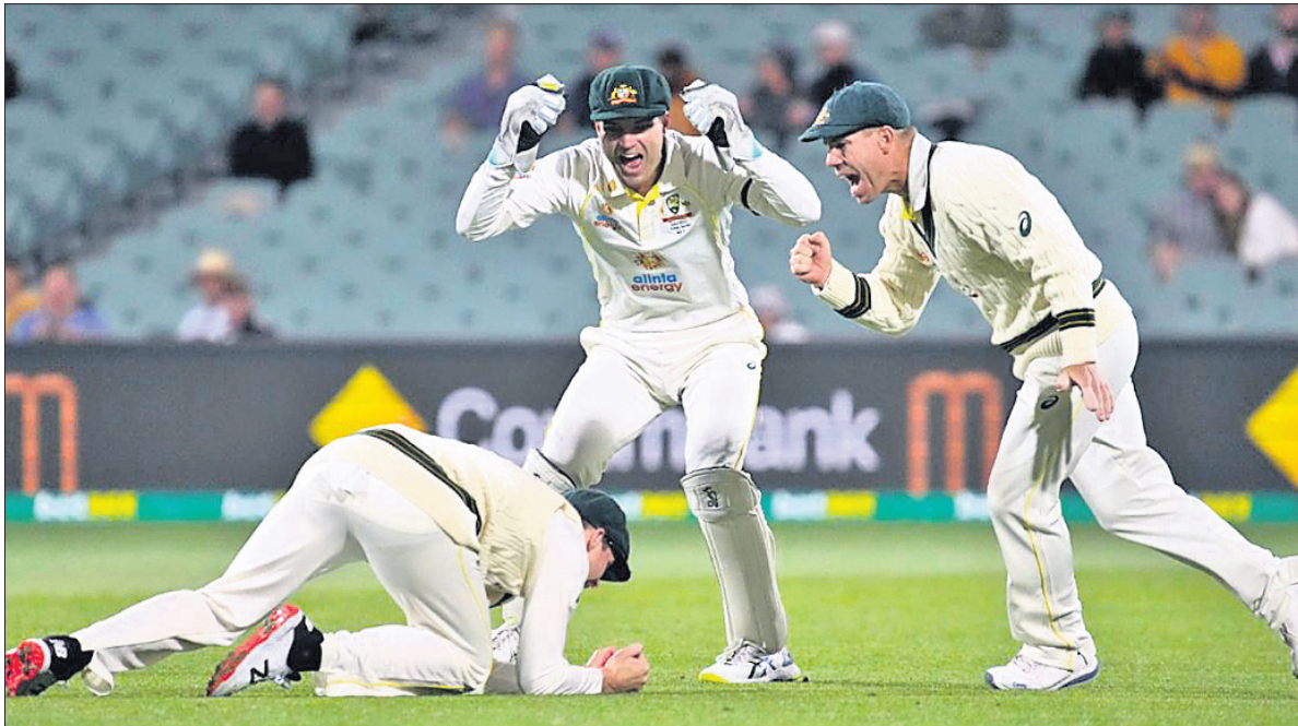
ସ୍କୁୟରେ ଇଂଲଣ୍ଡର ରୋରି ବର୍ଡ୍‌ଙ୍କ କ୍ୟାଚ ନେଉଛନ୍ତି ଅଷ୍ଟ୍ରେଲିଆର ଷ୍ଟିଭେନ ସ୍ମିଥ ।