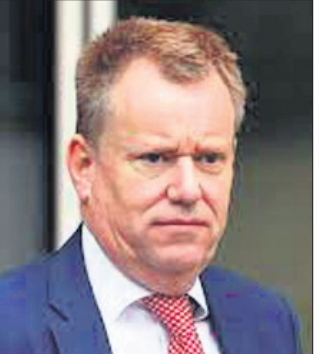
ଡାଭିଡ୍ ଫ୍ରସ୍କ ବୋରିସ୍ ଜନ୍‌ସନ

ମିଳୁଛି । ଏବେ ତ ଆୟକର ବିଭାଗ ଆସିଛି, ଆଗକୁ ପ୍ରବର୍ତ୍ତନ ନିର୍ଦ୍ଦେଶାଳୟ ଏବଂ ସିବିଆଇ ମଧ୍ୟ ଆସିବ । କିନ୍ତୁ ସମାଜବାଦୀ ପାର୍ଟିର ସାଧକମାନଙ୍କ ଅନୁମତି ନାହିଁ । ପଶ୍ଚିମବଙ୍ଗ ନିର୍ବାଚନରେ ମଧ୍ୟ ଭାଗ୍ୟ ଏପରି କରିଥିଲା । କିନ୍ତୁ ସୁପ୍ରୀମ କୋର୍ଟ ନାହିଁ ବୋଲି ସେ କହିଛନ୍ତି । ଶନିବାର ପ୍ରଧାନମନ୍ତ୍ରୀ ନରେନ୍ଦ୍ର ମୋଦି ଗଠା ଏକ୍ସପ୍ରେସ୍‌ରେ ଶିଳାମୟ କରି ଯୁପିଏ-ଯୋଗୀ-ଉପଯୋଗୀ ବୋଲି କହିଥିଲେ । ଏନେଇ ଅଖିଳେଶ କହିଛନ୍ତି, ମୁଖ୍ୟମନ୍ତ୍ରୀ ଯୋଗୀ ଅନୁପଯୋଗୀ ହୋଇଯାଇଛନ୍ତି ।