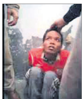
କପୁରଥାଲରେ ହତ୍ୟା ଶିକାର ହୋଇଥିବା ଯୁବକ।