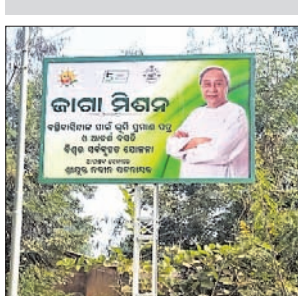
୮ ନଂ ଭାଗରେ ଲାଗାଯାଇଥିବା ବୋର୍ଡ।

ଜାଗା ମିଶନ ବୋର୍ଡ ଲାଗାଇବାକୁ ନବରଙ୍ଗପୁର ଜିଲ୍ଲା ଉତ୍ତରକୋଟ ପୌର ପରିଷଦ ଅଧୀନର ୨୭ଟି ବସ୍ତୁ ଅଞ୍ଚଳ ବିକ୍ରୟ କରାଯାଇଛି।