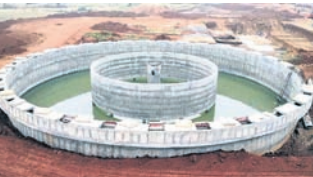
ପ୍ରକ୍ରିୟାକରଣ ଦ୍ଵାରା ବିଶୁଦ୍ଧ କରି ପାଇପ ପୋରେଇ ଘରକୁ ଘର ପଠାଇବା ଯୋଜନା ରହିଛି।

ନବରଙ୍ଗପୁର ଜିଲ୍ଲାର ୪ଟି ବ୍ଲକ୍‌ରେ ଘରକୁ ଘର ପାନୀୟ ଜଳ ଯୋଗାଇଦେବାକୁ ପରିକଳ୍ପନା କରି କେନ୍ଦ୍ର ସରକାରଙ୍କ ଉଦ୍ୟମରେ ମେରା ପାନୀୟ ଜଳ ପ୍ରକଳ୍ପ ଆରମ୍ଭ କରାଯାଇଥିଲା।