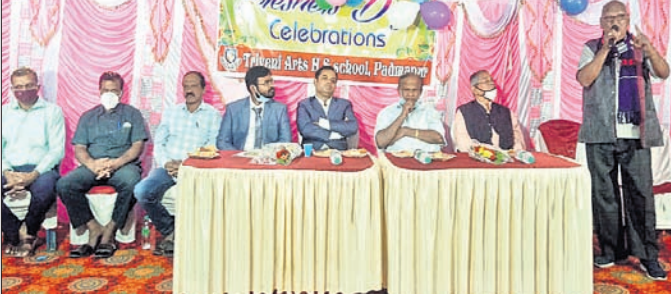
କାର୍ଯ୍ୟକ୍ରମରେ ମଞ୍ଚାସୀନ ଅତିଥିମାନେ।