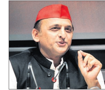
ଅଖିଳେଶ ଯାଦବ ଆସିଛନ୍ତି । ଆସନ୍ତା ବିଧାନସଭା ନିର୍ବାଚନରେ ଭାଜପା ପରାଜିତ ହେବ ବୋଲି ଏହି ଚଢ଼ାଉରୁ ସଙ୍କେତ

ବ୍ରିଟେନର ବ୍ରେକ୍ଜିଙ୍ଗ୍ ମନ୍ତ୍ରୀ ତାଭିଡ୍ ଫ୍ରଷ୍ଟ ବୋରିସ୍ ଜର୍ଜସନ କ୍ୟାବିନେଟରୁ ଇସ୍ତଫା ଦେଇଛନ୍ତି ।