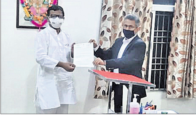
କୋରାପୁଟ ଏମ୍.ପି ସପ୍ତଗିରି ଉଲ୍ଲାକା ରାୟଗଡ଼ା ଜିଲ୍ଲାପାଳଙ୍କୁ ଦାବିପତ୍ର ପ୍ରଦାନ କରୁଛନ୍ତି।