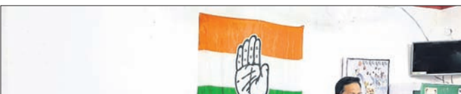
ଧରଣୀର ସମ୍ପାଦକଙ୍କୁ ବେଲେ ଦଳୀୟ ନେତା

ଜିଲ୍ଲାଭିତ୍ତିକ ଶିକ୍ଷକ ନିୟୁକ୍ତି ଗୁରୁତ୍ଵ ଦେବା ନେଇ ଜିଲ୍ଲା କଂଗ୍ରେସ ଦାବି କରିଛି।