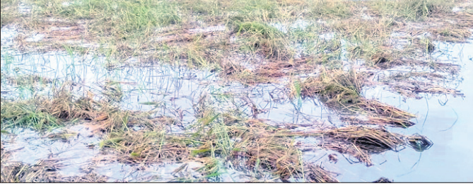
ପାଣିରେ ବୁଡି ରହିଥିବା ଧାନ ଫସଲ।

କମିଶନ କର୍ମଚାରୀମାନେ ଯାଇ କ୍ରମ୍ କର୍ମ କରୁଛନ୍ତି। ଚାଷୀମାନେ କ୍ଷତିଗ୍ରସ୍ତ ଜମି ଦେଖାଇ କ୍ରମ୍ କର୍ମ କରିବାକୁ କହିଲେ ମଧ୍ୟ ବାମା କମିଶନ କର୍ମଚାରୀମାନେ ଶୁଣି ନ ଥିବା ଅଭିଯୋଗ କରିଛନ୍ତି। ଏ ସମ୍ପର୍କରେ ଏଡିଏକ୍‌ସି ଏଗ୍ରୋ ବାମା କମିଶନ କର୍ମଚାରୀଙ୍କୁ ସୁରୁମାର ମାଉତିକ କହିବା କଥା ହେଲା ପ୍ରତି ପଞ୍ଚାୟତରେ ୪ଟି ପୁଅକୁ କ୍ରମ୍ କର୍ମ କରୁଛି। ସାବେଲାଇଟ ସର୍ତ୍ତେ