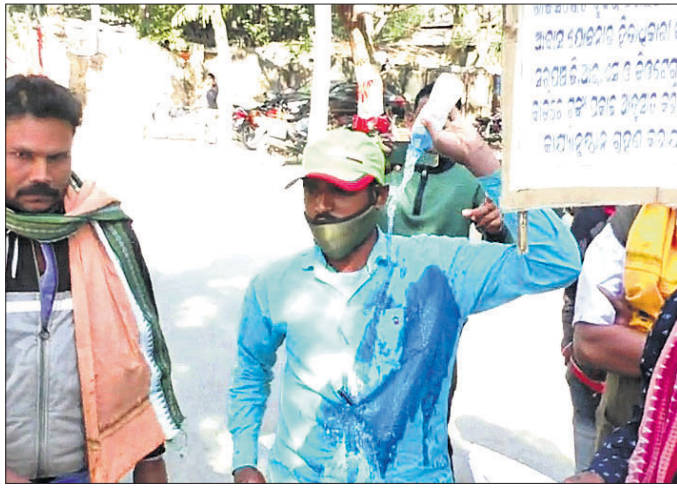
ଜିଲ୍ଲାପାଳଙ୍କ ଅଧିକ ସମ୍ମୁଖରେ ଆତ୍ମାହୁତି ଉଦ୍ୟମ କରୁଛନ୍ତି ଯୁବକ।