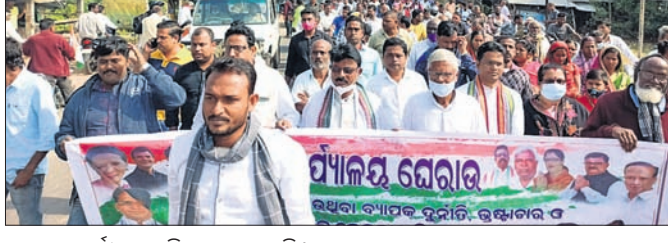
କଂଗ୍ରେସ କର୍ମୀମାନେ ବିକ୍ଷୋଭ କରୁଛନ୍ତି।