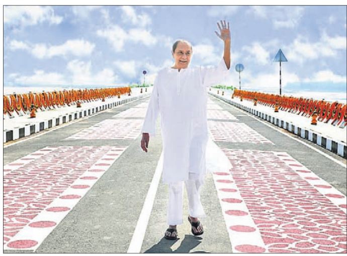
ଗୋପାଳାଧର-ସିଂହନାଥ ପାଠ-ବୈଦ୍ୟେଶ୍ୱର ଟି-ସେତୁରୁ ଯୋଗବାର ଲୋକାର୍ପଣ ପରେ ପୁଖ୍ୟମନ୍ତ୍ରୀ ନବୀନ ପଟ୍ଟନାୟକ ସେତୁ ଉପରେ ବୁଲି ମହାନଦୀର ମନୋରମ ଦୃଶ୍ୟକୁ ଉପଭୋଗ କରୁଛନ୍ତି। ଲୋକାର୍ପଣ ଟି-ସେତୁ।

ପାନାମା ପେପର୍ସ ଲିକ୍ ମାମଲାର ୩ ଶହରୁ ଉର୍ଦ୍ଧ୍ୱ ଭାରତୀୟଙ୍କ ନାମ ରହିଥିଲା। ସେମାନଙ୍କ ମଧ୍ୟରେ ଅଧିକାଂଶ ନେତା, ମନ୍ତ୍ରୀ, ଅଭିନେତା, କ୍ରୀଡାବିତ୍, ବଡ଼ ବ୍ୟବସାୟୀ ଆଦି ଶ୍ରେଣୀର ଲୋକଙ୍କ ନାଁ ଯାମନା ଆସିଥିଲା। ବିଭିନ୍ନ ଅପରାଧର କମ୍ପାନୀ ଖୋଲି ଚିକିତ୍ସା ଫାଙ୍କିବା, ମନି ଲଣ୍ଡରିଂ, ବ୍ୟବସାୟରେ ଅତ୍ୟନ୍ତ ଲାଭ କରଣୀୟ ଭଙ୍ଗାଝଟ କରିବା ଆଦି ଅଭିଯୋଗ ରହିଥିଲା। ୨୦୧୨ରେ ପାନାମା ଲିକ୍ ଫାର୍ମ ନୋସାକ ଫୋର୍‌ସିକାର ୧.୧୫ କୋଟି ଡଲ୍ଲାର ଲିକ୍ ହେବା ପରେ ସାରା ବିଶ୍ୱରେ ହଲଚଳ ପୃଷ୍ଠି ହୋଇଥିଲା। ଜର୍ମାନ ନ୍ୟୁଜ୍ ପେପର 'ସୁନ୍ଦର ଡିଲିଟ୍'ରେ ଏହି ଲିକ୍ ଡକ୍ୟୁମେଣ୍ଟ ପ୍ରକାଶ ପାଇଥିଲା। ଏଥିରେ ବିଶ୍ୱର ପ୍ରମୁଖ ବ୍ୟକ୍ତିତ୍ୱ ତଥା ବଡ଼ ବିଲ୍‌ମିତିତ ପ୍ରବର୍ତ୍ତନ ନିର୍ଦ୍ଦେଶାଳୟ(ଇଡି) ଅଧୀନରେ ହାଜର ହୋଇଛନ୍ତି। ଇତି ଅଧିକାରୀମାନେ ଏହି ବଲିଭିଡ୍ ଅଭିନେତ୍ରୀଙ୍କୁ ଫରେନ ଏକ୍ସ‌ପୋଜି ମ୍ୟାନେଜମେଣ୍ଟ ଆକ୍ସ (ଏଫ‌ଏକ୍ସ‌ଏମ୍‌ଏ) ଅଧୀନରେ ୫ ଘଣ୍ଟା ଧରି ପତରାଉତରା ସହ ତାଙ୍କ ବୟାନ ରେକର୍ଡ କରିଛନ୍ତି। ଏହା ପୂର୍ବରୁ ୪୮ ବର୍ଷୀୟା ଐଶ୍ୱର୍ଯ୍ୟାଙ୍କୁ ଜେରା ପାଇଁ ଇତି ସମନ କରିଥିଲେ ହେଁ ୨ ଥରଯାକ ସେ ହାଜର ନିମନ୍ତେ ଆଇଲ୍ୟାଣ୍ଡସ୍ ଛାଡ଼ି କମ୍ପାନୀରେ ସେ ତାଙ୍କ ଚକା ରଖିଥିଲେ ବୋଲି ଅଭିଯୋଗ ରହିଛି।