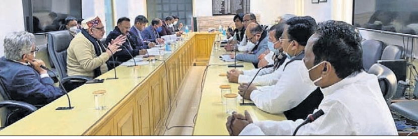
ନୂଆଦିଲ୍ଲୀଠାରେ ମନ୍ତ୍ରୀ ଗିରିରାଜ ସିଂହଙ୍କୁ ଭେଟିବାକୁ ବିଜେଡି ଏମ୍ପି ।

ଆବାସ ଯୋଜନା, ଏମ୍ପି ଏନ୍‌ଆର୍‌ଇଡି ଏସ୍ ନେଇ ଦାବି ଜଣାଇଲେ