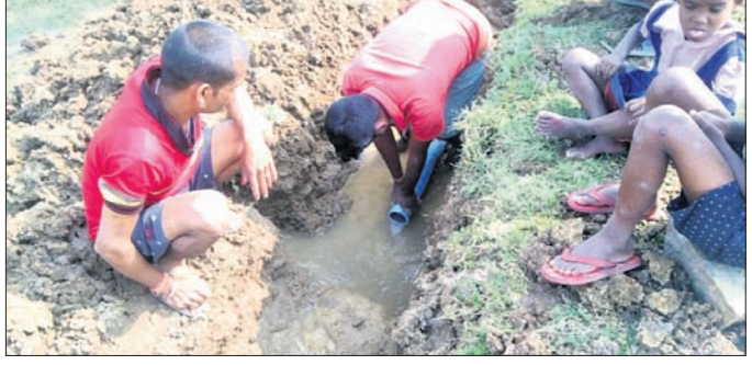
ଫାଟିଯାଇଥିବା ପାଣି ପାଇପକୁ ମରାମତି କରାଯାଇଛି।

ବ୍ୟବହାର କରିବାକୁ ବାଧ୍ୟ ହେଉଛନ୍ତି। ଏଭଳି ଦେଖିବାକୁ ମିଳିଛି କେନ୍ଦ୍ରାପଡ଼ା ଜିଲ୍ଲା ପଟ୍ଟାମୁଣ୍ଡାଲ ରୁକ୍ତ ବଡ଼ପତା ପଞ୍ଚାୟତ ନିର୍ମାଣ କରିଛନ୍ତି। ଅପରପକ୍ଷେ ଗାଁରେ ନଳକୂପସୂଚକକୁ ବସୁଆ ଯୋଜନାରେ ସାମିଲ କରିଛନ୍ତି। ଅନେକ ଜାଗାରେ ପାନୀୟ ଜଳ ପ୍ରକଳ୍ପ ଆଇ ମଧ୍ୟ ଲୋକେ ପାଣି ପାଇବାକୁ ବଞ୍ଚିତ ହେଉଛନ୍ତି। ଫଳରେ ଲୋକମାନେ ଖୋଲା କୁଅଁ ଓ ପୋଖରୀ, ପ୍ରଶଂସା କରାଯିବା ସହିତ ଗ୍ରାମବାସୀ