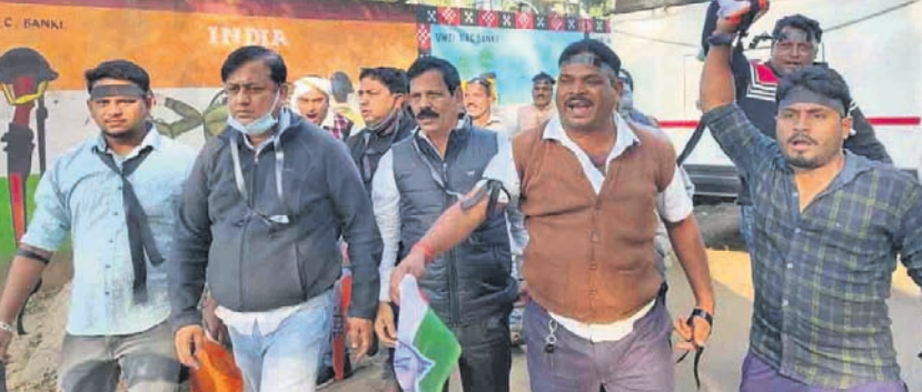
ବାଙ୍କିଠାରେ କଂଗ୍ରେସ କର୍ମୀମାନେ କଳାପତାକା ପ୍ରଦର୍ଶନ କରୁଛନ୍ତି ।