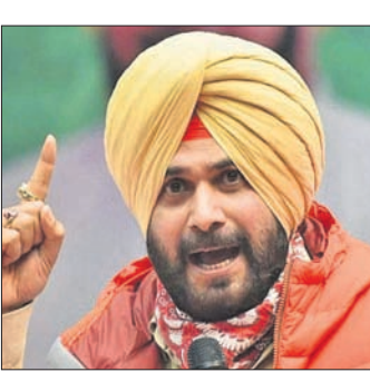
ଦେଲନାହାଡ଼ି ପୁଖ୍ୟମନ୍ତ୍ରୀ ଚରଣକିନ୍ଦ ସିଂ ଚନ୍ଦ୍ର ସ୍ୱର୍ଣ୍ଣମିତର ଗପ୍ତ କରି ଘଟଣାର ନିନ୍ଦା କରିଥିଲେ ଏବଂ ଜନସାଧାରଣଙ୍କୁ ଶାନ୍ତି ରଖା କରିବା ଲାଗି ଆହ୍ୱାନ ଦେଇଥିଲେ ।

ରବିବାର ମାଲେରକୋଲୋଠାରେ ଏକ ଜନସଭାକୁ ସମ୍ବୋଧିତ କରି ସିନ୍ଧୁ କହିଥିଲେ, ଅପବିତ୍ରକରଣ ଘଟଣାର ଲୋକଙ୍କ ଭାବାବେଗକୁ ଆଘାତ ଦେଇଛି । ତେଣୁ ଉକ୍ତ ମାନଙ୍କୁ ସହ ସମ୍ମୁଖ ସମସ୍ତଙ୍କୁ ସମସ୍ତଙ୍କ ଆଗରେ ପାଶ ଦିଆଯାଉ । ଏହି କାଣ୍ଡ ପଛରେ ଗୋଟିଏ ସମ୍ପ୍ରଦାୟର ହାତ ରହିଛି । ପଞ୍ଚାବରେ ଶାନ୍ତି ଭଙ୍ଗ କରିବାକୁ ଚାହୁଁଥିବା ଶକ୍ତି ଉଦ୍ଦମ କରୁଥିବା ସେ ଅଭିଯୋଗ କରିଛନ୍ତି । ଗୁରୁଦ୍ୱାର ଅପବିତ୍ରକରଣ ଘଟଣାକୁ ଅଧିକାରୀ ରାଜନେତା ନିନ୍ଦା କରିବା ସହ ଏହା ପଛରେ ଶତ୍ରୁତା ରହିଥିବା ଅଭିଯୋଗ କରିଛନ୍ତି । ତେବେ ଆଜ୍ଞାନୁଶୀଳନାକ ପାଶ ଦେବା ଲାଗି ସିନ୍ଧୁ ଦାବି କରିଛନ୍ତି ।