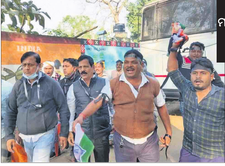
ମନ୍ଦୀ ପ୍ରଫୁଲ୍ଲ ମଲିକଙ୍କ ଗାଡ଼ିକୁ ଭାଜପାର ଅଣ୍ଟାମାଡ଼

ଭୁବନେଶ୍ୱର(ବ୍ୟୁରୋ)/ବାଙ୍କୀ(ସ.ପ୍ର.)/ନରସିଂହପୁର(ସ.ପ୍ର.) ୨୦୧୨