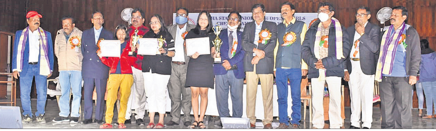
ଅନୁଗୋଳରେ ଅନୁଷ୍ଠିତ ରାଜ୍ୟସ୍ତରୀୟ ଟେସ୍ ଟାଣ୍ଡିନଗ୍‌ସ ଉଦ୍‌ଯାପନୀ ଅବସରରେ ଅତିଥିଙ୍କ ସହ କୃତୀ ଖେଳାଳିମାନେ ।