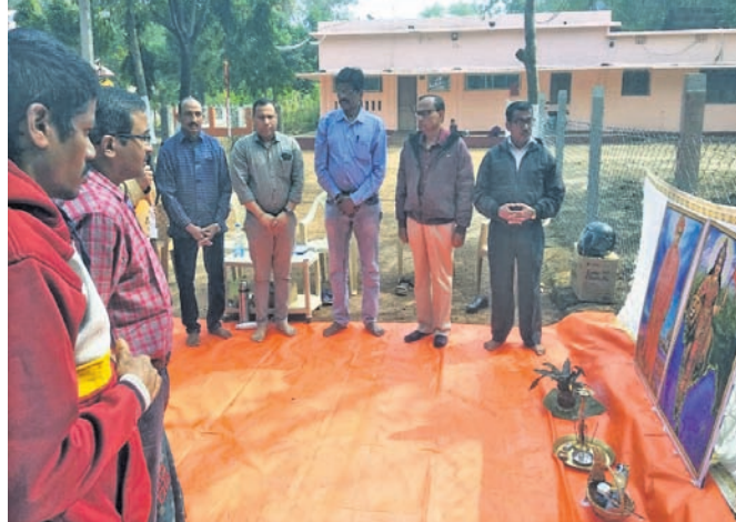
ବନ୍ଧୁମିଳନରେ ଯୋଗ ଦେଇଥିବା ଅବସରପ୍ରାପ୍ତ ସେନା କର୍ମଚାରୀ।