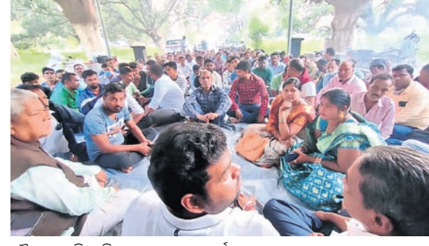
ବୈଠକରେ ବିଭେଦ ନେତୃତ୍ୱକ୍ଷମ ସହ କର୍ମୀମାନେ।

ଅନୁଗୋଳ ନିର୍ବାଚନପତ୍ରିକା ଅନ୍ତର୍ଗତ ବନ୍ଧୁ ଡାକ୍ତରୀ ଓ ବର୍ତ୍ତମାନ