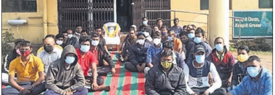
ଶ୍ରମିକ ସଙ୍ଘଠନ ପକ୍ଷରୁ ଧାରଣା ଦିଆଯାଇଛି।

ବନ୍ଧୁ, ୨୧୧୨(ଡି.ଏନ.ଏ.): ଏମ୍.ଏସ୍.ଏଲ୍. କର୍ମଚାରୀ