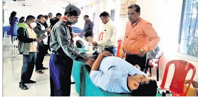
ଶିବିରରେ ରକ୍ତ ସଂଗ୍ରହ କରାଯାଇଛି।

ପଦକ୍ଷେପ ନେଉଛନ୍ତି। ଏଥିପ୍ରତି ଯତ୍ନବାନ ହୋଇ ଶିକ୍ଷାଦାନ କରିବାକୁ ସେ ଆହ୍ଵାନ ଦେଇଛନ୍ତି। ବୈଠକରେ ଉପକ୍ରମିକା ଶିକ୍ଷାଦାନ ପାଇଁ ପ୍ରସ୍ତାବ ଦେଖାଗଲା।