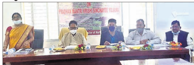
ବୈଠକରେ ମନ୍ତ୍ରୀଙ୍କ ସମେତ ଅଧ୍ୟକ୍ଷମାନେ।