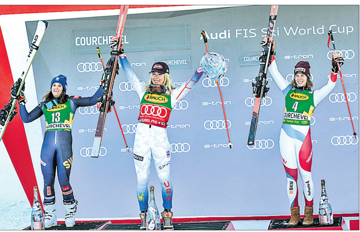
ଫ୍ରାନ୍ସର କୋର୍ଚ୍ଚେଭେଲରେ ଓପେନ୍‌ସ୍ ଖେଳିବା ପାଇଁ ଉପସ୍ଥିତ ଆଲ୍‌ପାଇନ ସ୍କି ବିଜୟିନୀ ଆମେରିକାନ୍ ମିକେଲା ଶିମ୍ପିନ୍ (ମଝି) ଏବଂ ୨ୟ ଓ ୩ୟ ହୋଇଥିବା ସୁଇଡେନର ସାରା ହେଡ୍‌ବର (ବାମ), ସୁଇଡେନର ମିକେଲା ଶିମ୍ପିନ୍ (ମଝି)।