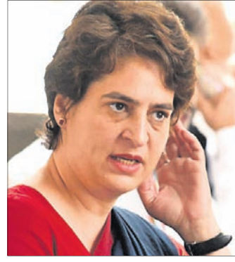
ପ୍ରିୟଙ୍କା ଗାନ୍ଧୀ ଭଦ୍ରା

ପ୍ରିୟଙ୍କା ଗାନ୍ଧୀ ଭଦ୍ରା କହିଛନ୍ତି ଯେ ତାଙ୍କ ପିଲାଙ୍କ ଆକାଉଣ୍ଟ ହ୍ୟାକ୍ କରିଛନ୍ତି ଭାଜପା। ତାଙ୍କ କହିବା ଅନୁଯାୟୀ, ତାଙ୍କ ପିଲାଙ୍କ ଆକାଉଣ୍ଟ ହ୍ୟାକ୍ କରିଛନ୍ତି ଭାଜପା।