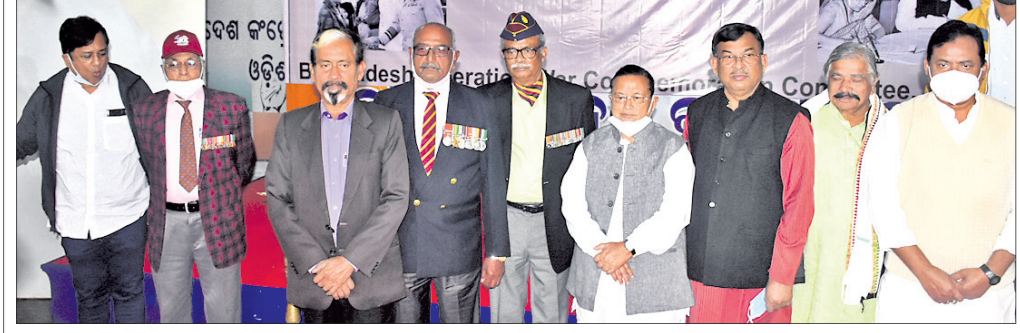
ଓଡ଼ିଶା ପ୍ରଦେଶ କଂଗ୍ରେସ କମିଟି ପକ୍ଷରୁ ମଙ୍ଗଳବାର ଭୁବନେଶ୍ୱରରେ କଂଗ୍ରେସ ଭବନରେ ୧୯୭୧-ବାଲାଇବେ ମୁକ୍ତି ସଂଗ୍ରାମର ୫୦ ବର୍ଷ ପୂର୍ତ୍ତି ଉତ୍ସବ ପାଳନ କରାଯାଇଛି।

ଆଇନ ମନ୍ତ୍ରୀଙ୍କ ଗାଡ଼ିକୁ ଅଣ୍ଟାମାଡ଼ ହେଉଛି। ଆଇନ ମନ୍ତ୍ରୀଙ୍କ ଗାଡ଼ିକୁ ଅଣ୍ଟାମାଡ଼ ହେଉଛି। ଆଇନ ମନ୍ତ୍ରୀଙ୍କ ଗାଡ଼ିକୁ ଅଣ୍ଟାମାଡ଼ ହେଉଛି।