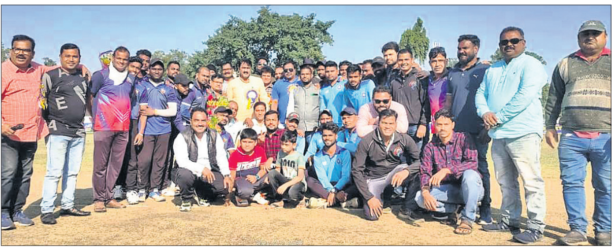
ଉଦ୍ଘାଟନା ଅବସରରେ ଅତିଥିକ ସହ ଦୁଇ ଦଳର ଖେଳାଳି।